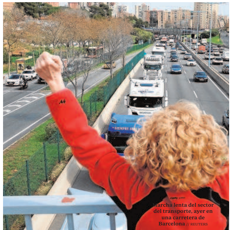
Marcha lenta del sector del transporte, ayer en una carretera de Barcelona

«La falta de concreción de las medidas por parte del Gobierno, no permiten por el momento reanudar la actividad del transporte de mercancías por carretera, hasta tanto no sean detalladas las medidas urgentes y efectivas que requieren los transportistas para poder salir de la ruina en que se encuentran