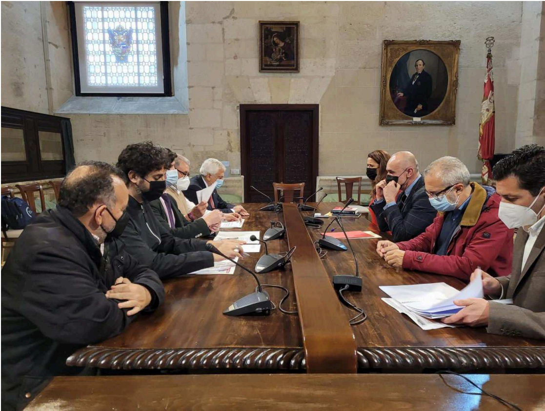
Un momento de la reunión. Ayto