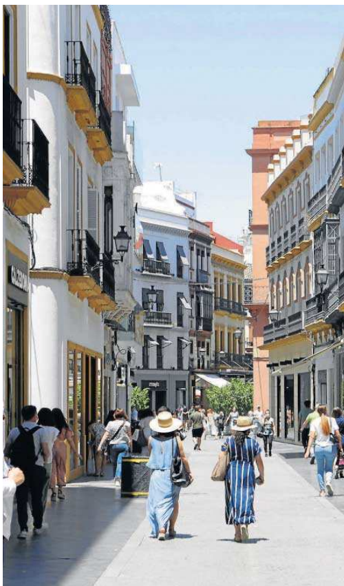
Las calles del centro sin toldos el pasado verano.

El portavoz del grupo municipal de Ciudadanos (Cs) en el Ayuntamiento de Sevilla, Álvaro Pimentel, mostró ayer su "desconfianza" en el "pacto" que ha alcanzado la Gerencia de Urbanismo con la empresa adjudicataria del contrato para instalar los toldos en el Casco Antiguo en 2021 para que sea la encargada de colocarlos en este año 2022. En este sentido, añadió que "este acuerdo representa la enésima prueba de la gestión chapucera que hizo el gobierno municipal el pasado año", cuando "dejó a los sevillanos sin estas velas de sombra durante casi todo el verano" y, al final, "instaló sólo unos cuantos toldos en el centro que llegaron tarde y mal".