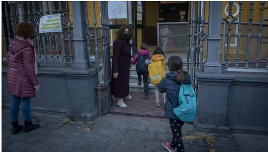
Los alumnos entran en un colegio público del centro de Sevilla.

La escolarización se ha convertido en un motivo de discordia entre la Administración autonómica y los sindicatos de enseñanza desde que llegó al Gobierno andaluz el bipartito de PP y Cs. El primer año el nuevo decreto que regula este procedimiento provocó la primera huelga sectorial contra el Ejecutivo de Juanma Moreno y desde 2021 el cierre de unidades ha motivado múltiples protestas contra los criterios establecidos a la hora de diseñar la oferta en la educación pública.