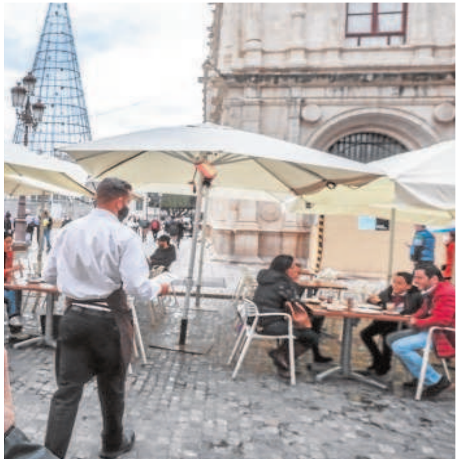
Un camarero sirve en unos veladores de la plaza de San Francisco

«Para la hostelería, no sólo hablamos de millones de euros en pérdidas sino también de miles de puestos de trabajo que se pueden perder si esta situación sigue como hasta ahora. Una hostelería sin productos alimentarios no es posible», añadió el presidente de los hosteleros sevillanos, que indicó que «todas las administraciones señalan que la huelga es minoritaria, pero el impacto comienza a ser global». «No entendemos la parsimonia con la que están llevando las negociaciones. Un