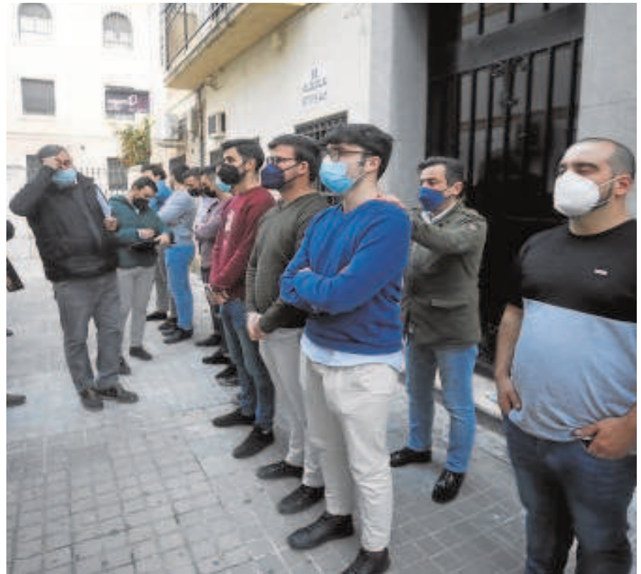
Uso de mascarillas en una igualá de costaleros en Córdoba

García insistió en la obligatoriedad de llevar mascarilla en interiores, una medida que podría recomendarse también en el exterior cuando no se pueda respetar una distancia de seguridad. Sobre la posibilidad de suprimir cuarentenas, se la viceconsejera seña-