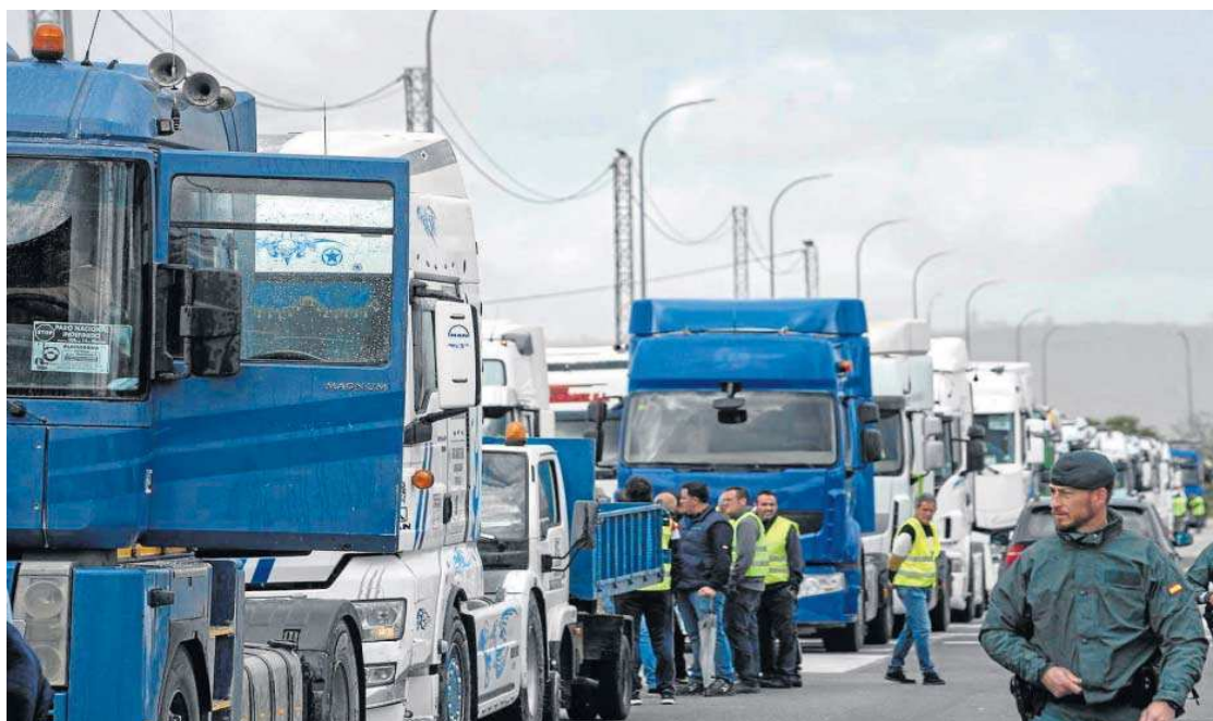
Agentes de la Guardia Civil en la protesta de camioneros en Huévar del Aljarafe.