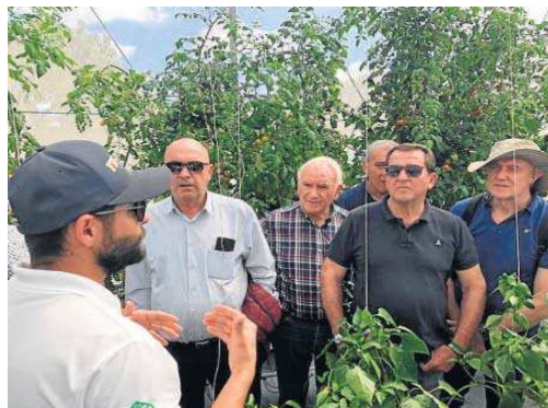
Visita a invernaderos con tecnología almeriense.

peso de la venta on line en Estados Unidos.