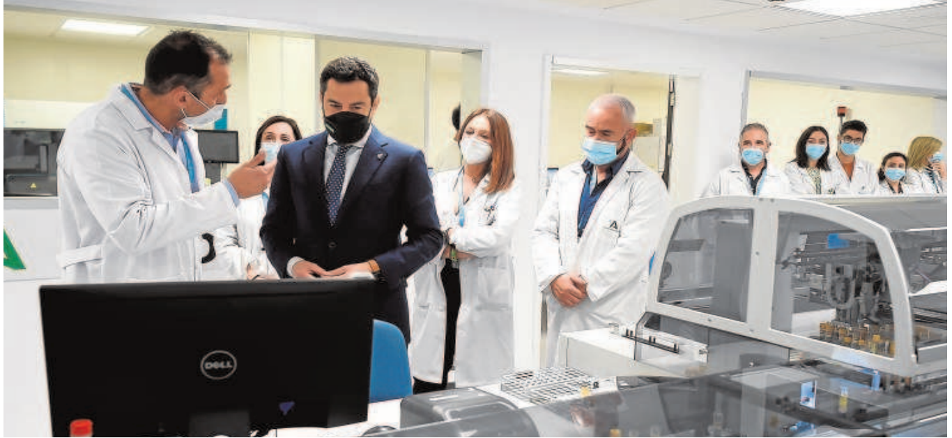
El presidente de la Junta de Andalucía, Juanma Moreno, ayer en su visita a las instalaciones del nuevo laboratorio del Hospital Regional de Málaga