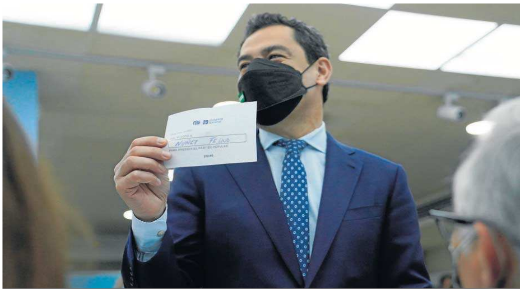
Juanma Moreno, ayer en Málaga, donde votó en las primarias del PP.