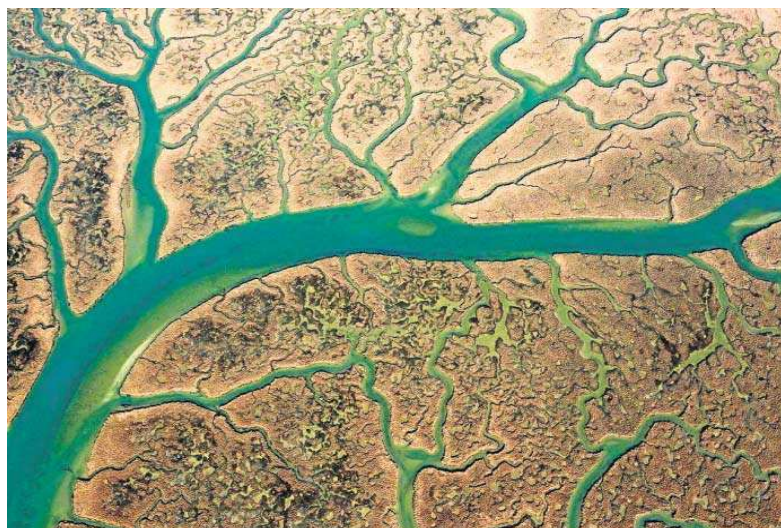
Vista aérea de la penetración del agua sobre la tierra.

Los días 26 y 27 de marzo se celebrarán las jornadas de puertas abiertas en el Jardín Botánico El