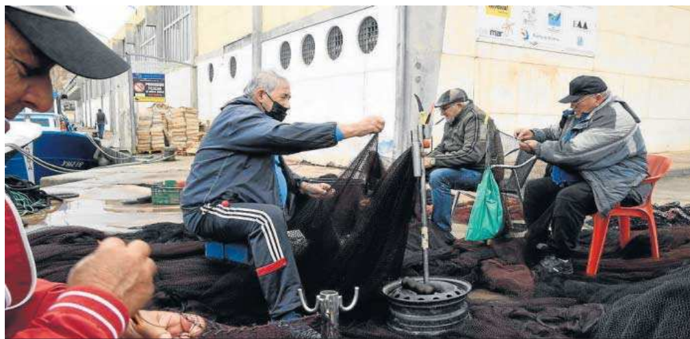
Pescadores arreglan sus aparejos en el puerto de Almería