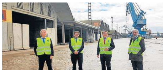
Un momento de la visita del presidente de Puertos del Estado a Sevilla. A.P.S.