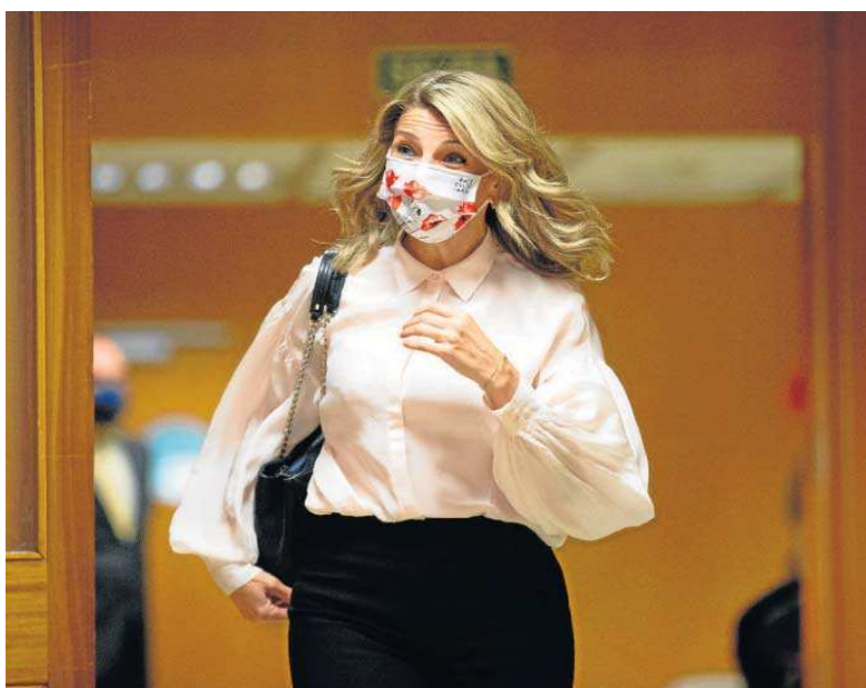
La vicepresidenta segunda, Yolanda Díaz, a su llegada ayer a una reunión de la Mesa de Diálogo Social.

Los socios del Ejecutivo en el Congreso, ERC, PNV, Bildu, Más País o Compromís, advirtieron a Sánchez de que fueron sus apoyos los que le permitieron ser presidente y desde todas las formaciones, incluida Vox, se ha criticado la falta de información al Parlamento.