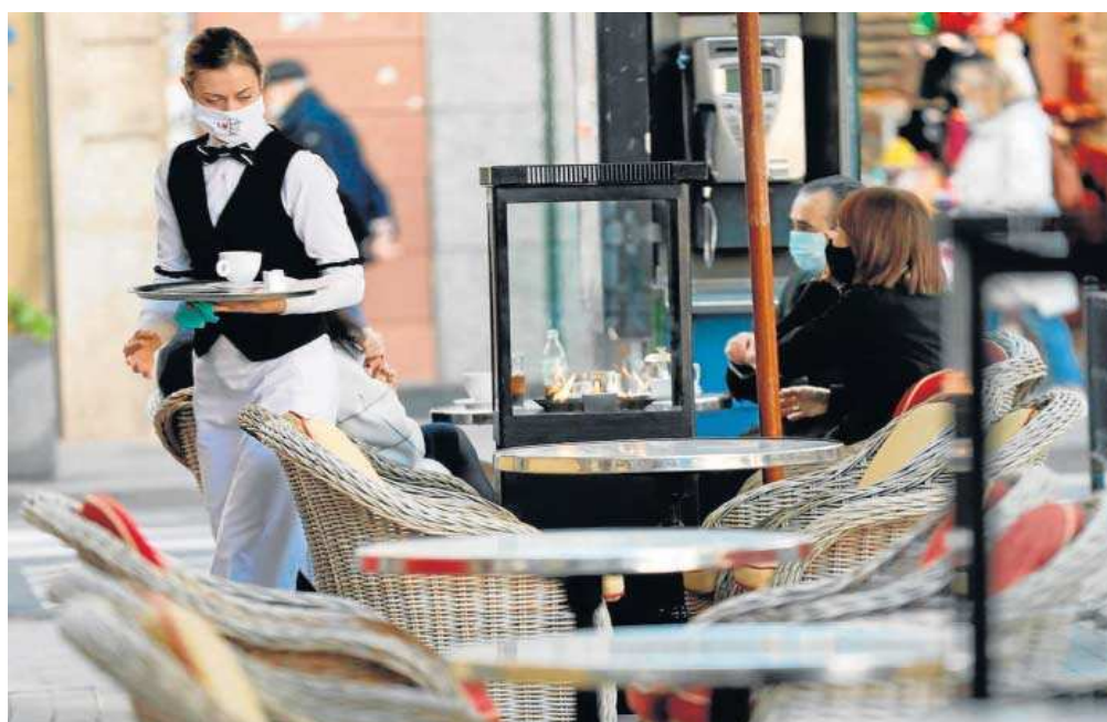
Una camarera atiende en la terraza de un bar.

Según Cephyme, el salario mínimo actual "no se ajusta al contexto económico actual", estimula el reemplazo de puestos de trabajo por máquinas o robots y desincentiva la creación de empleo. Entre 2016 y 2021 se han dejado de crear 161.000 empleos al no poder las empre-