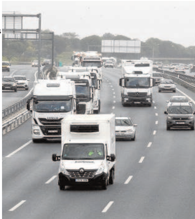
Caravana de transportistas ayer en Sevilla

«Nos encontramos, pues, no sólo con un gravísimo problema económico y de bienestar animal, sino con un riesgo inminente de salud pública al no poder alimentar animales en las granjas de para buena parte de los animales de granja», manifestó el colectivo, que incluye a fabricantes de harinas y sémolas; productores de ganado porcino, de vacuno de carne, de carne