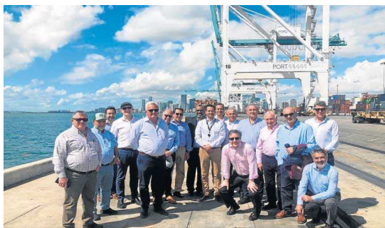
La delegación de Cooperativas Agro-alimentarias de Andalucía, durante la visita al Puerto de Miami.

más de una decena de cooperativas, como Cobella, Cocereales, Covap, El Grupo, Granada La Palma, Onubafruit, Productores del Campo, San Dionisio, San Sebastián, Unica Group o Vicasol.