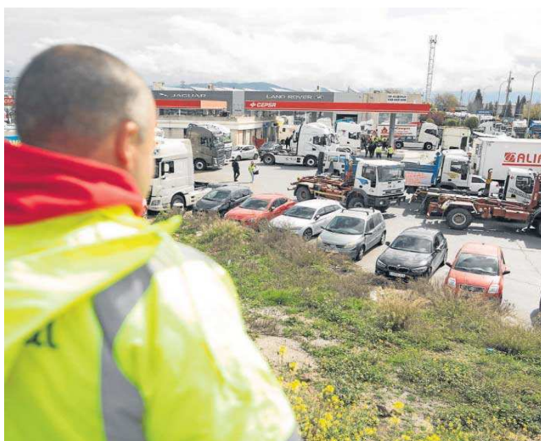
Concentración de transportistas en Mercagranada.

La reducción del precio del gasóleo se aplicará desde la entrada en vigor del real decreto-ley, que se aprobará el próximo 29 de marzo, en línea con lo anunciado en otros países europeos y concretamente siguiendo un modelo similar al de Francia, explicó la ministra de Transportes, Movilidad y Agenda