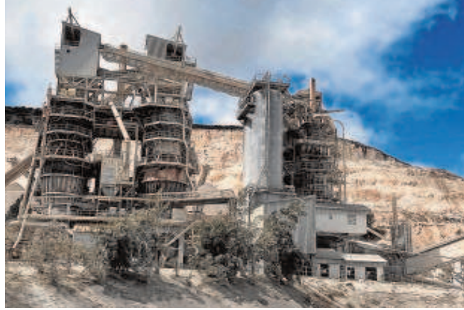
Instalaciones industriales de Calgovsa en Estepa