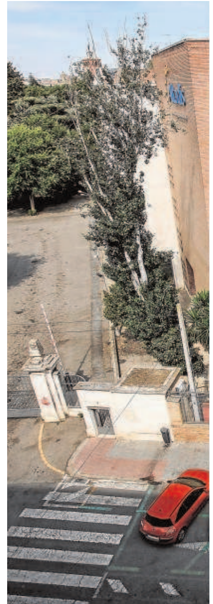
La verja que separa Altadis de la calle Juan Sebastián Elcano y que desaparecerá cuando termine la obra

La inversión ronda los 200 millones de euros a desarrollar en tres años y podría empezar a ejecutarse este mismo 2022 si el trámite avanza a buen ritmo como hasta ahora. Esa rapidez en el procedimiento, que ha precisado de un cambio