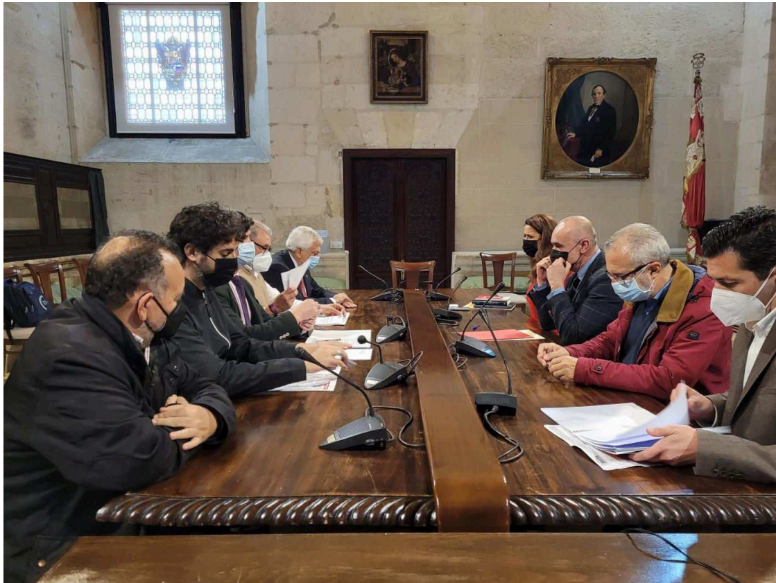
Un momento de la reunión. Ayto

Analizarán las medidas dentro de sus competencias en materia de transportes o normativas de conteatación para paliar precios y el bloqueo de transportes