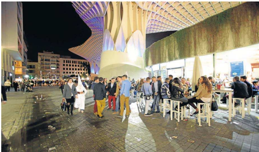
Veladores en los locales de hostelería de las 'setas' de la Encarnación.