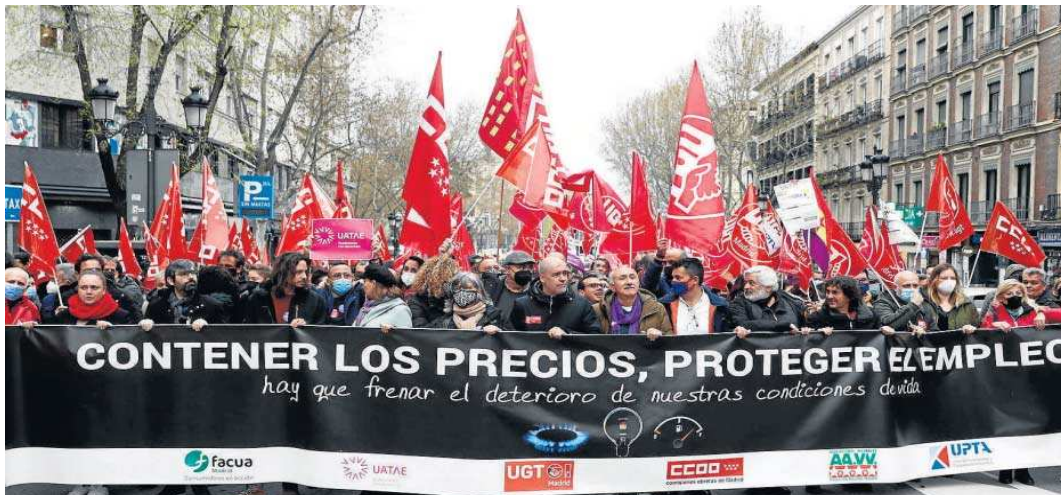
Cabecera de la manifestación contra la escalada de precios convocada ayer en Madrid, por sindicatos y asociaciones de vecinos, autónomos y consumidores.