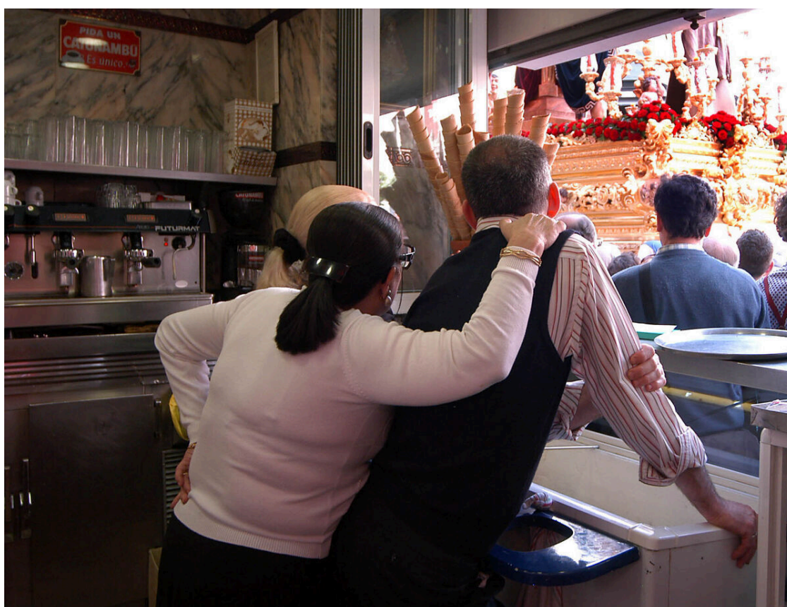
Unos hosteleros ven un paso desde el interior de su local.

Los establecimientos deben funcionar con sus puertas y ventanas cerradas (lo que excluye, asimismo, el funcionamiento de una actividad careciendo de cerramiento de fachada), sin perjuicio de su apertura y cierre para acceso y servicio de veladores autorizados, en su caso (dado que la correcta ventilación debe resolverse, incluso con los huecos cerrados, empleando los medios mecánicos que procedan).