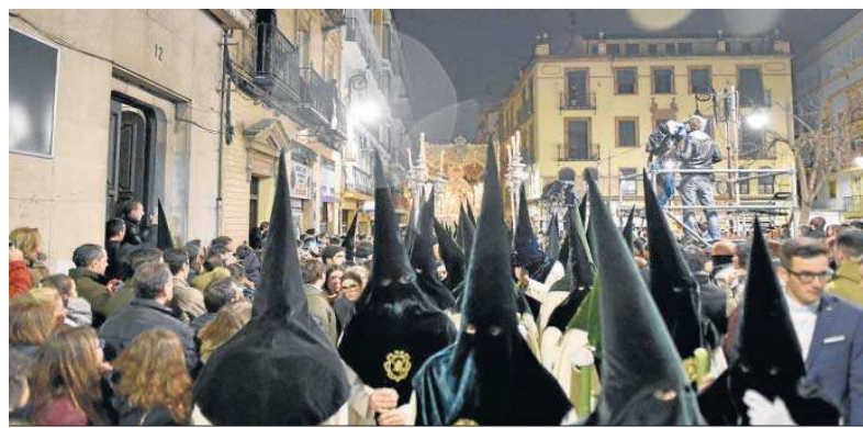
La Virgen de la Esperanza por la Pescadería, una de las zonas de más concentración de jóvenes.

● Las normas para el funcionamiento de la hostelería en Semana Santa mantienen por tercer año la 'ley seca' durante la Madrugada