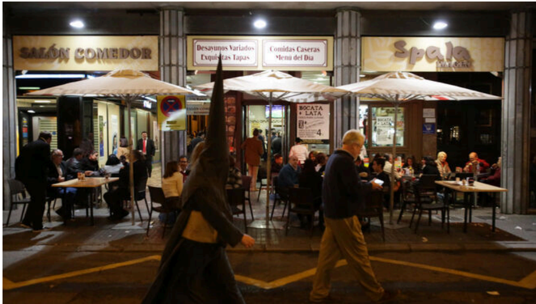
Un nazareno pasa ante una zona con veladores.

El Boletín Oficial de la Provincia de Sevilla ha publicado este miércoles las normas de funcionamiento que deberán aplicar los establecimientos de hostelería y de venta de alimentos durante la próxima Semana Santa. Prácticamente se mantienen las mismas disposiciones que en 2019, pero se incorpora como novedad que las terrazas con veladores situadas en plazas de aparcamientos deberán ser desmontadas en algunos casos. Para la Madrugada del Viernes Santo se mantiene el cierre de los establecimientos de ocio a la 1:00, aunque el Ayuntamiento, de manera excepcional, permitirá que se mantengan abiertos en algunas zonas, como Argote de Molina o la Plaza Nueva, si se cumplen una serie de condicionante.