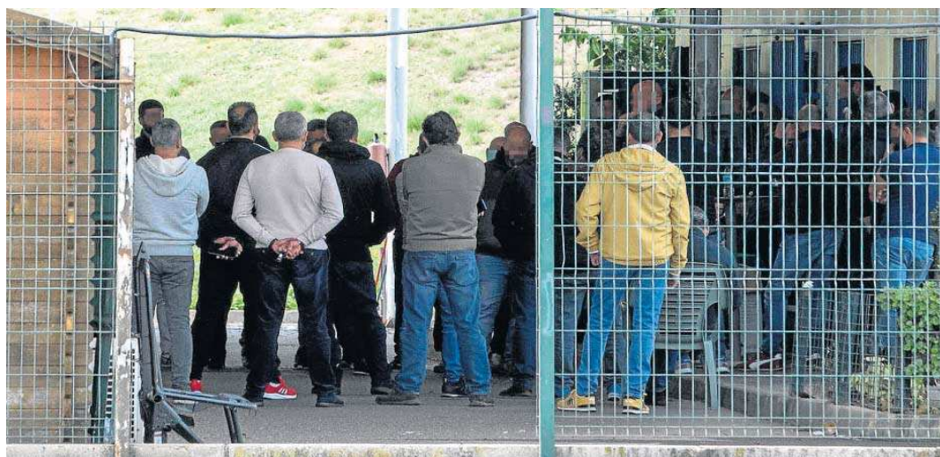
La asamblea de taxistas del Aeropuerto, celebrada el pasado martes.