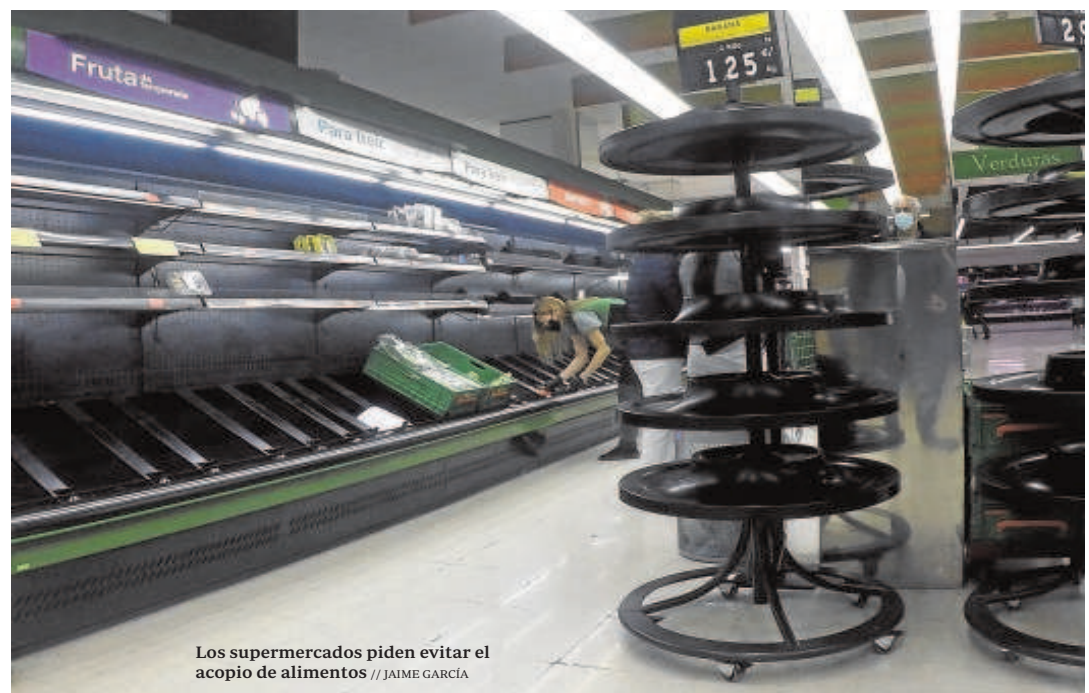
Los supermercados piden evitar el acopio de alimentos

El paquete de medidas también espera ser conocido por el transporte de viajeros (bus, taxi, VTC y ambulancias), al que ayer Transportes aseguró que se beneficiaría de la misma forma que mer-