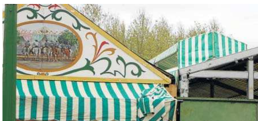
La doble cubierta de las casetas para el nuevo sistema de ventilación anti Covid.