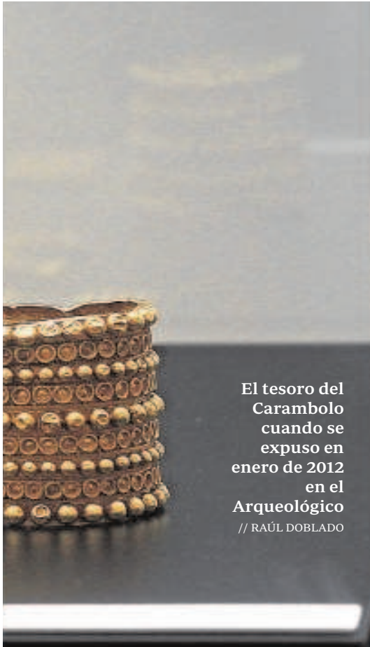
El tesoro del Carambolo cuando se expuso en enero de 2012 en el Arqueológico