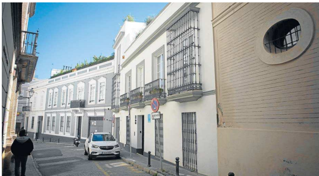
Un hombre mira la fachada del inmueble, que se encuentra en el número 4 de la calle Madre de Dios.