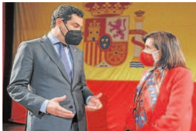
Juanma Moreno y Margarita Robles durante un acto en Sevilla

«Transcurridos ya algunos meses sin una solución que asegure el futuro de la planta, como presidente de la Junta de Andalucía, le requiero que intermedie con la empresa adjudicataria de tan importante contrato de su Ministerio para la provincia de Sevilla, el principal contrato con el Ejército de Tierra, con objeto de que no se produzca el traslado de esa producción y la consecuente pérdida de empleo y oportunidades», apremia el jefe del Ejecutivo regional en su carta.