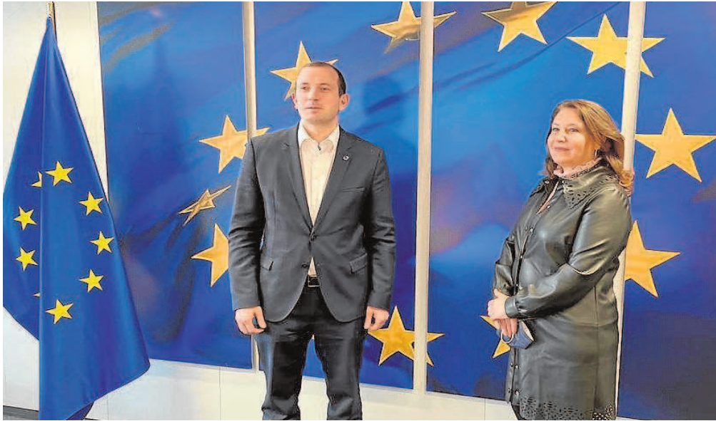
El comisario europeo de Medio Ambiente, Virginijus Sinkevicius, con la consejera de Agricultura en Bruselas