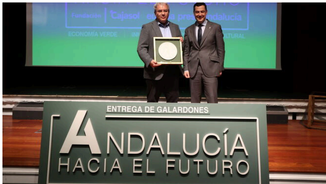
La fábrica de Renault en Sevilla, premio Andalucía hacia el futuro

La Refactory de Renault en Sevilla ha recibido el premio Andalucía hacia el futuro otorgado por Europa Press Andalucía y la Fundación Cajasol por convertirse en el primer proyecto de economía circular dedicado integralmente a la movilidad en España.