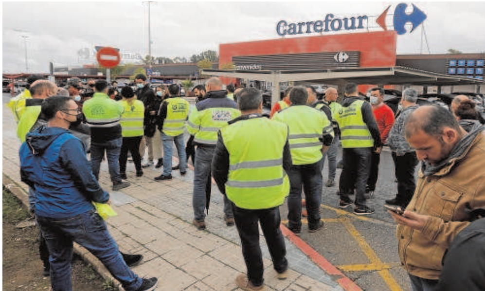
Transportistas concentrados en el centro comercial Carrefour de Sevilla