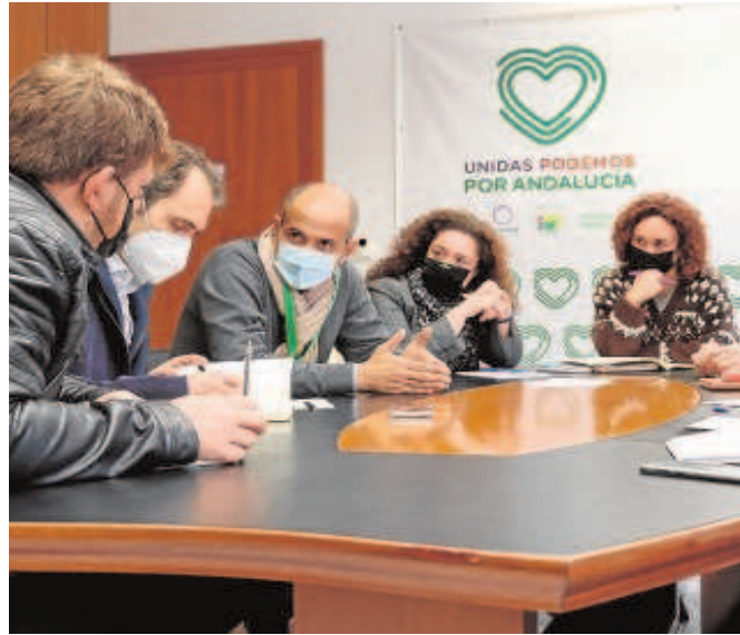
El delegado del Frente Polisario, en el centro, durante la reunión con UP

Toni Valero argumentó «su rechazo a la posición de Pedro Sánchez, que no