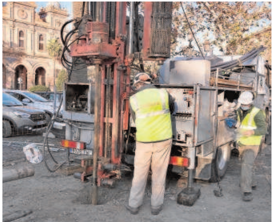
Catas geotécnicas para la línea 3 del metro de Sevilla // J. M. SERRANO

«Sevilla está a la cola de Europa en cuanto a movilidad», añadió y «con esta PNL instamos al Gobierno a que en la futura Ley de Movilidad Sostenible se haga referencia directa y explícita a las líneas pendientes de construcción recogidas en el mencionado Plan de la red para Ferrocarril Metropolitano de Sevilla y que esta referencia implique un compromiso expreso