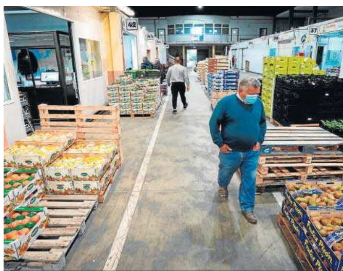
Imagen de Mercajerez hace una semana.

Empleo asegura que hay “muchas consultas” a la autoridad laboral (el delegado o delegada de la Consejería en cada provincia) porque las empresas no tienen claro el tipo de ERTE que tienen que presentar. La ley en vigor recoge dos tipos (a la espera que se aplique el modelo previsto en la reforma laboral): los llamados