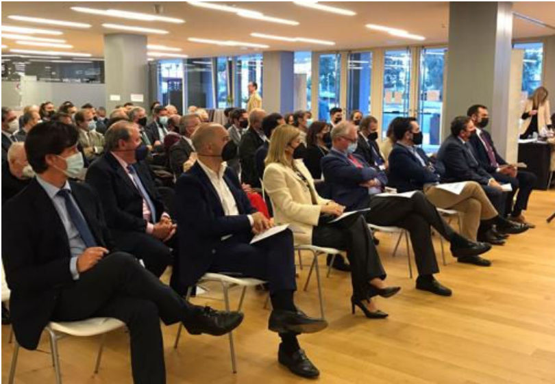
Asistentes a la asamblea electoral con Miguel Rus, presidente de la CES, en primer término -