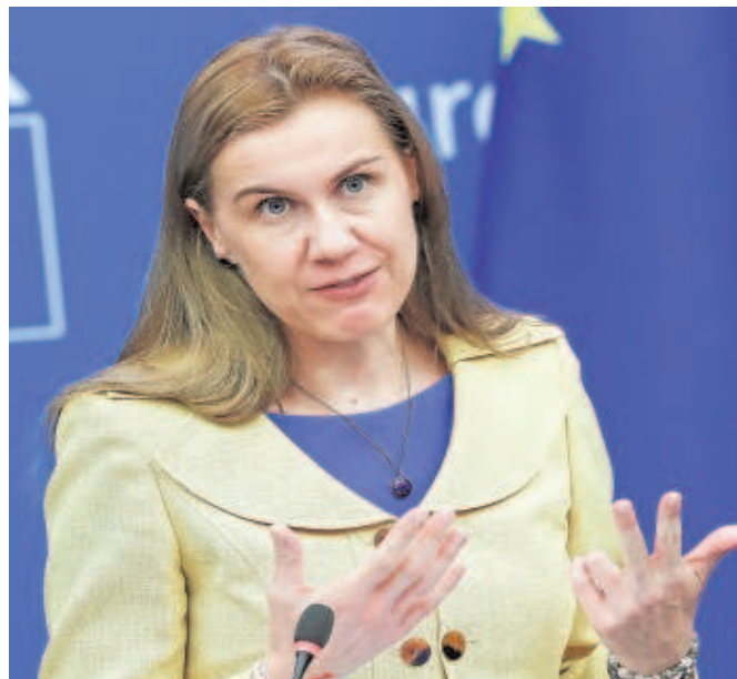
La comisaria de Energía, Kadri Simson

Respecto al mercado mayorista, la Comisión recuerda que «los Estados miembros pueden considerar la creación de un modelo de agregador según el cual una entidad compraría electricidad en condiciones comerciales favorables para ponerla a disposición