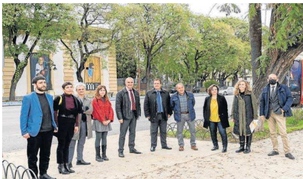
Presentación de Calle Cultura.