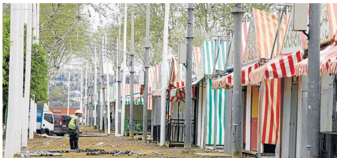
El montaje de las casetas para la Feria de 2022 está muy avanzado.