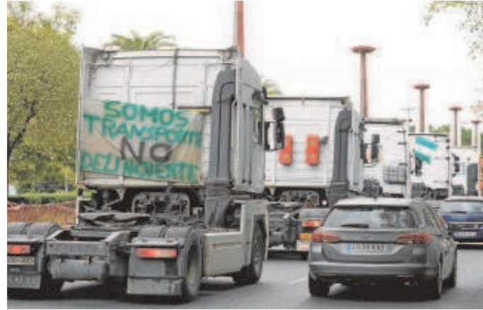
Camiones de los transportistas que secundaron en Sevilla el paro