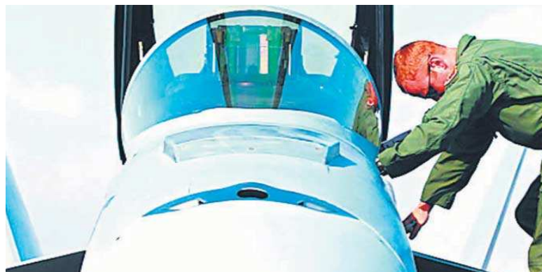
El sector aeroespacial andaluz lidera el proyecto Impulso.

Impulso propone un desarrollo novedoso en la cadena de valor de componentes metálicos fabricados por impresión 3D, con la finalidad de establecer una metodología eficiente y sencilla que permita la implantación de la tecnología aditiva en la cadena de producción de fabricación de dos sectores relevantes a nivel nacional, como son el aeroespacial y el médico. Para ello, el proyecto se ha dividido en dos fases, una primera centrada en la fabricación aditiva dentro del sector aeroespacial, ya que se consideró que se podía llegar a resultados y conclusiones a corto plazo, y una se-