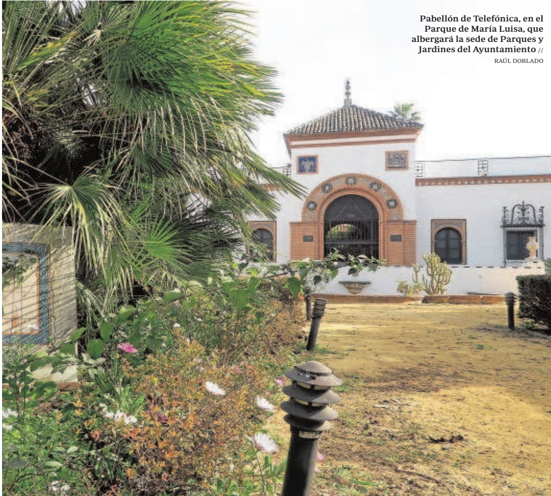
Pabellón de Telefónica, en el Parque de María Luisa, que albergará la sede de Parques y Jardines del Ayuntamiento //