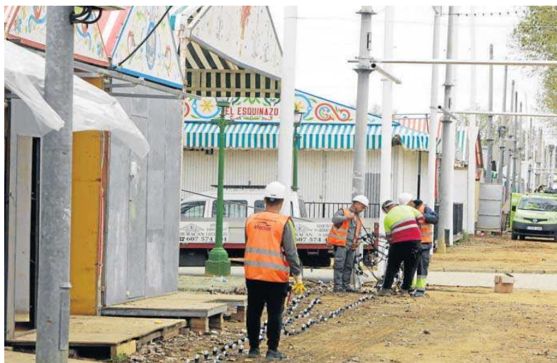
Operarios colocando las bombillas en el Real de la Feria.

No obstante, el delegado de Fiestas Mayores se mostró "esperanzado" en que se resuelva el problema "porque hay una oportu-