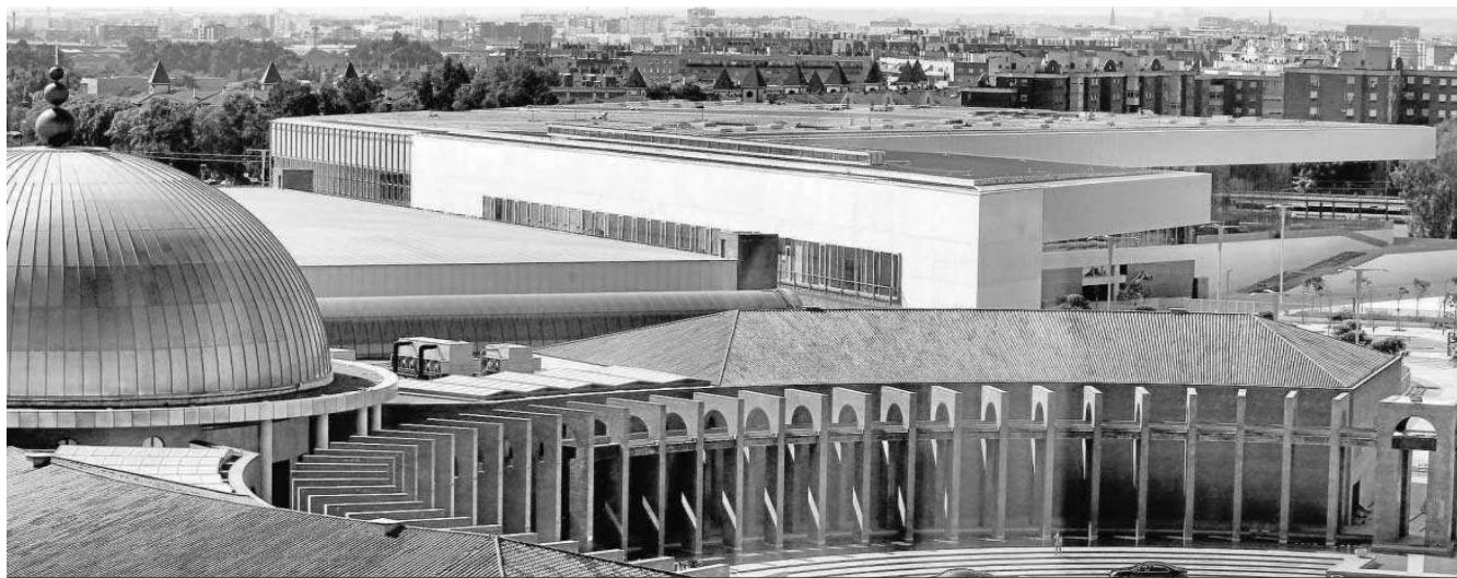
Una perspectiva del viejo edificio del Palacio de Congresos y de su ampliación.