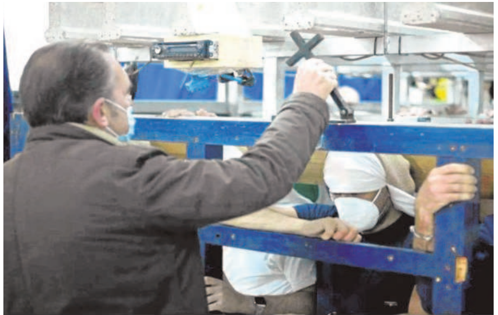
Un capataz de Sevilla en uno de los ensayos de costaleros con mascarillas

En cuanto a las agrupaciones o bandas de música, se recomienda mantener las reuniones previas o posteriores al aire libre o en espacios no cerrados, de ser imprescindible, en locales amplios con buena ventilación; usar mascarilla, al menos higiénica, durante el desfile procesional cuando el instrumento permita su uso; mantener la mayor distancia posible entre los músicos de instrumentos de viento con el público asistente; mantener la distancia en la formación entre los músicos durante el desfile procesional y no compartir bebidas durante las paradas.