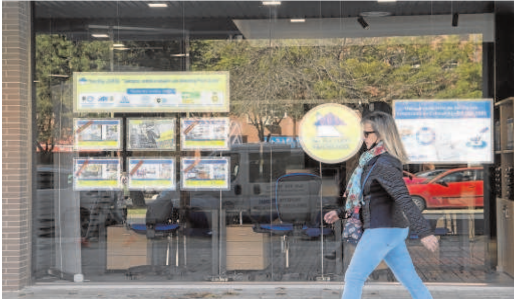
Los propietarios temen que la medida pueda perpetuarse