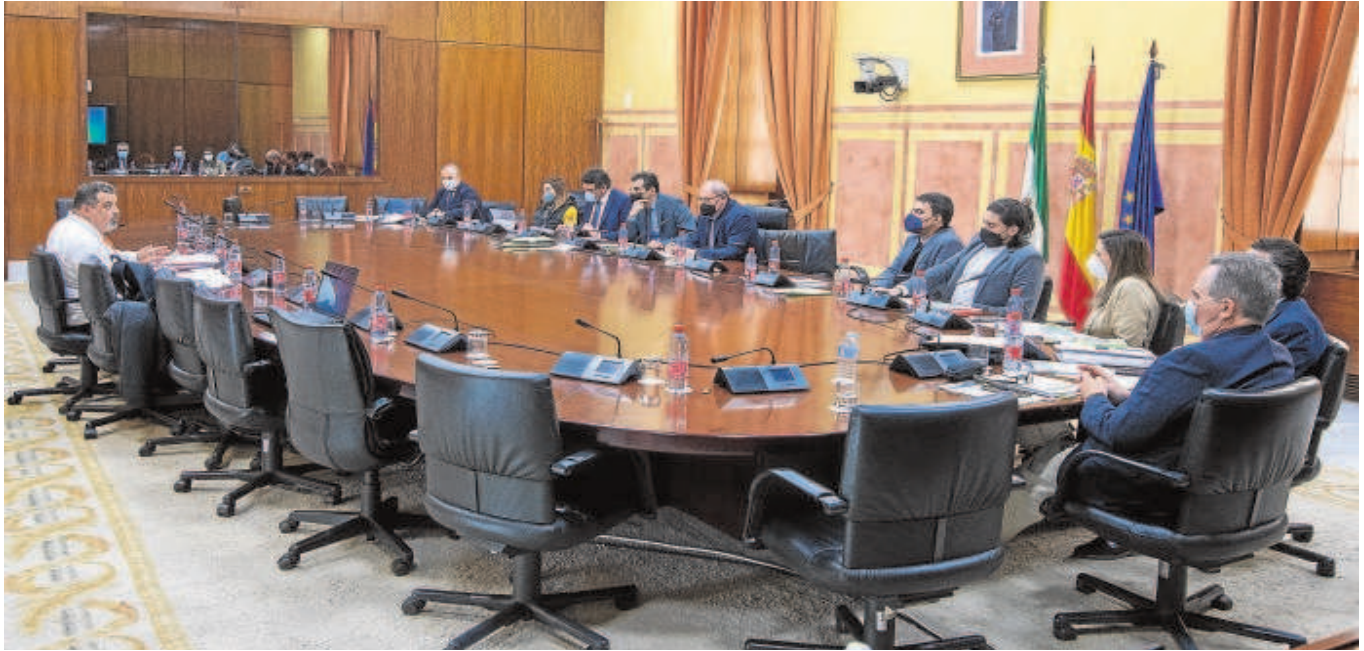
Imagen de la comisión de Fomento donde ayer, durante nueve horas, se escucharon los criterios de todas las partes para regularizar cultivos