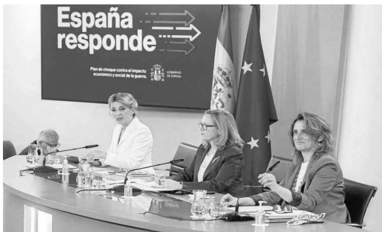
Yolanda Díaz, Nadia Calviño y Teresa Ribera, durante una rueda de prensa posterior al Consejo de Ministros.

Según ha explicado la vicepresidenta tercera y ministra para la Transición Ecológica, Teresa Ribera, se trata de evitar rentabilidades