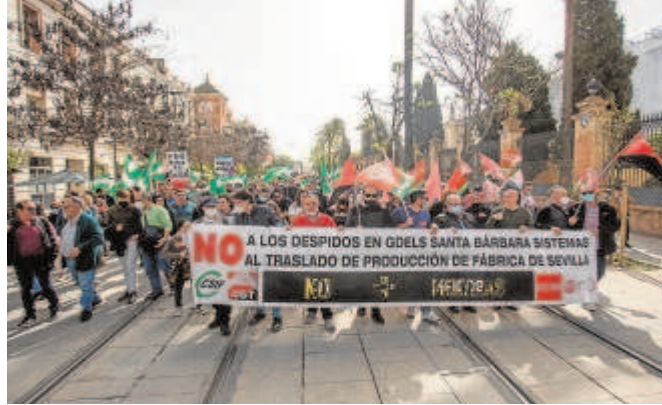
Manifestación de los trabajadores en Sevilla contra los despidos

compañía se compromete también a que durante este año 2022, se trabaje en Alcalá en el mantenimiento y modernización de vehículos como el Leopardo en todas sus versiones y Pizarro en fase 1, además del mantenimiento