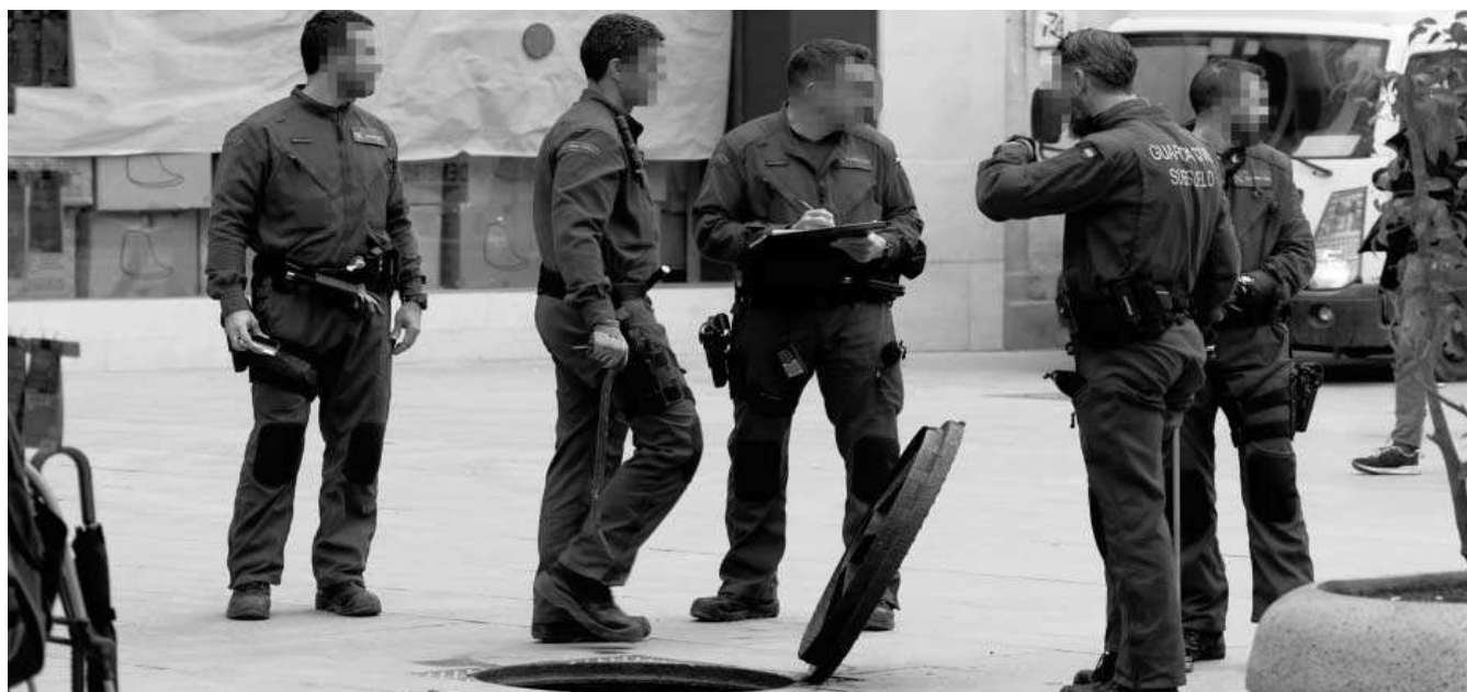
La Guardia Civil inspecciona una de las alcantarillas de la Avenida de la Constitución.