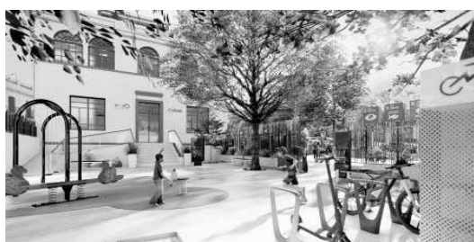
Recreación del centro de la Fundación MAS en el Liceo Francés. R. G.

Este innovador centro será gestionado por Fundación MAS e impulsará tanto iniciativas propias de la fundación como del Ayuntamiento de Sevilla, a través del Dis-