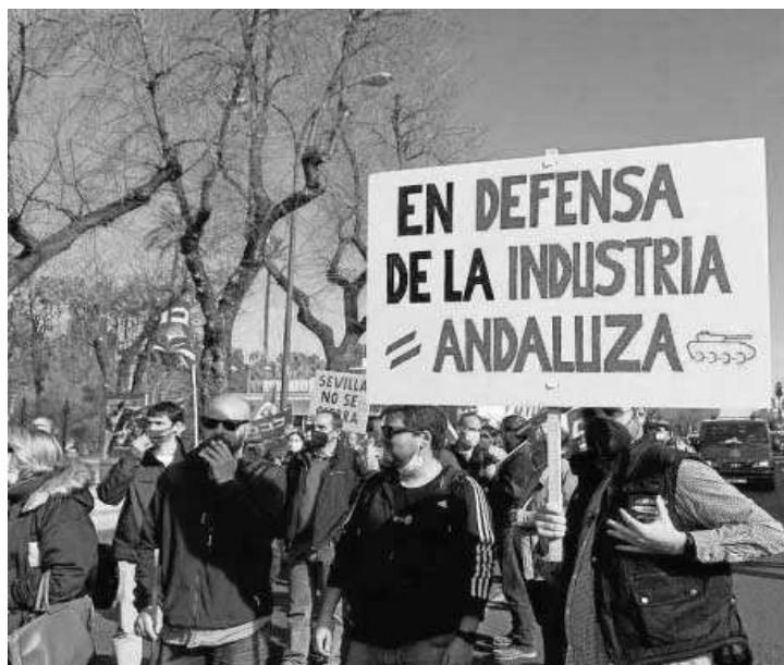
Manifestación de trabajadores de Santa Bárbara el pasado 22 de febrero. M.G.

Según la versión sindical, “la dirección de la empresa ha presentado un plan industrial, una hoja