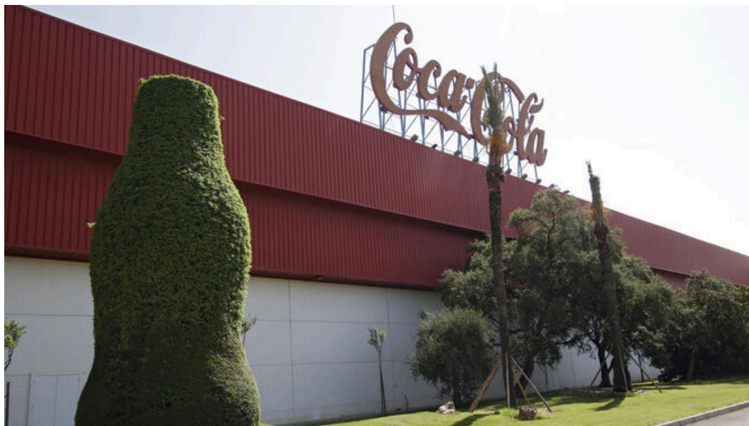
Más de un 40% menos de emisiones en la planta sevillana de La Rinconada

En materia de clima, Coca-Cola está avanzando hacia el objetivo cero emisiones , el cual está basado en reducir el valor absoluto de emisiones de Gases de Efecto Invernadero (GEI) en un 30% para 2030, respecto a 2019, y lograr cero emisiones netas de carbono para 2040 en toda su cadena de valor. Se trata de un plan validado científicamente por Science Based Targets Initiative.