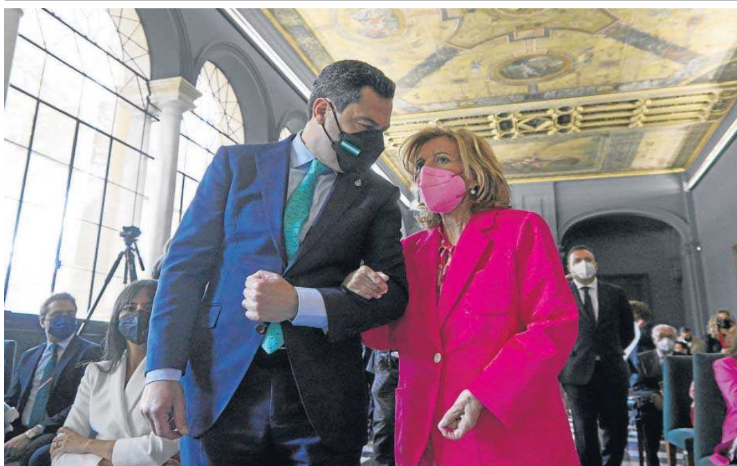
Juanma Moreno, junto a María Teresa Campos, ayer en la entrega de los premios de periodismo de la Junta.