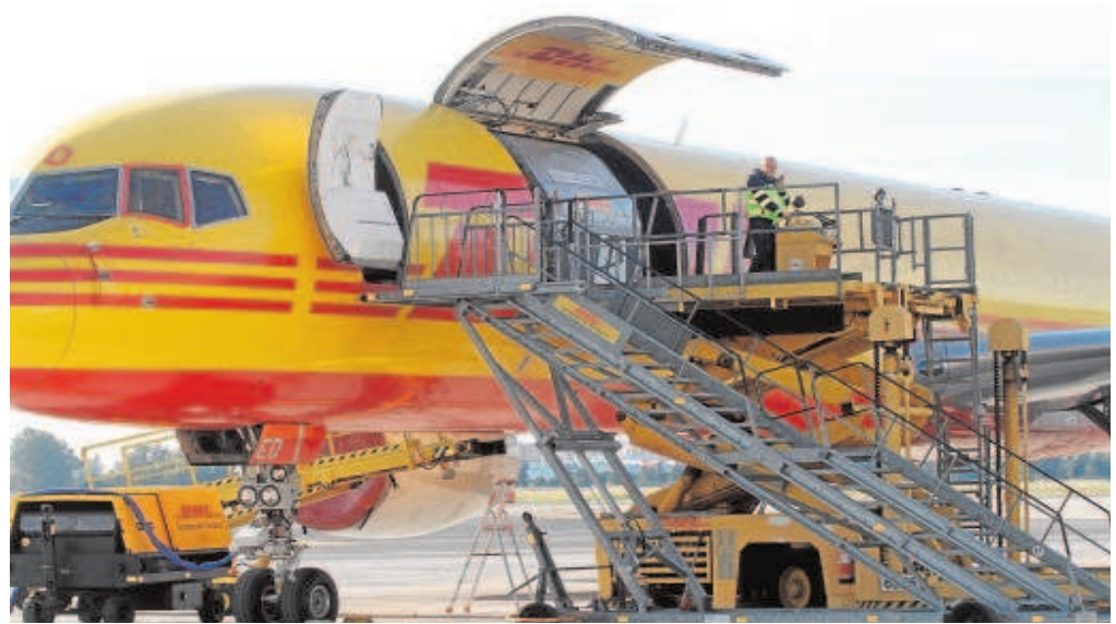
Carga de un avión de la compañía DHL en el aeropuerto de Sevilla

Toneladas se han registrado sólo en el mes de febrero, un 17% más que en 2019, el año de referencia al no haber pandemia.