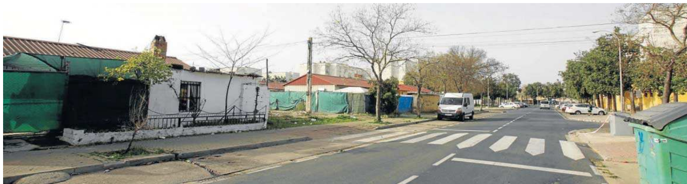
Los operarios municipales tiraron ayer a machotazos las paredes y derribaron los muros de las chabolas ilegales en el Polígono Sur.