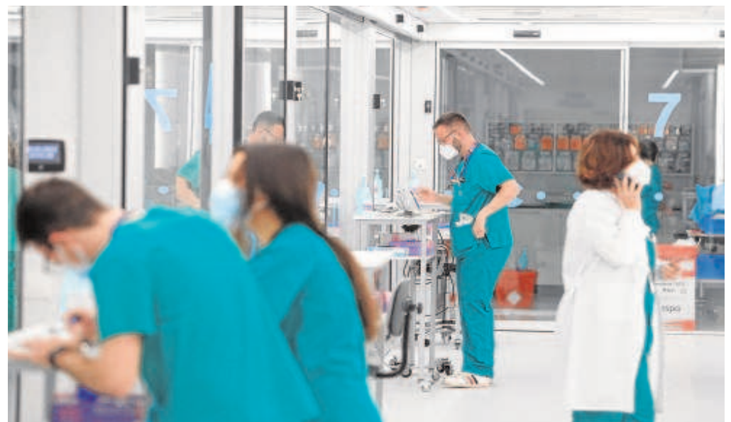
UCI de pediatriá del Hospital Reina Sofía de Córdoba // ÁLVARO CARMONA

Con este plan además de fidelizar a los residentes se procura cubrir las demandas asistenciales en las zonas rurales a cambio de un trabajo estable con muchas probabilidades de convertirse en fijo en un periodo de tiempo corto, en aplicación de los procesos de estabilización laboral del SAS.