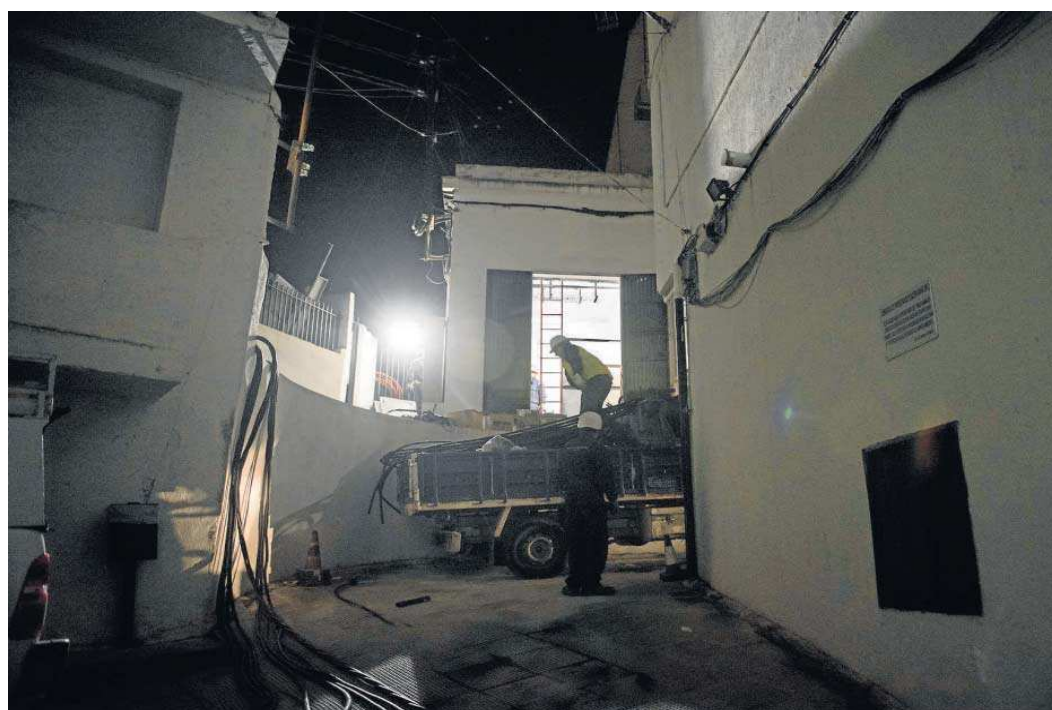
Un operario intenta averiguar el origen del problema de un apagón.

Endesa efectuó 4.282 cortes de suministro por fraude en 64 intervenciones conjuntas con las fuerzas del orden en distintos barrios de Almería como El Puche, La Chanca, El Quemadero o el Cerro de San Cristóbal. El año anterior fueron 1.306 cortes en 25 intervenciones. Una auditoría de 2019 concluyó que Endesa tiene más potencia a disposición de los abonados que la potencia demandada. Los cortes de suministro no se deben por