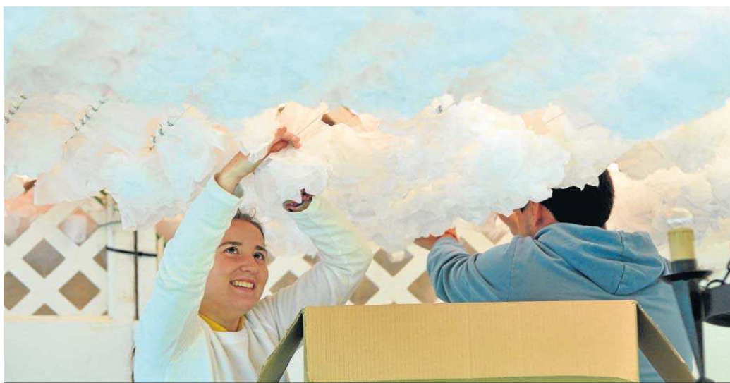
Dos trabajadores colocan flores de papel en una caseta.