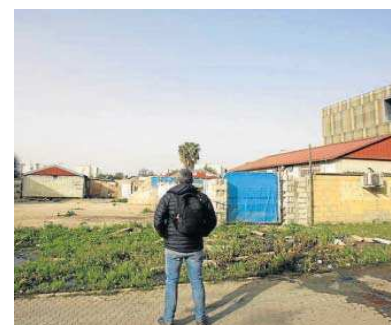
En el barrio hay grandes espacios diáfanos.