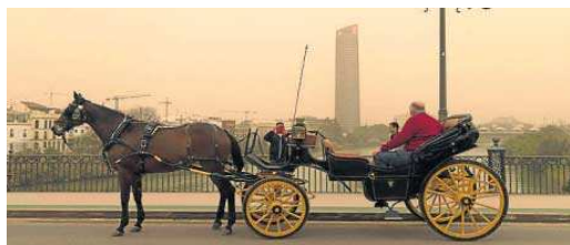
Las imágenes de Sevilla cubierta de calima y polvo en suspensión. D. S.