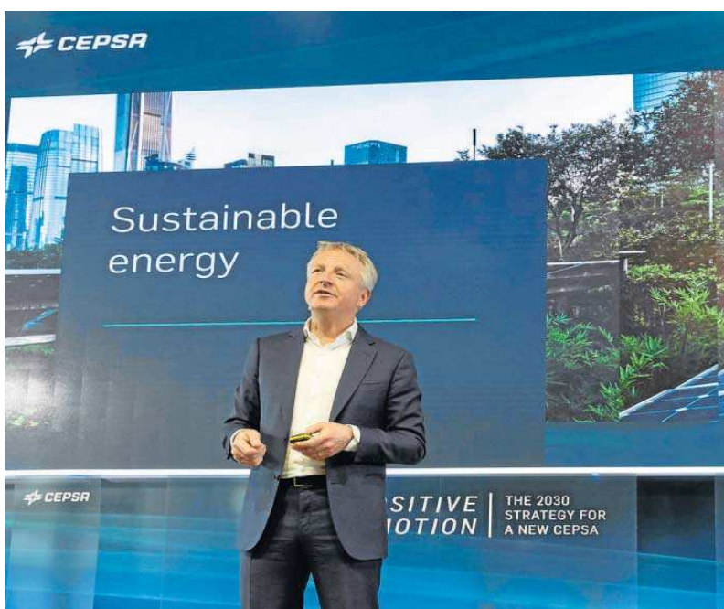
El consejero delegado de Cepsa, Maarten Westelaar, durante la presentación del nuevo plan estratégico.

que en ningún sitio de Europa", aseguró el consejero delegado, que también apunta al otro lado del Estrecho como un punto clave.