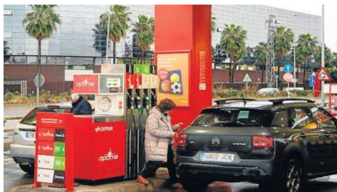
Una mujer reposta combustible en una gasolinera del Puerto de Sevilla. JOSÉ ANGEL GARCÍA