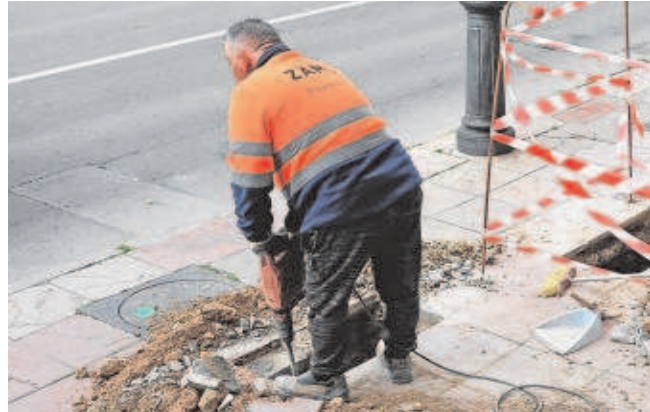
No se puede despedir poniendo como causa los aumentos de precios