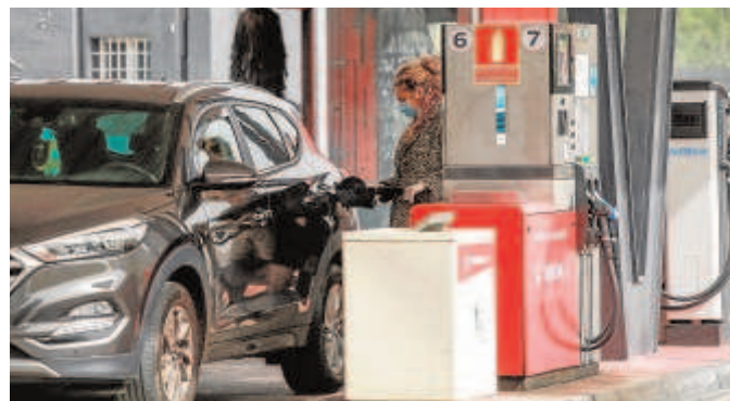
Las estaciones de servicio deberán aplicar a partir de este viernes descuentos de 20 céntimos en cada litro de carburante