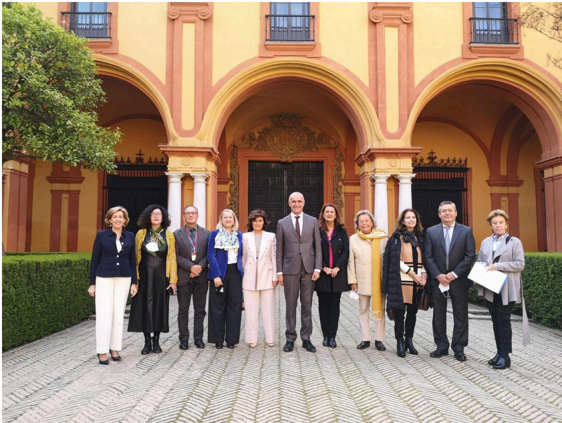
El Consejo Consultivo del Real Alcázar.