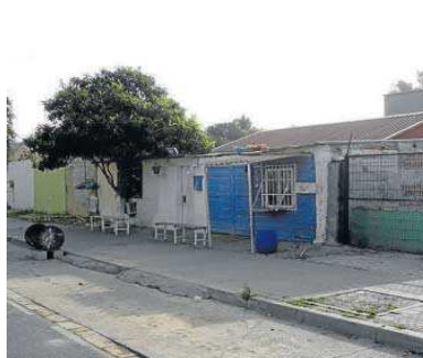
En los próximos días continuarán las demoliciones.

En los próximos días continuarán las demoliciones, un paso más para tratar de dotar de normalidad al barrio más pobre de España. Mientras, se sigue escuchando el zumbido de los extractores de aire, que procede de algún piso lleno de plantas de marihuana.