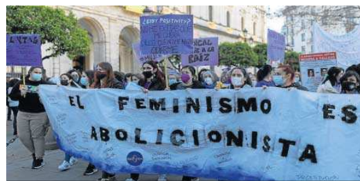
Los manifestantes a su paso por el Ayuntamiento. ANTONIO PIZARRO