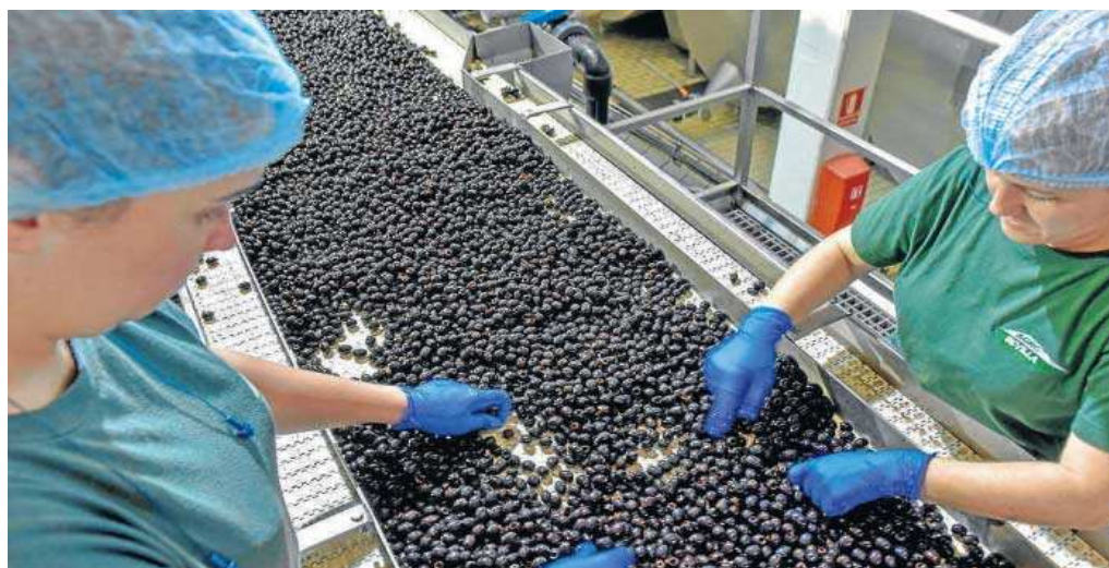
Línea de procesado de la aceituna de mesa de Agro Sevilla.