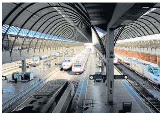
Varios trenes en el interior de la estación de Santa Justa.

En el texto se recuerda que el paso transfronterizo sur entre España y Portugal, a través de Andalucía, es el único que carece de conexión ferroviaria, a pesar de que Portugal ha mantenido el trá-