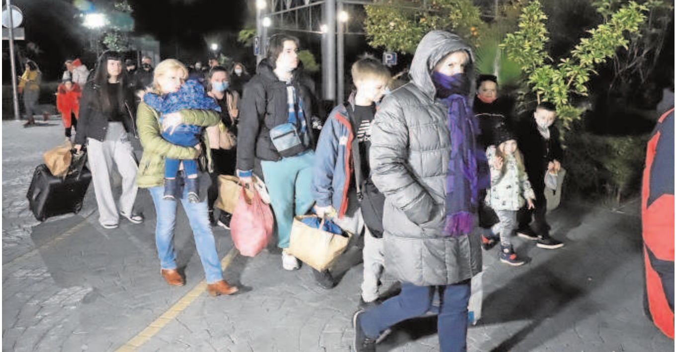
Refugiados de la guerra de Ucrania a su llegada a Málaga en el autobús fletado por un empresario privado