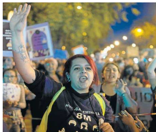
Una joven participa en una de las concentraciones. ANTONIO PIZARRO

● Dos grandes marchas recorren las calles de Sevilla en defensa de los derechos de la mujer en el 8-M