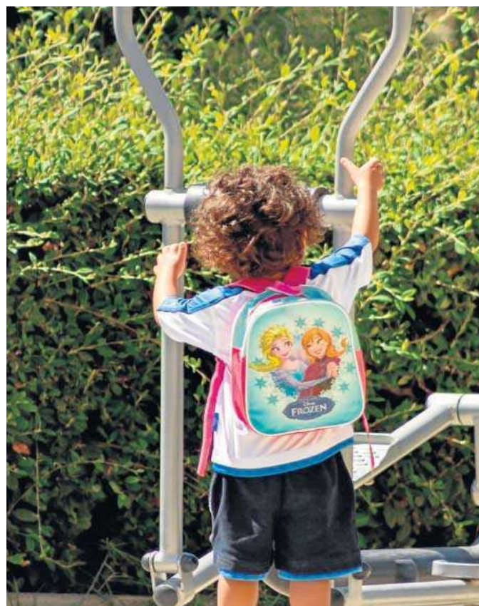
Un menor juega en un parque de actividades a la salida del colegio.

proceso de segundas dosis de la vacuna contra el Covid en los menores de entre 5 y 11 años, los últimos en sumarse a la campaña de inmunización, y que desde el pasado 9 de febrero están completando la pauta vacunal, en su caso, a las ocho semanas del primer pinchazo, que lo empezaron a recibir el 15 de diciembre. De hecho, es en ese grupo de edad donde se registra la tasa de contagio más baja de la provincia a 14 días, con 67,5 casos por 100.000 habitantes. La más alta, por su parte, se da en el colectivo de 30 a 39 años, con una tasa cercana a 300.