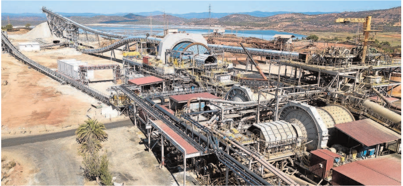
Instalaciones de Atalaya Mining en la mina de Ríotinto, en Huelva