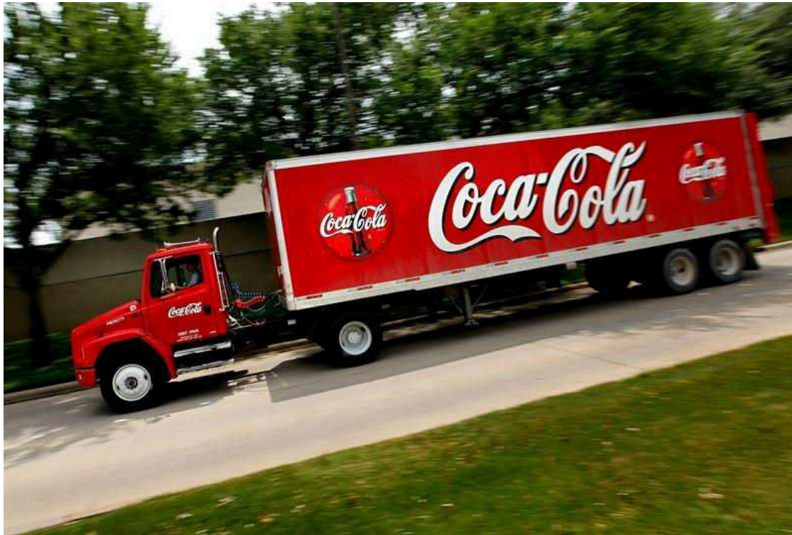
Coca Cola. EP

Las marcas más emblemáticas de EE.UU. y la cultura del capitalismo anunciaron este martes casi al unísono que suspenden sus operaciones en Rusia