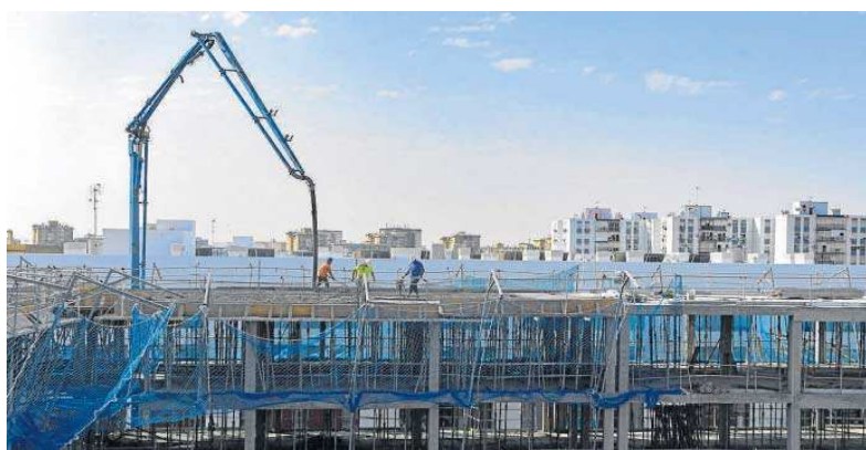
Obras avanzadas en la promoción de vivienda social que Emvivesa construye en Cisneo Alto.

Un dato objetivo es que la citada reactivación de Emvivesa desde el pasado mandato coincide con el desarrollo de políticas sociales centradas en dar respuesta a esta demanda general. En estos momentos, no hay una sola vivienda vacía y el plazo máximo que transcurre hasta que se asigna una vacante es de una semana, según fuentes municipales. Éste es el resultado de adjudicar una media cercana a las 20 viviendas mensuales en los últimos años. En estos momentos hay 1.380 viviendas protegidas adjudicadas del parque municipal. Y, en el caso de inmue-