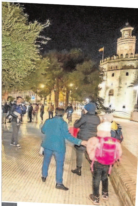
Llegada anoche de una treintena de ucranianos a Sevilla, tras cinco días de viaje en autobús

tarios del hospital Viamed que prestarán atención sobre el terreno a los exiliados de la guerra que aguardan un transporte.