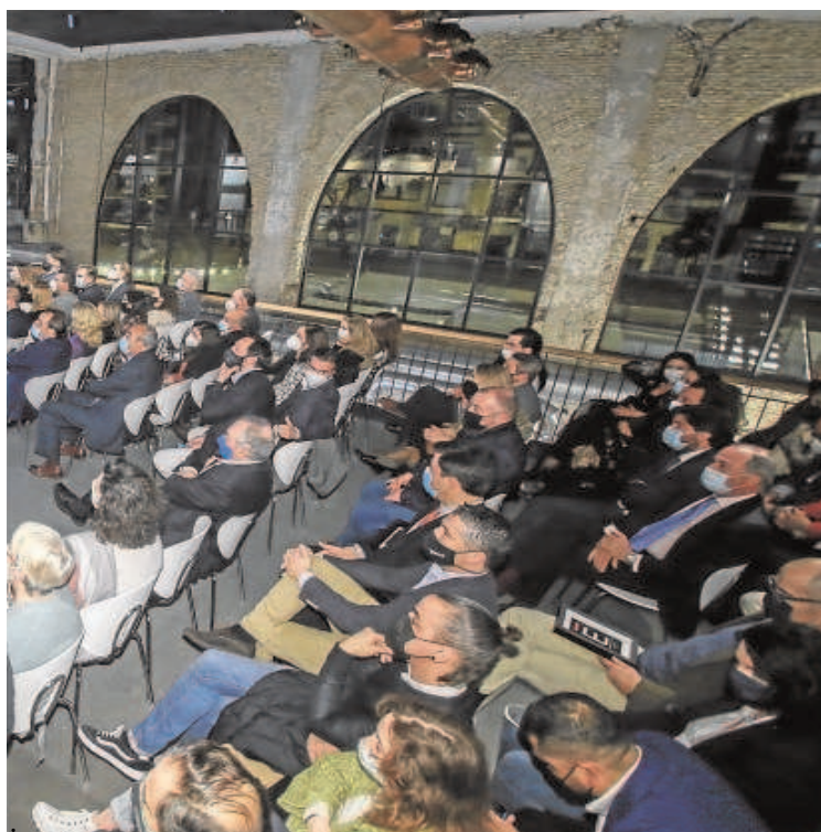
celebrados la noche del pasado lunes