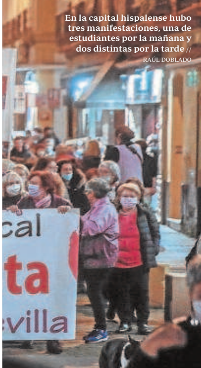
En la capital hispalense hubo tres manifestaciones, una de estudiantes por la mañana y dos distintas por la tarde