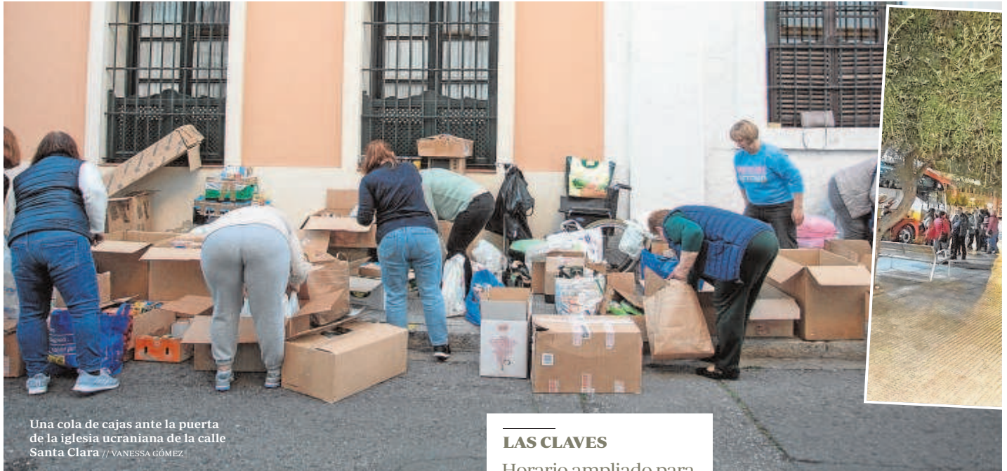
Una cola de cajas ante la puerta de la iglesia ucraniana de la calle Santa Clara