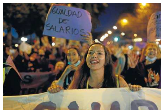
Pancartas reclamando la igualdad salarial con los hombres. ANTONIO PIZARRO

Dos manifestaciones, una convocada por la Comisión por la Igualdad y contra la Violencia de Género, y otra por el colectivo Feministas 8M, recorrieron las calles de la capital jiennense este 8 de marzo. Así, según cifras de Policía Nacional facilitadas por Subdelegación del Gobierno, "unas 1.100 personas" participaron en la convocada por la comisión bajo el lema Por mí, por ti, por todas salimos a la calle . Mientras, en la marcha organizada por el colectivo feminista hubo