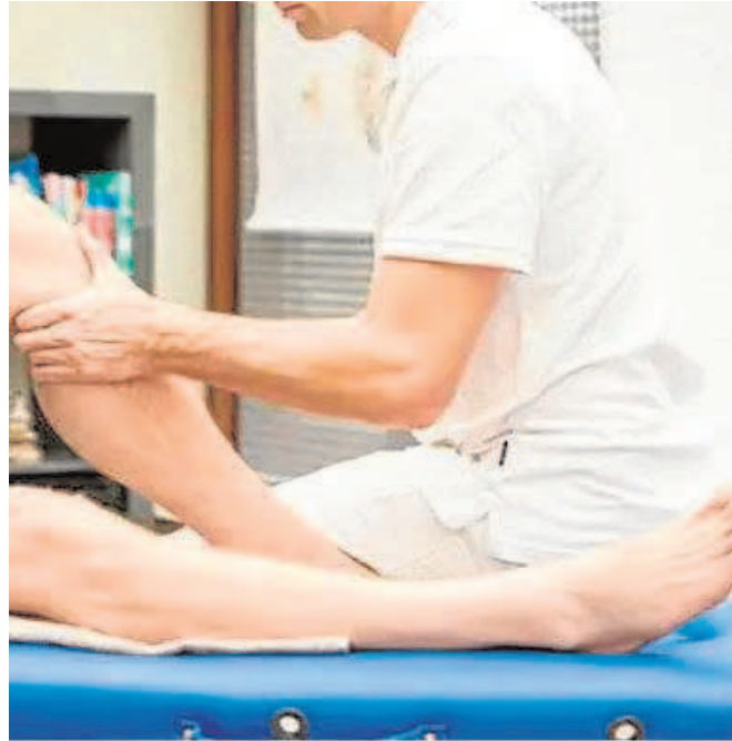
Un fisioterapeuta, trabajando con un deportista

En el Consejo Superior comunican que han establecido conexiones y encuentros con las asociaciones y colectivos profesionales relacionados con