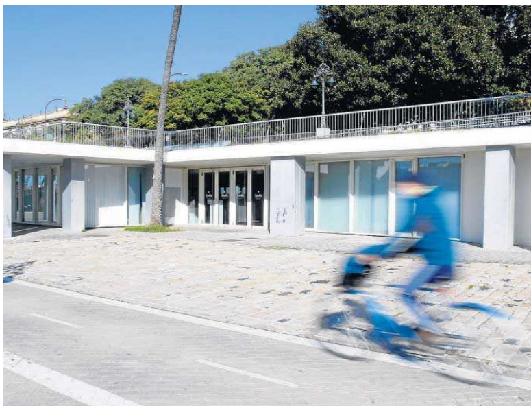
Un ciclista pasa junto a los locales del Paseo Marqués de Contadero.

El primero es el proyecto de aceleración de empresas innovadoras y tutela para emprendedores y startups especializadas en aplicaciones tecnológicas para la industria turística de la mano de socios de referencia. Esta idea surge a raíz de los contactos que se entablaron en la última edición del congreso de tecnologías aplicadas a la industria turística Tourism Innovation Summit . La intención es permitir que se fortalezca el ecosistema de innovación turística, así como testar en la ciudad experiencias piloto que permitan gestionar más sosteniblemente los recursos turísticos. No sólo eso. Se busca analizar indicadores de competitividad y agregación de valor.