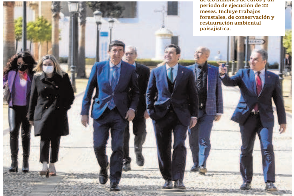
El presidente Juanma Moreno y algunos de los consejeros en La Rábida, con el monasterio al fondo

El Consejo de Gobierno tomó conocimiento del proyecto 'Actuaciones para la mejora de hábitats incluidos en la Red Natura 2000 y control de efectos externos en el Espacio Natural de Doñana', por parte de la Consejería de Agricultura que cuenta con un presupuesto de 6,6 millones de euros y un periodo de ejecución de 22 meses. Incluye trabajos forestales, de conservación y restauración ambiental paisajística.