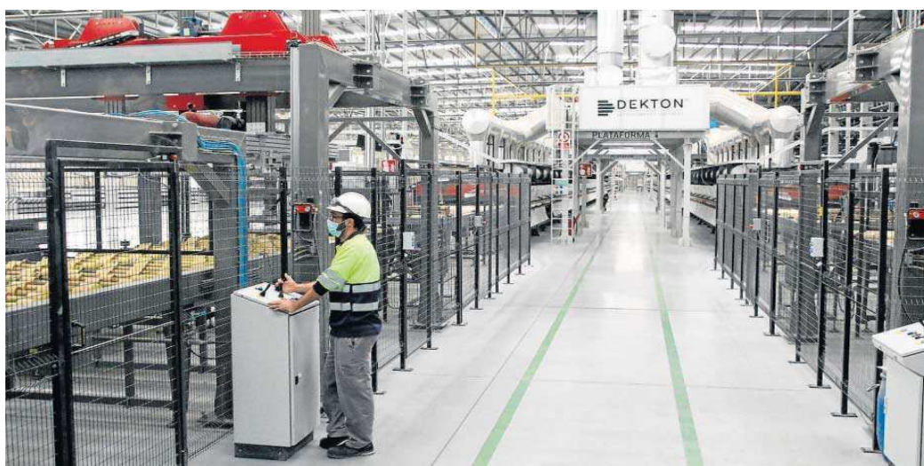
Interior de la fábrica de Cosentino en Cantoria, en Almería.

Ninguna de las 19 empresas de la Aiqbe prevé interrumpir la producción en Huelva