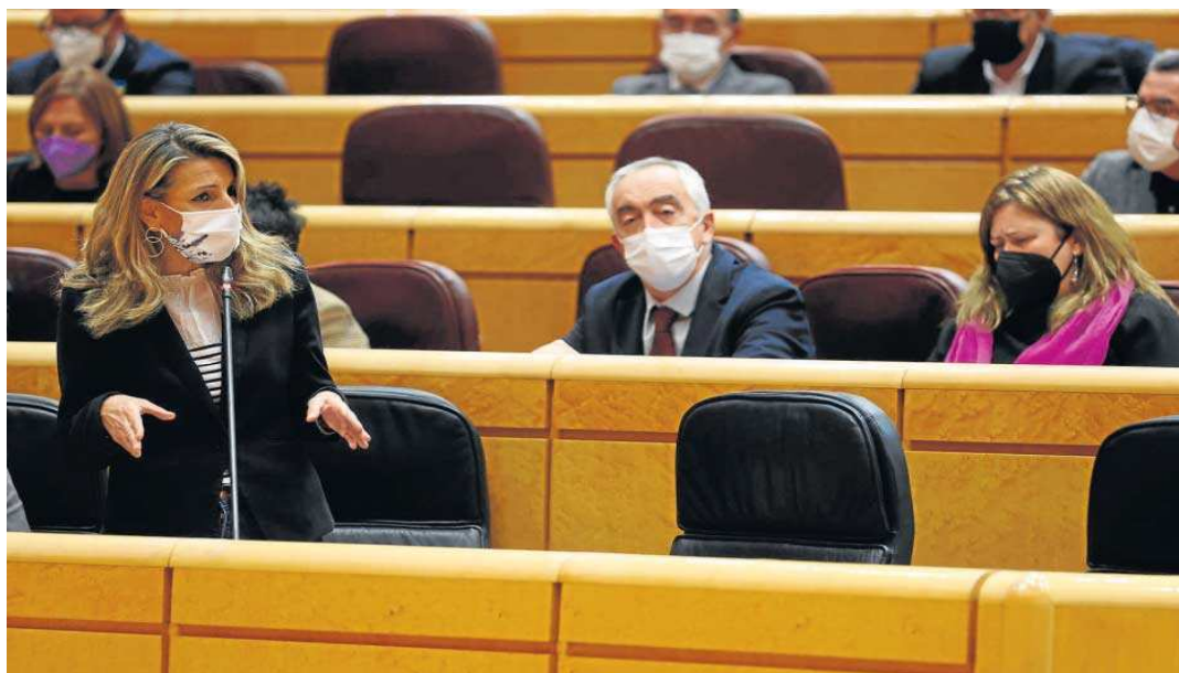
Yolanda Díaz, vicepresidenta segunda del Gobierno, durante su intervención ayer en el Senado.

El PP señaló que la decisión del Rey emérito es algo "personal" referido a su vida privada y la reseta. "Mientras la Justicia no diga lo contrario el rey puede hacer lo que crea conveniente", afirmó el diputado de Cs Guillermo Díaz, que avanzó que su formación estaría dispuesta a analizar la figura de la inviolabilidad del Rey si se reforma la Constitución, pero que hay otras cuestiones prioritarias. La reforma constitucional para suprimir la inviolabilidad del Rey, según Vox, "no parece que esté entre las prioridades de los españoles", según su portavoz, Iván Espinosa de los Monteros, quien cree que el Emérito "está en su derecho" de regresar a España cuando quiera.