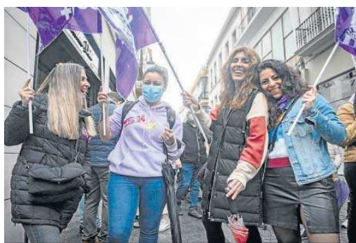
Ambiente festivo entre las participantes.

La Delegación del Gobierno en Andalucía cifró en 64 –frente a las 46 del pasado año– las concentraciones y manifestaciones comunicadas en la comunidad este 8 de marzo con motivo del Día Internacional de la Mujer –36 en las provincias y 28 en las capitales–. En Málaga capital la