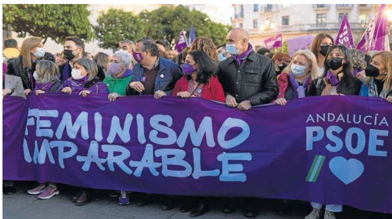
El alcalde, Antonio Muñoz, a la cabeza de una de las manifestaciones. ANTONIO PIZARRO