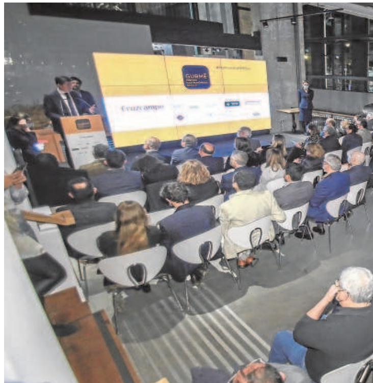
Vista general de la entrega de los Premios GURMÉ en la Factoría Cruzcampo,