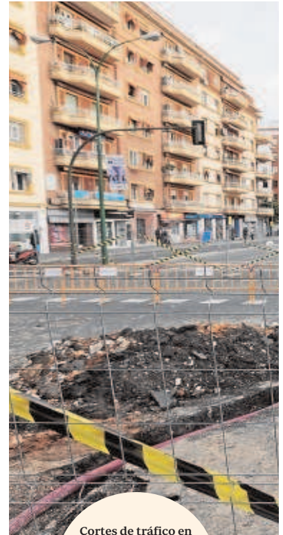
Cortes de tráfico en Nervión y su entorno, así como los desvíos que ha propuesto el Ayuntamiento ante las obras del tranvía

Este cierre en pleno Nervión ha llegado cuando sigue clausurada por la colocación de nuevas canalizaciones la avenida Jiménez-Becerril desde el Alamillo a la Barqueta, cuando parte de Torneo también está en obras de reurbanización y ya con la avenida de la Cruz Roja cerrada al tráfico para peatonalizarla. Además, la Ronda Histórica también está en obras y con la calzada reducida por la ampliación de aceras y construcción del nuevo carril bici, mientras que la Carretera de Carmona quedó cerrada hace varios meses en dirección salida. El 'desahogo' de todo este tapón enviaba el tráfico hasta Nervión, donde