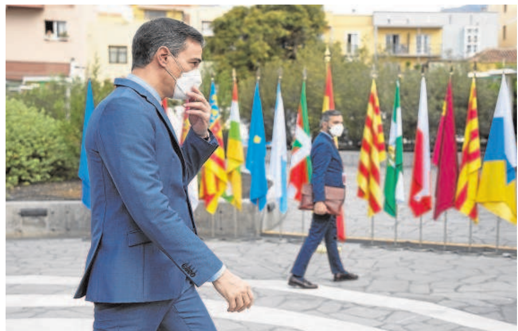
Pedro Sánchez, en la Conferencia de Presidentes celebrada en la isla de La Palma

Lo cierto es que, más allá de los acuerdos de fondo, y los que puedan venir, el ambiente que se respira es de sintonía entre La Moncloa y la dirección interina del PP. Fuentes de los populares agradecen que durante la cumbre de La Palma hubiera una buena interlocución personal entre Sánchez y Feijóo y el propio presidente gallego subrayó, en su comparecencia final ante los medios de comunicación, que era la primera Conferencia de Presidentes a la que no se llegaba con un guion establecido previamente desde el Gobierno. Sánchez, de hecho, protagonizó justo antes de empezar los trabajos de la conferencia, junto al presidente canario, Ángel Víctor Torres, que ejercía de anfitrión, una comparecencia que pecó de ambigua, sobre todo para los informadores que cubrieron el evento, pero con la que trató de evitar interferir en el debate posterior y que hubiese cualquier tipo de incomodidad por parte de Feijóo, en su estreno como líder de la oposición.