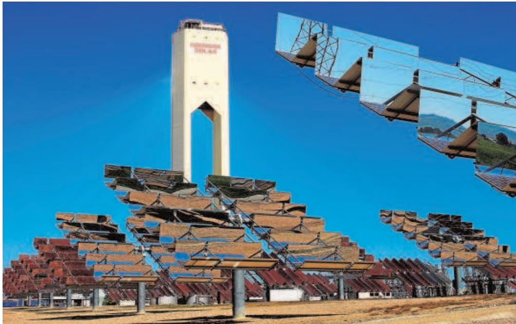
La multinacional sevillana Abengoa tiene más de 12.500 trabajadores en nómina