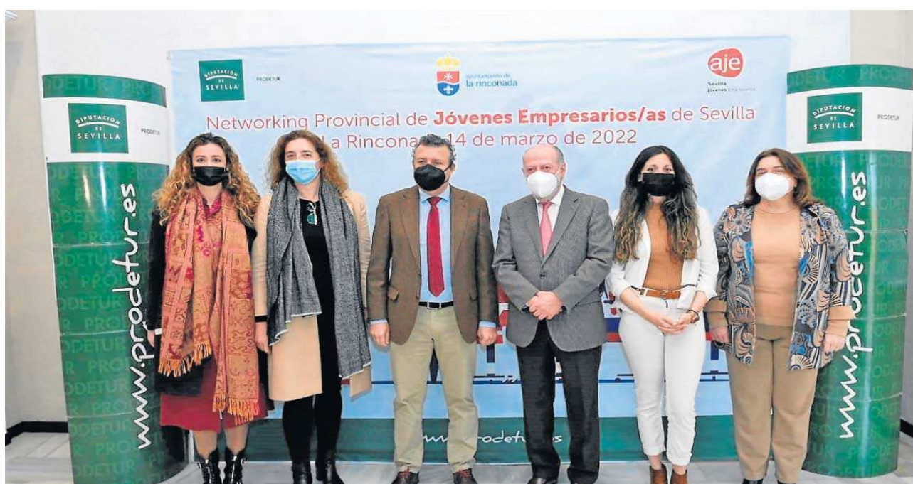
Presentación del Encuentro Provincial de Negocios.

Competitividad empresarial. Ayer tuvo lugar el Encuentro Provincial de Negocios 'Networking'