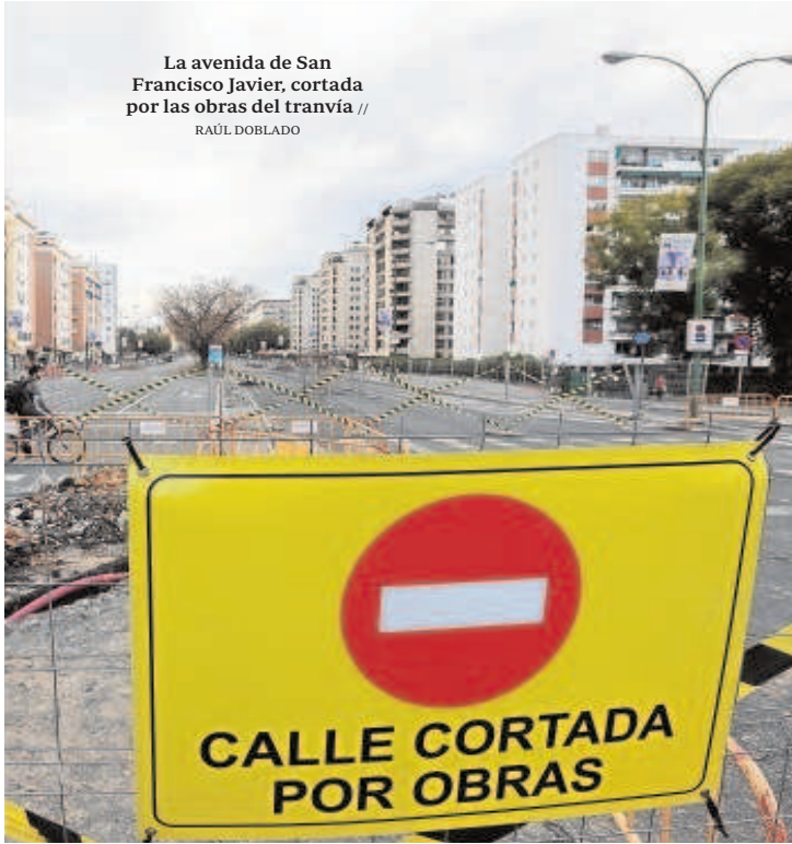
La avenida de San Francisco Javier, cortada por las obras del tranvía

ahora se ha cerrado la principal arteria. Esta falta de previsión y de coordinación ha generado un escenario insufrible para los conductores en todo el tráfico urbano interior, que ha terminado colapsando. El exterior, que ya está colmatado desde hace años, también está sufriendo por las obras en todo el entorno del Centenario, de forma que el resultado es un caos colosal en horas punta y una circulación muy problemática en el resto de franjas horarias.