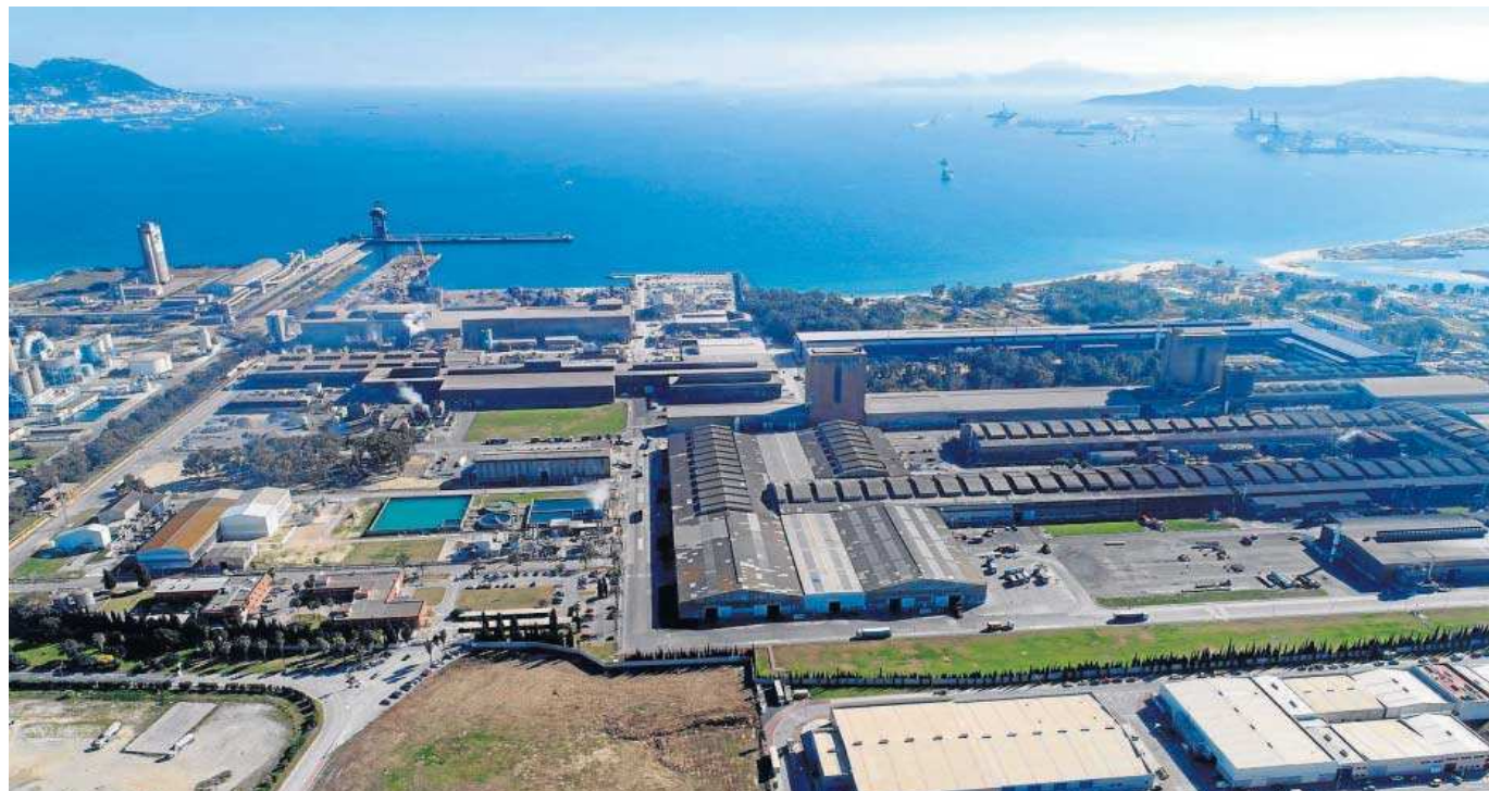
Vista aérea de la fábrica de Acerinox en Los Barrios (Cádiz).