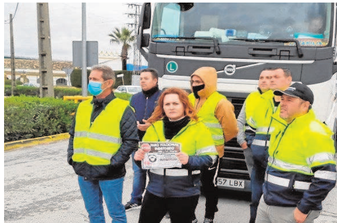
Piquete impidiendo la entrada de camiones en Sevilla

En Bailén y Guarromán, localidades de Jaén, los piquetes alteraron la normal distribución de carburantes a las estaciones de servicios, según fuentes de la patronal. También en Jerez de la Frontera, los piquetes de las estaciones de servicio impidieron que los camiones que transportaban carburante vaciaran sus tanques en dos gasolineras.