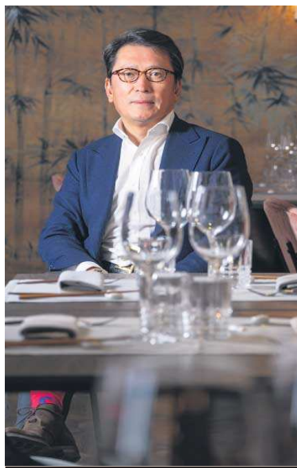
MESAS PARA NUEVOS SABORES M.G.

mi lo ha cambiado. Ahora usamos unos palillos para coger y otros para comer. Así ya no mezclamos. Aquí lo mismo, ponemos pinzas. –¿Ha pensado en ampliar su grupo a otras ciudades españolas? –Estamos preparados para salir de Madrid. Andalucía encaja en nuestro concepto, pensamos en Sevilla, Córdoba y sobre todo Marbella. Una ventaja grande para nosotros es que tenemos la logística, el equipo. –Guarda cierto vínculo con Andalucía, ¿no? –Fundé una asociación de golfistas chinos en España, llevo ocho años de presidente, aunque tengo poco tiempo, viajo cuando puedo a Marbella. Viví once años en Holanda y a las ocho está todo el mundo en la cama. Marbella tiene mucho potencial y tenemos equipo para mandar fácilmente a un jefe de cocina, un sumiller... y va a funcionar. –¿Y abrir en Sevilla? –Fui al Alfonso XIII. El director es mi amigo y me ofreció un local en el hotel. Sevilla está bien, aunque primero veo Marbella. Los sevillanos son conservadores en sus gustos y tiene que encajar muy, muy bien. Hace 8 o 10 años, fui a verlo y pensaba que no era el momento, todo era pescaito frito y demás. Pero ahora sí, todo está más globalizado y abierto, lo veo. En Sevilla, una cosa bien hecha, funciona seguro. –Se dice que mientras en