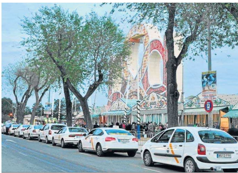
Taxis en la Portada de la Feria en una edición pasada.