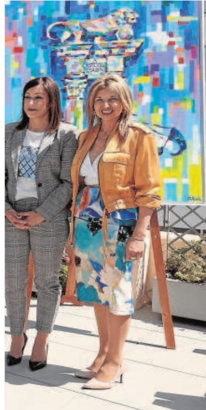
Chaves, ayer en la presentación

Dichas piezas audiovisuales acercan al visitante a la trayectoria vital del escultor y explican la relación del monumento en cuestión con otras de sus obras. Esta información didáctica contiene imágenes de alta calidad, tanto de monumentos como de ilustraciones procedentes del Museo ABC. Estos elementos urbanos mostrarán, además, tres pinturas realizadas por José Cerezal en torno a los principales monumentos del artista en la capital andaluza y las fotografías de Zamora.