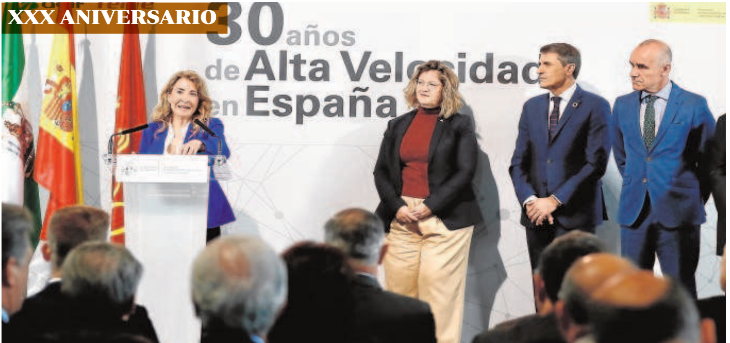
la ministra de Transportes, Raquel Sánchez, ayer en la estación de Santa Justa en un acto en el que sólo hubo políticos del PSOE