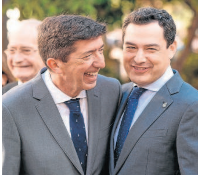
Moreno y Marín sonríen en el último consejo de Gobierno en Málaga

Sin embargo, las encuestas reducen al mínimo las opciones de la formación naranja en las elecciones andaluzas, incluso podría perder toda su representación parlamentaria de 21 diputados tras casi cuatro años en el