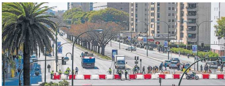
Corte de tráfico en la avenida de San Francisco Javier antes de la tala del arbolado de la mediana.