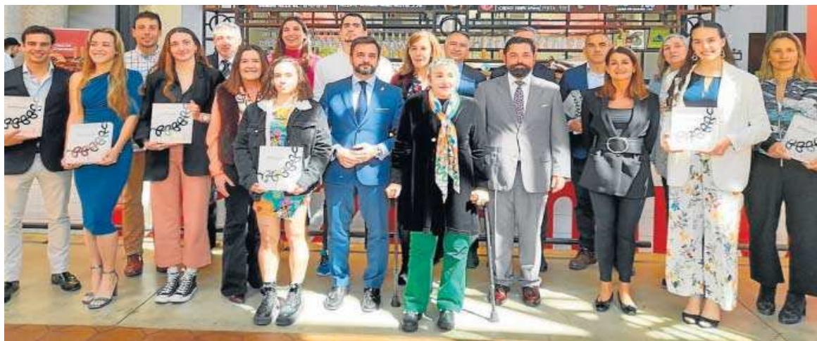
Los distinguidos con los premios Estímulos del Deporte del último trienio. D.S.