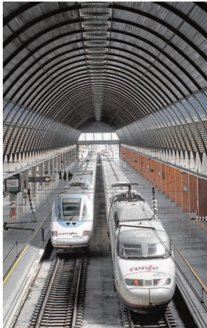
Dos trenes AVE en la estación de Santa Justa