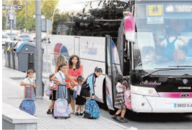
Transporte escolar en la ciudad de Córdoba

«Tal y como se ha realizado con el sector de las obras y la construcción, hemos solicitado reuniones urgentes con la Junta para buscar fórmulas que permitan una revisión de los precios. Cuando parece que vamos a empezar a poder iniciar la recuperación nos sobreviene esta inflación galopante, que en los combustibles es imposible de asumir. Tenemos firmados contratos con la administraciones que deben ser