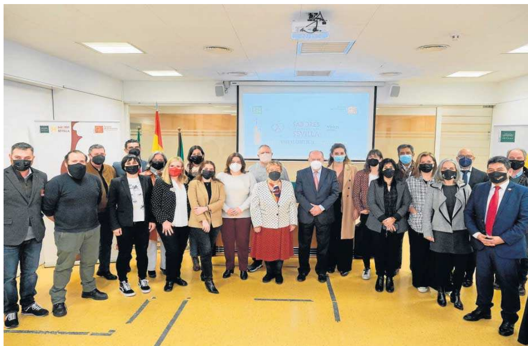
El presidente de Diputación, Fernando Rodríguez Villalobos, junto al jurado de los VII Premios Vinos y Licores de la Provincia de Sevilla.

“Tras dos años de dificultades, en los que hemos procurado reforzar nuestro apoyo a este sector –uno de los más afectados por la crisis sanitaria provocada por la pandemia– y en los que hemos mantenido la celebración de estos Premios, en esta séptima edición del certamen pretendemos impulsar aún más nuestros vinos con un acto de entrega de distinciones a la altura del esfuerzo de estos empresarios, y de la categoría y calidad que tienen nuestros vinos y destilados”, ha declarado Villalobos. A la convocatoria del Premio han podido optar todos los vinos y licores elaborados en el territorio de productores adheridos a la marca “Sabores de la Provincia de Sevilla”, atendiendo a las siguientes