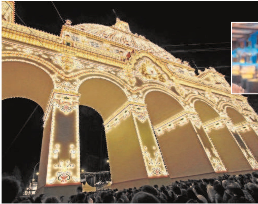
La Feria de Abril se podrá vivir a través de unas gafas de realidad virtual