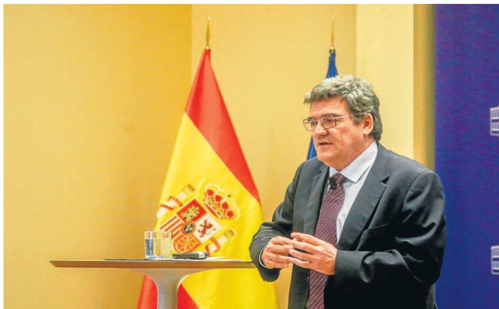
El ministro de Inclusión, Seguridad Social y Migraciones, José Luis Escrivá, interviene en una rueda de prensa en la sede del Ministerio.

El ministro Escrivá señaló que eso se refleja en la composición de los contratos, con un 77% de ellos de carácter indefinido, 6 puntos más que en el promedio registrado en los meses de 2015 a 2021. Los contratos se reparten en un 73% de fijos, un 4% de fijos dis-