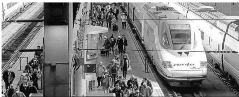
Viajeros en la estación de Santa Justa, ayer.

Entre las autoridades invitadas faltó una representación de la Junta de Andalucía, que mostró su malestar por este detalle. “En dicho acto no ha habido presencia de la Junta de Andalucía porque no había sido invitada ni informada previamente. Lo hemos sabido ahora”, lamentó el Gobierno andaluz, que recordó que hace cinco años, en los 25 años de la Alta Velocidad, el entonces