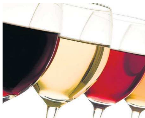
Los vinos y licores de la provincia de Sevilla tienen un gran prestigio.

Por otra parte, la Diputación promoverá los vinos y licores ganadores de este concurso utilizando en sus actos promocionales, catas o degustaciones, para lo que adquirirá suficiente cantidad de estos caldos o de otros de la misma bodega, en caso de que no tuvieran suficiente suministro del vino o destilado ganador.