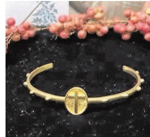
Pulsera solidaria // ABC

Ucrania' se podrá colaborar tanto donando como comprando estos libros.