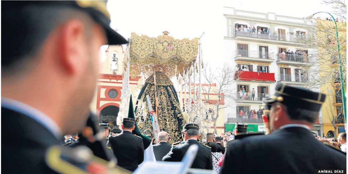
San Roque. Los músicos de la banda de la Cruz Roja acompañan a la Virgen de Gracia y Esperanza. Domingo pleno de gozo en la antigua ronda .

Distribuido para CONFEDERACIÓN DE EMPRESARIOS DE SEVILLA * Este artículo no puede distribuirse sin el consentimiento expreso del dueño de los derechos de autor.