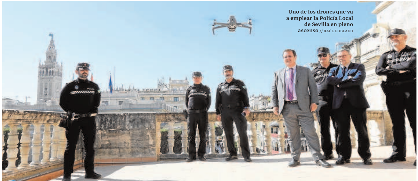
Uno de los drones que va a emplear la Policía Local de Sevilla en pleno ascenso