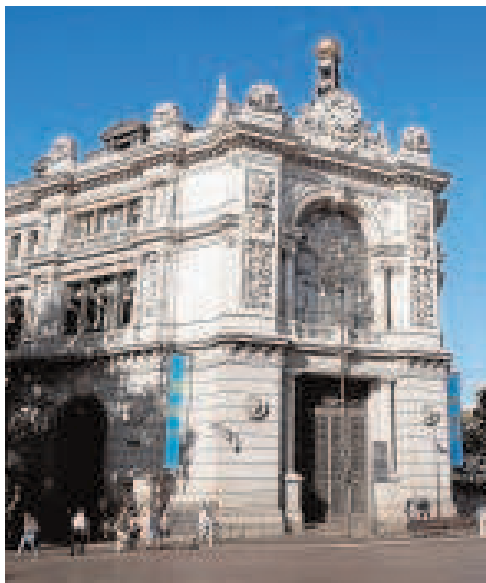
El Banco de España

Lo que determina este cambio del ciclo de tipos es el punto de partida. Nunca la casilla de salida había sido negativa. Las expectativas sobre que los tipos transiten de negativo a positivo tiene muchas y