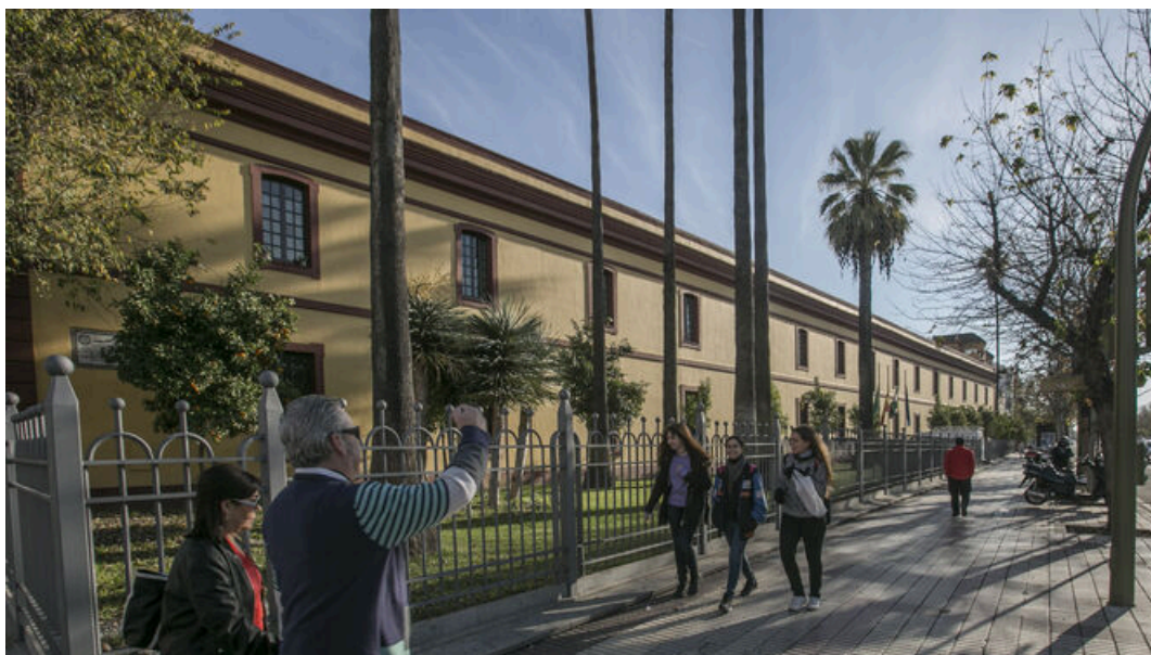
La fachada de la Diputación de Sevilla.

La Diputación de Sevilla ilumina este lunes 11 de abril su fachada de color rojo en solidaridad con las personas enfermas de Parkinson y sus familiares .