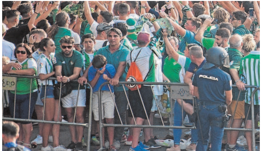
Los agentes tienen varias citas deportivas de primer nivel

Este esfuerzo en recursos humanos no se va a traducir en una remuneración por servicios extraordinarios como sí ocurre en otros cuerpos como la Policía Local. La Dirección Adjunta Operativa ha reservado una partida para abonar como gratificación extraordinaria 450 servicios de los más de 1.200 diseñados para la cobertura de la Semana Santa sevillana. Es de-