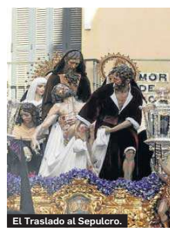
El Traslado al Sepulcro.