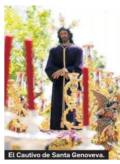
El Cautivo de Santa Genoveva.

Dos pasos Parroquia de Ntra. Sra. de las Mercedes