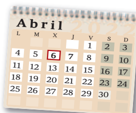
6 de abril: Inicio presentación declaración por internet

En esta campaña de Renta la Agencia Tributaria prestará especial atención a los contribuyentes con rentas procedentes de criptomonedas, activos en el extranjero o alquileres de inmuebles. Tiene previsto remitir cerca de dos millones de avisos a través de los datos fiscales del programa Renta Web para recordar a los contribuyentes con este tipo de activos considerados de riesgo por un lado, que dispone de información sobre su posición patrimonial; y, por otro, que tienen la obligación de declarar los rendimientos obtenidos en su declaración de la Renta.