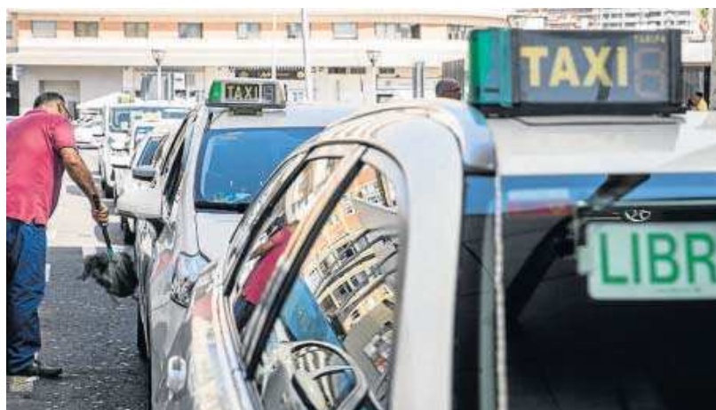
Un taxista limpia su vehículo en una parada con más coches.

Así figura en el último recuento del Ministerio de Transportes, Movilidad y Agenda Urbana (Mitma) sobre autorizaciones para el transporte de viajeros en turismo, fechada el pasado 1 de marzo y recogido por Europa Press, toda vez que tiempo atrás, la Junta de Andalucía aprobaba un decreto de modificación del Reglamento de los Servicios de Transporte Público de Viajeros en Automóviles de Turismo, para introducir medidas de modernización en el sector.