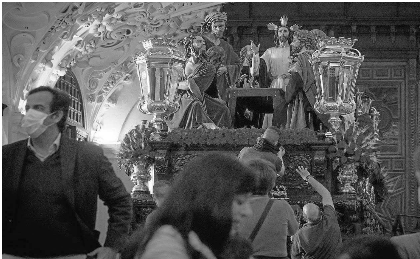
Últimos preparativos al paso de misterio de la Sagrada Cena ayer en la iglesia de los Terceros.