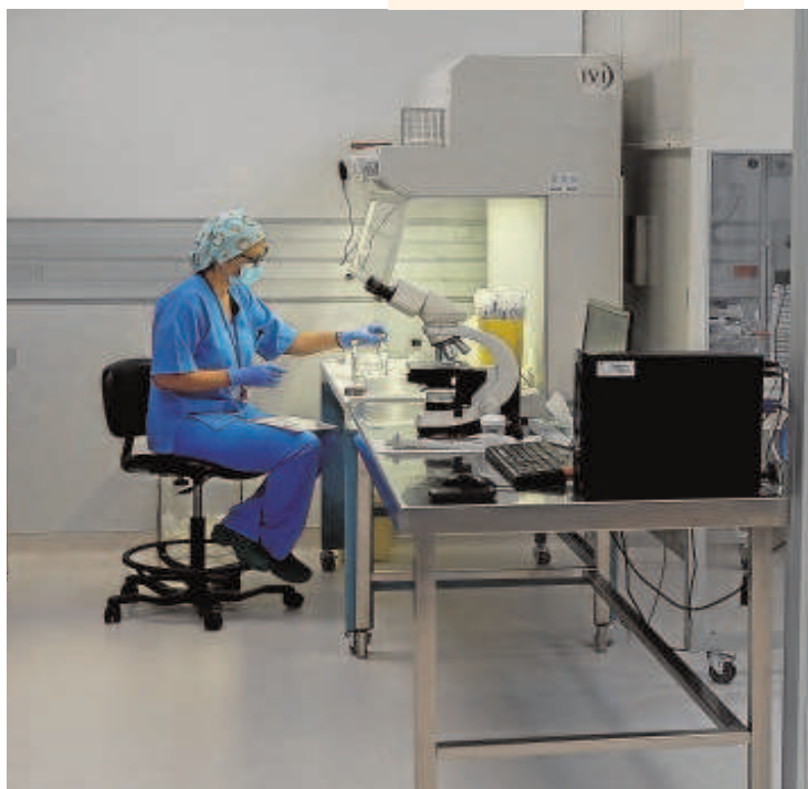
Sanitarios trabajando en el laboratorio de una clínica de Sevilla