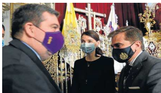
La ministra de Justicia, Pilar Llop, en la Capilla de la Estrella.