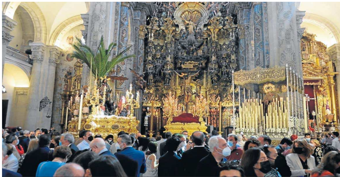
La iglesia del Salvador, repleta de público en la mañana del Domingo de Ramos.