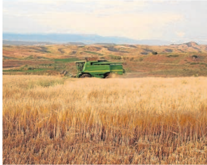
La campaña sevillana perderá ayudas si no se cambia la PAC