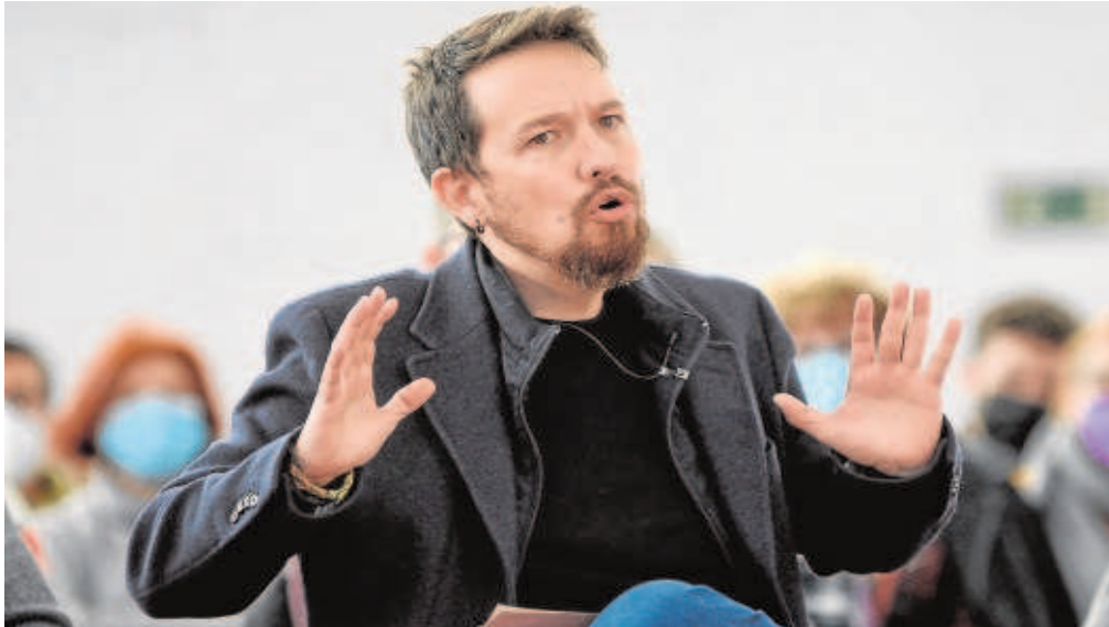
Pablo Iglesias abandonó el Gobierno en marzo del año pasado para participar en las elecciones madrileñas del 4-M