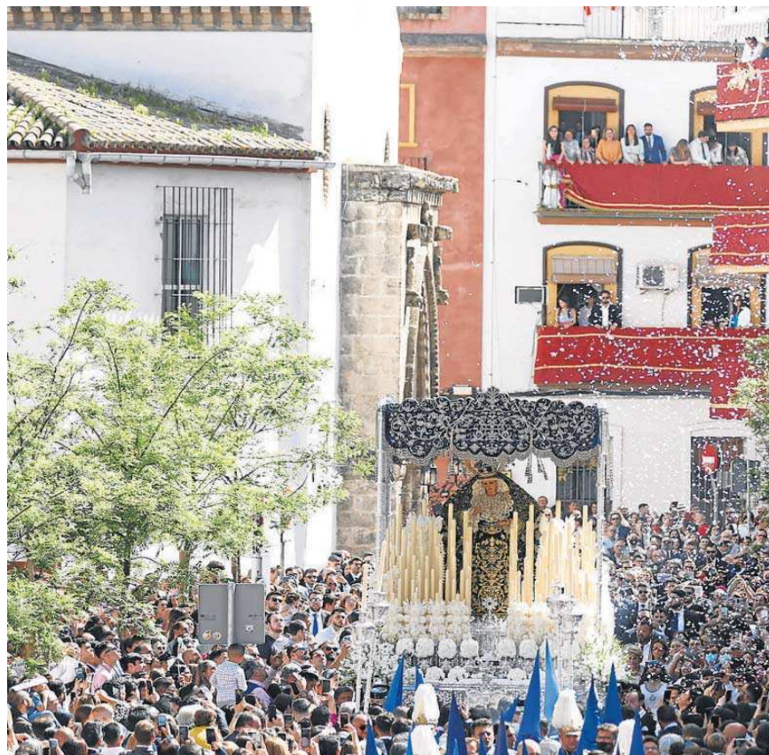
Una lluvia de flores recibe a la Virgen de la Hiniesta en su barrio tras salir de la parroquia de San Julián.

La Hermandad de la Paz abrió el día e inundaba de alegría el barrio del Porvenir. Mucha gente buscó el refugio ofrecido por los árboles del parque para contemplar la cofradía. A esa hora, ya era prácticamente imposible encontrar un bar que tuviera sitio para almorzar o para tomar un refrigerio. De un tiempo a esta parte se ha hecho completamente imprescindible reservar. Y en Semana Santa no iba a ser menos. Las consecuencias de la pandemia. De la antigua normalidad han quedado las raciones y las medias que sustituyen a las tradicionales tapas durante los días de la pasión.