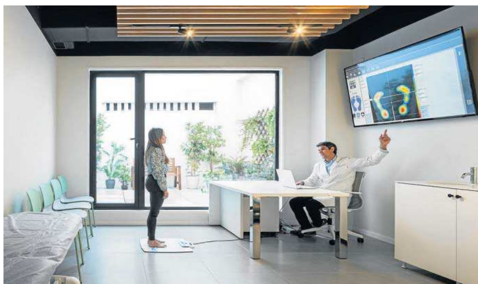
Una de las salas de la nueva clínica de la calle Arroyo.