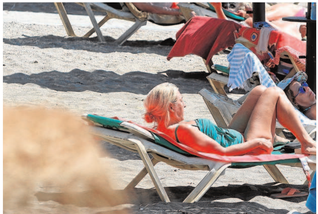
Turistas tomando el sol en una de las playas de la costa de Málaga