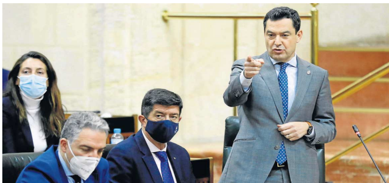
Juanma Moreno, el pasado jueves, junto a Juan Marín y Elías Bendodo.

● El socio de Juanma Moreno en el Gobierno andaluz convoca un congreso el 14 de mayo en Córdoba con el objetivo de que las próximas no sean sus últimas elecciones