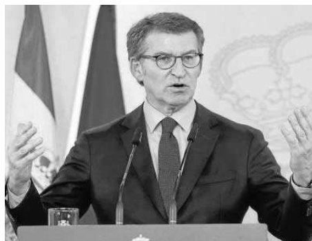
Alberto Núñez Feijóo comparece ante los medios.

tistas y unos primos que pagaron con dinero público ¿Y, por cierto, el Ayuntamiento de Madrid no tiene controles básicos para filtrar una compra de material sanitario de todo a cien? Si hasta la técnica de Hacienda que gestionaba la compra envió a los proveedores una fotografía de unos guantes de características similares a los que le vendían al precio de ocho céntimos de euro en un supermercado cuando el ayuntamiento había pagado dos dólares por los mismos. Es de suponer que habrá, como mínimo, responsabilidades técnicas y políticas en el pufo de 15,8 millones. Eso sin pensar en algún posible tráfico de influencias. Me-