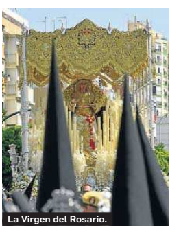
La Virgen del Rosario.

Dos pasos Parroquia de San Ignacio de Loyola