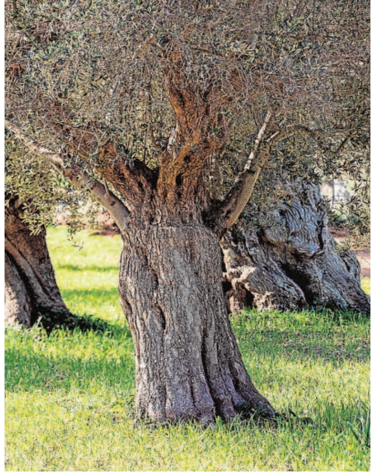
Cubierta vegetal en una explotación de olivar