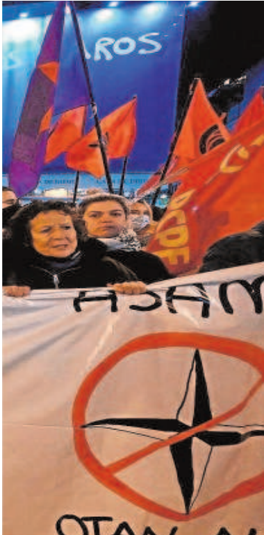
Manifestación del PCE contra la OTAN tras iniciar Putin la guerra

Rusa», sostiene Red Roja en defensa de Putin y de su invasión.