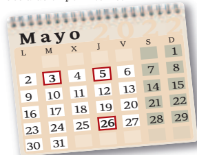
3 de mayo: Inicio solicitud de cita previa para plan 'Le llamamos' 5 de mayo: Inicio de atención telefónica mediante el plan 'Le llamamos' 26 de mayo: Se puede pedir cita previa para la atención presencial