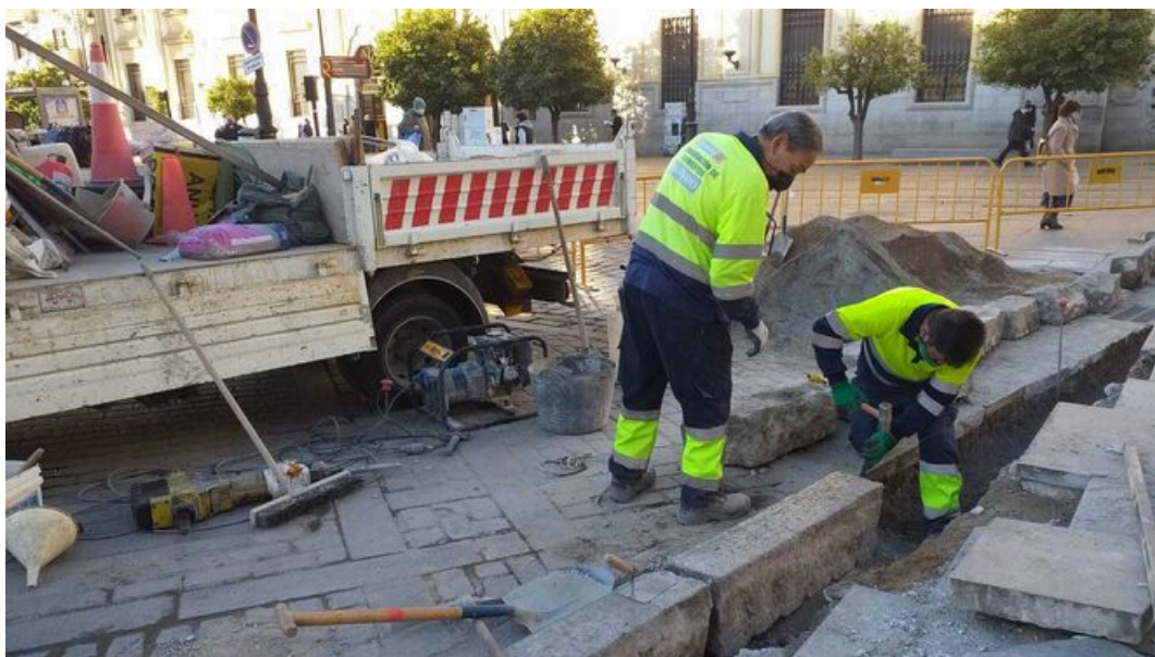
Obras en la céntrica Avenida de la Consituación.

La programación especial desplegada desde la Gerencia de Urbanismo y Medio Ambiente para repasar los pavimentos en las calles y plazas más transitadas y concurridas durante la Semana Santa, especialmente en aquellas que son parte de la Carrera Oficial e itinerarios de las distintas hermandades , ha concluido en la tarde del pasado viernes con más de 300 actuaciones .