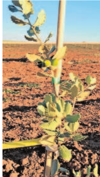
Encinas de Meristec en campo

Por otra parte, una de las empresas líderes en el sector viverístico, como es Agromillora, también se encuentra actualmente haciendo ensayos de plantación de encinas en marco intensivo y superintensivo y en regadío, en colaboración con el Centro de Investigaciones Científicas y Tecnológicas de Extremadura (Cicytex). «Son muchas las campañas en las que la producción de bellotas en España y Portugal es insuficiente y los ganaderos salen a países del norte de África como Túnez, Argelia y Marruecos en la búsqueda de estos fru-