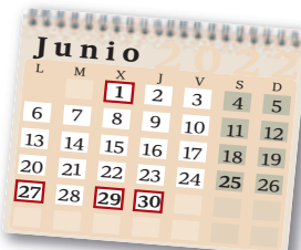
1 de junio: Comienza la atención presencial para confección de declaraciones 27 de junio: Fin del plazo para la domiciliaciones. Renta a ingresar 29 de junio: Fin del plazo de cita previa 30 de junio: Último día para presentar la declaración