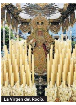
La Virgen del Rocío.