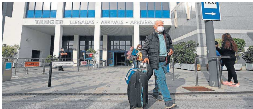
Algunos de los últimos pasajeros que atravesaron el Estrecho en ferry, a su llegada a Tanger. ERASMO FENYO