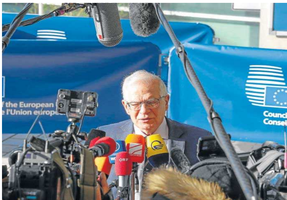
El jefe de la diplomacia europea, Josep Borrell, atiende a los medios ayer en Luxemburgo.

El político español visitó la semana pasada junto a la presidenta de la Comisión Europea, Ursula von der Leyen, Kiev, donde se reunieron con el presidente ucraniano, Volodimir Zelenski, y Bu-