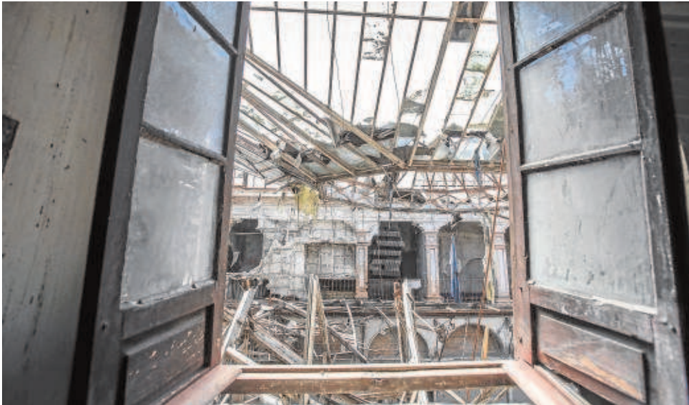
Sobre estas líneas, estado del interior del antiguo cine Trajano