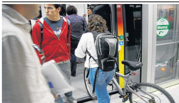
Una joven sube con su bicicleta al Metro.

"El Ministerio ha reafirmado que continuará aportando un euro por cada euro que aporte la Junta, una vez descontadas las posibles ayudas, con independencia de la figura y de la Administración