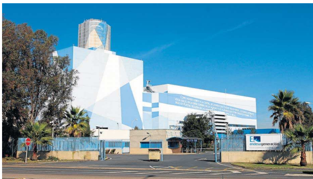
Central de ciclo combinado de Endesa en Huelva.

Recuerdan que el sector eléctrico viene demandando que se cambie el método de cálculo del PVPC para evitar la volatilidad que sufren los clientes acogidos a la tarifi-