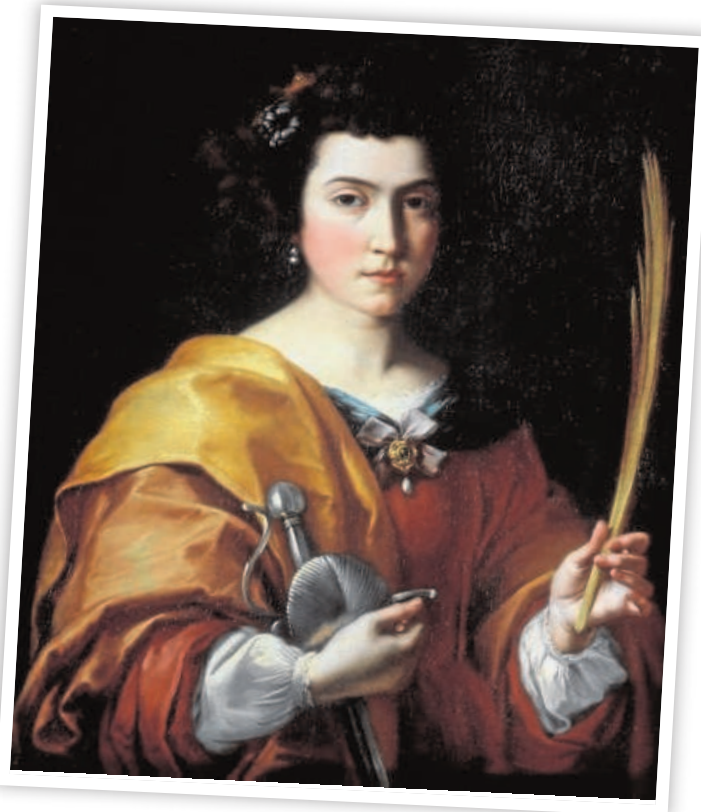
'Santa Catalina', de Bartolomé Esteban Murillo

Tanto el alcalde de Sevilla como la Consejería de Cultura ya han mani-