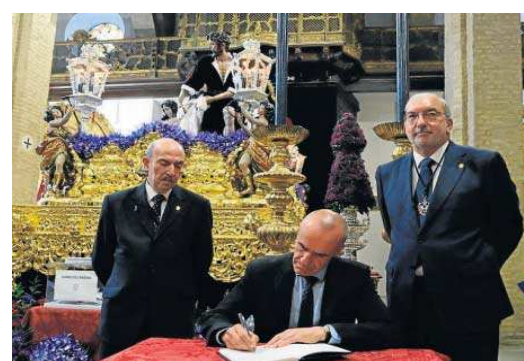
El alcalde firma en el libro de honor de Santa Marta.

Hasta la parroquia de Nuestra Señora de las Mercedes y Santa Genoveva llegaron visitas de las hermandades del Gran Poder, la Macarena, los Estudiantes o la Sed. A las nueve y media daba co-