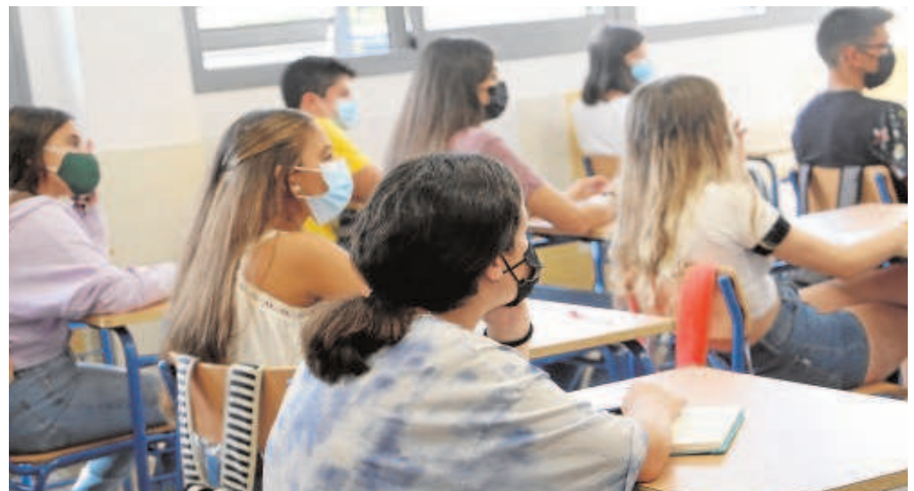
Estudiantes en plena clase en un instituto

Además los profesores de historia consultados por ABC consideraban que ese cambio se hace con la idea de que los estudiantes sean «más manipulables» y consideran que se trata de una reforma que se hace «en beneficio de una determinada ideología» y rechazaban tajantemente que se empezara a estudiar la historia sólo desde 1812.