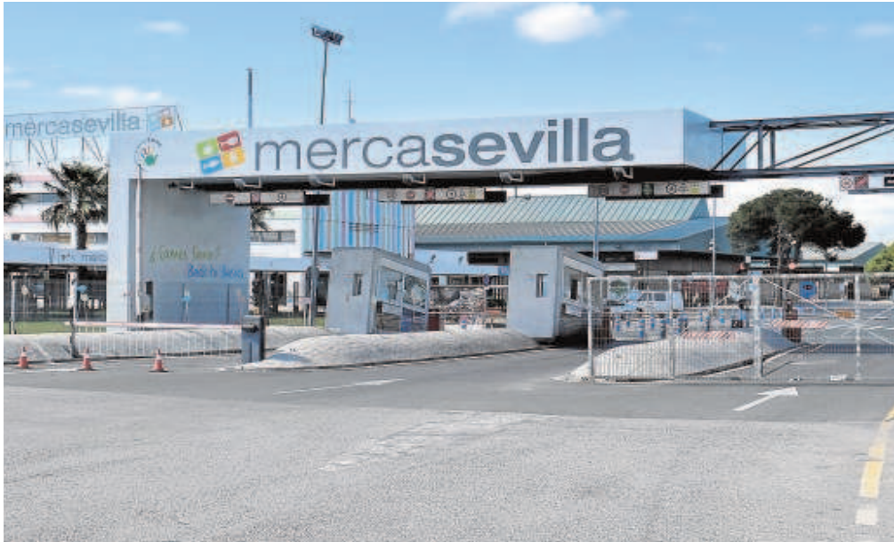
Acceso principal al mercado central de abastos sevillano, Mercasevilla