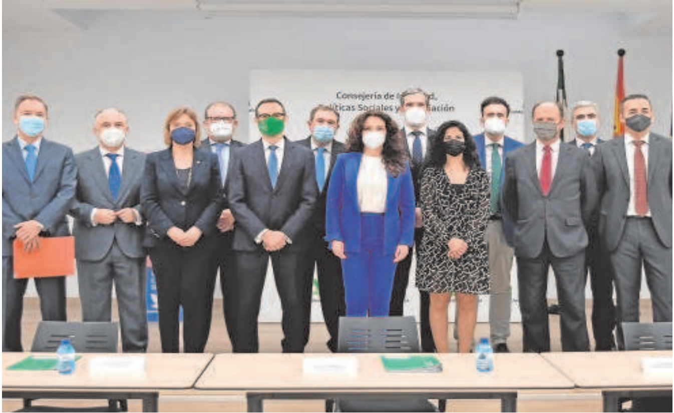
Foto de familia de la firma de las entidades bancarias y la Consejería de Igualdad de la Junta de Andalucía