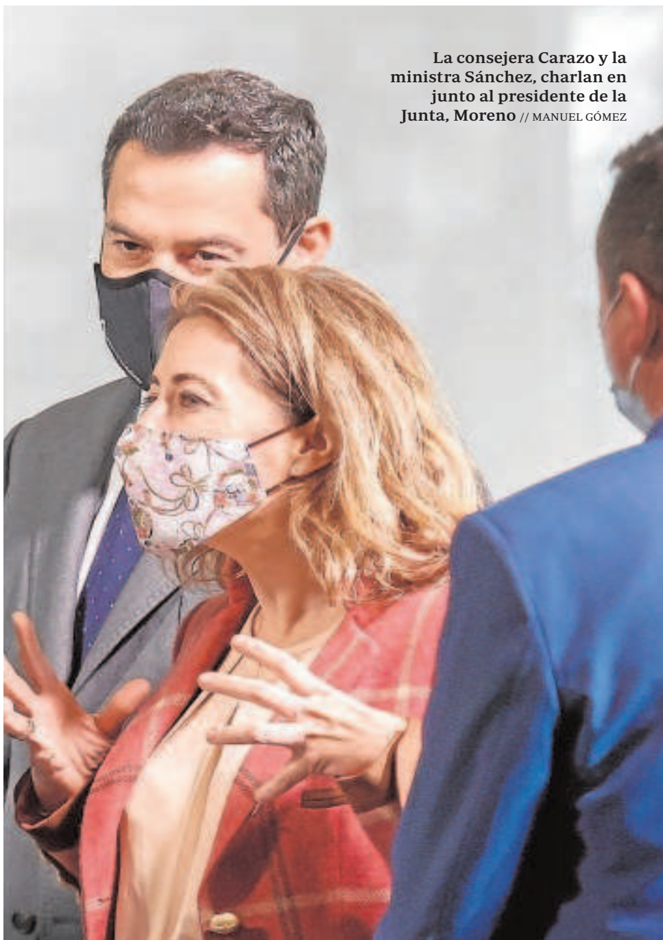
La consejera Carazo y la ministra Sánchez, charlan en junto al presidente de la Junta, Moreno

to tras trasladar el borrador al Gobierno. Recordó que se trabaja en la ampliación del metro «desde el primer día en la Consejería» y que, de hecho, se revisó el proyecto, se puso en marcha una mesa técnica con el Ayuntamiento para compartir información,