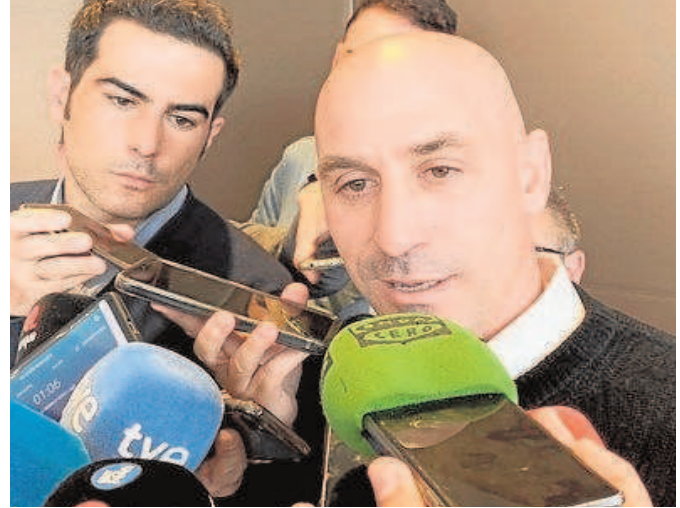
Luis Rubiales atendió ayer a los medios de comunicación en Sevilla

Sobre la citada candidatura de España y Portugal para el Mundial 2030, que tiene muchos visos de prosperar dado que se prevé que sea la única eu-