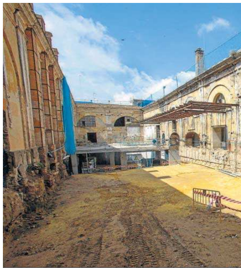
El hallazgo es compatible con el proyecto de rehabilitación.

El proyecto cofinanciado con fondos europeos se está ejecutando sobre los 8.000 metros cuadrados de la parte occidental de la Fábrica de Artillería. En estas naves se ha planteado una propuesta arquitectónica que adapta los espacios a los nuevos usos conservando con un criterio arqueológico las texturas, huellas y cicatrices de las reformas a las que se ha visto sometido el edificio con el paso del tiempo. Se apuesta además por intervenciones mínimas y de carácter reversibles que adquieran distintas formas en función de las cualidades y de la singularidad de cada uno de los espacios. El diseño contempla que el propio edi-