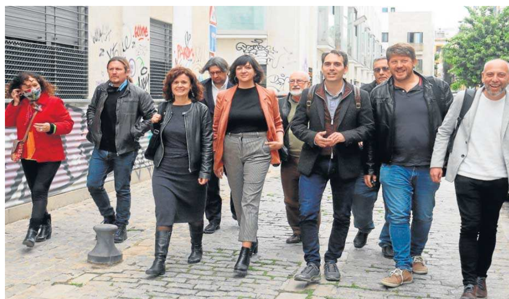
Los líderes de los partidos de izquierda que negocian una nueva confluencia, el día que anunciaron el inicio del proceso, en Sevilla.

● Podemos, IU, Equo e Iniciativa “confían” en “precisar” su acuerdo “en los próximos días” tras una reunión en Málaga a la que no acudió Más País, que apuesta por un candidato independiente