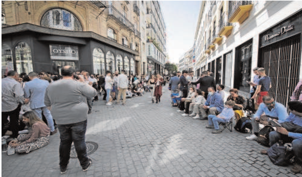
Público en la calle Rioja este pasado Domingo de Ramos a la espera del paso de las cofradías