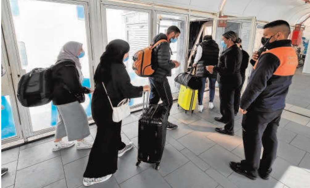
Primeros viajeros embarcando ayer en el puerto de Algeciras con destino a Tánger