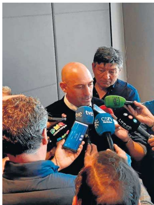
Rubiales atiende a los medios de comunicación en su visita ayer a Sevilla.