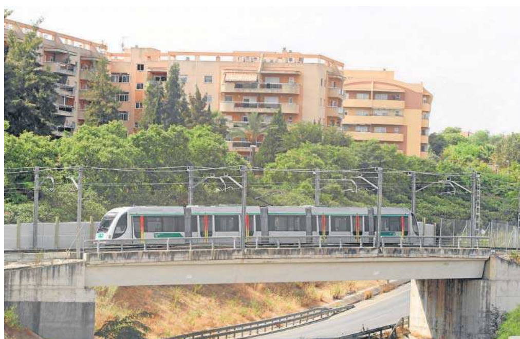
El Metro de Sevilla por Mairena del Aljarafe.