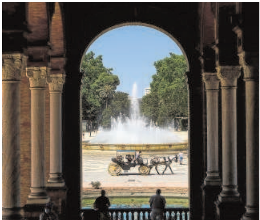
Panorámica de la Plaza de España desde una de sus galerías

«Los lazos entre Dior y España y, más concretamente con Andalucía, se forjaron ya en la década de 1950 y se han fortalecido desde entonces, con viajes que culminaron a lo largo de los años en siluetas con nombres evocadores soñados tanto por el propio Dior como por sus sucesores» al frente de la casa, señalaron desde Dior a través de un comunicado oficial. Partiendo de ese legado, «con motivo de la presentación de la colección crucero 2023 diseñada por Maria Grazia Chiuri, la casa Dior continúa este inspirador homenaje celebrando una amistad inquebrantable con un desfile exclusivo en la icónica Plaza de España, en Sevilla», indicaron para definir el desfile como un «evento único» que «mostrará la excelencia de la artesanía y la cultura andaluza a