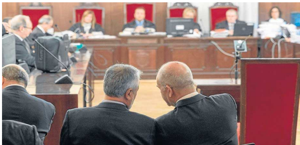
Los ex presidentes Chaves y Griñán, en el juicio de los ERE.