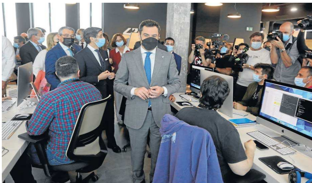
Juanma Moreno, ayer en Málaga, en un acto con el presidente de Telefónica, José María Álvarez-Pallete.

Juanma Moreno puso a calentar la máquina del adelanto hace varias semanas. Autorizó a sus consejeros de Hacienda y de Economía a que se posicionasen