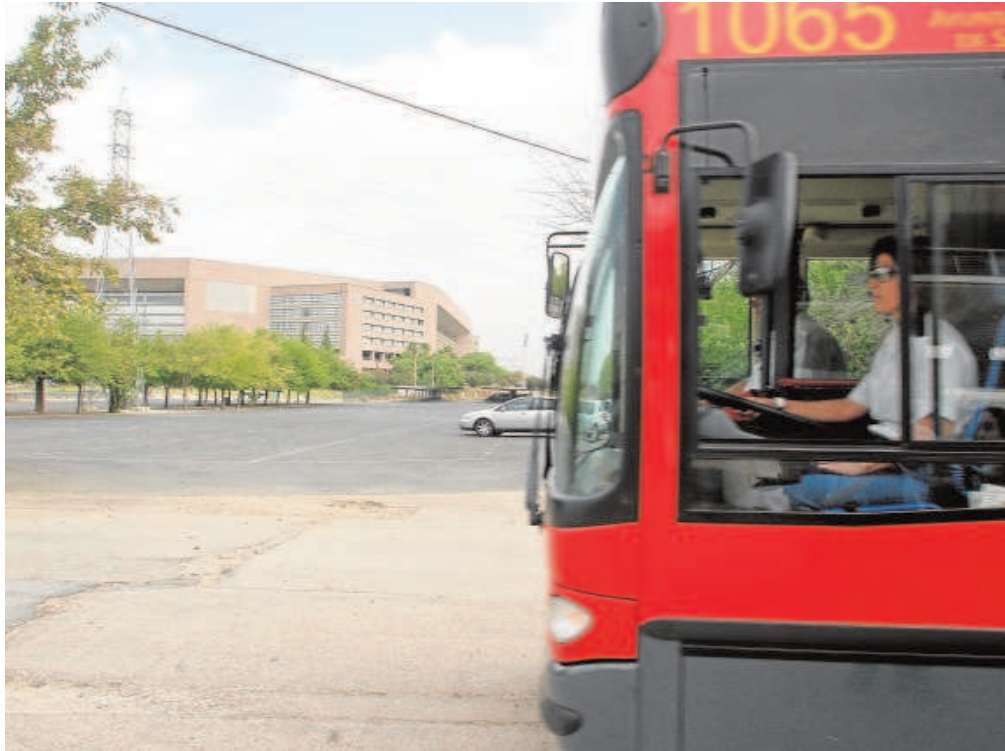
Un autobús especial de Tussam, en las inmediaciones del Estadio de la Cartuja