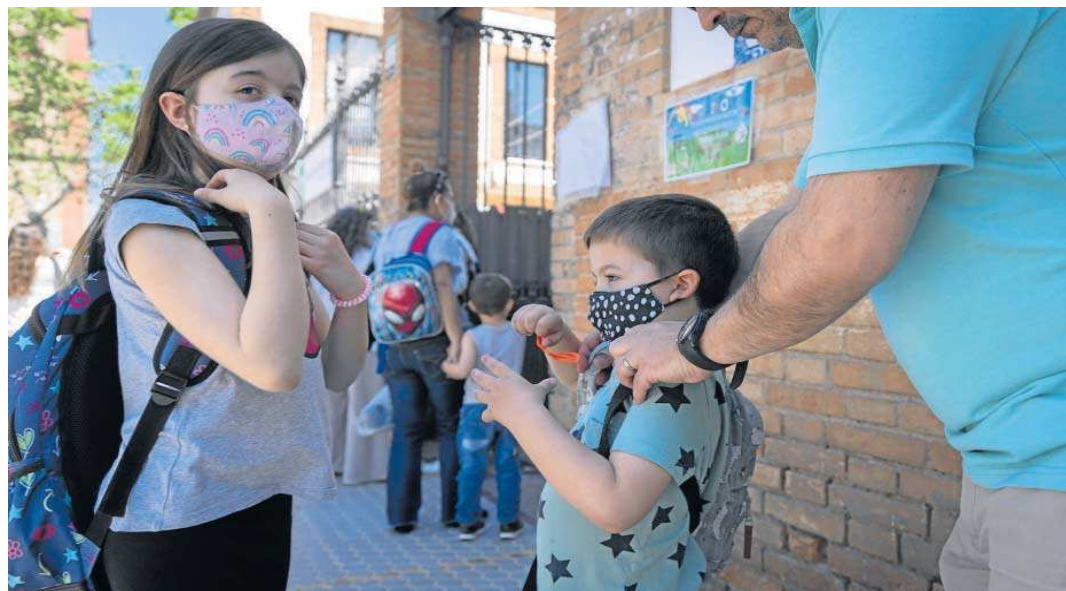
Dos menores, con mascarilla, a la puerta de un colegio en la capital. ANTONIO PIZARRO