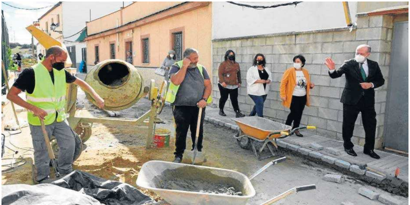
El presidente de la Diputación de Sevilla, Fernando Rodríguez Villalobos, visita una obra en la provincia.