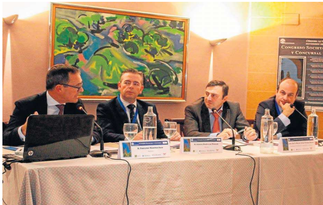
El magistrado Miguel Ángel Navarro Robles, segundo por la derecha, en una imagen publicada en redes sociales.