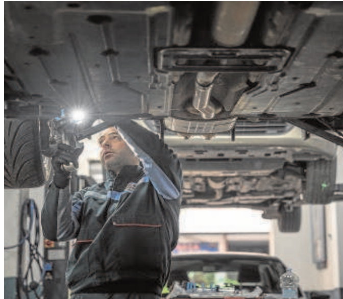
Un mecánico trabaja en un taller de automoción

En este contexto, los analistas estiman que el recorte de la previsión del Gobierno será cercano a los dos puntos. En principio, la revisión se incluirá en el programa de estabilidad que España debe remitir a Bruselas antes del 1 de mayo, un documento que re-