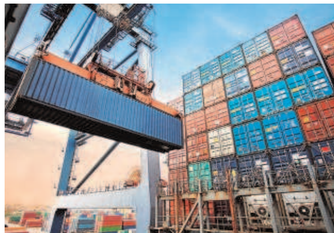
Contenedores de barcos para el transporte internacional en un puerto

Las importaciones realizadas por Andalucía también crecieron en los dos primeros meses del año, un 64%, hasta 6.493 millones, lo que arroja un déficit de la balanza comercial de la comunidad con el exterior de 182 millones en este periodo, con una tasa de cobertura del 97%, superior a la de España en 13 puntos (84%).