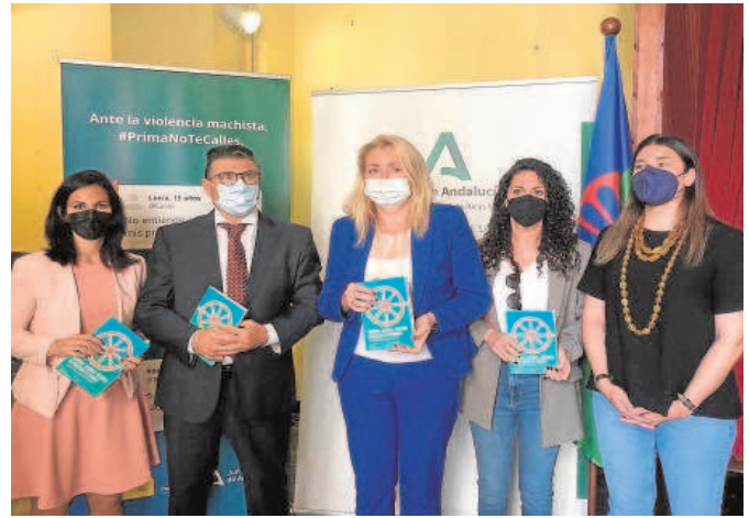
Presentación de la campaña, ayer en Sevilla