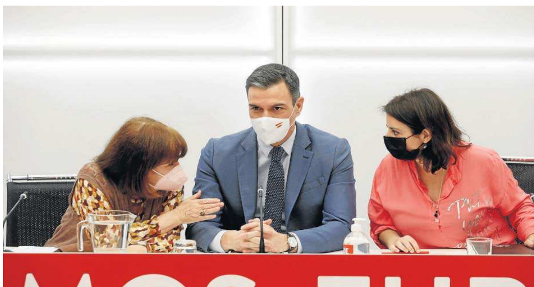
Pedro Sánchez, flanqueado por la presidenta del PSOE, Cristina Narbona, y la vicesecretaria general, Adriana Lastra.

Para Sánchez, que ayer lunes en una entrevista con Antena 3 puso fecha a las generales, diciembre de 2023, “queda claro” que sólo hay dos opciones, “o un Gobierno de coalición de la derecha con la ultraderecha, o un Gobierno de centro izquierda del partido socialista con lo que representa el espacio de Yolanda Díaz”. Sánchez enlazó así al PSOE con el futuro espacio de Yolanda Díaz, sin mencionar a Podemos, y aleja un pacto con el PP, a pesar de que su ministro de Presidencia, Félix Bolaños, ofreciese este domingo apoyar