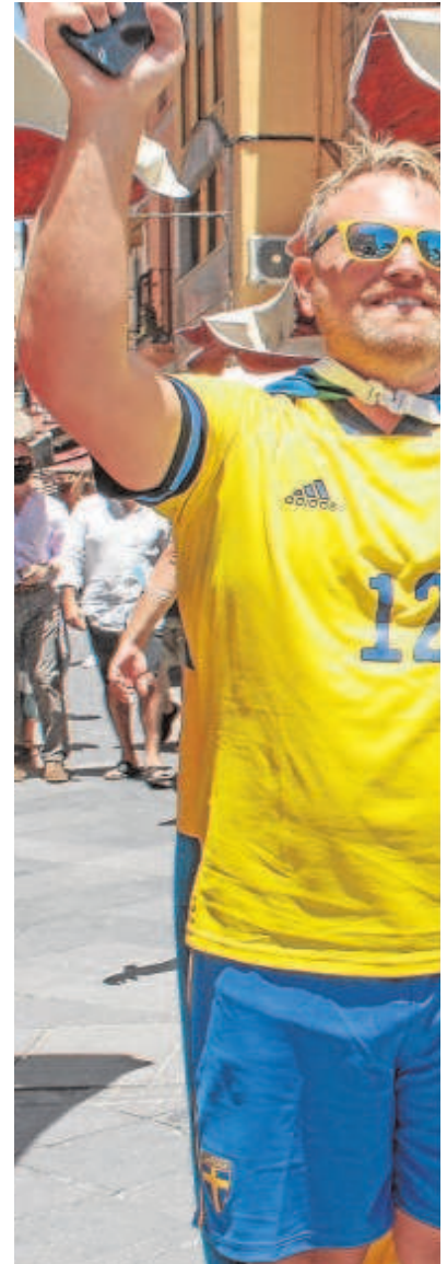
Aficionados suecos que viajaron a Sevilla la p

La pandemia multiplicó el número de eventos deportivos con la elección de Sevilla como sede para la pasada Eurocopa