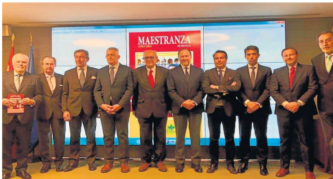
Los premiados y los asistentes al acto celebrado ayer en Sevilla.