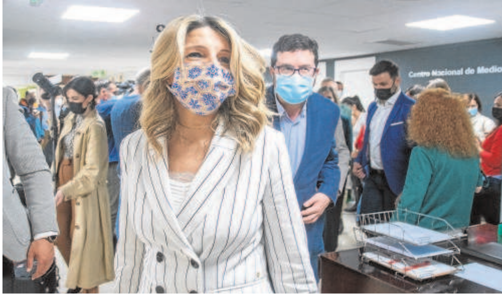
La vicepresidenta segunda y ministra de Trabajo, Yolanda Díaz, en una imagen de archivo