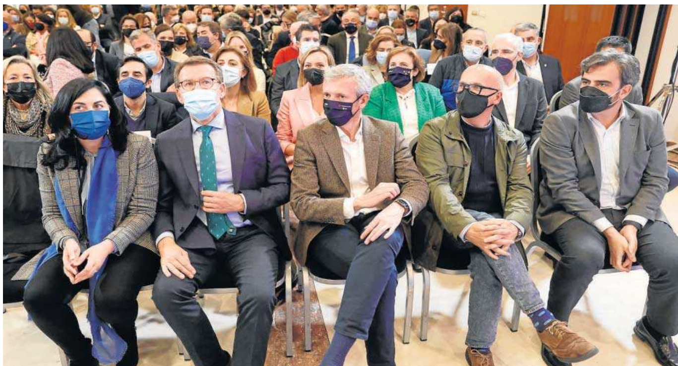
Alberto Núñez Feijóo, rodeado de los responsables provinciales del Partido Popular de Galicia.