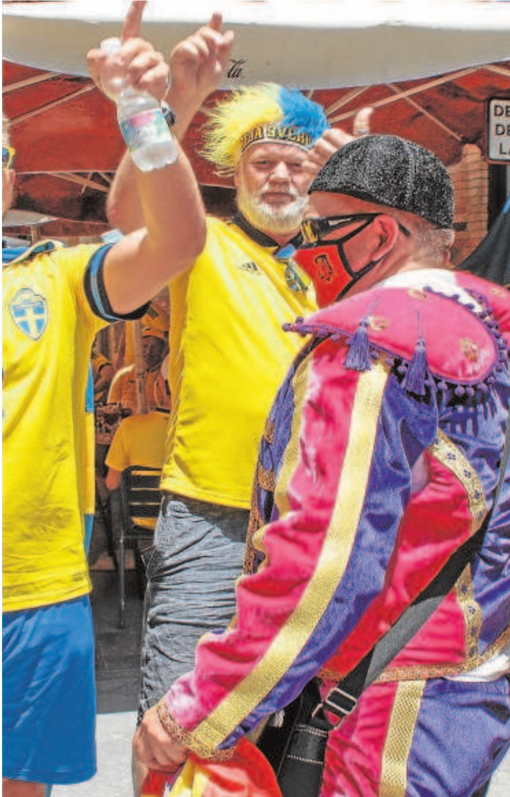
mavera de 2021 para los partidos de la Eurocopa

Distribuido para CONFEDERACIÓN N DE EMPRESARIOS DE SEVILLA * Este artículo no puede distribuirse sin el consentimiento expreso del dueño de los derechos de autor.