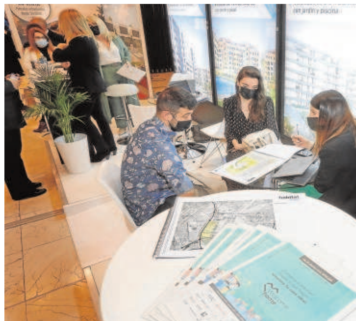
Una pareja de compradores en el salón inmobiliario de Sevilla

La tasa de esfuerzo para pagar la hipoteca ya supera en las grandes ciudades el 40% de los ingresos aconsejado por los expertos