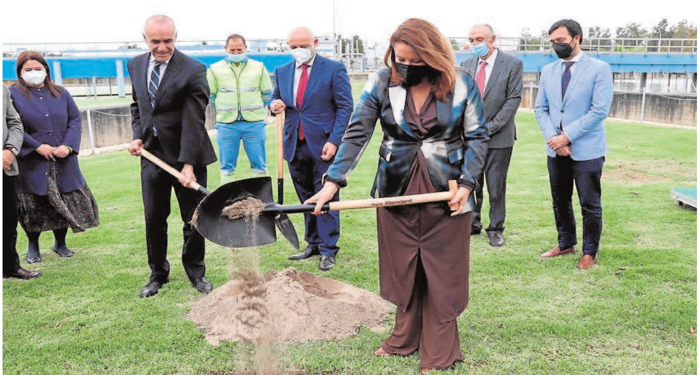
La consejera de Agricultura, con los alcalde de Sevilla y Dos Hermanas, ponen la primera piedra de la depuradora del Copero