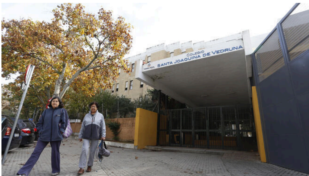
El Colegio de Santa Joaquina de Vedrúna contará con una nueva unidad concertada de Educación Especial