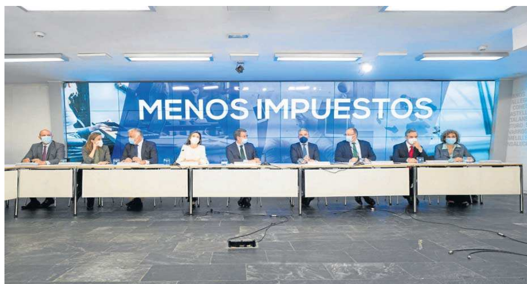
Reunión del Comité Ejecutivo Nacional del PP en la sede de la calle Génova en Madrid.

● El PP plantea en su plan económico rebajar el IRPF a ingresos menores de 40.000 euros en una cantidad equivalente a la inflación y subvencionar a los que están exentos de declarar