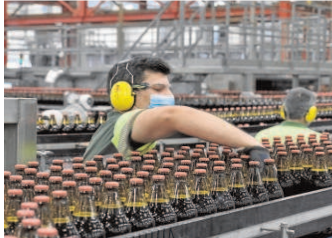
Fábrica de Heineken en la provincia de Sevilla