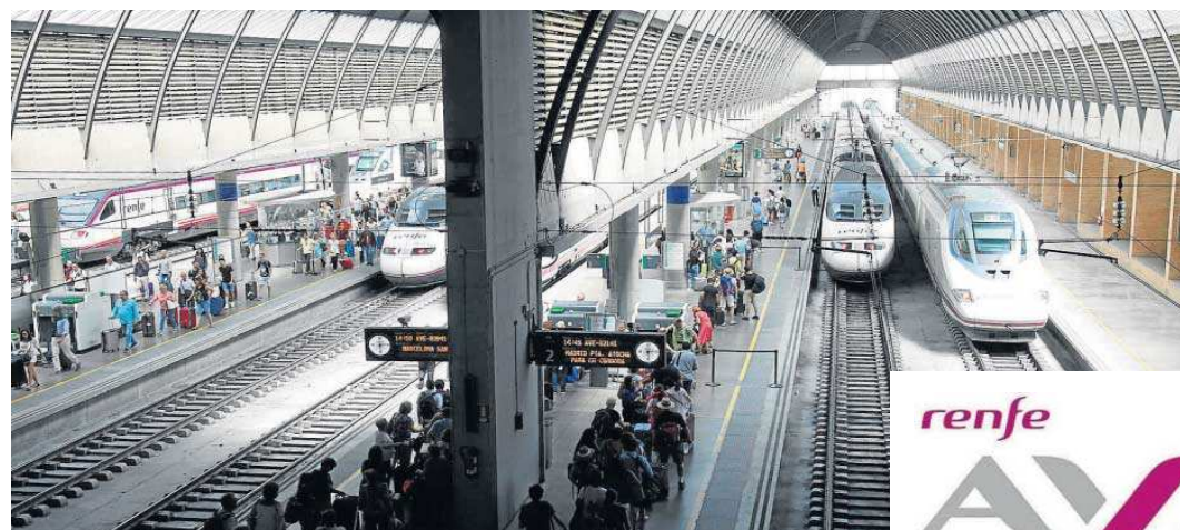
Trenes AVE en la estación de Santa Justa de Sevilla.