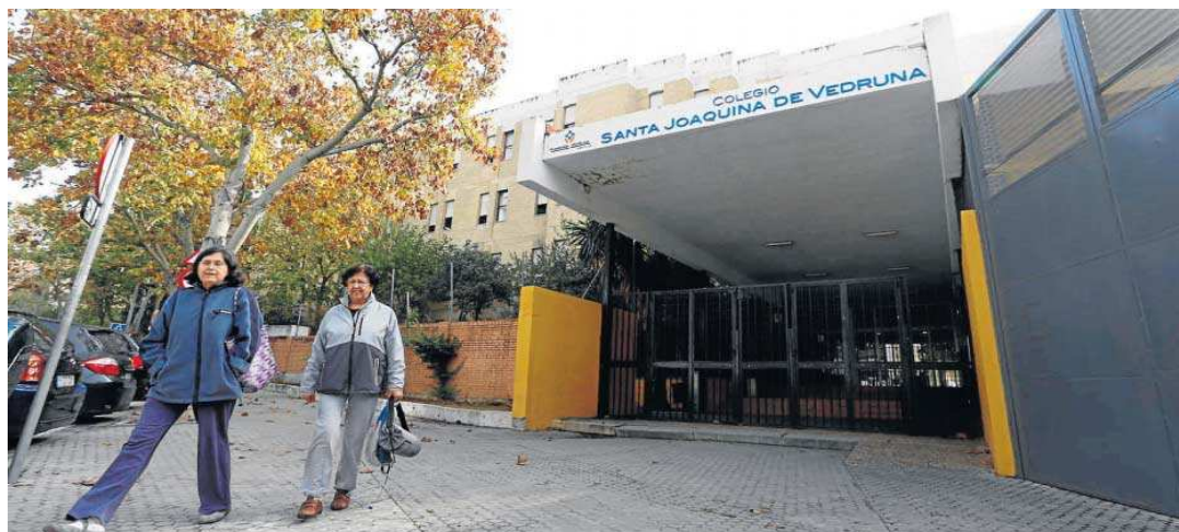
El Colegio de Santa Joaquina de Vedruna contará con una nueva unidad concertada de Educación Especial