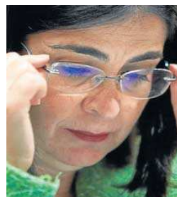
MIGUEL OSES / EFE

desprovistas de la mascarilla. “Las mascarillas ya no son obligatorias”, aseveró Darias, y subrayó que las excepciones a esa norma general afectan a los centros y establecimientos sanitarios (centros de salud, hospitales, unidades de transfusión o farmacias, entre otros) y a los medios de transporte por la elevada interacción social que se produce en ellos.