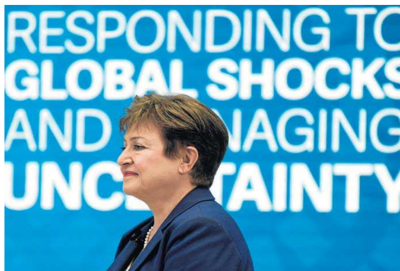
La directora gerente del Fondo Monetario Internacional (FMI), Kristalina Georgieva, el martes en Washington.

Esta reducción paulatina del déficit refleja, a juicio de los ana-