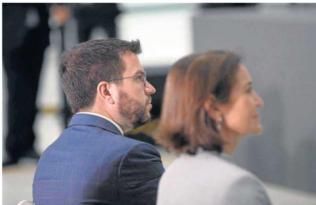
El presidente de la Generalitat, Pere Aragonès, en la apertura de la fábrica de cargadores Wallbox en Barcelona.

Por tanto, pone sobre la mesa la posibilidad de que ERC retire el apoyo que está dando a Sánchez en el Parlamento durante la legislatura, y eso podría llevar aparejada una decisión similar por parte de otras formaciones políticas hasta ahora aliadas.