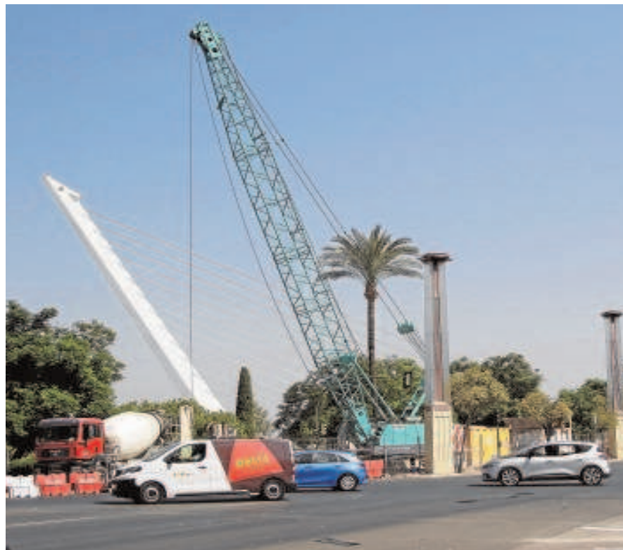
La obra de Jiménez-Becerril, del colector de San Jerónimo // JUAN FLORES

El 3 de febrero de 2021 se firmó un convenio de colaboración con la Confederación Hidrográfica del Guadalquivir para la ejecución de obras de colectores de saneamiento, por importe de 93,5 millones de euros (donde Emasesa aporta 37,4 millones de euros), el 11 de diciembre de 2020 se suscribió un convenio con el Ministerio de Ciencia e Innovación para la ejecución del Complejo Ambiental por importe de 18 millones de euros (donde Emasesa aporta 6,5 millones de euros), y también se firmó el 3 de septiembre de 2020 un Convenio de Colaboración con la Consejería de Agricultura, Ganadería, Pesca y Desarrollo Sostenible de la Junta de Andalucía para la ejecución de infraestructuras de saneamiento y depuración, cuyo importe estimado inicial es de 129 millones de euros (donde la aportación de Emasesa alcanza los 13,4 millones de euros).