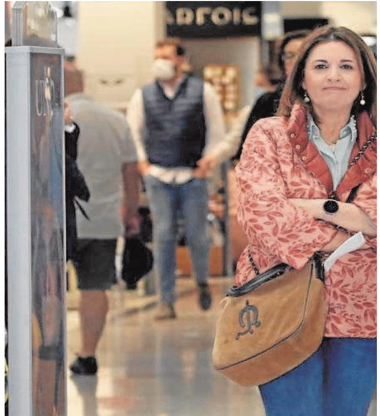
En los comercios y grandes superficies había de todo, mucho público con mascarillas y otros sin ellas, pero la mayoría de los trabajadores seguían manteniendo la protección

En los gimnasios había de todo. Muchos practicaban deporte sin mascarilla pero también algunos pocos la mantenían puesta. De momento, la prudencia fue ayer la tónica dominante en el primer día del gran paso a la normalidad tras más de dos años de pandemia.