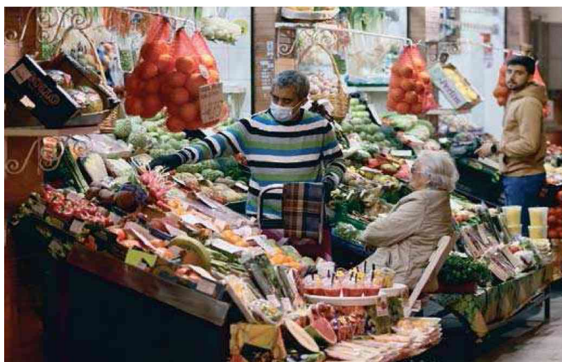
Mientras los trabajadores optan por seguir con la mascarilla, los usuarios se liberan de ella.

Con respecto a la feria, Inmaculada Salcedo, portavoz del grupo asesor del coronavirus en Andalucía, ha apuntado en los informativos de 7TV que realizarán una guía de recomendaciones en case-