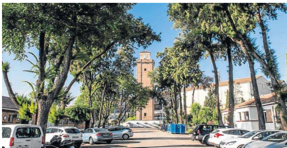
Vista de algunos de los edificios del Polígono de Astilleros del Puerto de Sevilla.

● La firma Atlántico 18 irá al centro de transformación que estaba pendiente de ocupación en la zona