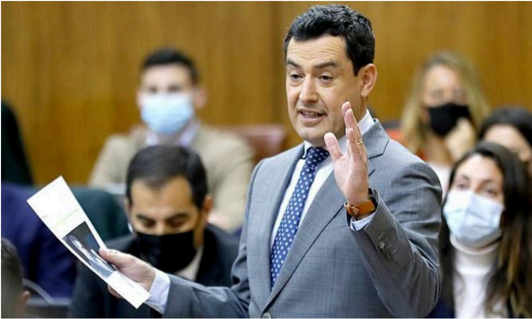
El presidente andaluz, Juanma Moreno.