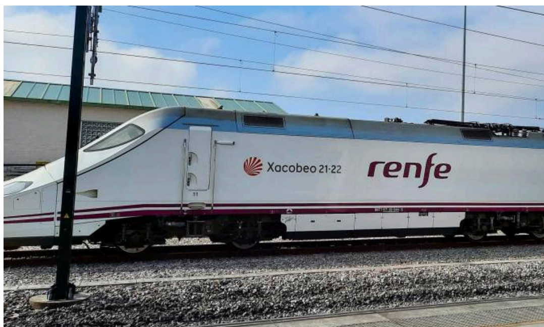
Un tren AVE.

"No duden que continuaremos inmediatamente con el proceso, pero evidentemente no tenemos todavía la concreción de cuándo podremos tener esa DIA , pero desde luego estamos más cerca que al principio y, sobre todo, mucho más cerca que en el 2018 cuando se tuvo que recuperar ese proyecto que había quedado en el cajón".