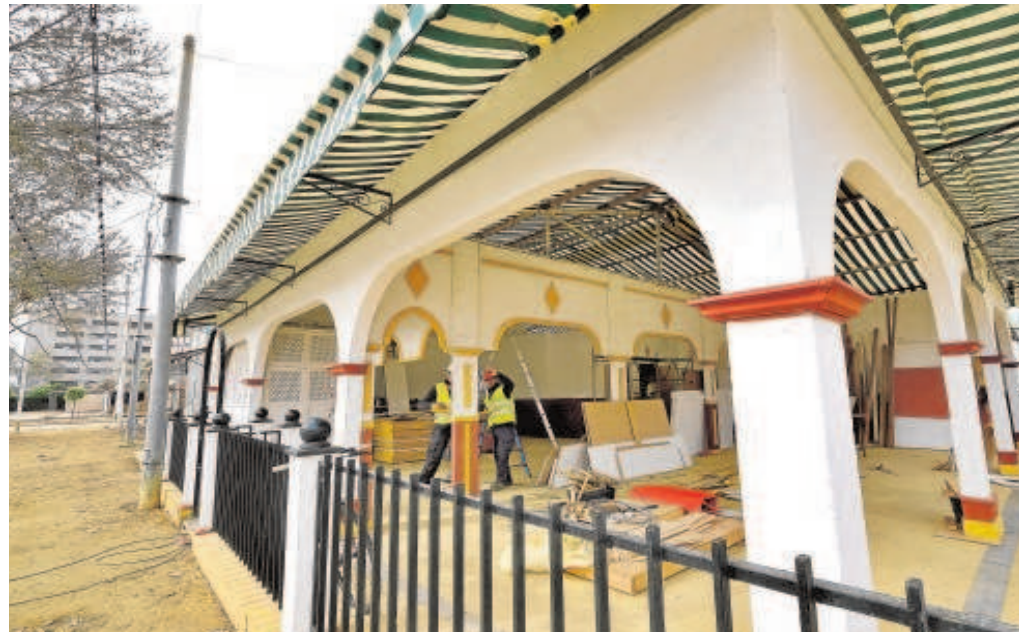
Preparativos de las casetas de la Feria de Abril