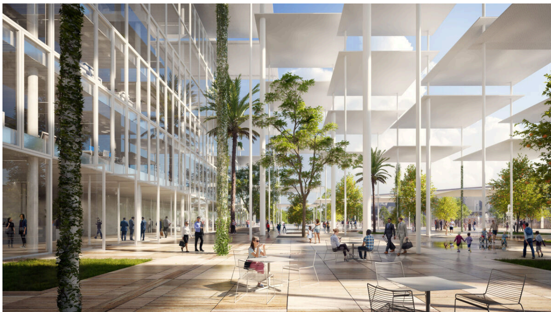
Detalle de la plaza con sombra, vegetación y luz que crea el edificio. / JRC

El Centro Europeo de Investigación ha presentado en el Caixaforum los detalles del futuro edificio, que busca ser referente en sostenibilidad e innovación.