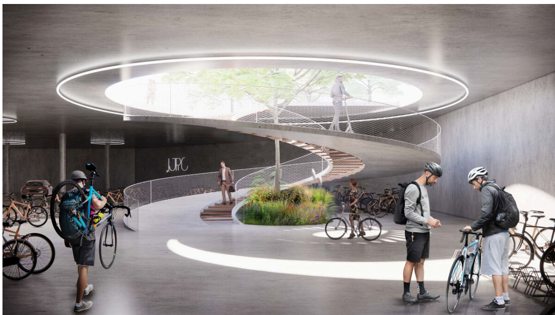
Aparcamiento para bicis.