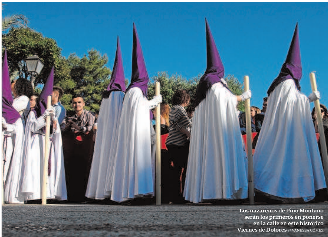
Los nazarenos de Pino Montano serán los primeros en ponerse en la calle en este histórico Viernes de Dolores // VANESSA GÓMEZ