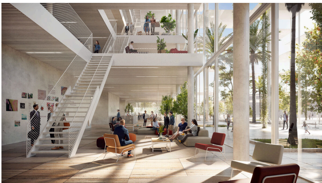
Zona para descansar o tomar algo.

En su interior, contará con un centro de conferencias y espacios sociales en la planta baja, mientras que las oficinas y las unidades de investigación ocupan las plantas superiores. Los lugares de trabajo colaborativos dan a la plaza, mientras los espacios de trabajo individuales al jardín. La configuración propuesta está diseñada para ser totalmente flexible y adaptable en función de las necesidades futuras y, además, promueve la colaboración y la creación conjunta.