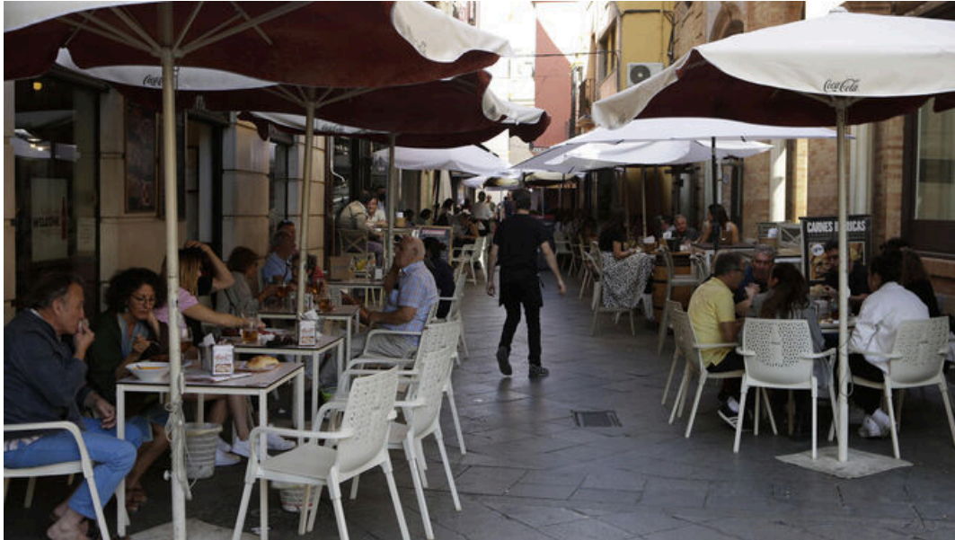
Veladores de restaurantes en Sevilla.

La Semana Santa es el momento para disfrutar de las procesiones en las calles, de los viajes para quienes opten por salir de su ciudad, de los amigos y la familia y de acompañar todo eso con una buena comida . En este sentido, cabe destacar que la gastronomía ocupa un lugar primordial en nuestros planes, según datos de TheFork, la app líder de reservas, que proporciona el dato de Sevilla , que ha experimentado un aumento notable de las reservas online en restaurantes para esta Semana Santa con un crecimiento de más del 156% frente a 2021 y más del 73% frente a 2019 .