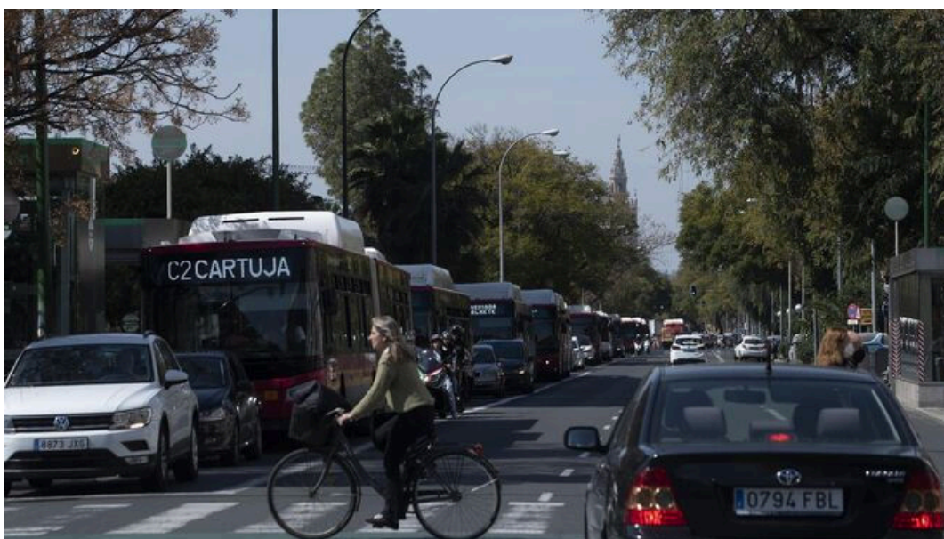
Acumulación de autobuses en Eduardo Dato por el corte de San Francisco Javier para las obras del tranvía.

El Ayuntamiento de Sevilla va a implantar un millar de aparcamientos regulados en zona azul en el entorno de la avenida de San Francisco Javier y la calle Luis de Morales , tal y como quedó aprobado con el voto a favor de todas las entidades sociales, vecinales, AMPAS, clubes deportivos y los grupos políticos municipales, salvo la abstención de VOX, en una reciente Junta Municipal del Distrito Nervión, tras una petición vecinal en este sentido.