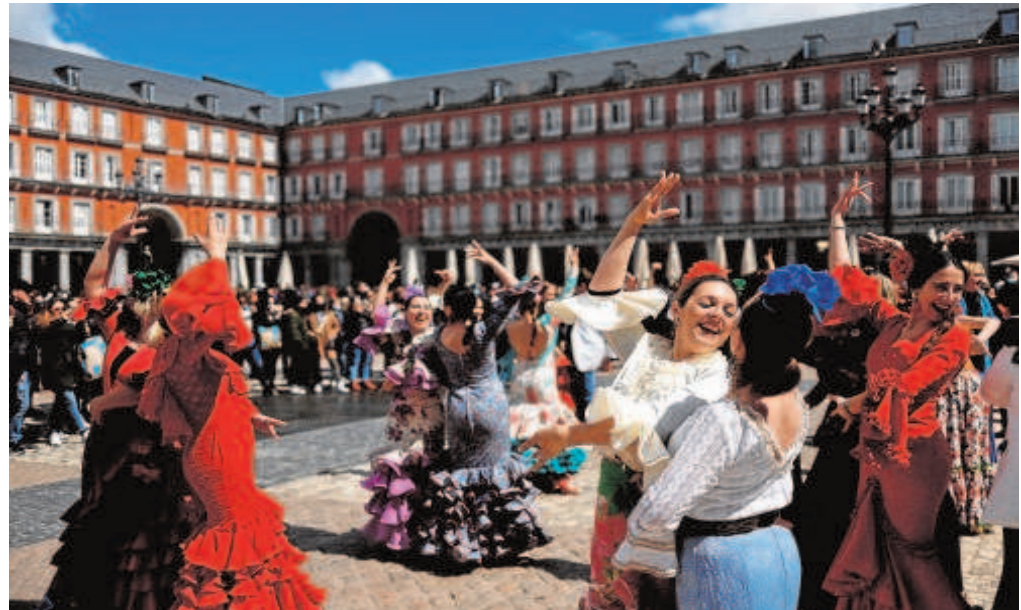
El turismo espera recuperarse al completo en 2023

Pero a pesar del alza, todo apunta a que el año 2022 acercará al sector a la plena recuperación. En suma, Exceltur calcula que el PIB turístico para el conjunto de 2022 podría alcanzar los 141.681 millones de euros. Es decir, un 91,6% de los niveles prepandemia de 2019. «Ello supondría una revisión al alza de seis mil millones respecto a nuestra propia previsión de enero, si