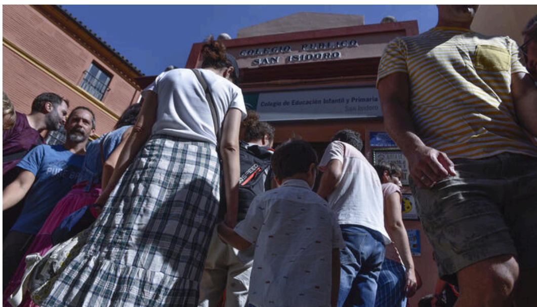
El colegio público San Isidoro, en la céntrica calle Mateos Gago.

Los efectos de la proliferación de los pisos turísticos y hoteles en el centro de Sevilla capital empiezan a dejarse notar en los colegios . El periodo de solicitud de plazas en los centros públicos y concertados se ha saldado con 154 vacantes , una cifra que no se recuerda desde hace décadas. Aunque la bajada de la natalidad también influye, directores y padres de alumnos consideran que el principal motivo de la caída de la demanda obedece a la marcha de los residentes a otras zonas de la ciudad e, incluso, al área metropolitana, ante el encarecimiento de los alquileres y el cambio de uso de los inmuebles para alojar a visitantes.