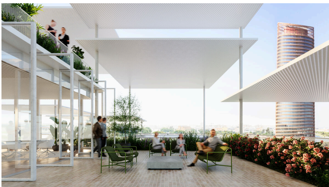
Terraza del edificio. / JRC