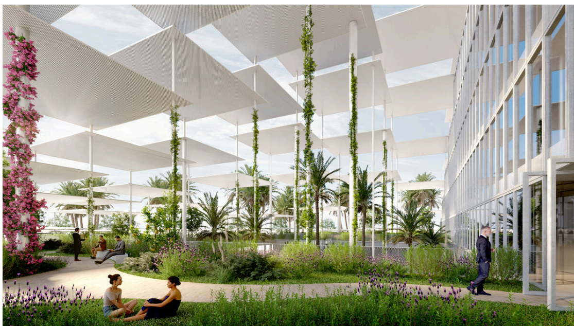
Jardín dentro del edificio.

y el precio insostenible de la energía, evidencia que tenemos que acelerar el Pacto Verde Europeo. Asimismo, ha señalado que este es nuestro primer edificio inspirado por completo en los principios de la Nueva Bauhaus Europea. Y muestra por primera vez, la imagen y el sentimiento del Pacto Verde Europeo.