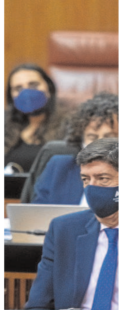
El presidente andaluz, Juanma Moreno, ayer

De esta forma, el próximo 22 de abril está previsto que los sindicatos se sienten con la Consejería de Salud en un grupo de trabajo sobre el «modelo y procedimientos del desarrollo profesional». Sin embargo, avisaron ayer, ambos sindicatos serán «exigentes» con el resultado de las negociaciones y recuerdan que su aspiración es que se aplique el acuerdo del 29 de julio de 2021 que «desarrolla la carrera profesional para quien no tiene acceso a ella, se facilita el acceso al personal temporal y se promocio-na al personal auxiliar administrativo. Además, este Acuerdo se compromete