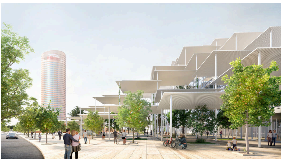
Vista exterior del edificio y del paseo para los sevillanos.

El proyecto, previsto en la parcela del desaparecido pabellón de los Descubrimientos de la Isla de la Cartuja de Sevilla, afianzará el objetivo de la ciudad de Sevilla para descarbonizar la Cartuja y convertirse en referente mundial para la sostenibilidad . El estudio ganador propone cubrir todo el recinto con una cúpula de porches solares que proporcione sombra a una plaza, un jardín y también al edificio, que se ubicará en diagonal. Estos tejados son hojas fotovoltaicas ligeras cuadradas apoyadas sobre columnas, que van cogiendo altura para crear, además, un espacio público y acogedor al aire libre.