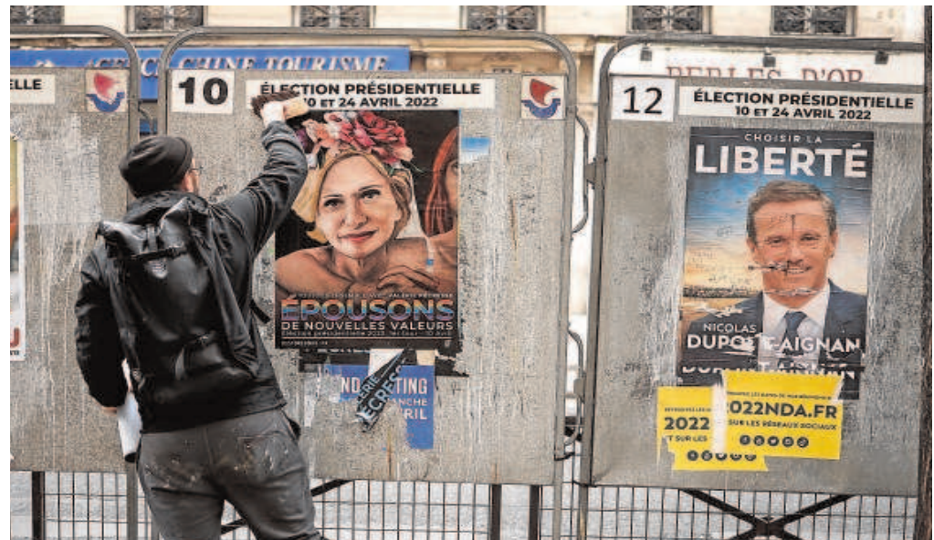
El artista callejero Jaeraymie pega un cartel electoral en París con la caricatura de Valérie Péresse

No sin cierta temeridad, Péresse decidió afrontar el desafío, en tanto que presidenta en funciones de la región Isla de Francia, la más rica, poderosa e influyente, donde ha dejado una herencia de sólida competencia. Acompañada de modestas eminencias –el excomisario europeo Michel Barnier o Éric Ciotti, próximo a Zemmour–, Péresse se enfrenta a unas elecciones difíciles. Ese equipo ha contribuido a acelerar el eclipse final y la catástrofe anunciada de la candidata conservadora.