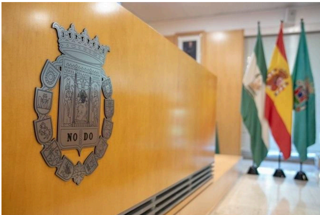
Imagen de recurso de la Diputación. DIPUTACIÓN

La Diputación de Sevilla, a través de su Área de Servicios Públicos Supramunicipales, va a colaborar financieramente con 23 municipios de la provincia menores de 5.000 habitantes tanto en la elaboración de sus planes de adaptación al cambio climático como en la realización de las actividades de educación ambiental en su ámbito competencial.