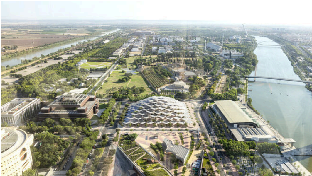
La parcela del pabellón de los Descubrimientos acogerá un edificio con cúpula de porches solares que proporcione sombra a una plaza, a un jardín y al edificio.

Parte exterior de la futura sede del Centro de Investigación de la Comisión Europea en Sevilla.