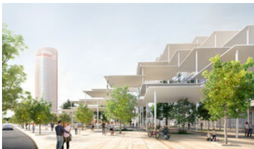
Parte exterior de la futura sede del Centro de Investigación de la Comisión Europea en Sevilla.

Parte exterior de la futura sede del Centro de Investigación de la Comisión Europea en Sevilla.