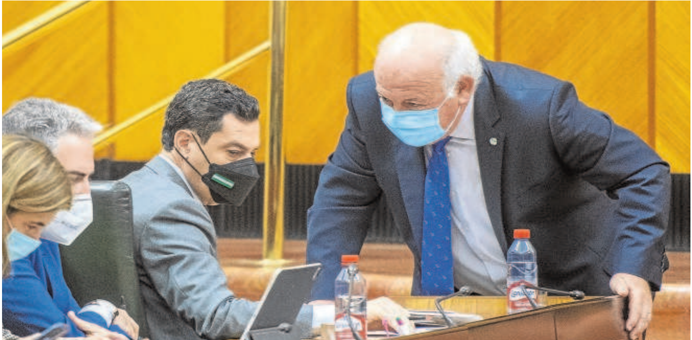
Aguirre se acerca al presidente Juanma Moreno durante el pleno que se celebró ayer en el Parlamento

La convocatoria electoral sobrevuela en el Parlamento. El PSOE advierte al Gobierno de los riesgos de una «convocatoria frívola» porque «lo puede pagar en las urnas»