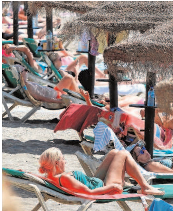
Turistas al sol en una playa de la Costa del Sol

«La gastronomía tira del turismo y con estas instalaciones se va a dotar de mayor cualificación a los alumnos y alumnas que se vayan incorpo-