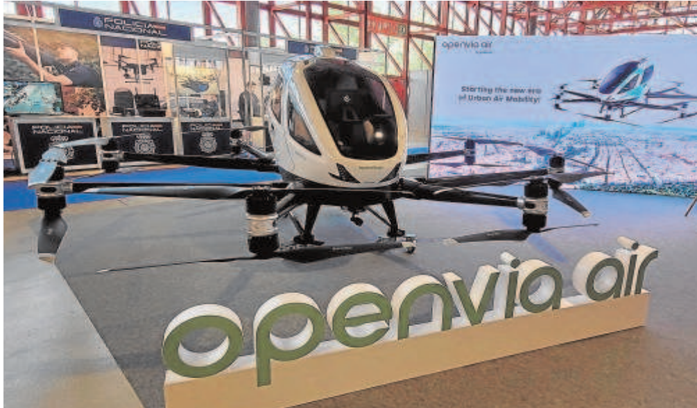
Dron de pasajeros de Openvia Air, la línea de negocio de movilidad aérea urbana