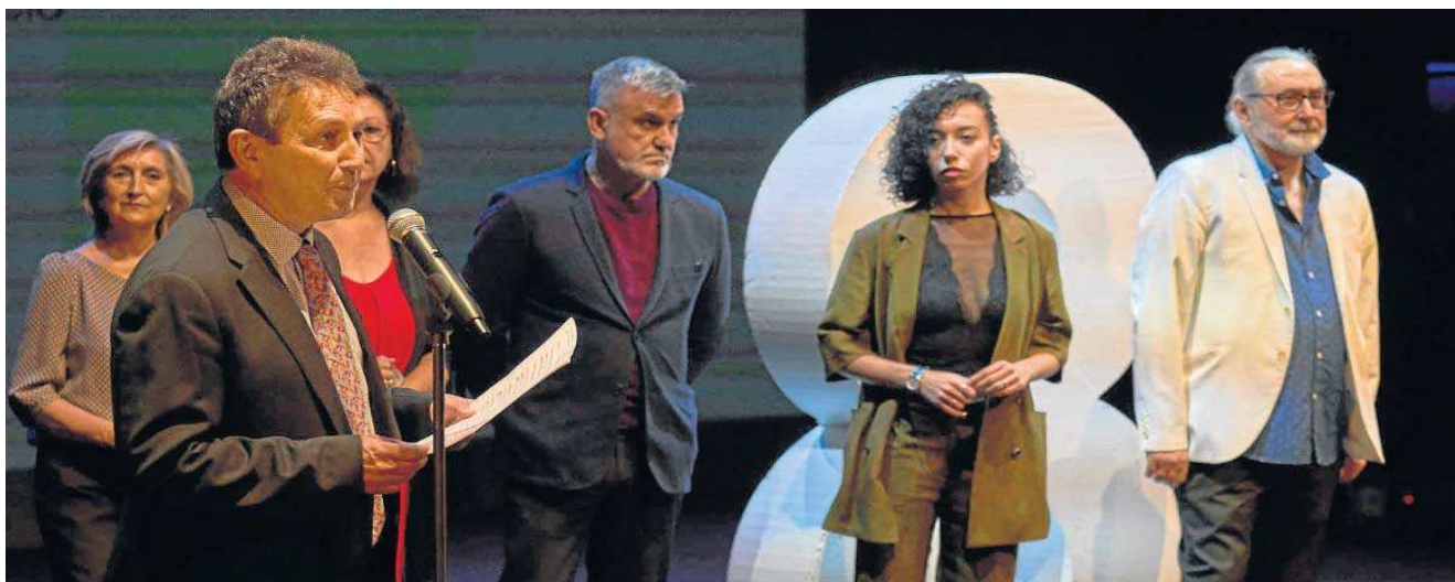
El dramaturgo Alfonso Zurro, presidente de la Academia de las Artes Escénicas de Andalucía, ayer en la gala de los Premios Lorca.

Distribuido para CONFEDERACIÓN N DE EMPRESARIOS DE SEVILLA * Este artículo no puede distribuirse sin el consentimiento expreso del dueño de los derechos de autor.