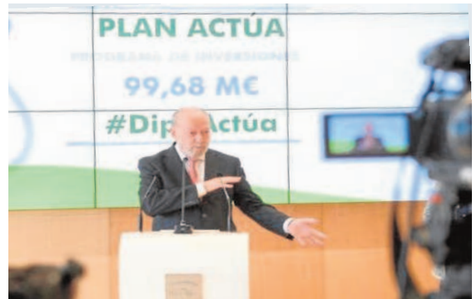
Fernando Rodríguez Villalobos, presidente de la Diputación de Sevilla

Destacan igualmente en el plan nueve millones de euros destinados a una línea de ayudas de emergencia a personas desfavorecidas. Otros seis millones de euros dedicados a la finalización de espacios deportivos y culturales promovidos por los ayuntamientos, una línea de actuación que figuraba en el anterior plan Con-