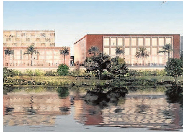
La recreación del proyecto de KKH para Altadis

Para que esto suceda, antes es necesario que se intervenga en todo el espacio clausurado. Así, entre este año 2022,