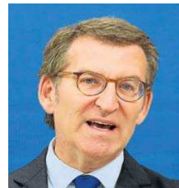
Alberto Núñez Feijóo Presidente del PP

Estamos asistiendo a una autoinmolación del Gobierno que daña seriamente a España"