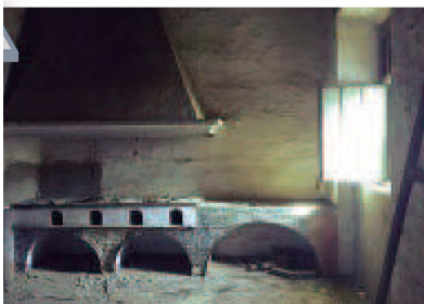
Arriba, la sala De Profundis, que será una zona expositiva. Debajo, una de las estancias de las casas de vida particular, que se restaurarán