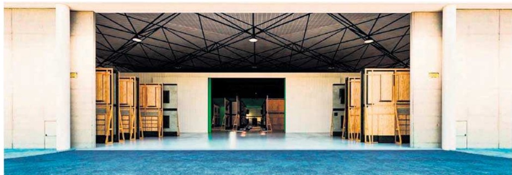
Recreación del exterior de la puerta de elefante del pabellón 1 del Palacio de Congresos y Exposiciones.

Ése es el nombre de un plan del Gobierno de España para impulsar al sector audiovisual. Es uno de los ejes de la agenda España Digital 2025 y tiene como objetivo fomentar la producción audiovisual nacional, desde el cine a series, cortos, publicidad, videojuegos o animación; atraer inversión y actividad económica; reforzar a las empresas del sector mejorando su competitividad a través de la digitalización y apoyar el talento. Y Sevilla, donde radica una importante industria audiovisual, aspira a ser referente y a formar parte de dicho hub, que se financiará con dinero de la Unión Europea, principalmente, el Fondo Euro-