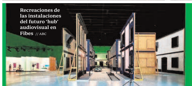
Recreaciones de las instalaciones del futuro 'hub' audiovisual en Fibes