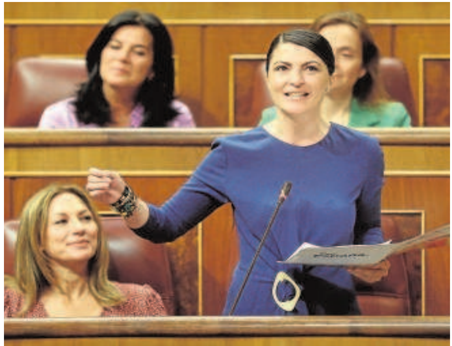
La candidata a la Junta por Vox, Macarena Olona

La candidata de Vox seguirá interviniendo en el Congreso de los Diputados hasta el próximo día 3 y ayer inició allí sus mensajes electorales. Hasta ahora, Olona no había hecho ningún anuncio sobre cuáles son sus planes de gestión para Andalucía pero