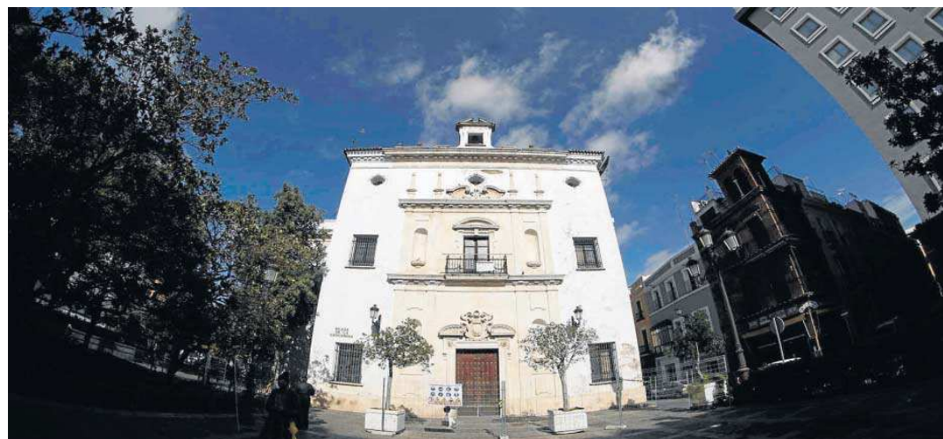
Fachada principal de la antigua iglesia de San Hermenegildo.