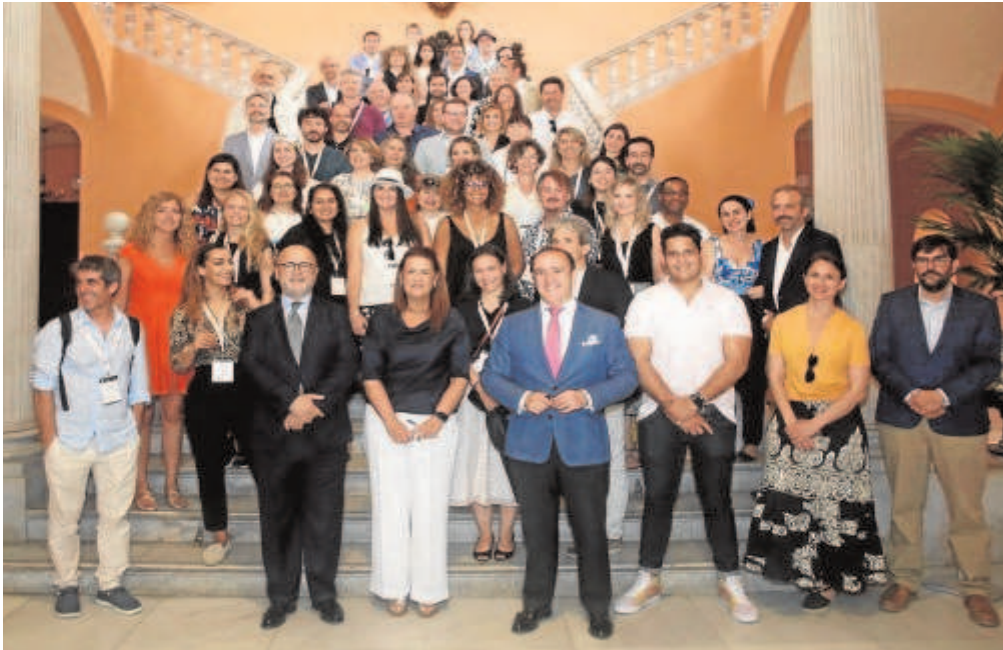
Los representantes de las productoras norteamericanas, ayer en el Ayuntamiento de Sevilla