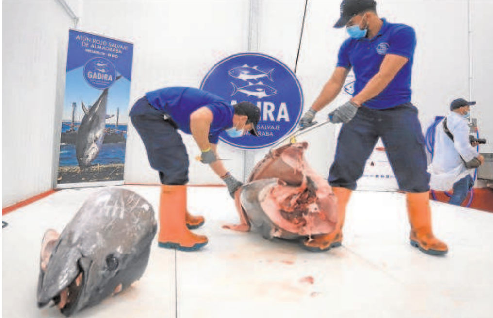
Imagen del ronqueo de un ejemplar de atún rojo salvaje el día de la inauguración

La marca que comercializa tres de las cuatro almadrabas de Cádiz, Gadira , inaugura sus nuevos almacenes de ultracongelados en la antigua fábrica de El Rey de Oros