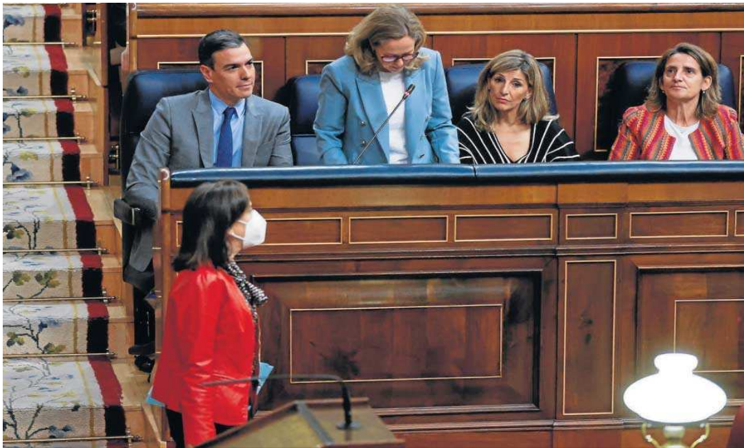
Pedro Sánchez, junto a las vicepresidentas Nadia Calviño, Yolanda Díaz y Teresa Ribera, tras la intervención ayer de la ministra de Defensa, Margarita Robles.