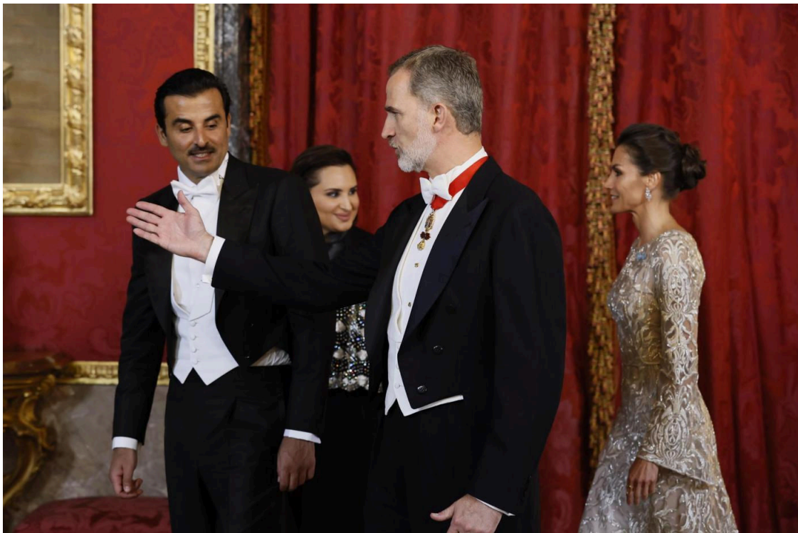
Los reyes de España saludan al emir de Qatar y su esposa.