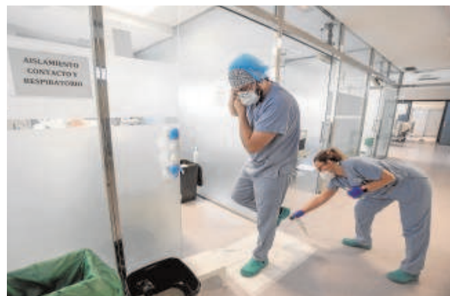
Esta semana han aumentado los hospitalizados por Covid

Y todo ello, tras notificar ayer la Consejería de Salud y Familias 2.030 nuevos contagios entre los mayores de 60 años, 1.408 curados y once muertes desde el pasado viernes. En cuanto a la presión en los hospitales, desde el último informe emitido el viernes pasado, se ha registrado un aumento de los hospitalizados en la provincia de Sevilla. En la actualidad son 257 las personas que se encuentran ingresadas en planta, lo que supone 46 más. En cuanto a los ingresos en UCI hay que destacar que ahora son 15 los sevillanos hospitalizados con un cuadro clínico más grave, lo que significa la misma cifra que el viernes. Sólo en los cuatro últimos días han necesitado ser ingresadas 64 personas, de las que dos lo han hecho en la Cuidados Intensivos.