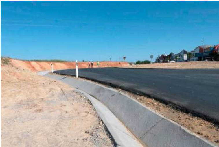
Obras de ensanche de la carretera de acceso a Pilas desde la A-49.