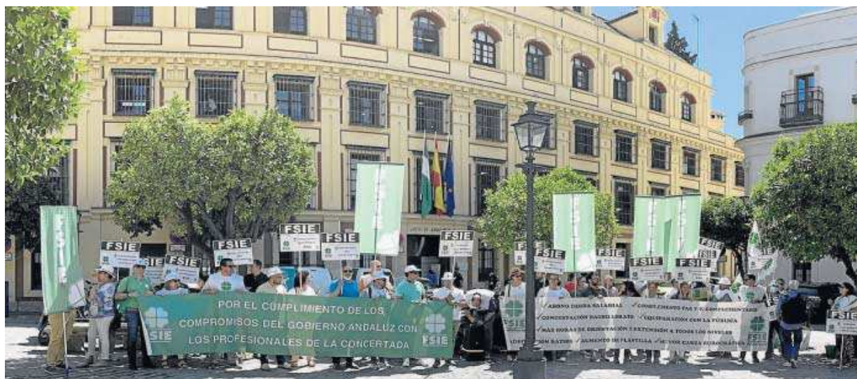
Protesta de los trabajadores de los colegios concertados de Sevilla ante la Delegación del Gobierno de la Junta. D. S.