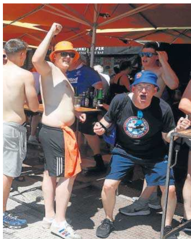
Aficionados del Rangers, ayer, y del Celtic, en 2003.

De los verdiblanco a los azules. De los católicos a los protes-