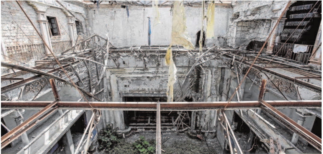
Estado en el que se encuentra el espacio escénico del antiguo cine Trajano donde se construirá un teatro