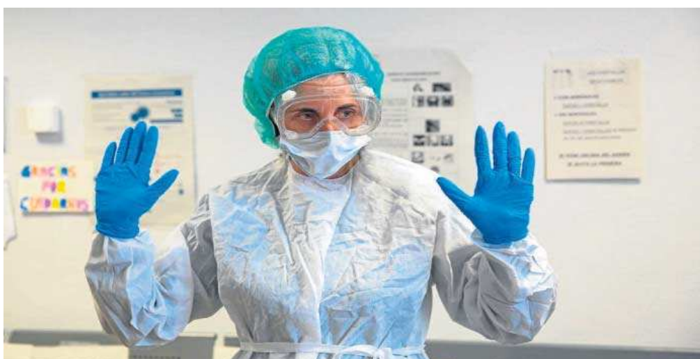
Las bajas de los sanitarios afectan a determinados departamentos, sobre todo a cirugía y consultas programadas.

● El último informe de Salud recoge que 593 profesionales estaban en aislamiento por contagio el día 5, 386 más que siete días antes