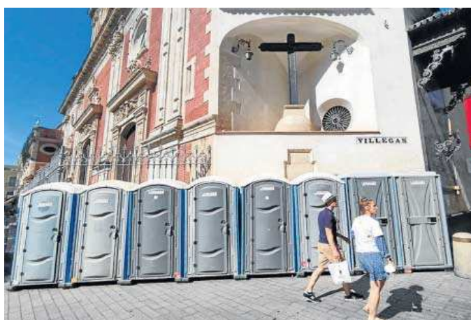
Los urinarios instalados junto a la iglesia del Salvador.

Entre esta instalaciones, las que más han llamado la atención son las que se encuentran delante de la fachada de la iglesia del Salvador, un edificio declarado Bien de Interés