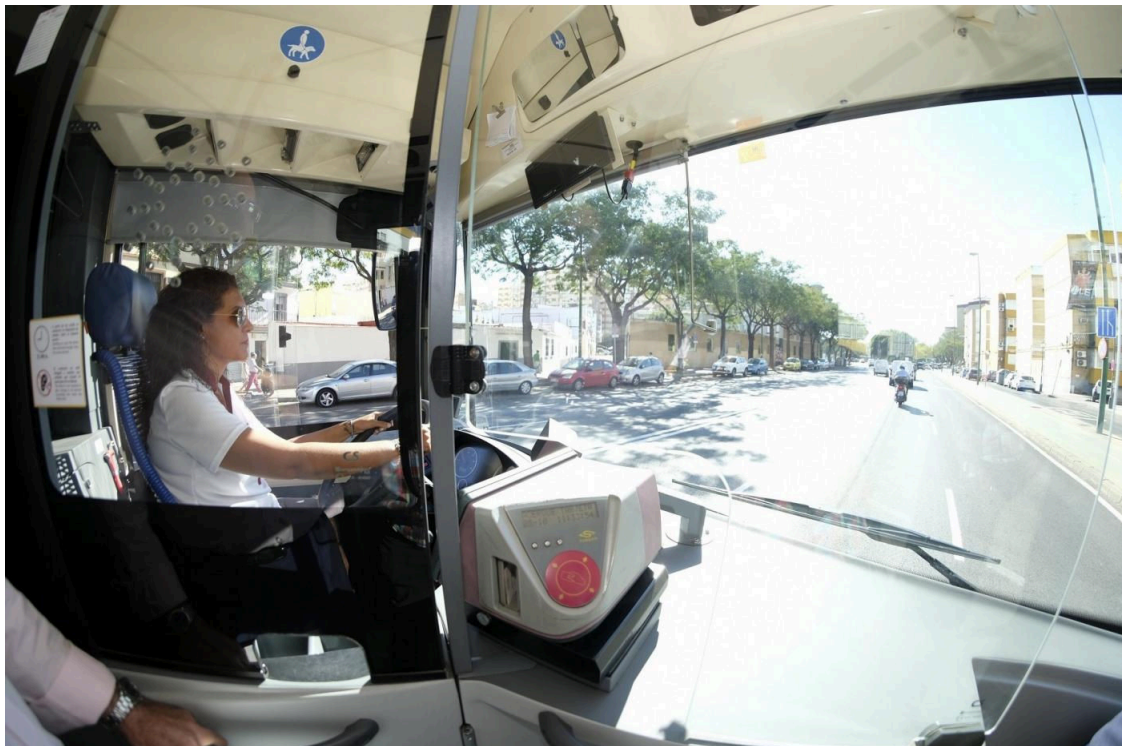
Un autobús de Tussam.

Ante la final de la UEFA Europa League que acogerá este miércoles el estadio Ramón Sánchez Pizjuán entre el equipo alemán Eintracht de Frankfurt y el británico Glasgow Rangers, la Agrupación Sindical de Conductores (ASC), el sindicato mayoritario en la sociedad Transportes Urbanos de Sevilla (Tussam), perteneciente al Ayuntamiento hispalense, ha solicitado a la dirección de la entidad que la línea especial del aeropuerto cuente con un servicio "en proporción" al incremento de vuelos previsto a cuenta de este evento.