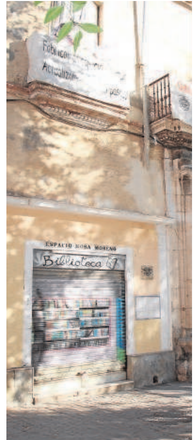
Fachada principal del Palacio del Pumarejo.

Otro caso paradigmático es el de las obras de adecuación interior del Pabellón Real para convertirlo en museo de Aníbal González y el Regionalismo. Este proyecto se remitió a Patrimonio por parte de la Gerencia el 13 de octubre del año pasado, según la documentación a la que ha tenido acceso este periódico. Desde entonces, esta iniciativa, que con-