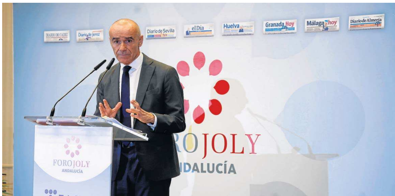
El alcalde de Sevilla, Antonio Muñoz, durante su intervención en el Foro Joly.