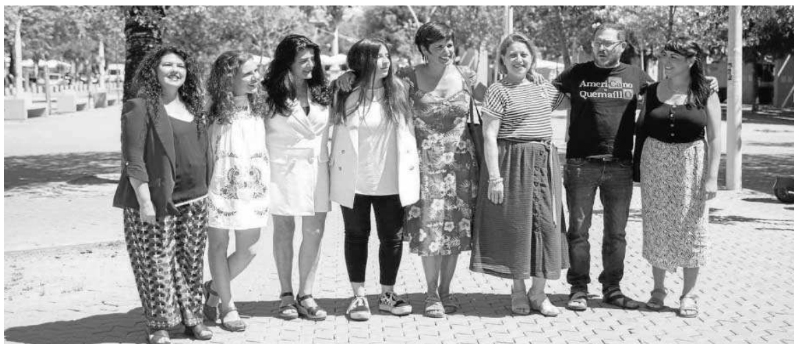
Presentación de los cabezas de lista de Adelante Andalucía para las elecciones del 19-J, ayer en Sevilla.