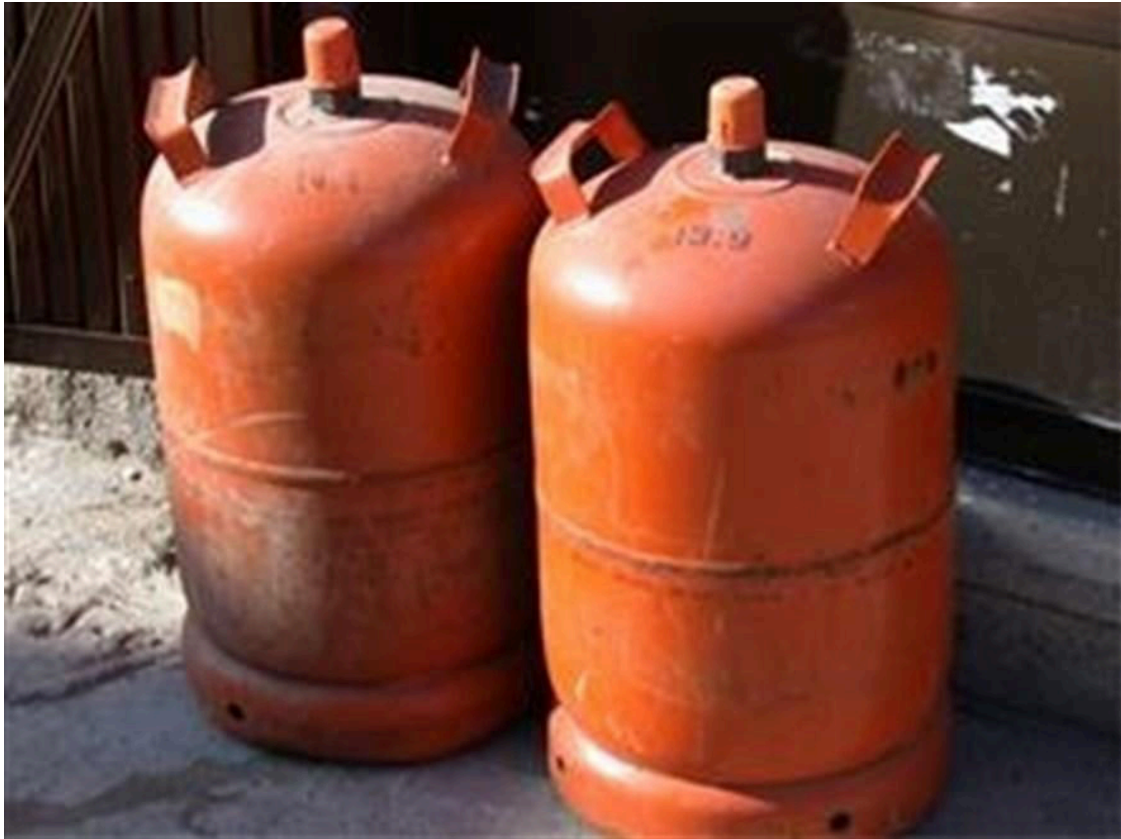
Bombonas de butano.

El precio máximo de la bombona de butano de 12,5 kilogramos se incrementará un 4,94% a partir de este martes, 17 de mayo, hasta situarse en 19,55 euros, según una resolución publicada ayer en el Boletín Oficial del Estado (BOE).