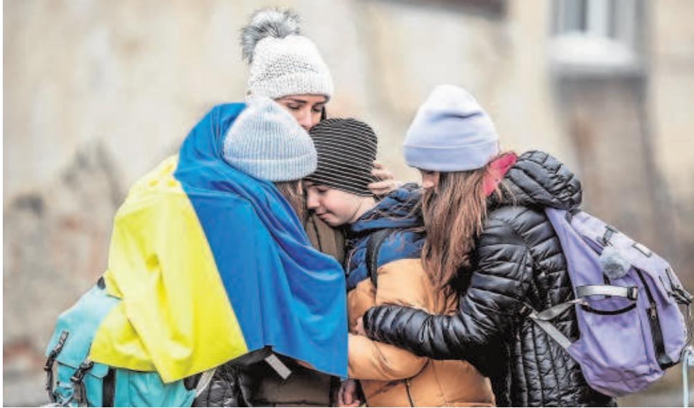
Un grupo de menores ucranianos se abraza a su madre con la bandera de su país