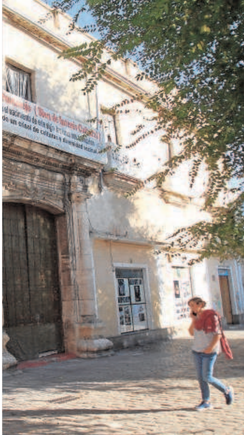
a Macarena, que espera su reforma