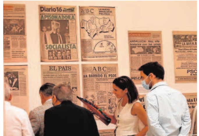
Numeroso público se acercó ayer a la Casa de la Provincia // MANUEL GÓMEZ

«Siendo como es el mes de las flores y el de las libertades, porque no olvidemos aquel París del 68, este mayo viene especialmente asociado a la libertad y al poder de decisión. El día 23 de mayo es especialmente significativo en este 2022», comenzó su discurso el presidente Villalobos. «De un lado, como sabéis, ese día siempre celebramos el desarrollo y avance propio que experimentamos como proyecto colectivo de provincia. Y a eso,