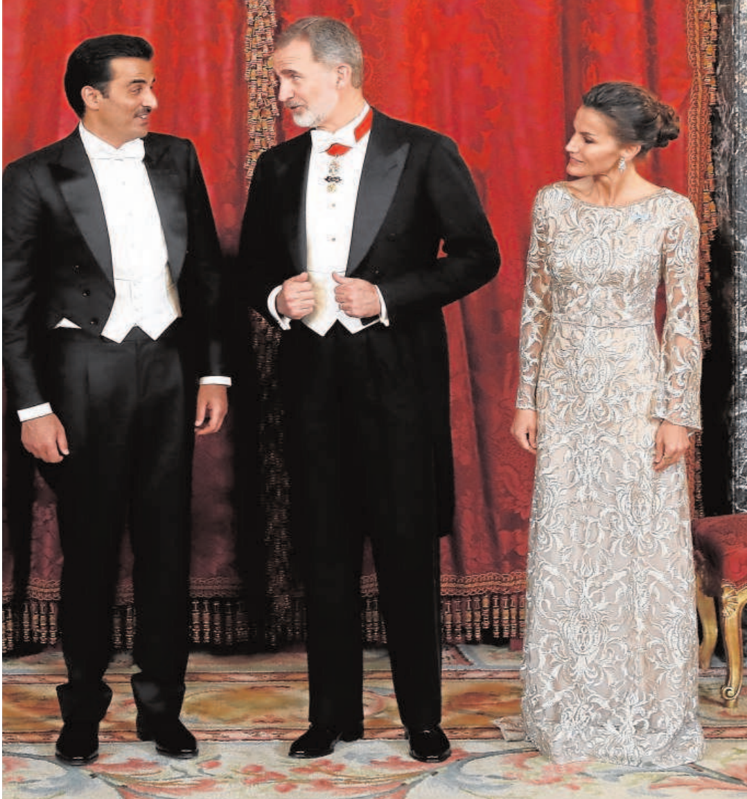
Don Felipe y Doña Letizia, con el emir de Catar y su mujer

El emir de Catar destaca la cooperación con España en materia de enseñanza, salud, inversiones, energía y economía