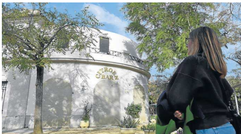
Una mujer pasa junto al pabellón Citroen, que reabrirá de nuevo como bar.

El proceso hasta la licitación ha sido largo. El Tribunal Supremo acordó el pasado 22 de octubre de 2020 inadmitir el recurso planteado por la persona que tenía la concesión demanial del