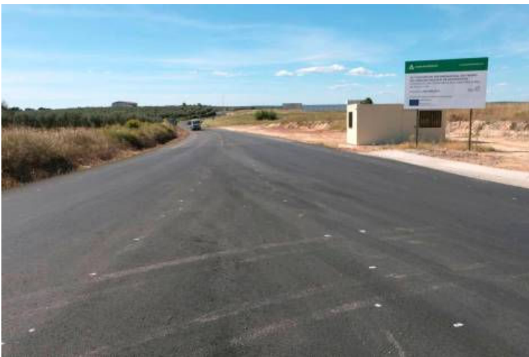
Detalle del asfaltado de la carretera.