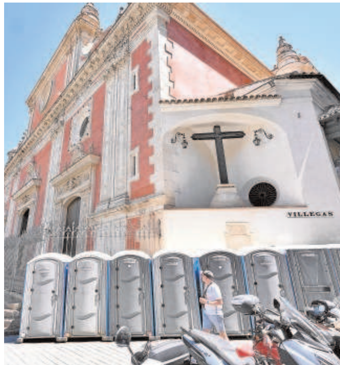
Urinarios instalados junto a la iglesia del Salvador

La instalación en las puertas de ese templo provocó numerosas críticas en las redes sociales. «A este paso ponen urinarios en la Catedral», decía un tuitero mientras que otros se han preguntado si no había otro sitio mejor para ponerlos. Sin embargo los del Salvador no son los únicos. Los hay junto a otros monumentos. En la avenida de la Constitución delante del Archivo de Indias, junto a la Catedral, en la plaza de la Virgen de los Reyes, en la plaza San Francisco, en la Encarnación delante de las Setas, en la Alfalfa o en la Alameda de Hércules. Todos ellos estarán disponibles durante la tarde del miércoles hasta la mañana del jueves y contarán con limpie-