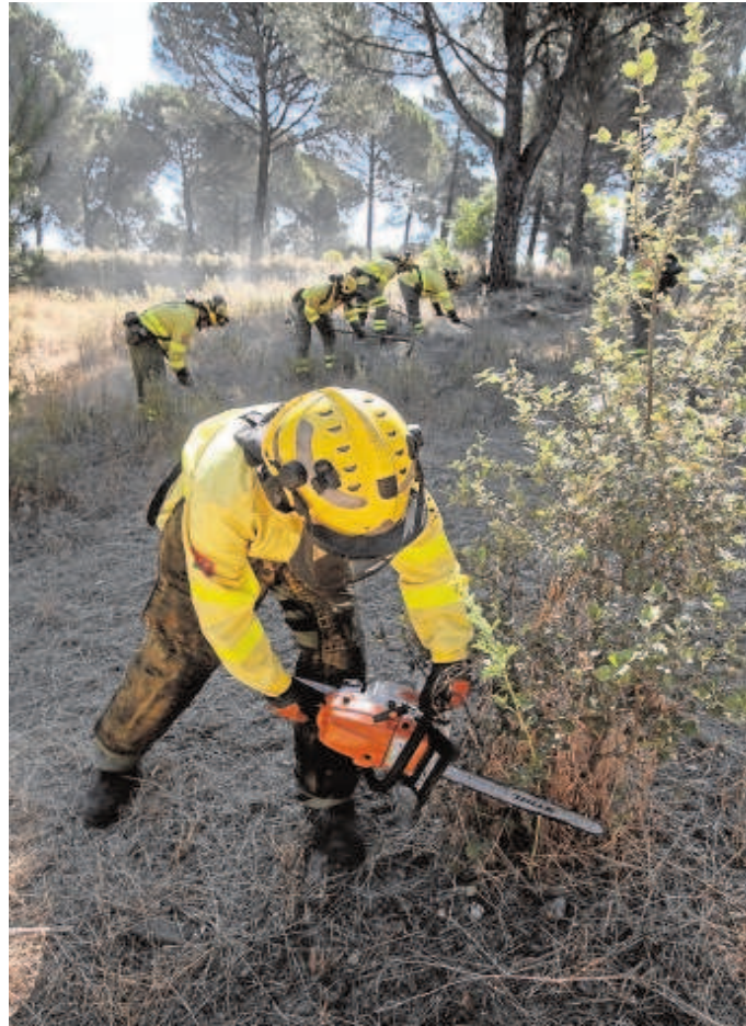
Los bomberos del dispositivo Infoca

Respecto a las infraestructuras y medios logísticos, el operativo cuenta con 23 Centros de Defensa Forestal (Cedefo), un Centro Operativo Regional y ocho Centros Operativos Provinciales. La principal novedad es el Cedefo de Cazorla que se estrena en esta campaña. El resto de infraestructuras consiste en tres Bases de Brigadas de Refuerzo, ocho pistas de aterrizaje pro-