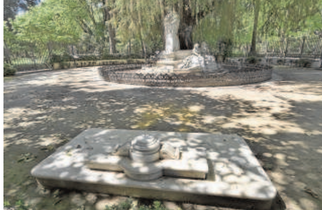
Vandalismo en el parque de María Luisa