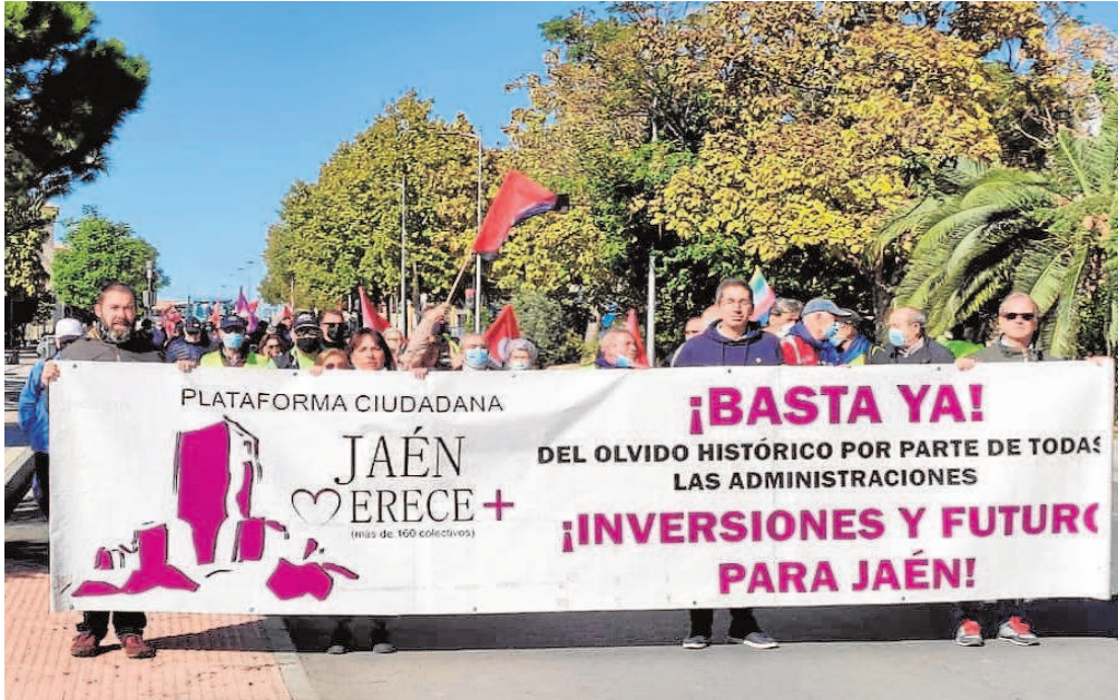
Una de las movilizaciones de las plataformas de Jaén que se han unido en una candidatura a las elecciones del 19-J