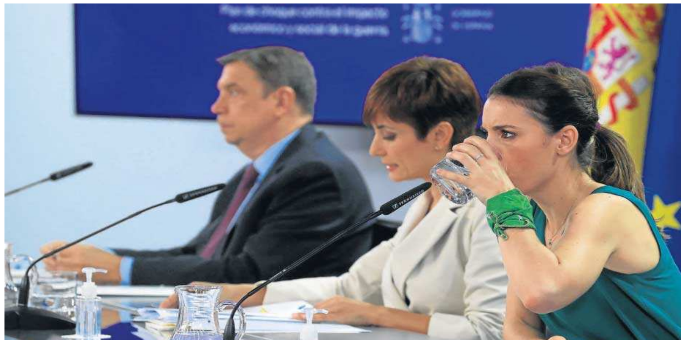
La titular de Igualdad, Irene Montero, bebe agua en la rueda de prensa tras el Consejo de Ministros, junto a Luis Planas e Isabel Rodríguez.

El anteproyecto amplía el acceso gratuito de la píldora del día después de los hospitales y centros de salud a los centros de nueva creación de salud sexual y reproductiva. La educación sexual estará presente de forma obligatoria en todas las etapas desde la primera infancia. Además, la ley considera la gestación subrogada una forma de violencia contra las mujeres, de forma que se perseguirán a las agencias que promueven esta práctica, que es ilegal en España y prohíbe su publicidad, aunque no castigará a quienes acudan a estas empresas.