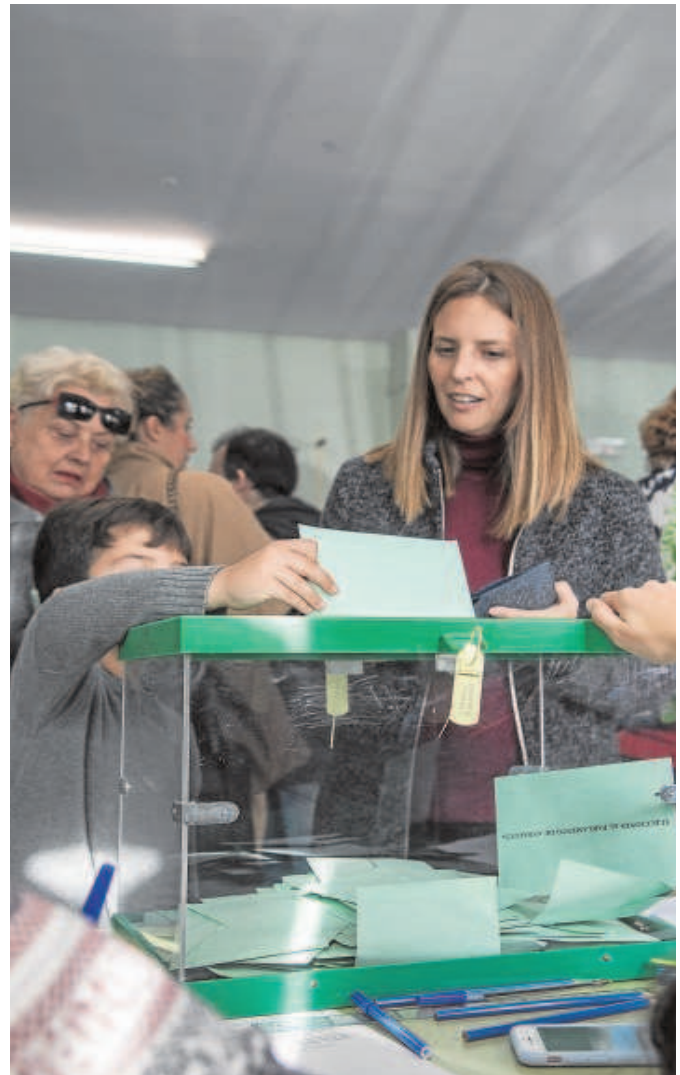
Ambiente en un colegio electoral en las elecciones de 2018

En cuanto a las recomendaciones para las mesas electorales, se aconseja que mantengan una distancia adecuada de, al menos, dos metros. Igualmente, se recomienda que en las mesas exista un dispositivo —bandeja o similar— donde poder depositar la identificación de los votantes.