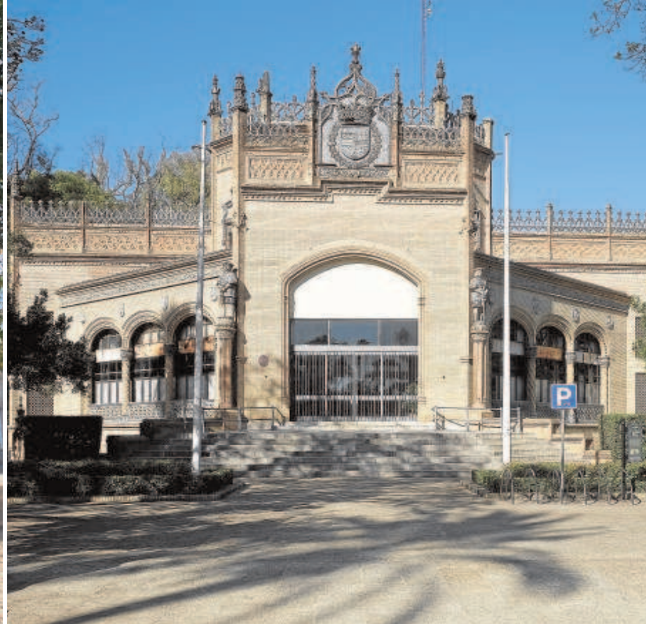
El Pabellón Real aguarda un dictamen de Patrimonio en torno al proyecto de musealización // ABC

nio otro documento más solicitando la agilización del asunto, pero superado el ecuador del mes de mayo se sigue sin respuesta alguna.