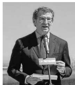
Alberto Núñez Feijóo, ayer en Ceuta.

Aparte de esos actos centrales de campaña –seguramente la apertura y el cierre–, fuentes del PP han avanzado a Europa Press que Feijóo y Moreno tendrán “agendas separadas” y “distintas”, dado que el objetivo es “peinar” lo máximo posible esta autonomía y