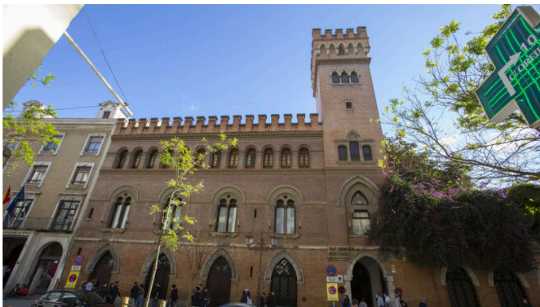
El Palacio de la Motilla