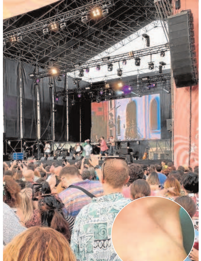
El festival Interestelar reunió a miles de jóvenes que sufrieron picaduras

Cultura asegura que la desinfección del terreno es competencia de la empresa promotora y que investigará lo ocurrido