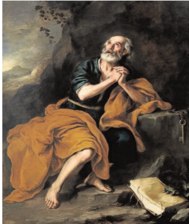
'San Pedro penitente' de los Venerables

La Fundación Focus pretende vender el 'Santa Catalina', que ha ofertado por 900.000 euros, junto a una obra de Bartolomeo Cavarozzi —'Sagrada Familia con San Juanito'—, por considerar que no son estratégicos para la institución, tal como ya adelantó ABC de Sevilla. El objetivo es equili-