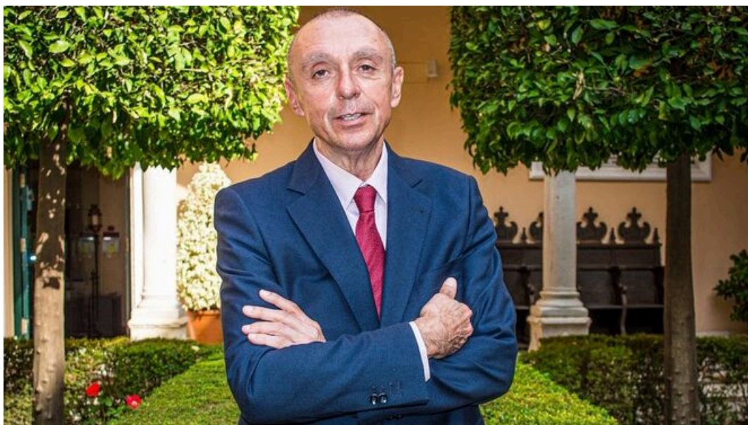
La digitalización permitirá situar al usuario en el centro de nuestra gestión

-¿Cuál es el objetivo de Emasesa para 2022?