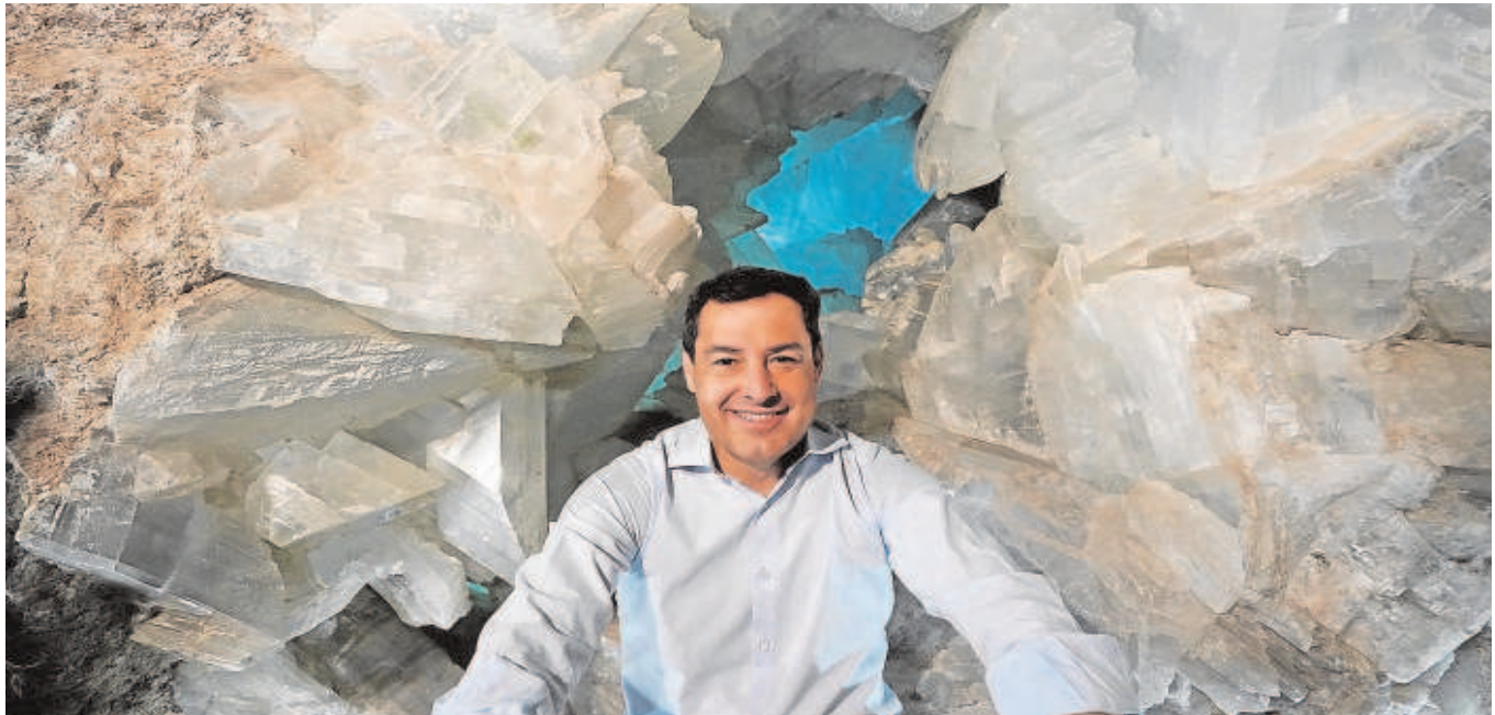
El presidente de la Junta, Juanma Moreno, en la visita que hizo ayer a la Geoda de Pulpi