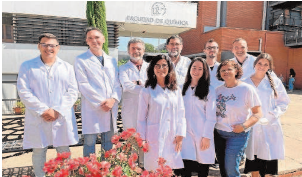
El grupo de investigadores de la Universidad de Sevilla que participa en el proyecto europeo