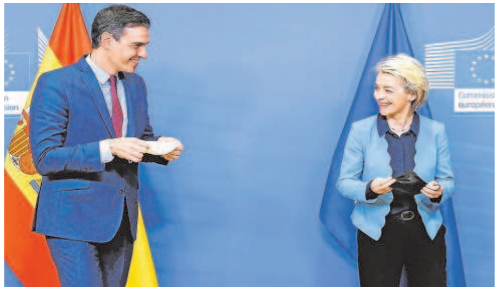
Pedro Sánchez con la presidenta de la CE, Ursula von der Leyen, el pasado 21 de marzo

Y no se queda ahí la cosa porque las disposiciones operativas firmadas por el Gobierno de España con la Comisión Europea, cuyo cumplimiento o incumplimiento determinarán si España recibe o no los fondos que tiene preasignados, prevén que el Ejecutivo tenga en consideración las medidas de reforma fiscal planteadas por el Comité de Expertos reunido por el Ministerio de Hacienda, lo que abre el potencial abanico de subidas al IRPF, principalmente a la imposición sobre el capital; al IVA, el impuesto sobre So-