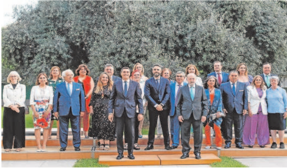
Foto de familia de todos los premiados, anoche, con la máxima distinción del Día de la Provincia 2022 // MANUEL GÓMEZ