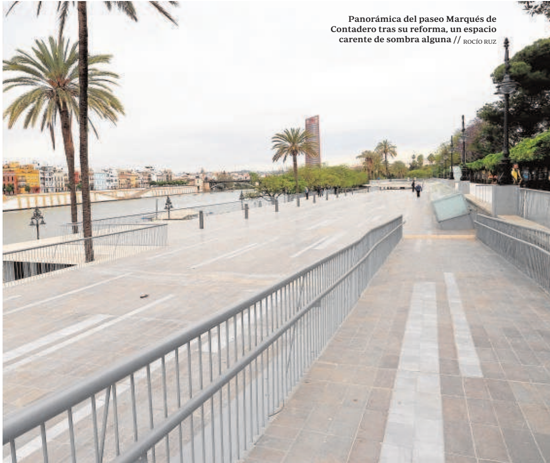
Panorámica del paseo Marqués de Contadero tras su reforma, un espacio carente de sombra alguna