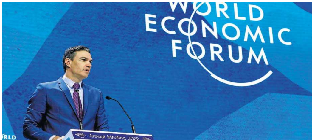
El presidente del Gobierno, Pedro Sánchez, durante su intervención en el Foro Económico Mundial en Davos (Suiza).