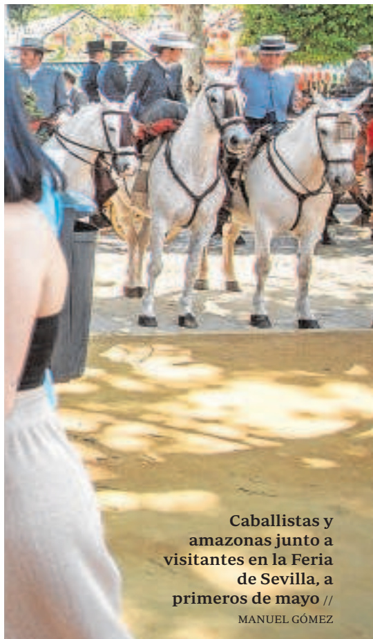
Caballistas y amazonas junto a visitantes en la Feria de Sevilla, a primeros de mayo //

La nota negativa de la evolución de la pandemia, según los datos de Salud, está en el número de fallecidos, que ayer volvieron a ser 50. La comunidad informó el pasado viernes de 40 pero han vuelto a la media de las últimas semanas, que estaba en ese medio centenar por informe. En total, desde el inicio de la crisis sanitaria han muerto 13.895 personas por Covid en Andalucía.