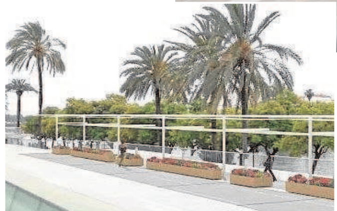
Recreación de las pérgolas para los toldos en Marqués de Contadero