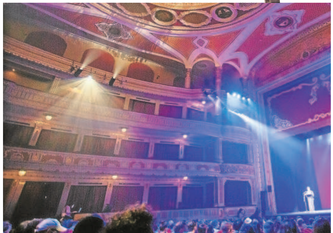
Un momento de la presentación de la XXII Bienal de Flamenco, ayer en el Teatro Lope de Vega