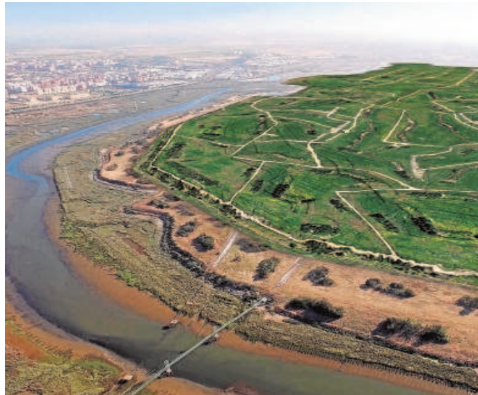
Recreación de cómo quedará la balsa tras las obras de Fertiberia