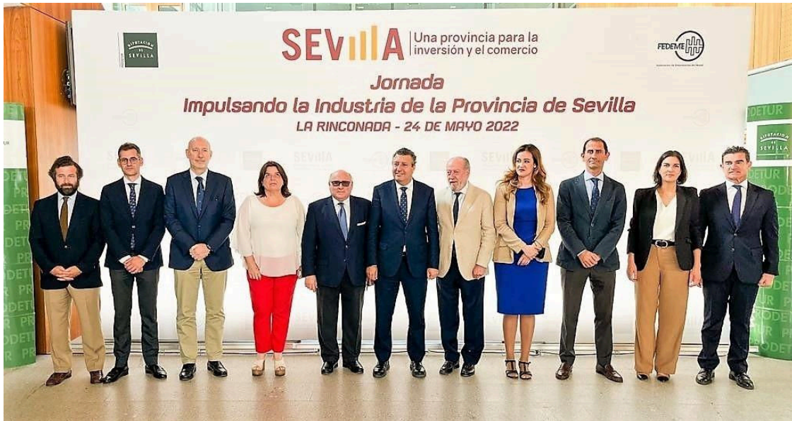
Foto de grupo de los participantes en las jornadas.