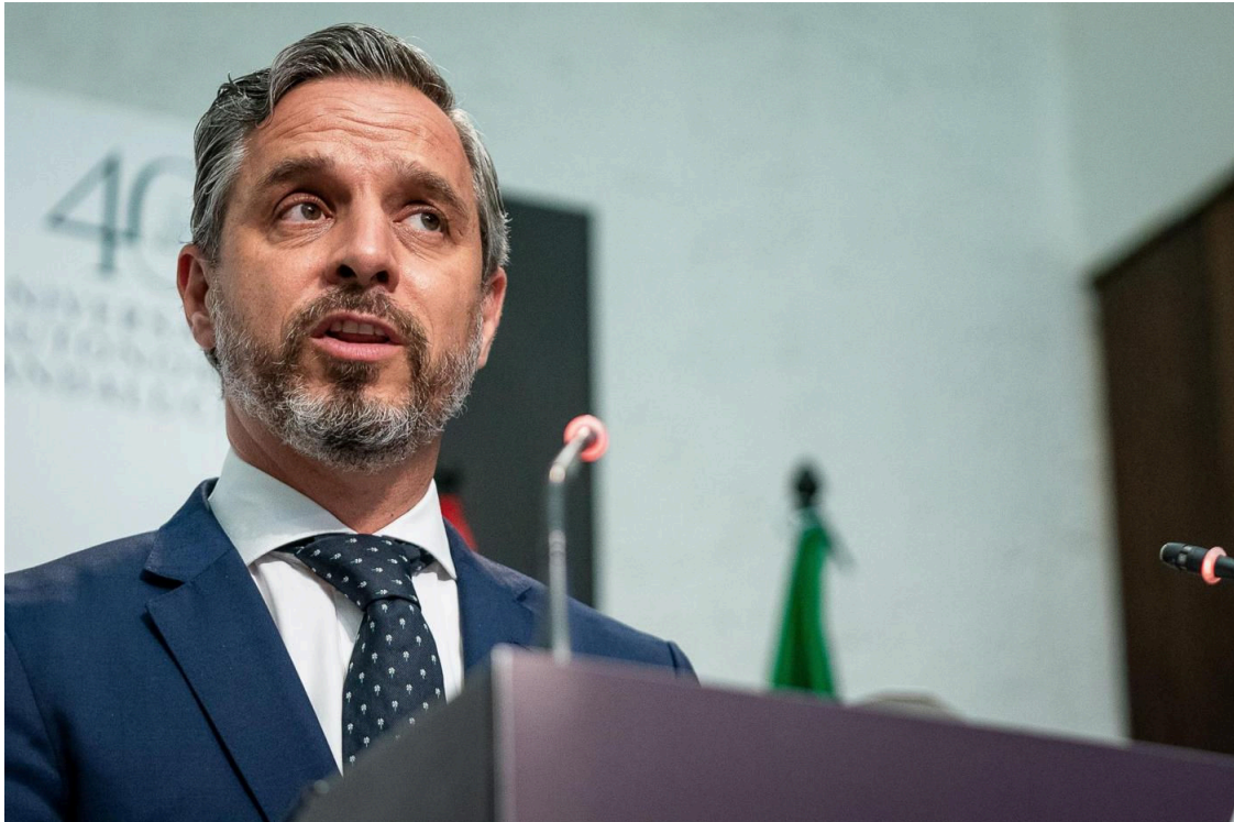
Juan Bravo. Europa Press

El consejero de Hacienda, Juan Bravo, ha firmado este martes la orden de elaboración de los presupuestos para 2022 con la intención de que "se empiece a trabajar desde ya" y se puedan cumplir los plazos para presentar las cuentas en los últimos meses del año y que su aprobación se pueda dar antes de final de año.