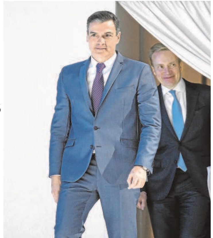
Pedro Sánchez, con el presidente del Foro de Davos, Borge Brende

La primera noticia que se tuvo del Perte de semiconductores fue un anuncio por parte de Pedro Sánchez en el foro 'Wake Up, Spain!', en la que afirmó que contaría con un presupuesto de 11.000 millones –comparativamente, el del vehículo eléctrico tiene 2.975 millones–, lo que le convertía en el mayor proyecto del Plan de Recuperación anunciado hasta la fecha. Sin embargo, en la rueda de prensa después del Consejo de Minis-