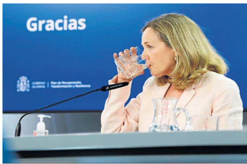
La vicepresidenta primera y ministra de Asuntos Económicos y Transformación Digital, Nadia Calviño.

Sánchez explicó en la localidad suiza que España inicia "una carrera de fondo" para convertirse en un referente en la industria de los semiconductores.