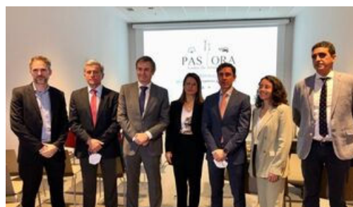
Un momento de la presentación de Pastora en Málaga. Un momento de la presentación de Pastora en Málaga.

Las dos plantas suman una capacidad conjunta de 100 MW y generan 202 GWh al año, lo que equivale al consumo energético anual de una localidad como Carmona. Para su construcción llegaron a trabajar más de 300 personas en los momentos pico durante la obra, por lo que se realizaron cursos de formación a más de 125 personas, la mayoría desempleados de la zona que ahora tienen una formación en un sector como el renovable que cada vez necesita de más profesionales.