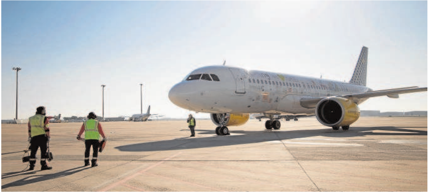
Llegada a Sevilla del primer avión de Vueling propulsado con combustible ecológico el pasado mes de noviembre