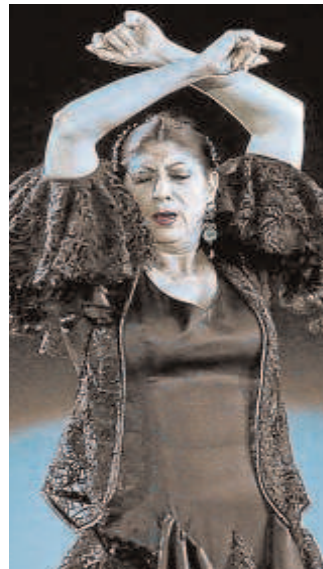
MANUELA CARRASCO. La bailaora sevillana presentará su espectáculo 'Manuela' en el Maestranza