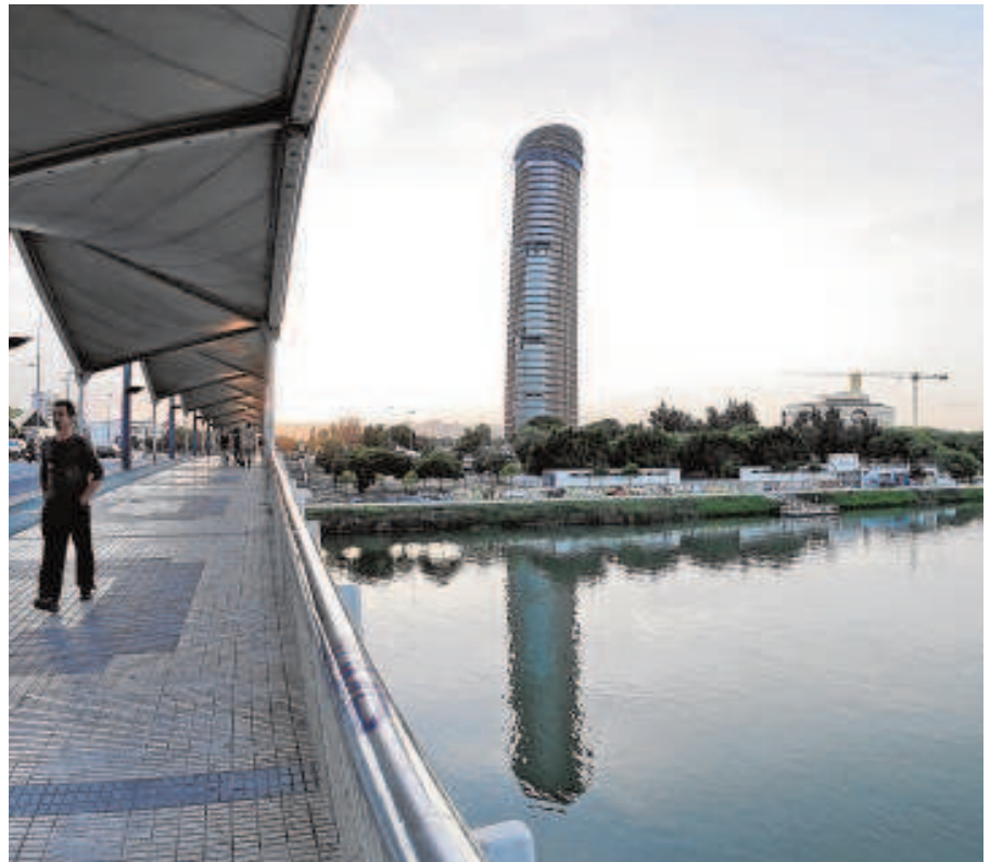
Imagen de la Cartuja desde el puente del Cachorro

El proyecto presentado por el Liceo Francés viene de la mano de la Embajada francesa y de la sede en Sevilla del Centro Común de Investigación (Joint Research Centre). Otras instituciones públicas y privadas como el Parque Científico y Tecnológico Cartuja (PCT), la Cámara de Comercio Franco-Española, el Ayuntamiento y el Círculo de Empresarios de Cartuja han apoyado también este proyecto, que se conver-