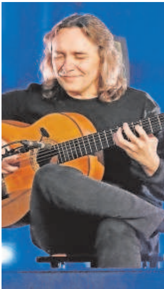
VICENTE AMIGO. El guitarrista ofrecerá un recital en el Teatro de la Maestranza