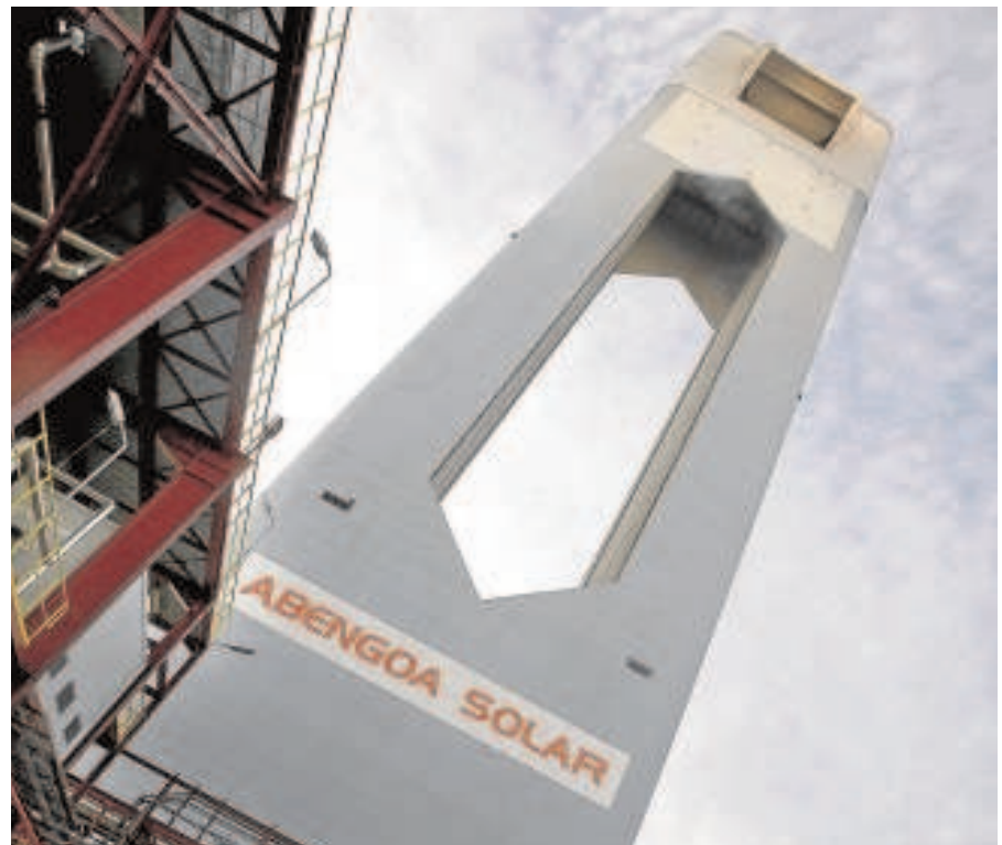
Abengoa lleva un año esperando el rescate de la SEPI