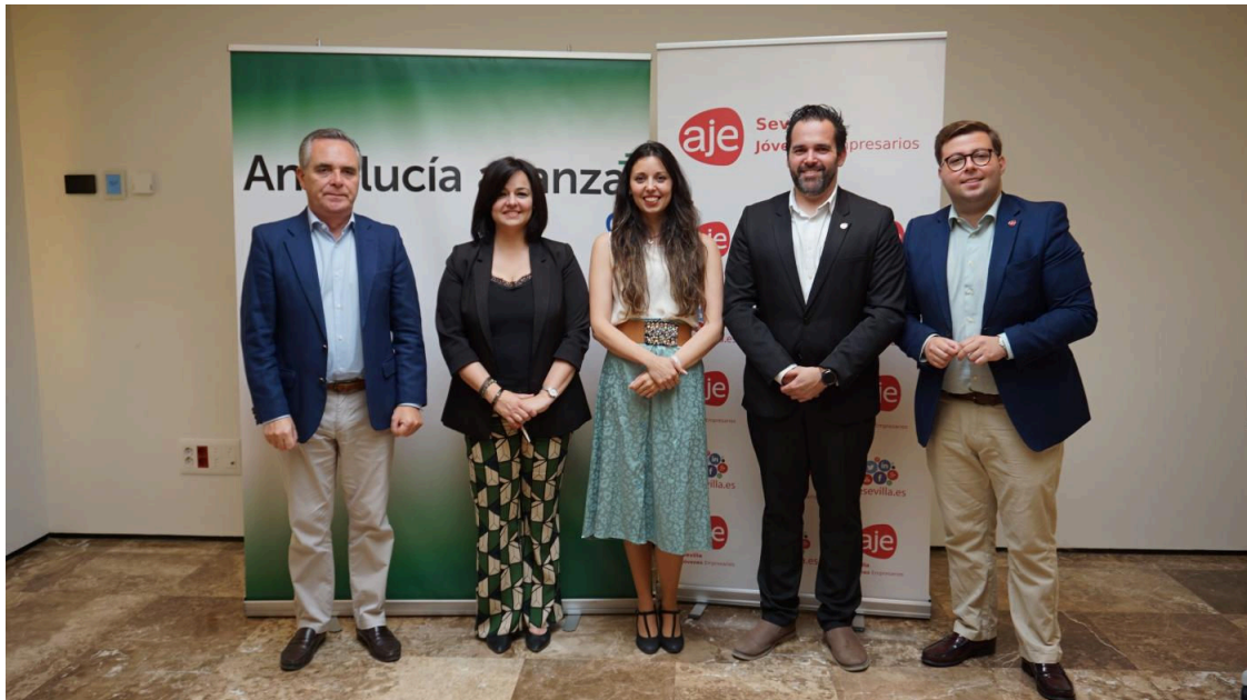
El Pp De Sevilla Se Reúne Con La Asociación De Jóvenes Empresarios De Sevilla Y Coinciden En Seguir Reduciendo Trabas Burocráticas Para Emprender En La Provincia. PP SEVILLA

La presidenta del PP de Sevilla y número tres del PP por Sevilla a las elecciones autonómicas del próximo 19 de junio, Virginia Pérez, se ha citado con la Asociación de Jóvenes Empresarios (AJE) de Sevilla en un encuentro en el que ambas partes han coincidido en "seguir reduciendo trabas burocráticas para emprender, en línea con las políticas del Gobierno del cambio".