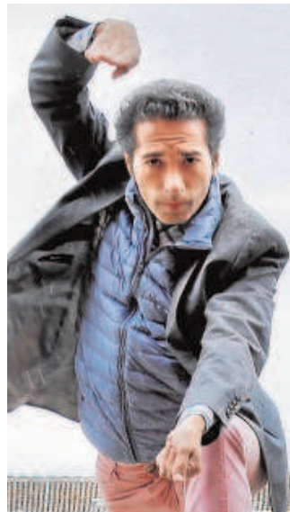
ISRAEL GALVÁN. El bailar sevillano plasmará sus recuerdos de la infancia en 'Seises'