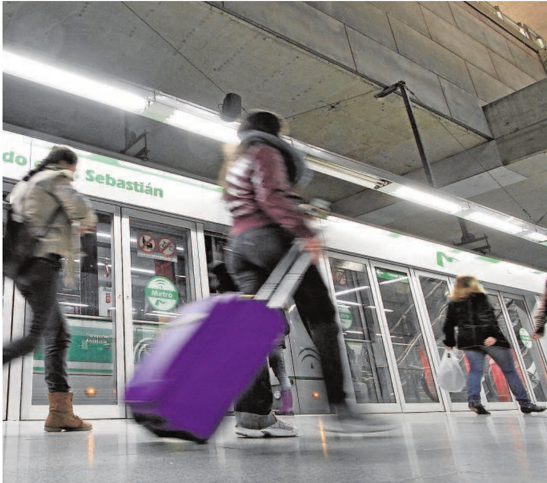
Pasajeros en una de las estaciones de la línea 1 del metro de Sevilla