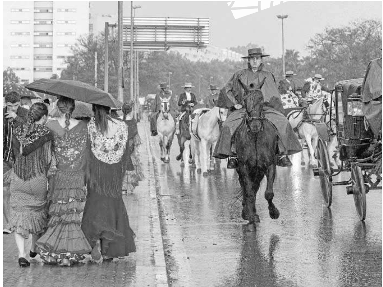
Los paraguas y los chubasqueros llegaron a la Feria por la tarde.