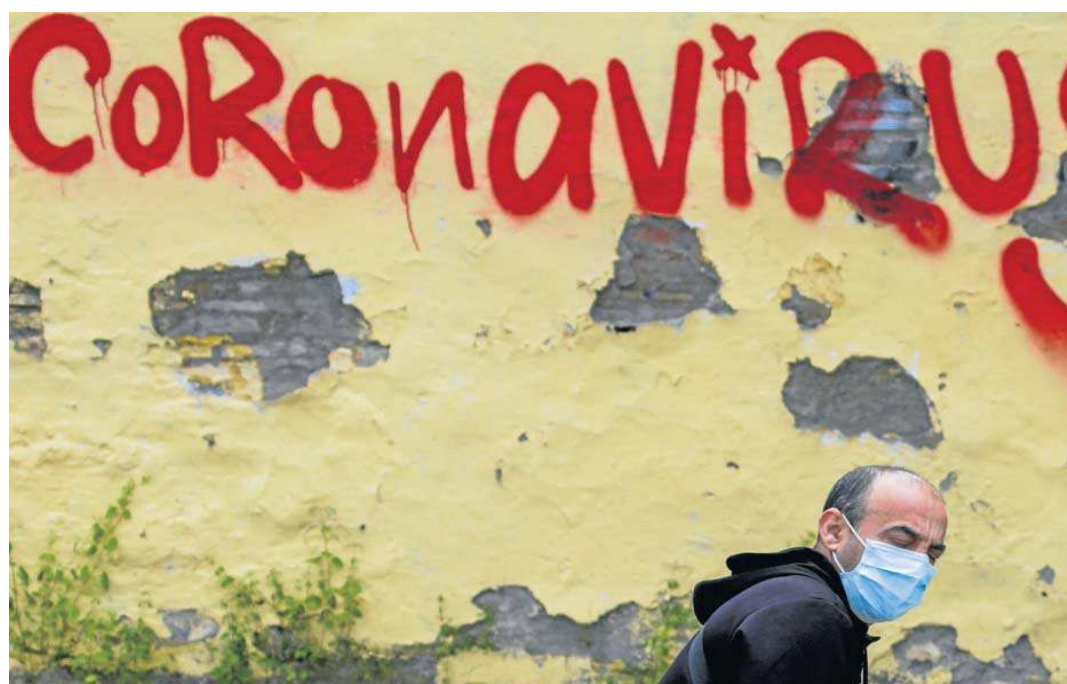
Un ciudadano atraviesa una fachada con la inscripción del SARS-CoV-2 durante el primer año de la pandemia.

● Un informe de la Consejería de Salud concluye que las personas con ingresos bajos han tenido cuatro veces más posibilidades de fallecer por Covid-19 que los de ingresos altos