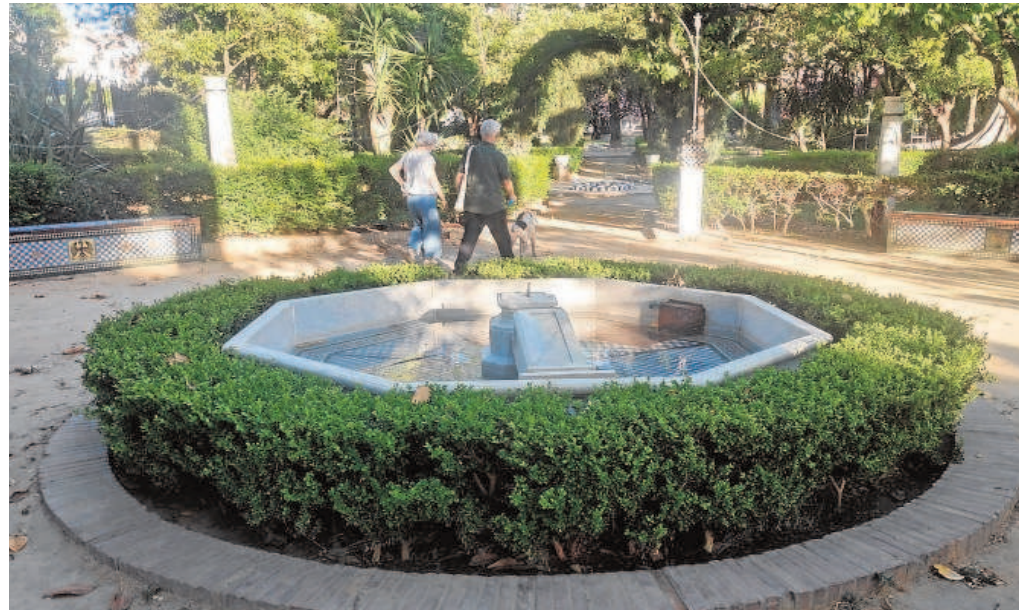
Una de las fuentes de los Jardines de Murillo afectadas por el vandalismo