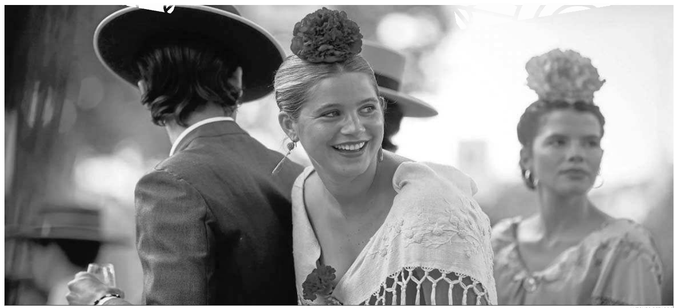
Una joven flamenca sonríe mientras va a la grupa de paseo por el real.

Distribuido para CONFEDERACIÓN DE EMPRESARIOS DE SEVILLA * Este artículo no puede distribuirse sin el consentimiento expreso del dueño de los derechos de autor.