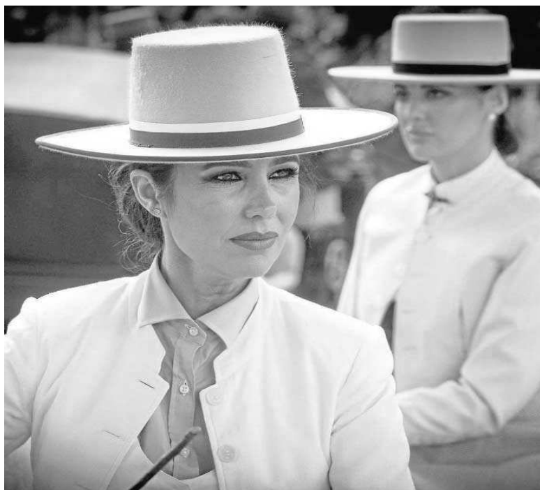
La belleza de la amazona.

Los primeros farolillos de la temporada llegaron con un libro titulado Feria . Lleva ya más de veinte ediciones y ha convertido en fenómeno literario a su autora, Ana Iris Simón (Campo de Criptana, Ciudad Real, 1991), paisana de Sara Montiel y de los molinos de viento. Cuenta en ese libro que sus abuelos maternos,