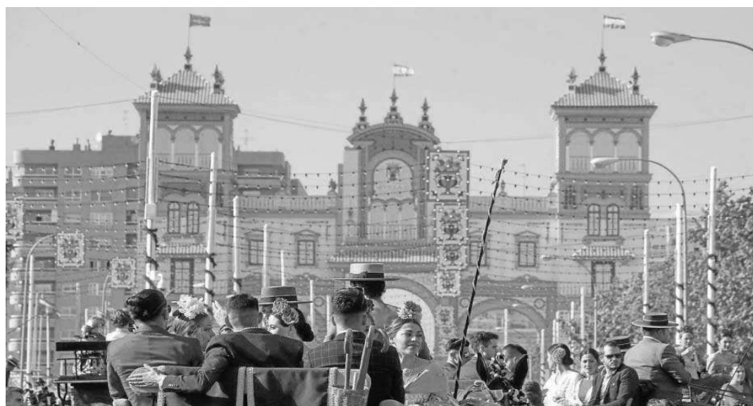
Las entradas de carruajes por los puntos de control de acceso a la Feria rozaron las 1.400.