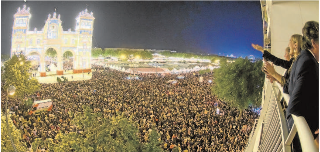
El real de la Feria con la portada al fondo el día del alumbrado