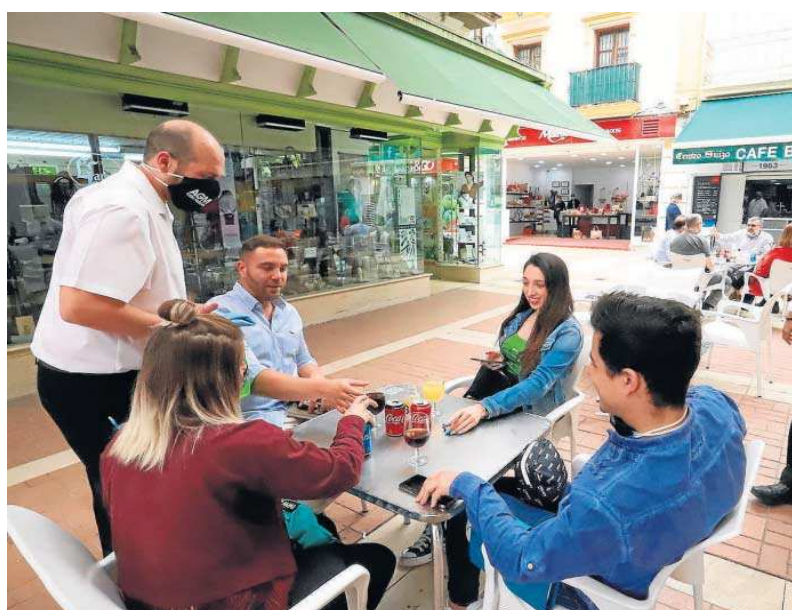
Dos camareros atienden a clientes.

En número absolutos, Andalucía es la comunidad donde más baja el paro (-55.600) y la segunda, tras Madrid, en la que más se generan puestos de trabajo (111.600). El hecho de que la ocupación suba con mucha más fuerza de lo que baja el paro se debe a que la población ac-