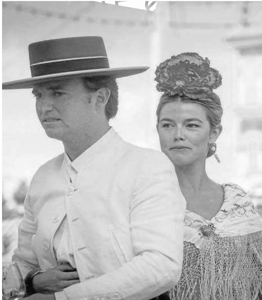
Una pareja, de paseo a caballo.

Distribuido para CONFEDERACIÓN N DE EMPRESARIOS DE SEVILLA * Este artículo no puede distribuirse sin el consentimiento expreso del dueño de los derechos de autor.