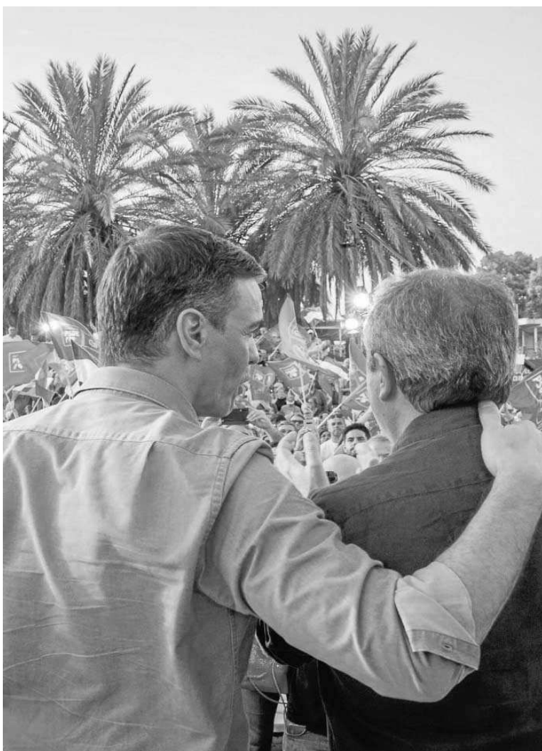
Pedro Sánchez y Juan Espadas en el acto de cierre de campaña de las elecciones andaluzas en Sevilla.

● La derrota del PSOE en Andalucía obliga a Pedro Sánchez a repensar todas las estrategias de aquí a 2024 ● Los socialistas andaluces llevan perdiendo votos desde hace 18 años pero siguen sin tener una estrategia de reconexión con sus votantes ● El otoño será inclemente: la economía se deteriora y el PP no soltará la presa tratando de hacer caer al Gobierno