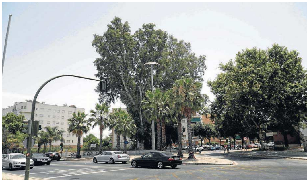
Arboleada en la entrada de la barriada de Tablada.