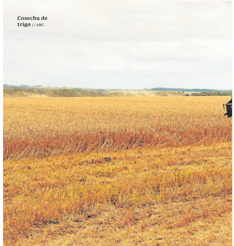
Cosecha de trigo

Pero no todo son malas noticias para los agricultores. Así, «la calidad del trigo duro está siendo mucho mejor de lo que se esperaba a principios de campaña y los precios se prevé que, a corto plazo, sigan sostenidos con tendencia al alza», ha señalado el técnico de la patronal agraria. De hecho, la Lonja de Cereales de Sevilla ha fijado el precio del trigo duro del grupo 1 a 532