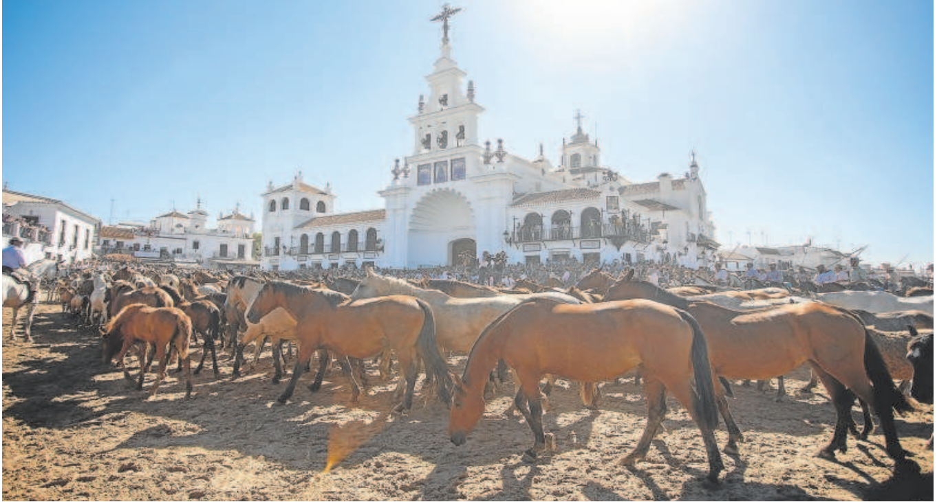
Las tropas de equinos guiadas por los yegüerizos pasan ante el Santuario de la Virgen del Rocío