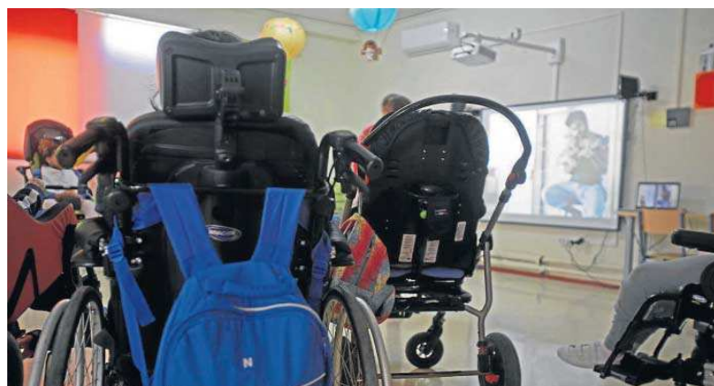
Un colegio de Educación Especial, otro de los servicios por cuya concertación se apuesta.

Realmente significativo resulta el respaldo a la FP Dual, en la que debe destacarse el programa piloto puesto en marcha en el IES Cristóbal de Monroy, de Alcalá de Guadaíra, en el que se desarrolla por primera vez en Andalucía el modelo alemán para esta formación, donde el alumno permanece el mayor tiempo en las empresas, aunque, en este caso,