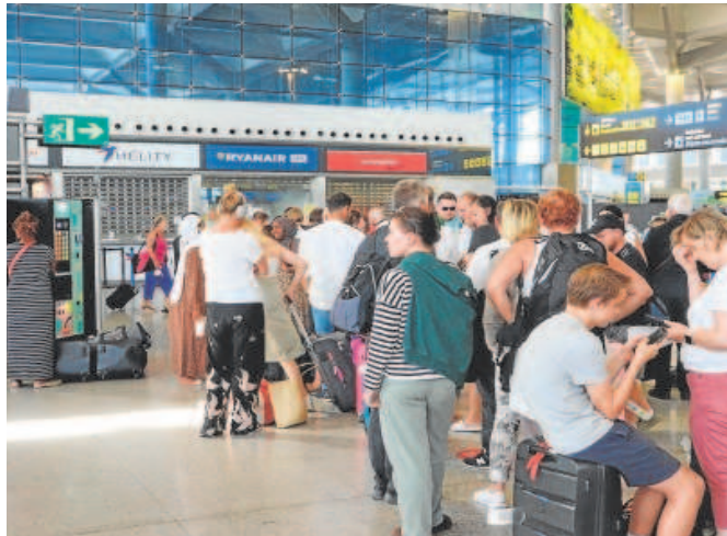
Así se encontraba el aeropuerto de Málaga ayer

El sindicato USO denuncia que la compañía irlandesa ha trasladado a la capital costasoleña cinco pilotos marroquíes