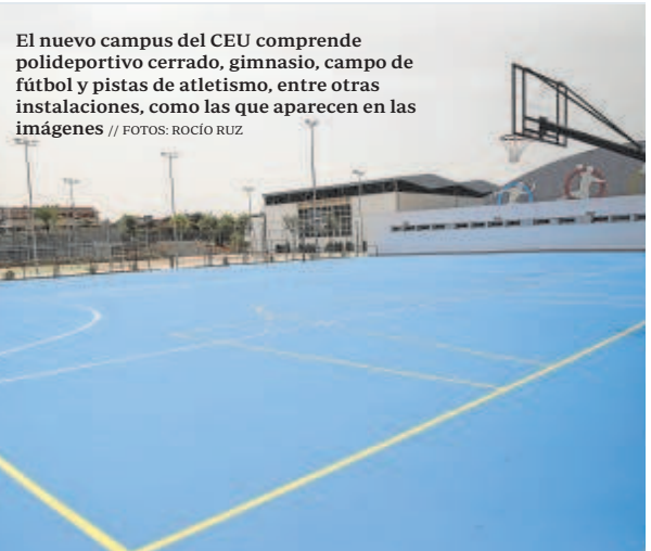
El nuevo campus del CEU comprende polideportivo cerrado, gimnasio, campo de fútbol y pistas de atletismo, entre otras instalaciones, como las que aparecen en las imágenes