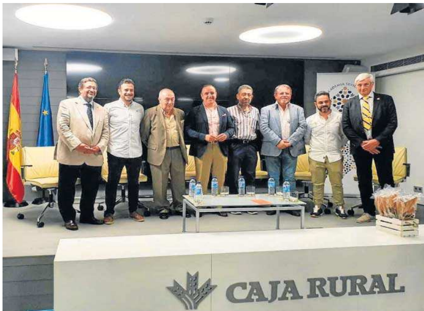
Coloquio sobre el pan organizado por la Academia Sevillana de Gastronomía y Turismo en Fundación Caja Rural. M. G.

vo de relanzar la gastronomía sevillana así como colaborar en acciones promocionales del destino a nivel nacional, implementando así el carácter universal de la cultura de la tapa sevillana.