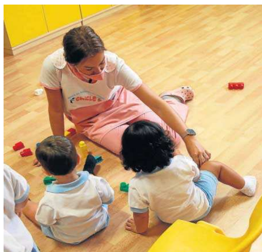
La trabajadora de una guardería atiende a los niños.

Otro de los objetivos de esta legislatura es conseguir la gratuidad plena en el primer ciclo de Educación Infantil (de 0 a 3 años), para lo que ya se han dado los primeros pasos estos años, en