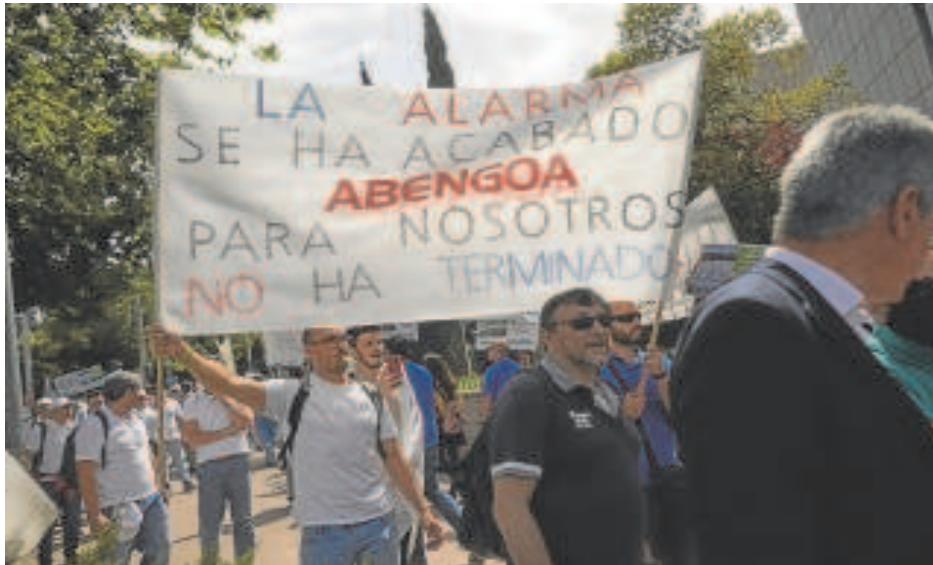
Protestas de trabajadores de Abengoa en Madrid // GUILLERMO NAVARRO