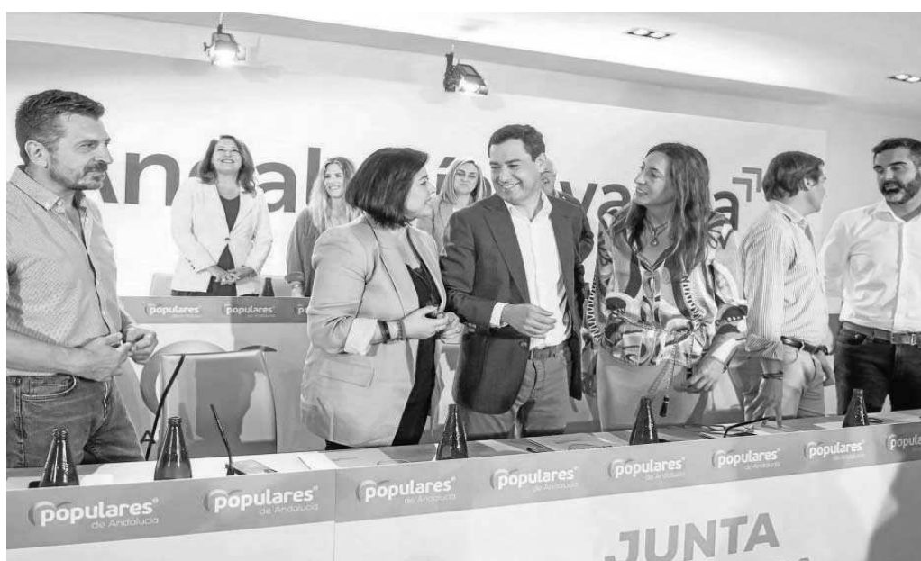
Juanma Moreno, en la reunión de la junta directiva autonómica del PP, el viernes en Sevilla.

El presidente de la Junta se tomará unos días de descanso la semana próxima, no mucho más de un fin de semana largo, y será a la vuelta cuando termine de ponerle nombres al nuevo Gobierno, así como a su estructural final. El cambio será profundo por dos motivos: porque ya no será de coalición y porque sale Elías Bendodo, titular de Presidencia y portavoz. Bendodo es una de las personas de mayor