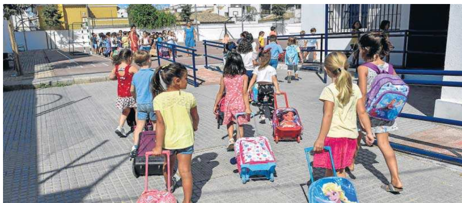
Niños entran en un colegio el primer día de clase.