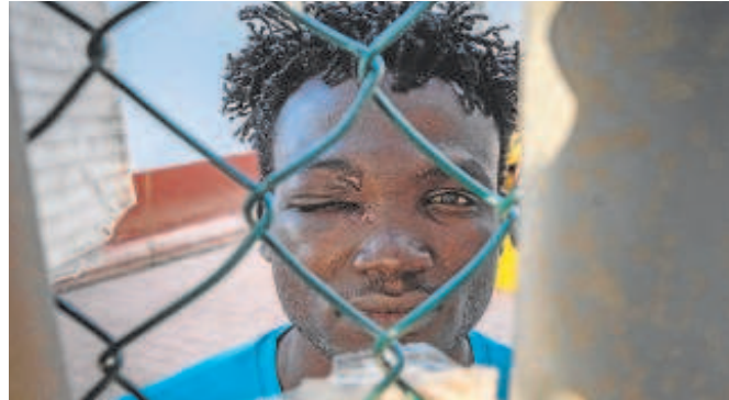
Uno de los inmigrantes que lograron entrar en Melilla el pasado viernes

También ayer la Guardia Civil rescató en el mar y a medio kilómetro de la costa de Ceuta el cuerpo sin vida de un joven magrebí con un flotador. Todo ello apenas dos días después de que otros 2.000 subsaharianos intentaran asal-