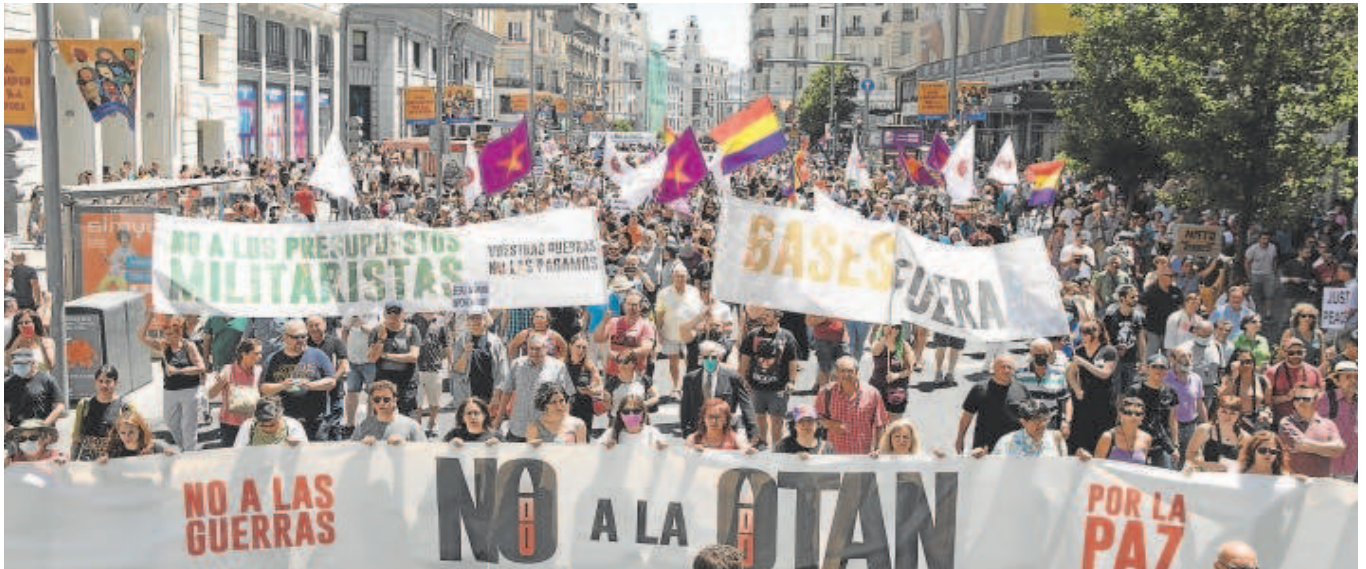
Cabecera de la manifestación contra la OTAN en la Gran Vía de Madrid, a la altura de Callao