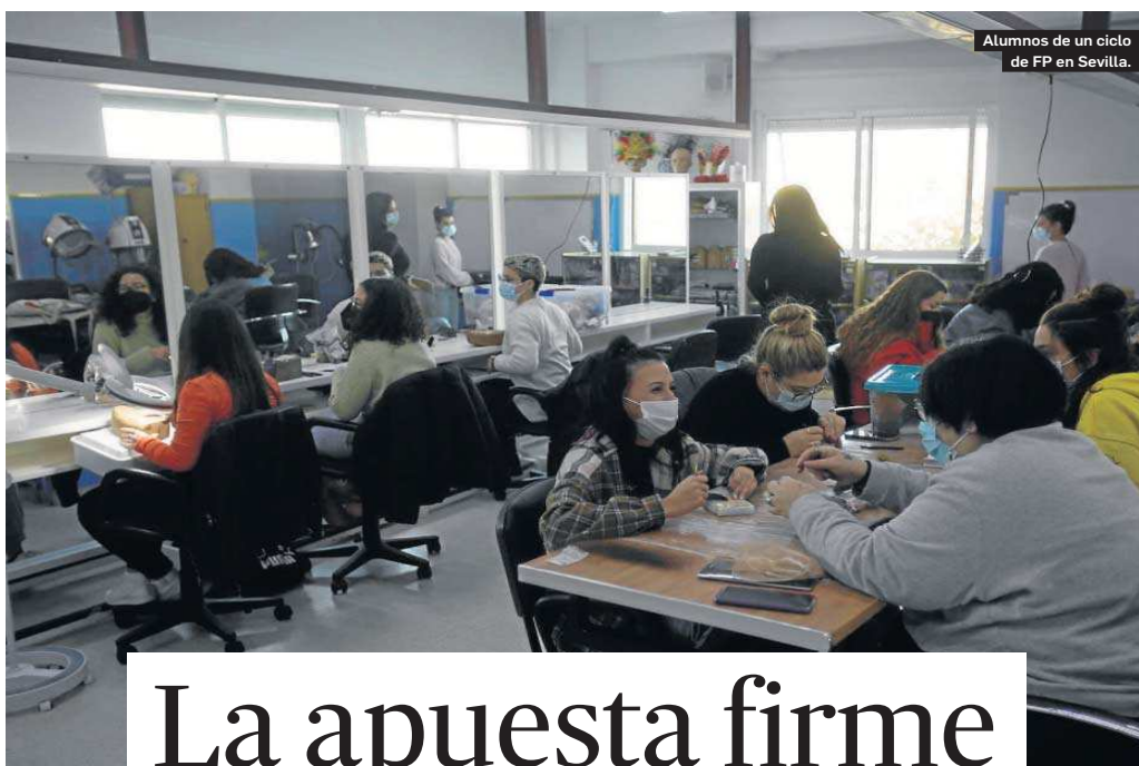
Alumnos de un ciclo de FP en Sevilla.

● El programa del PP contempla el concierto del Bachillerato y la bajada del número de alumnos en las aulas, medidas descartadas por Cs la pasada legislatura ● Persigue un pacto social en Educación