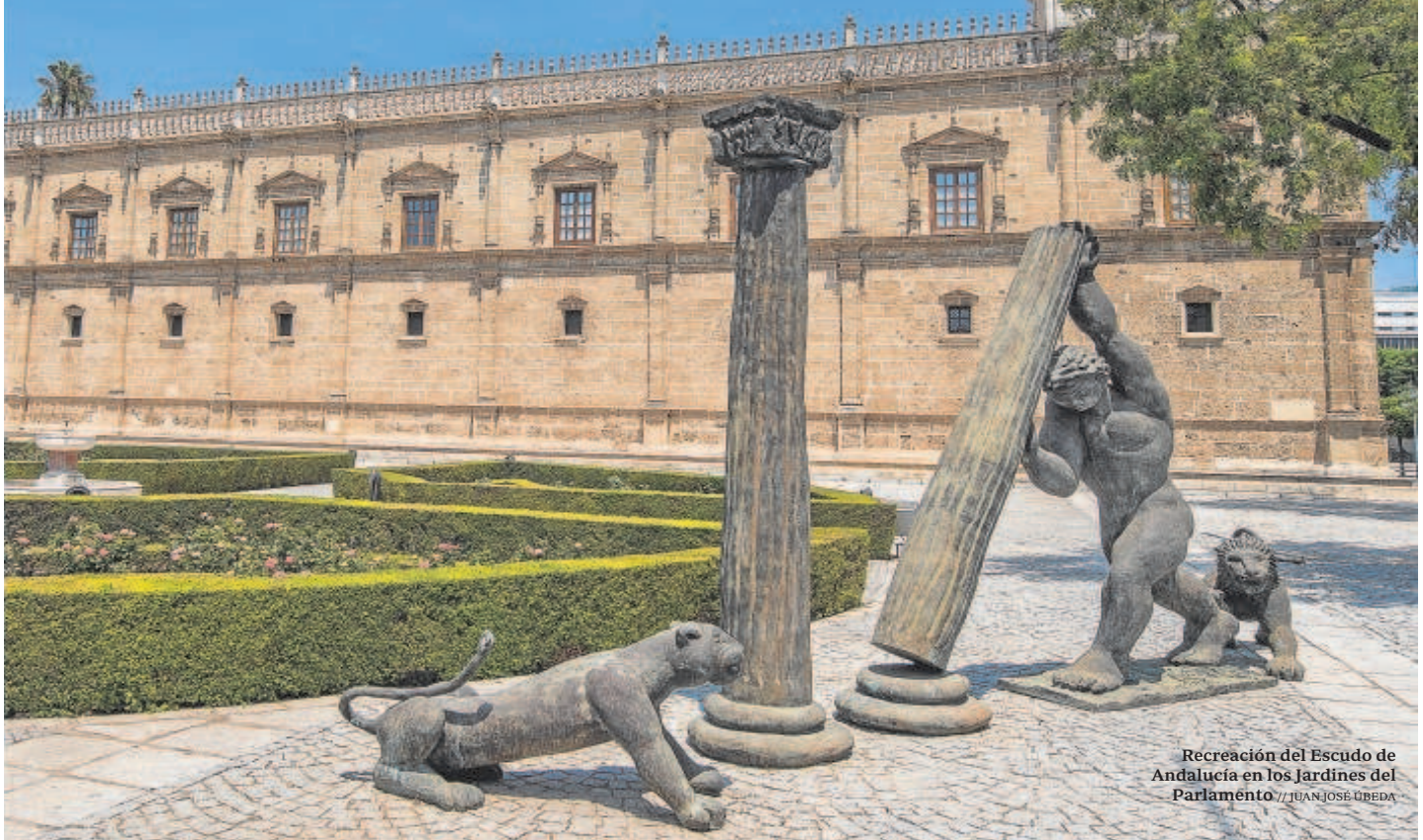
Recreación del Escudo de Andalucía en los Jardines del Parlamento

te acuerdo por lo que es previsible que la normativa vuelva a tramitarse en los mismos términos o muy similares.