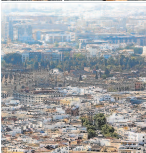
En las dos imágenes superiores y en la que está debajo de estas líneas, tres instantáneas que se repiten por toda la ciudad, con basura tirada por los suelos y contenedores que no dan más de sí; a la izquierda una vista aérea de la ciudad de Sevilla.