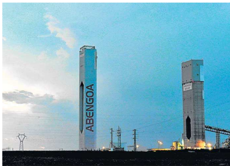
Planta termosolar construida por Abengoa en Sanlúcar la Mayor, en Sevilla.

Un extremo que confirma el informe y que es muy relevante es que los ejecutivos del grupo Abengoa no registraron este reparto hasta el 7 de abril pasado. Y que el nuevo Plan de Viabilidad se entregó el pasado 10 de mayo, que fue cuando se incorporaron los datos auditados de las cuentas anuales del ejercicio 2020. Esto es muy importante, porque confirma que la SEPI no ha estado demorando el trámite duran-