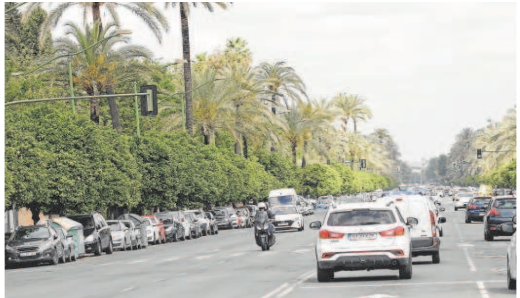
Los trabajos se centran en el tramo que va de la Glorieta Plus Ultra hasta Cardenal Ilundain

El Ayuntamiento de Sevilla va a destinar 700.000 euros de inversión para el nuevo plan de asfaltado de calles de seis distritos de la ciudad, con mejoras como el uso de mezclas más resistentes y silenciosas que aguantarán mejor el paso del tiempo y ayudarán a disminuir el ruido del tráfico y la circulación.