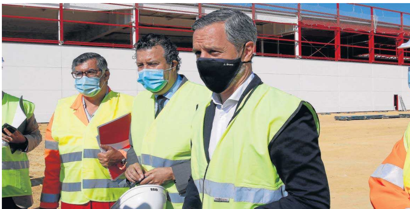
El consejero de Hacienda en funciones, Juan Bravo, en la visita de una obra en Sevilla.

● El nuevo organismo controlará las conductas que puedan ser constitutivas de “fraude o corrupción” ● Andalucía ha recibido hasta enero unos 1.900 millones de la Unión Europea