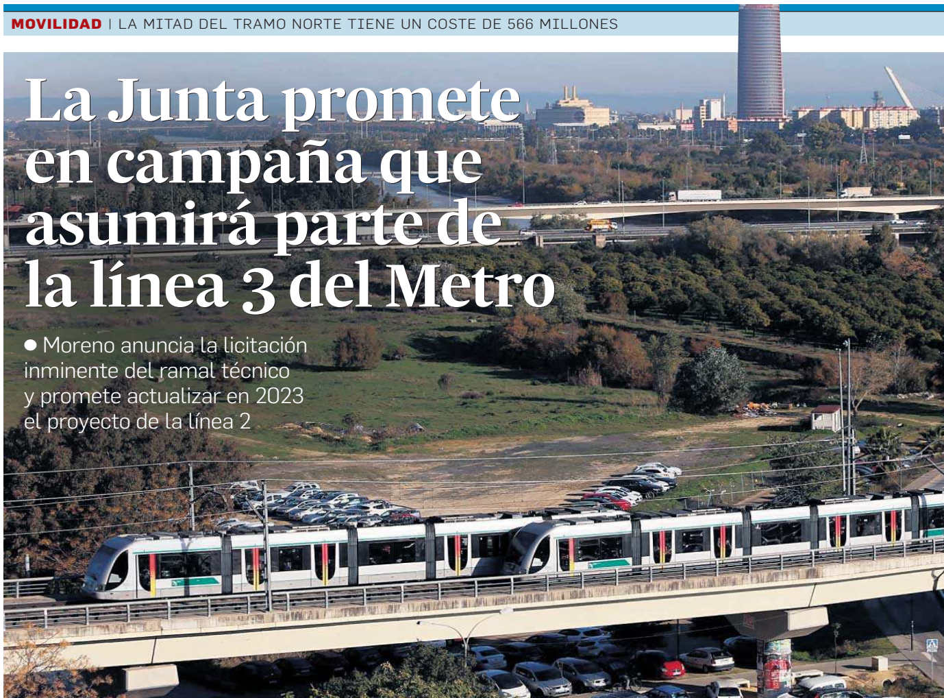
Dos convoyes de la línea 1 del Metro se cruzan a la altura de la estación de San Juan Bajo.