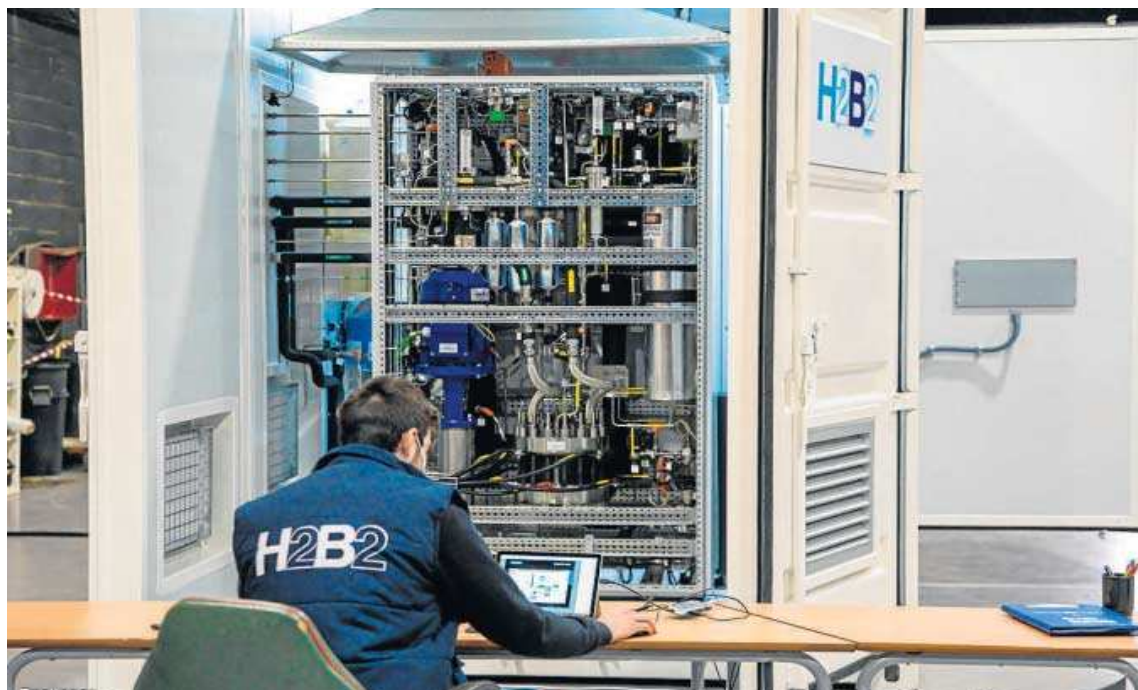
Un electrolizador construido por la 'startup' H2B2 en sus instalaciones de Dos Hermanas.