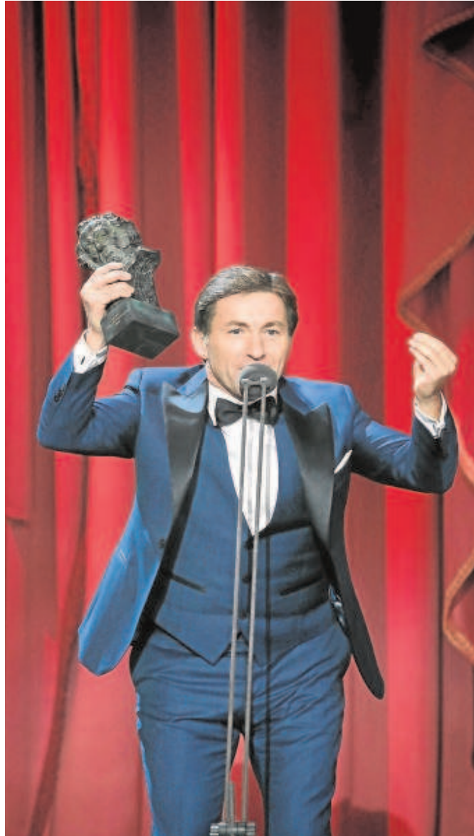
Antonio de la Torre recibiendo el Goya en Sevilla en 2019

Tal y como ya afirmara el presidente de los cineastas en aquella ocasión, «Sevilla es una ciudad muy cinematográfica y nos da cineastas muy reconocidos y que han recibido numerosos premios Goya. La Academia es de todos los cineastas del Estado y es bueno que los Goya reflejen esa realidad», poniendo en valor «la apuesta tan fuerte que hace Sevilla por el