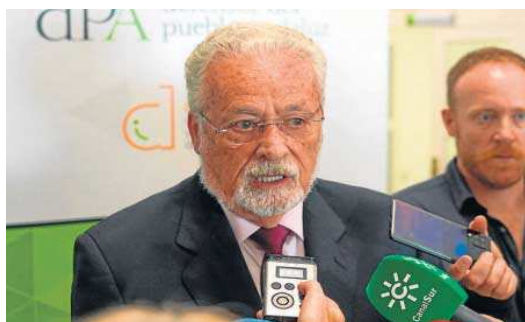
El Defensor del Pueblo Andaluz, Jesús Maeztu, en la sede de la institución.

Maeztu compareció ante los medios junto al Defensor del Pueblo de España, Ángel Gabilondo, quien estuvo ayer en Sevilla en una visita institucional, la primera que realiza a Andalucía desde que tomó posesión del cargo.