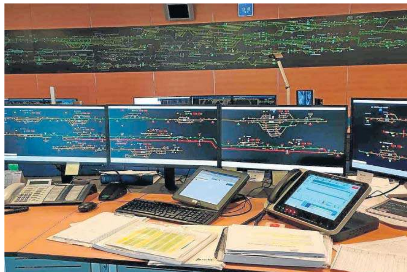
Vista de algunas de las pantallas de control del Centro de Regulación.

El CRC de Sevilla se encarga de la regulación del tráfico ferroviario mediante el Control de Tráfico Centralizado (CTC). Un CTC es un sistema de regulación y control de tráfico caracterizado porque desde un puesto de mando se accionan todas las señales y agujas de un tramo de línea determinado y sus estaciones. La extensión del CTC de "manera progresiva" a otras líneas supondrá "un aumento en la capacidad, seguridad y fiabilidad de la infraestructura ferroviaria".