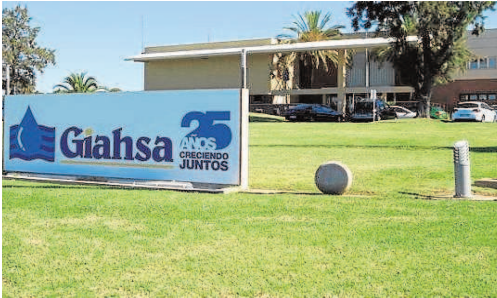
Sede de la empresa de la mancomunidad Gihasa, que abastece de agua y recoge la basura en municipios de Huelva