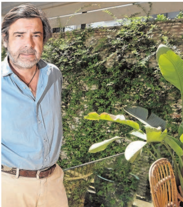
// J.M. SERRANO

González explica que desde 2018 se ha producido una verdadera 'explosión' del sector de seguros por muchas razones, una de ellas «porque es un sector muy resistente, incluso en tiempos de Covid, y porque muchos fondos metieron dinero en el sector, produciéndose una gran concentración. Marsh, que es el líder, compró la número cuatro, JLT; Aon intentó compra Willis y bajó el 20% del sueldo a todos su empleados... De repente, se produjo una tormenta en el sector y todo el talento decidió por arte de magia venir a Howden Broking Group. De hecho, 600 personas de las grandes corredurías vinieron a trabajar a Howden porque se desencantaron ante las opciones americanas porque son tan grandes que se han olvidado de los clientes, de sus empleados... mientras que nosotros estamos muy orientados a las personas».