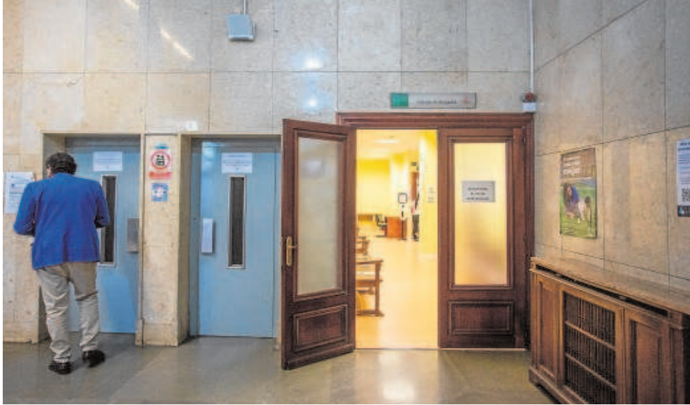
Dependencias del Colegio de Abogados en la Audiencia de Sevilla