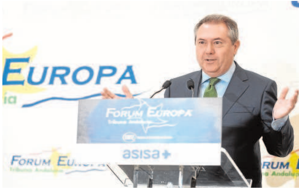
El secretario general del PSOE-A y candidato a la Presidencia de la Junta, Juan Espadas, ayer en el Fórum en Málaga