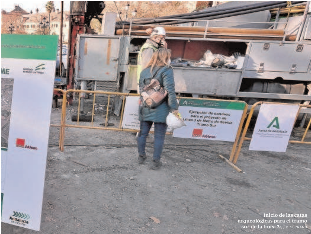
Inicio de las catas arqueológicas para el tramo sur de la línea 3

El proyecto de la línea 3 se presentó en enero y en febrero se constituyó la mesa técnica de ambos departamentos. Casi cuatro meses después aún no hay acuerdo.