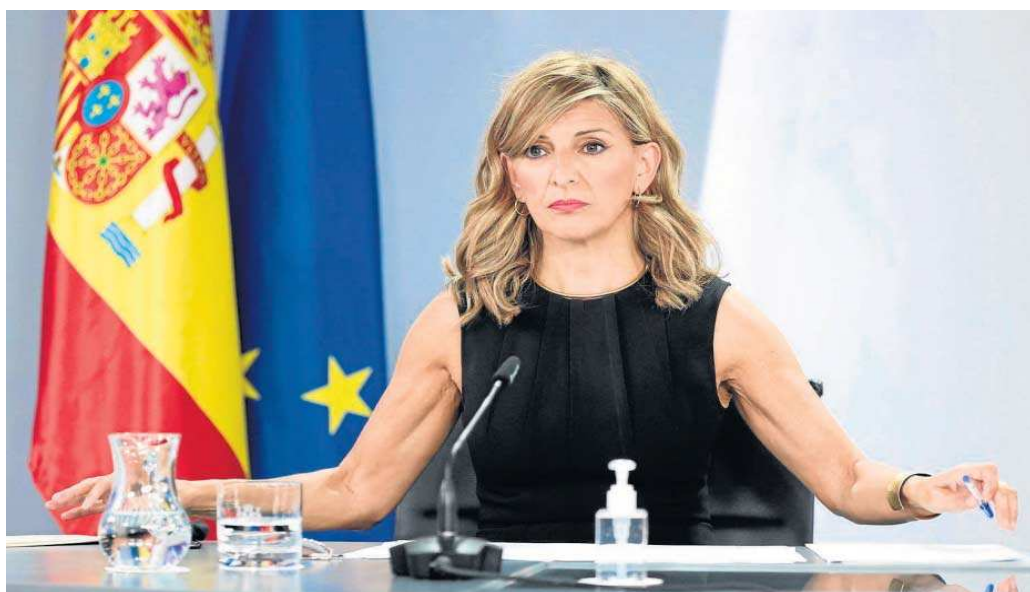
La vicepresidenta segunda y ministra de Trabajo y Economía Social, Yolanda Díaz, interviene ayer en la comparecencia tras el Consejo de Ministros.

● La ministra Yolanda Díaz anuncia una subvención de 50 millones de euros destinada a aquellas personas cuya exposición al impacto económico del Covid haya sido mayor