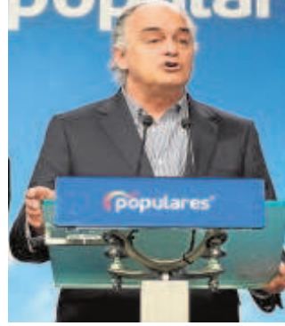
Esteban González Pons

González Pons ocupará una de las diez vicepresidencias del PPE y su función estará centrada en la supervisión de los fondos europeos y en las relaciones con Latinoamérica y Estados Unidos. Fuentes del PP señalaron que se trata de una vicepresidencia 'ejecutiva' y en la práctica González Pons actuará como auténtico número dos de Weber.