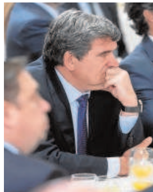
El ministro de Inclusión, Seguridad Social y Migraciones, José Luis Escrivá

En estos momentos, tanto el PSOE como Unidas Podemos siguen negociando modificaciones para lograr que la formación morada apoye finalmente el proyecto de ley. Sin embargo, lograr el beneplácito de Yolanda Díaz para el proyecto de ley no asegura su aprobación. Fuentes parlamentarias aseguran a ABC que, por el momento, el Gobierno no habría logrado sumar suficientes apoyos entre los partidos socios de la coalición que se han descolgado del proyecto de ley. Si Compromís y Más País cedieran sus votos, el Gobierno podría sacar la norma en el Congreso con un gesto de Ciudadada-