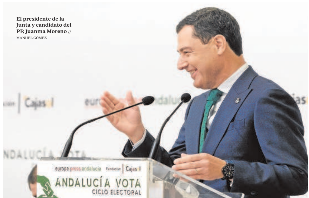
El presidente de la Junta y candidato del PP, Juanma Moreno