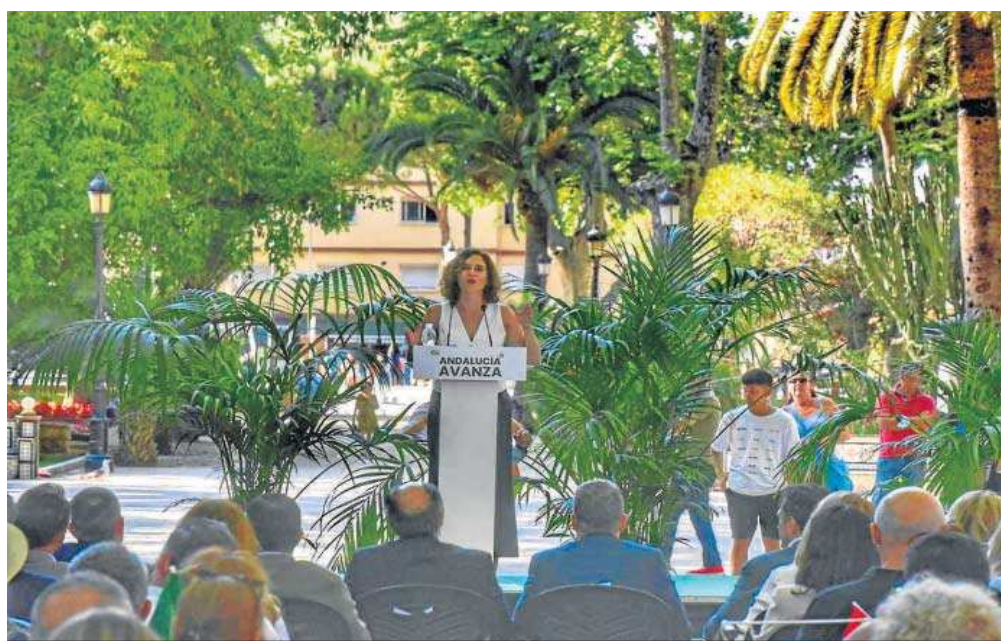
Isabel Díaz Ayuso, en el acto celebrado ayer en Algeciras.