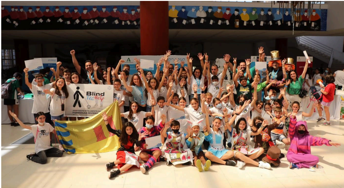
Los premios entregados en Málaga. ENDESA SUR