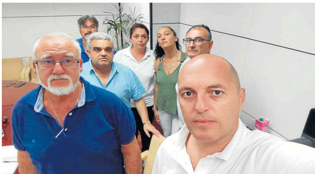
Representantes de los comités de Abengoa encerrados en la SEPI.