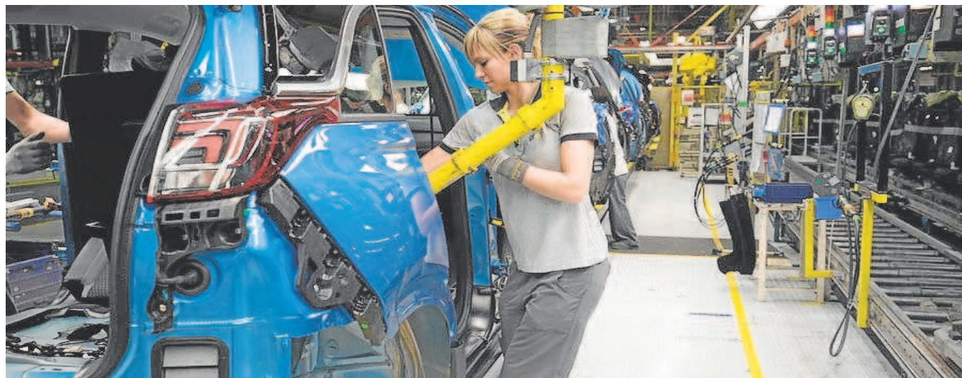
Trabajadores en una cadena de montaje de automóviles

millones es la cifra recaudada en 2021, reflejo de la caída de matriculaciones por la crisis del Covid-19