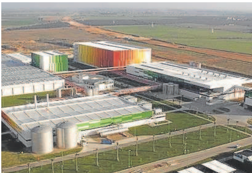
La fábrica de Heineken en Sevilla, junto a la cual se levantará la planta termosolar

«Estamos convencidos de que establecer sólidas alianzas público-privadas es el camino para llegar más lejos en nuestros ambiciosos objetivos de sostenibilidad para 2025, y este proyecto conjunto es un claro ejemplo de ello», explicó por su parte Etienne Strijp, presidente de la compañía Heineken España.