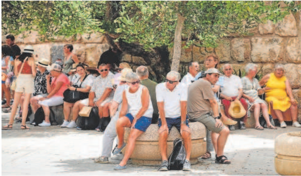
Un grupo de turistas se refugia del calor debajo de un árbol