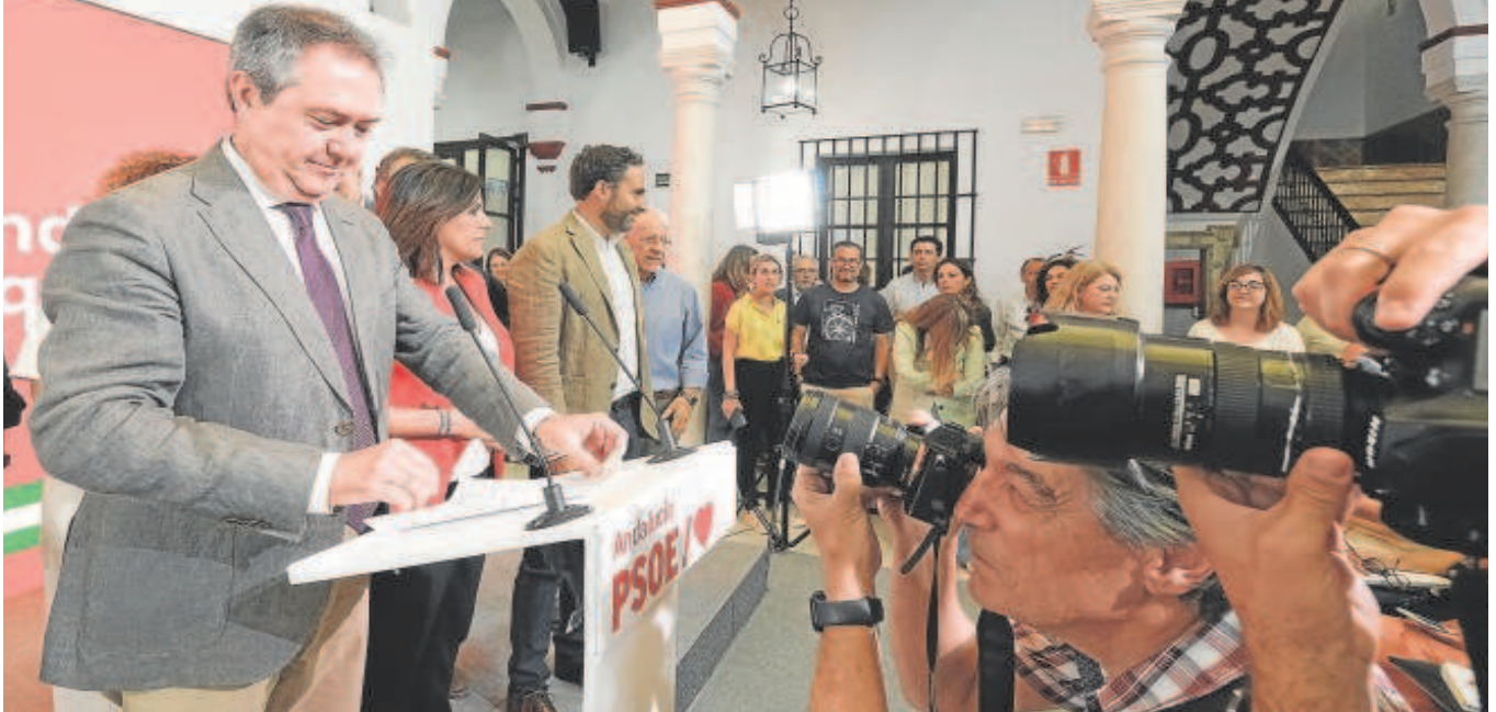
El secretario general del PSOE andaluz en su comparecencia en la sede regional del partido