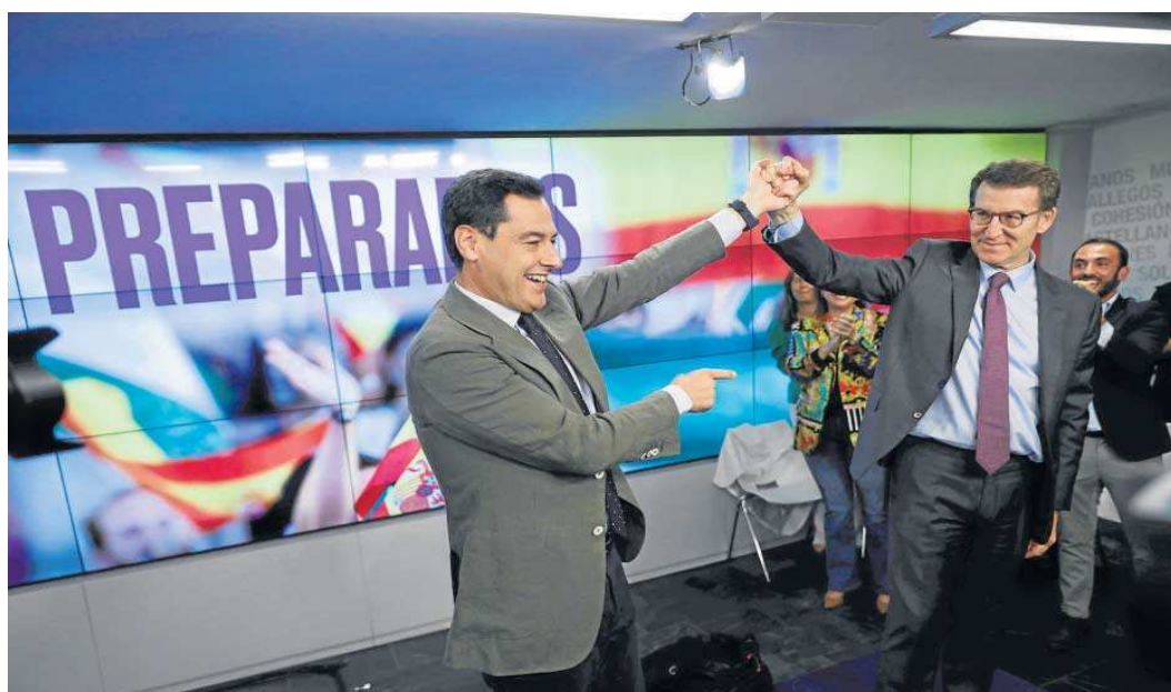
Juanma Moreno y Alberto Núñez Feijóo, en la junta directiva nacional del PP.

● Feijóo usa la victoria en Andalucía para plantear una política de “mayorías y centrada” frente a “la división y el radicalismo” ● Los populares defienden el inicio de un “cambio de ciclo”