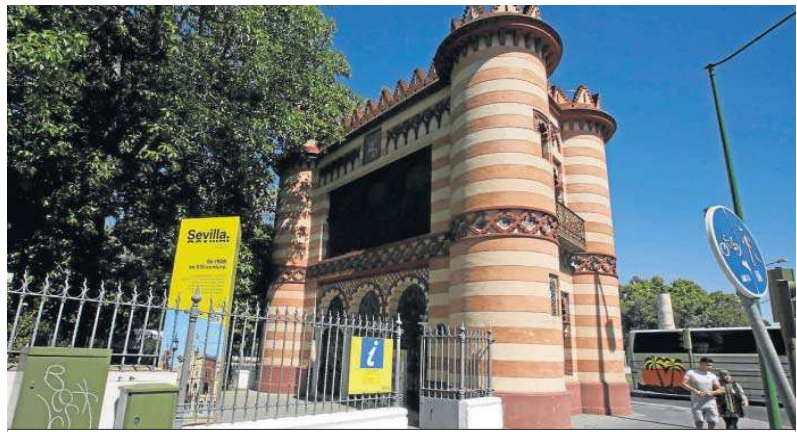
El punto de información turística en el Costurero de la Reina abrió sus puertas hace unos días.

Desde el inicio del proyecto, Contursa ha venido trabajando por la mejor solución del destino Sevilla y se han valorado diferentes escenarios, tanto para la mensajería (a través de los chats-box) como para la presentación de la información (cambio de folleto digital a formato QR). Otro aspecto importante que destacan es la necesidad de ampliar la huella turística a través de los puntos de información de atención al visitante para poder estar físicamente cercanos a ellos y ofrecerles mayores productos turísticos. Una camiseta, una joya inspirada en la obra de un artista como regalo o llevar en el bolso un llavero con un icono de diseño son algunos de los souvenirs que podrán encontrar los turistas.