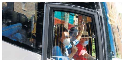
Protesta de transportistas en Córdoba.