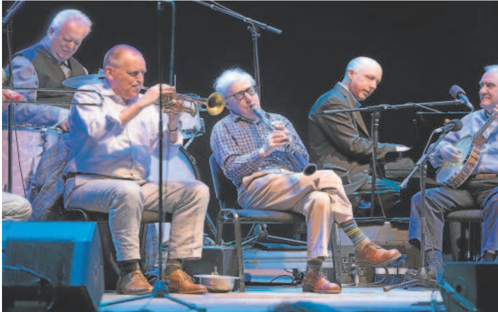
Woody Allen y su New Orleans Jazz Band, en una imagen de archivo de la actuación en Madrid en 2019