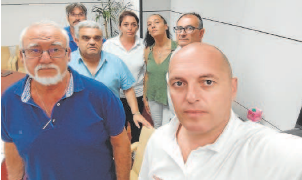
Representantes de UGT y de comités de empresa de Abengoa están encerrados en la SEPI para pedir el rescate