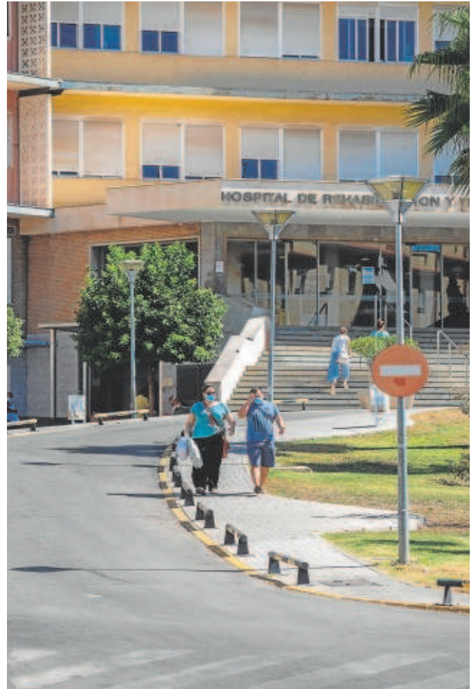
Varias personas en el Hospital Virgen del Rocío

En el distrito Sur (formado por 429.000 habitantes de las localidades