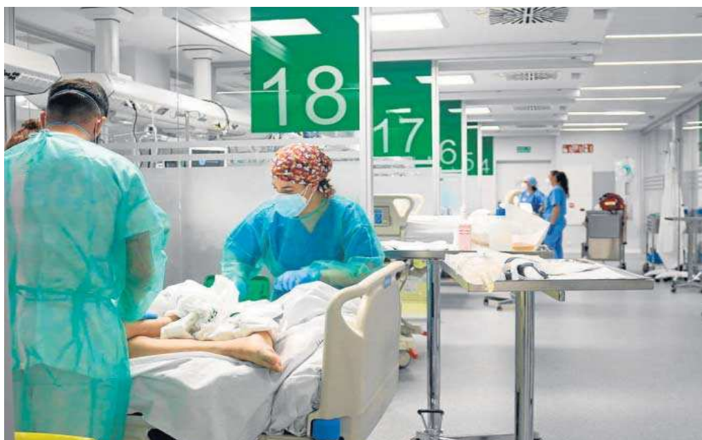
Personal sanitario en la UCI del Hospital de Emergencia Covid-19, en el antiguo Hospital Militar.

Estos datos reflejan que la protección de las vacunas, los nuevos tratamientos antivíricos y, por qué no, la menor virulencia de la variante Ómicron han mantenido a las unidades de cuidados intensivos lejos del colapso.