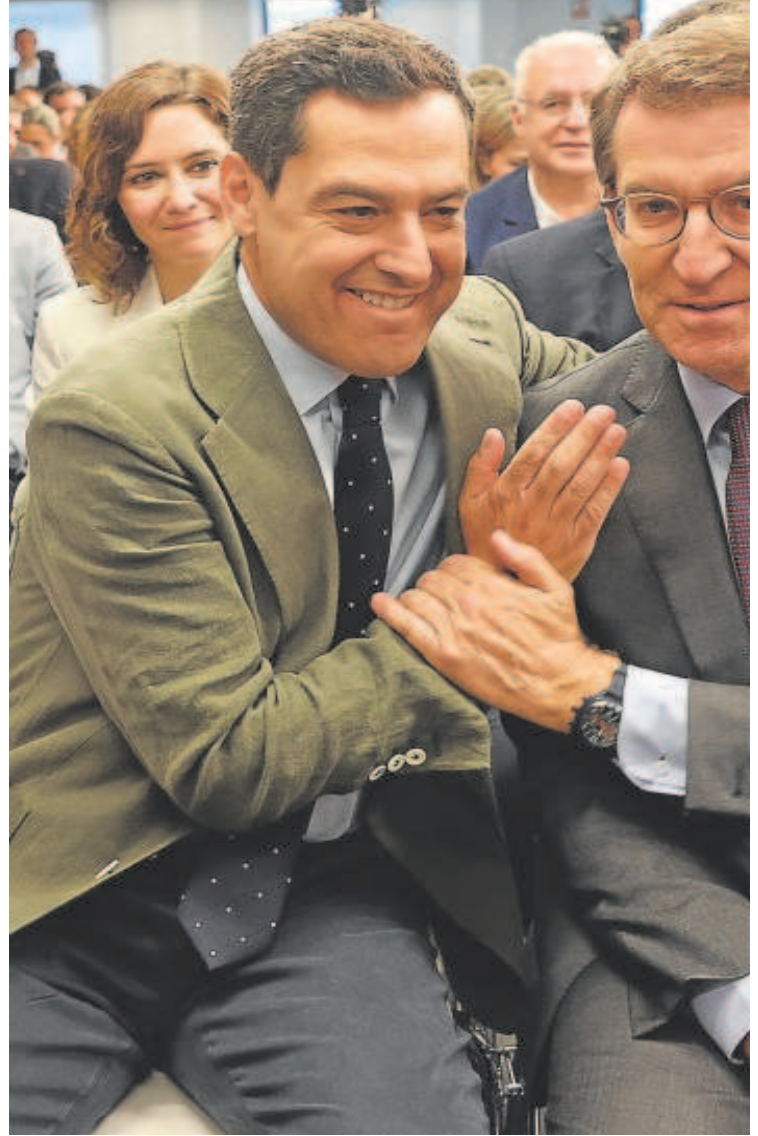
Juanma Moreno y Alberto Núñez Feijóo ayer en la Junta Directiva nacional del PP

Todas las palabras de Feijóo fueron un elogio al modelo de Moreno, que puso como referente y guía para todo el par-