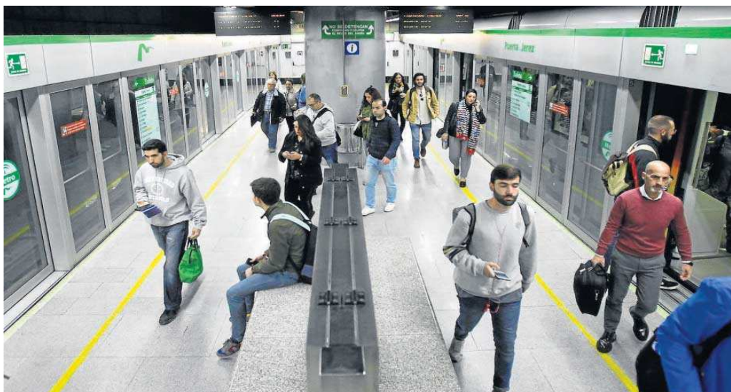
Viajeros del Metro en la línea 1.

● A los dos días del vuelco electoral en Andalucía, cierran la financiación y firmarán el convenio tras el verano ● El Ministerio acepta que la Junta pague su parte con fondos europeos Feder