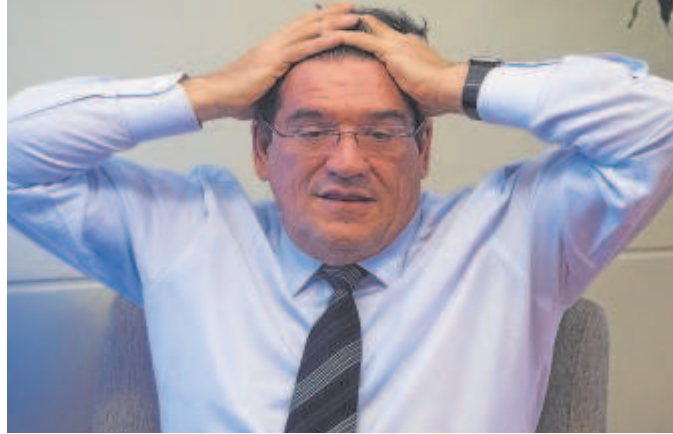
El ministro de Seguridad Social, José Luis Escrivá