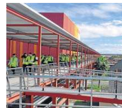
La fábrica de Heineken.

llegar más lejos en nuestros ambiciosos objetivos de sostenibilidad para 2025, y este proyecto conjunto es un claro ejemplo de ello”, señala por su parte Etienne Strijp, presidente de la compañía Heineken España.