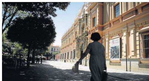
El Museo de Bellas Artes contará con un espacio de atención al turista.

Los técnicos de turismo realizan una petición: "Para poder adaptarnos a la importancia de la digitalización y la ampliación de la huella turística, sin el menoscabo del trabajo diario realizado por un personal ya escaso desde hace años por la jubilación y la huida de personal a otras áreas (como la Unidad de Tramitación de Turismo), nos encontramos con la imposibilidad de afrontar el nuevo escenario con los recursos existentes, por lo tanto, se hace necesaria la incorporación de cuatro informadores turísticos de apoyo al área de Atención al Visitante".