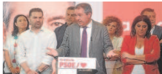
Análisis de Espadas el día después a las elecciones // J.M. SERRANO

Pueden dirigir sus cartas a ABC de Sevilla al correo electrónico cartas.sevilla@abc.es . Su extensión no debe exceder los 900 caracteres, con espacios. ABC se reserva el derecho de extraer o reducir los textos de las cartas cuyas dimensiones sobrepasen el espacio destinado a ellas.