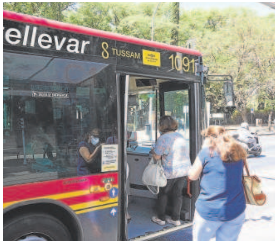
Varios usuarios suben a uno de los autobuses de Tussam