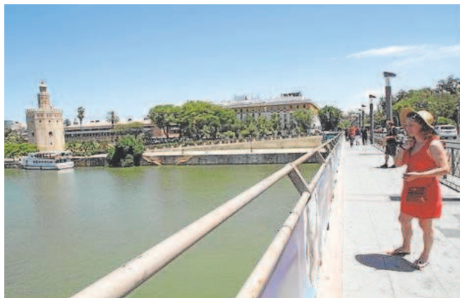
Una chica contempla el Guadalquivir desde el Puente de San Telmo