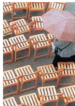
Sillas de la carrera oficial.

El alcalde también destacó que en 2016, siendo ministro de Hacienda el popular Cristóbal Montoro, el Gobierno decidió recurrir la decisión del Teara, cuando dicho tribunal se mos-