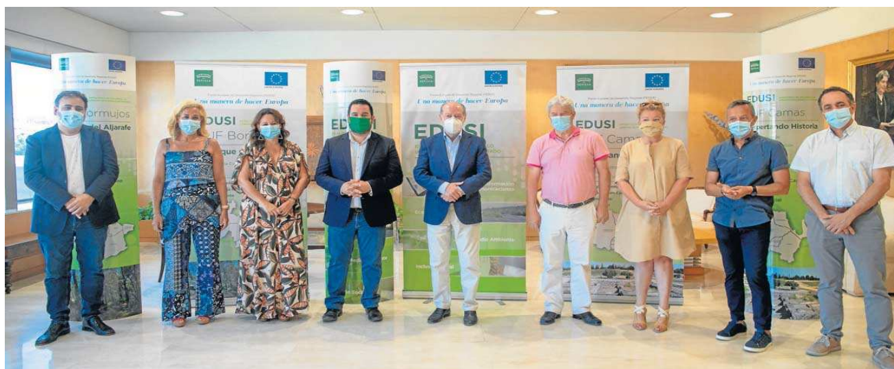
Foto de familia de la presentación con el presidente de la Diputación de Sevilla, Fernando Rodríguez Villalobos, en el centro.

Nuevas obras. Llegan próximas actuaciones en las localidades sevillanas dentro del marco de las Estrategias de Desarrollo Urbano Sostenible e Integrado, financiadas con fondos Feder