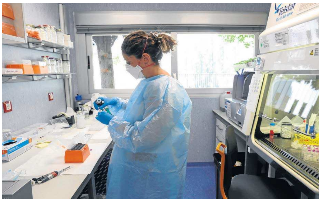
Una investigadora examina una muestra en el Centro Nacional de Microbiología, el organismo donde se efectúa un mayor número de secuenciación del virus.

● Andalucía ha secuenciado 54 positivos, 12 más que los contabilizados en el informe de la semana pasada ● Los 33 casos que se investigan duplican a los del registro anterior