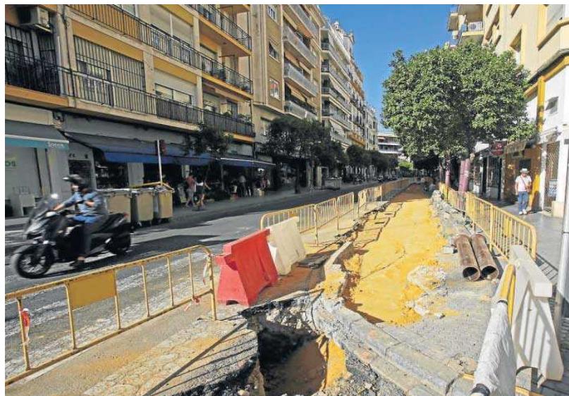
Obras que se acometen en la calle Canalejas.

Unas restricciones que anticipan el cierre al tráfico privado del centro de la ciudad, el cual empezará a aplicarse en pocas semanas cuando entre en vigor el polémico Plan Respira, que recupera el espíritu del Plan Centro que puso en marcha durante el último mandato de Alfredo Sánchez Monteseirín. Este proyecto fue derogado al poco de llegar Juan Ignacio Zoido a la Alcaldía.