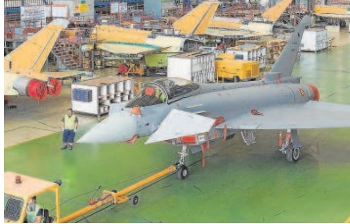
Nave de ensamblaje del Eurofighter en las instalaciones de Airbus en Getafe