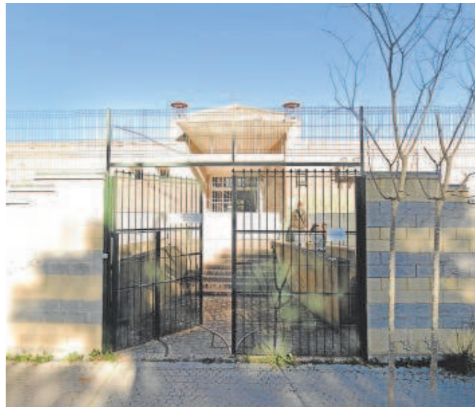
La anterior sede de AVRA en el Polígono Sur tuvo que cerrar

«Las plantaciones de marihuana y las mafias que las controlan han dinamitado por completo el barrio. Nuestra oficina llevaba años funcionando allí y la situación se ha vuelto insostenible. Los cortes de luz afectan sobre todo en las épocas de frío y de calor y es cuando se acercaban a nuestras instalaciones grupos organizados de vecinos a increparnos. Es necesaria una intervención integral, profunda y que compete