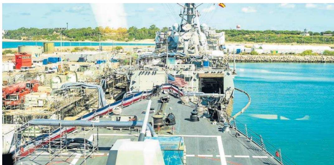
ARMADA / MOISÉS SANZ

UN NUEVO DESTRUCTOR EN ROTA. El destructor USS Paul Ignatius está en la Base de Rota, el tercer relevo entre los buques del escudo antimisiles que EEUU renueva desde 2020. Su llegada coincide con el establecimiento en la base de un nuevo escuadrón de helicópteros que moderniza este sistema de defensa para interceptar misiles enemigos antes de que lleguen a su destino. /A. R.