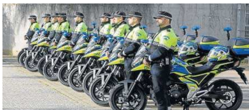
Agentes de la Policía Local junto a las nuevas motos adquiridas recientemente. JOSÉ ÁNGEL GARCÍA

En concreto, son 45 plazas correspondientes a Policía Local y 29 al servicio de Bomberos, 39 para peones y 43 para administrativos y técnicos administrativos, entre otras. La cifra total ofertada supera en 26 el número de vacantes de 2021 y los primeros cinco meses de 2022.