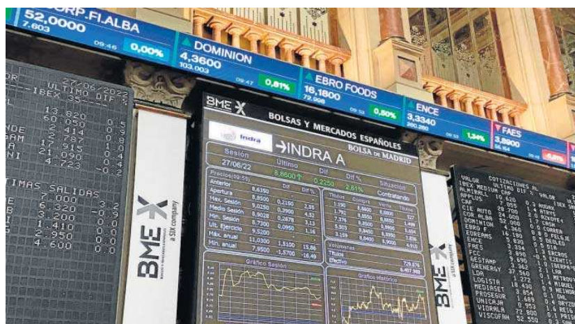
La Bolsa de Madrid, ayer.