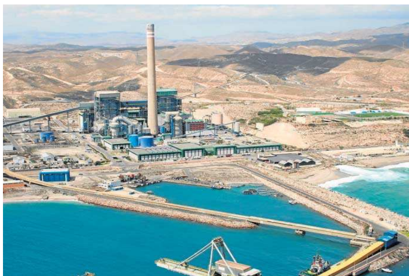
Central térmica Litoral, de Carboneras.

El control de la contaminación atmosférica cuenta con unos límites y valores objetivo legales marcados por la Directiva 2008/50/CE y el Real Decreto 102/2011 para "evitar, prevenir o reducir los efectos nocivos para la salud humana y el medio ambiente". Ese es el marco legal que rige en España y sobre esos valores se ha constatado una importante reducción. Pero la Organización Mundial de la Salud revisó en 2021 sus directrices sobre la calidad del aire, marcando los niveles a partir de los cuales se considera que la contaminación es perjudicial para la salud, unos valores que son mucho más estrictos. Y al comparar los datos recopilados se constata, una vez más, que la presencia de contaminantes sobrepasa