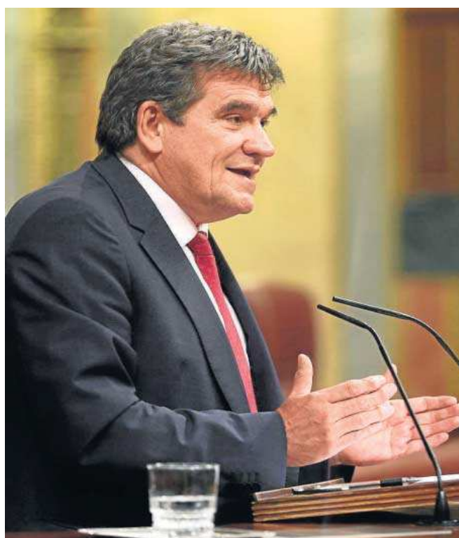
José Luis Escrivá, el pasado miércoles en el Congreso.

En los escalones inferiores, la idea con la que se busca cerrar un complejo acuerdo tras meses de