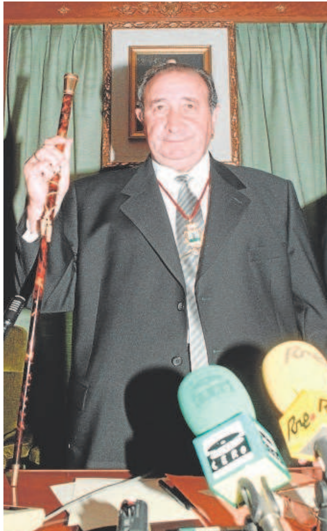
Jesús Gil fue alcalde de Marbella entre 1991 y 2002

La alcaldesa quiere evitarlo a toda costa. «Ahora se acuerdan de desempolvar el tema de Gil. Su idea es venir 32 años después a decir que imponen la normalidad y la legalidad que Jesús Gil infringió. No conocen la realidad de Marbella», reprocha la alcaldesa.