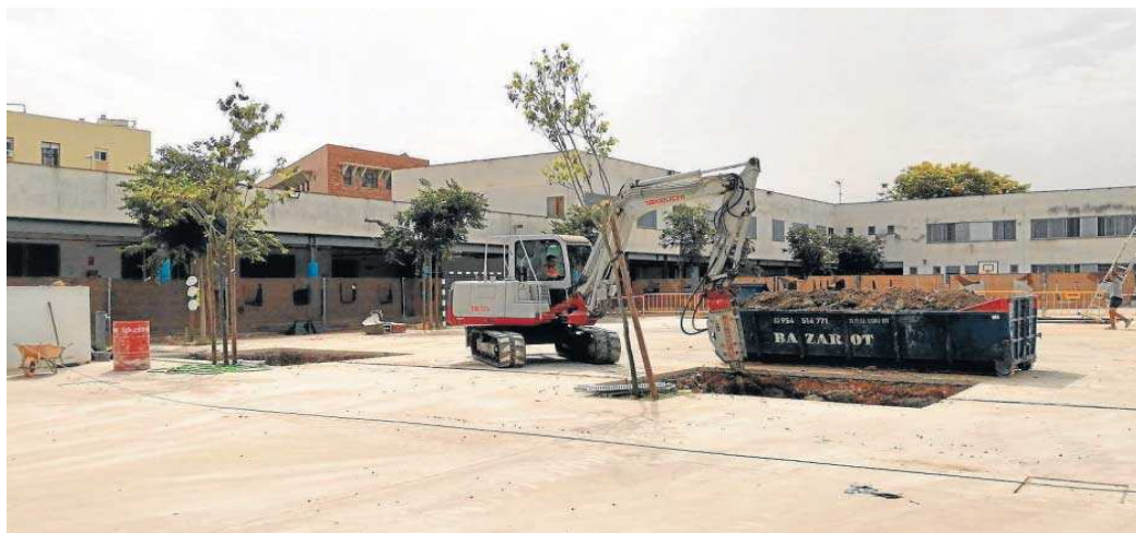
Una de las obras que está ejecutando la Agencia de Educación para bioclimatización y renovables en el CEIP Marie Curie de Sevilla.