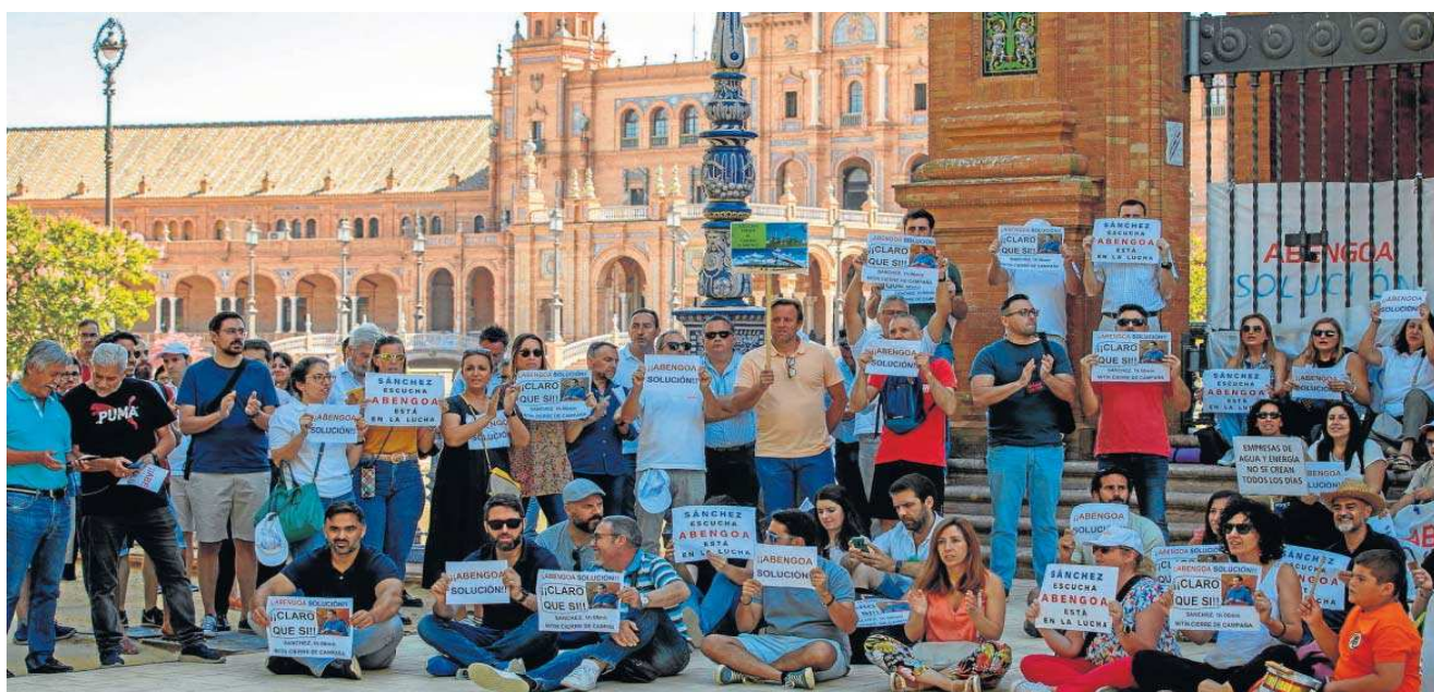
Concentración de trabajadores de Abengoa y familiares, ayer ante la sede la Delegación del Gobierno de Andalucía en la Plaza de España en Sevilla.