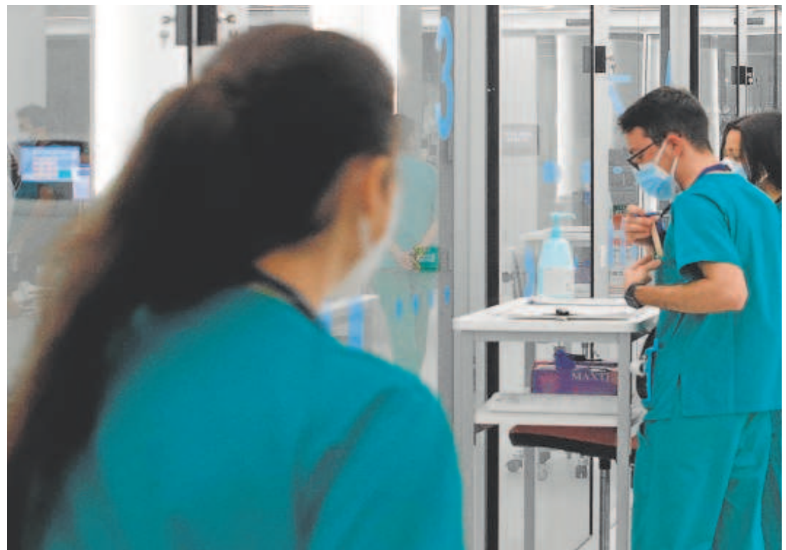
Profesionales sanitarios en la UCI pediátrica del hospital Reina Sofía de Córdoba