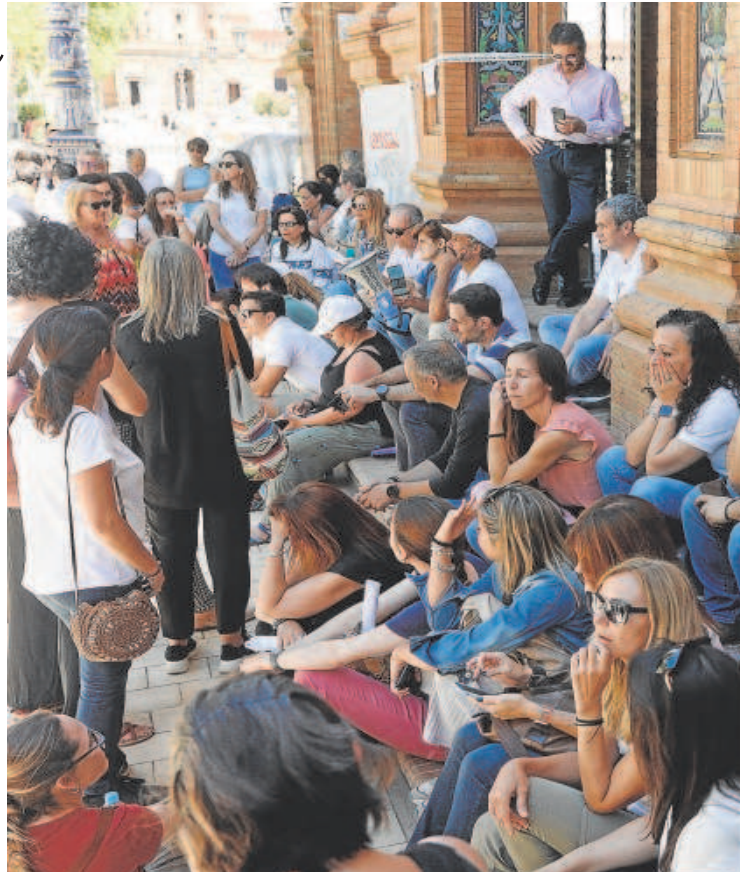
Trabajadores de Abengoa han acampado en la delegación del Gobierno en

Se barajan diversas hipótesis sobre que ocurrirá con el grupo Abengoa, que tiene 200 empresas y 11.000 empleados, si la SEPI no aprueba antes del 30 de junio el crédito de 249 millones de euros que ha pedido para garantizar su viabilidad. Ese día no sólo acaba la validez de la oferta de compra de Abengoa por parte del fondo TerraMar, sino que expira la moratoria concursal, que hasta