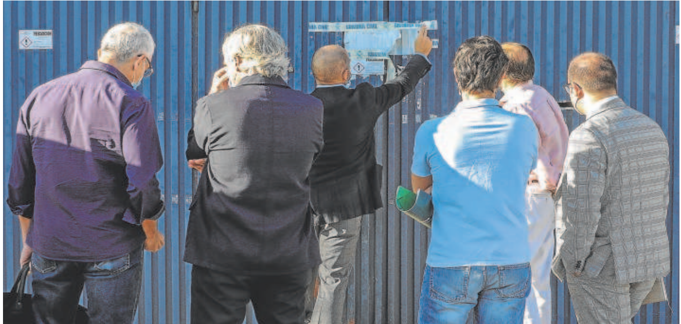
Inspección judicial realizada en la fábrica de Magrudis, foco del brote de listeriosis, en septiembre de 2019 // RAÚL DOBLADO