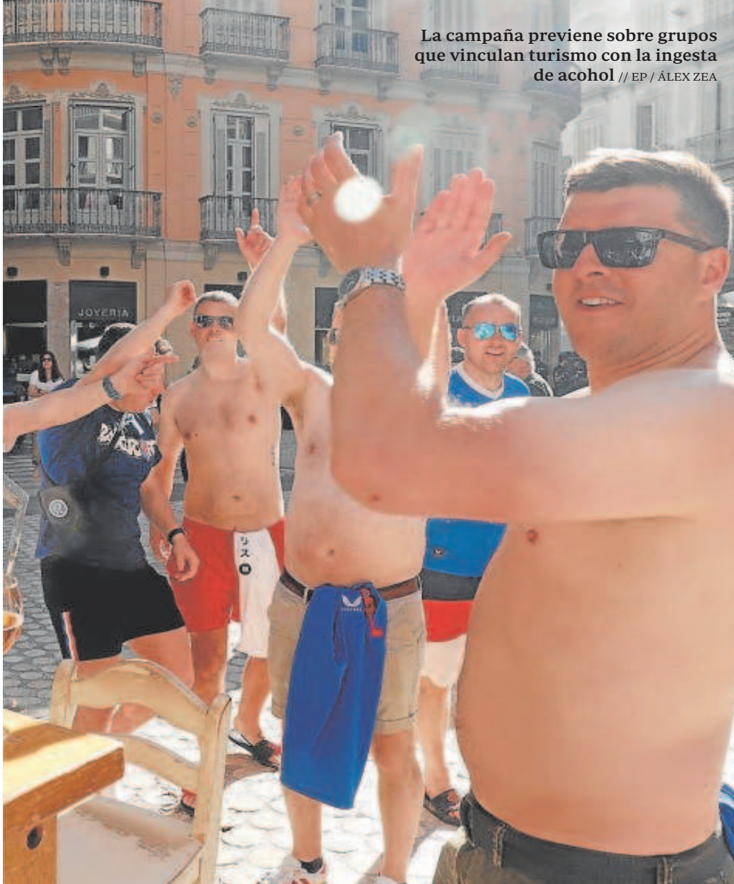
La campaña previene sobre grupos que vinculan turismo con la ingesta de alcohol

tos de la máxima calidad, con un servicio inmejorable».