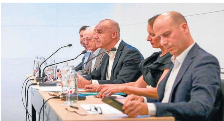
El alcalde Antonio Muñoz en su intervención en la Asamblea del Círculo de Empresarios de la Cartuja, ayer.

Igualmente, el alcalde indicó que próximas actuaciones en conservación del viario con una inversión de 350.000 euros para la mejora de asfaltado en el en-