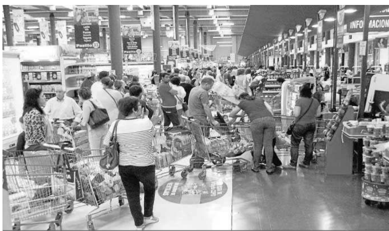
La cesta de la compra es de lo que más ha sufrido la subida de los costes.

La tasa general del IPC mantiene la senda alcista que comenzó en marzo de 2021 y que solo quedó interrumpida en enero, cuando se moderó 4 décimas hasta el 6,1%, y en el mes de abril, cuando bajó un punto y medio, hasta el 8,3%. El nivel de junio rompe el máximo registrado el pasado marzo del 9,8% y supera la barrera de las dos cifras.