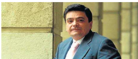
El magistrado Rafael Tirado Márquez.