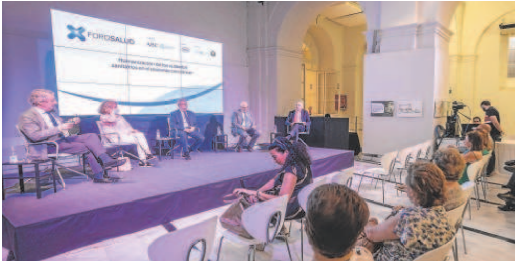
El Foro Salud celebró su primera edición presencial en La Galería de ABC