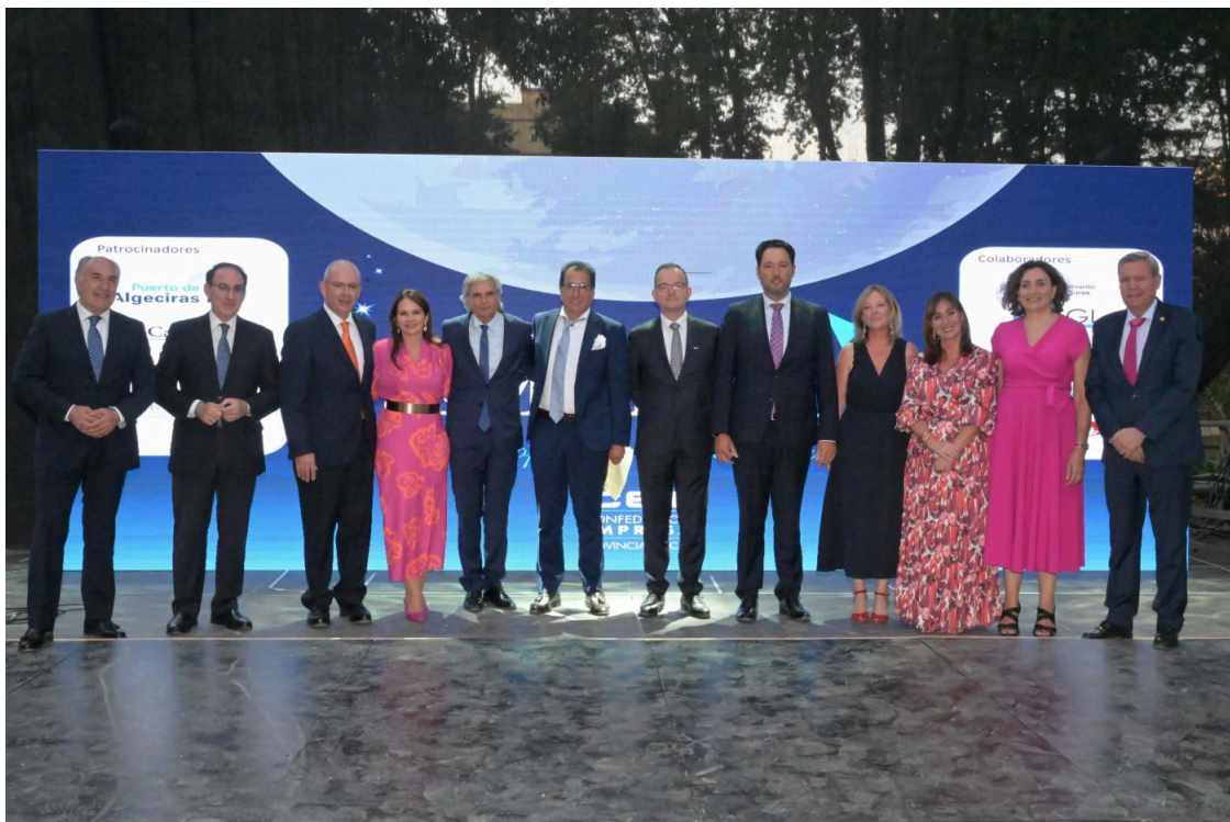
Noche de la Empresa de la CEC en Algeciras 2022. AI

La Confederación de Empresarios de la provincia de Cádiz (CEC) ha congregado esta noche en el Parque María Cristina de Algeciras a más de 650 personas en la cuarta edición de la Noche de la Empresa, alrededor del reconocimiento a la importancia que tienen las empresas de cara a la mejora de la sociedad, la generación de empleo, riqueza y contribución al desarrollo económico.