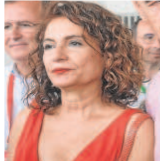
María Jesús Montero

«Esta decisión hace daño a la economía española y andaluza», recalcó Bendodo en la rueda de prensa posterior al Consejo de Gobierno celebrado ayer en Sevilla. El también consejero de la Presidencia en funciones advirtió de que la ministra de Hacienda, María Jesús Montero, «miente y no es la primera vez» al defender, en el Congreso de los Diputados, que Abengoa podría estar reflotada si la Junta le hubiese concedido los 20 millones de euros solicitados y que le fueron denegados. «No entendemos que una andaluza quiera castigar a Andalucía», le afeó. «¿Va a depender el rescate de Abengoa de los 20 millones de la Junta y no de los 249 millones que iba a