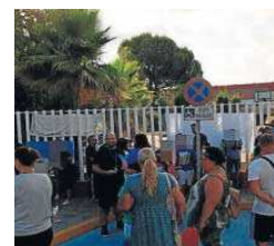
Protesta en el CEIP Hernán Cortés.

cos de la provincia que este curso cumplieran mandato, una cifra que avala el buen trabajo realizado por estos profesionales y por los equipos directivos educativos en la provincia.