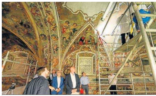
El alcalde, durante su reciente visita a la Capillita de San José.

La colaboración entre el Ayuntamiento y los capuchinos para restaurar la Capillita de