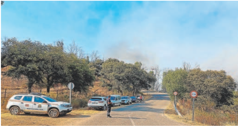
Las llamas obligaron a desalojar a ciento veinte vecinos de las urbanizaciones colindantes