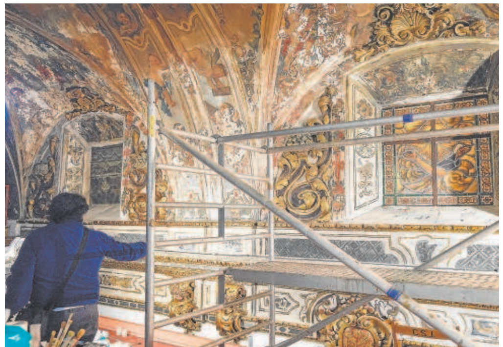
Las pinturas murales y los elementos decorativos de la nave central de la capilla están siendo atendidos

El 26 de mayo de 2021 se firmó un segundo convenio con un importe de 275.000 euros para la financiación de las obras correspondientes al «Proyecto reformado del proyecto básico de las obras de consolidación estructural y de las pinturas murales de la Capilla de San José en calle Jovellanos». Es un proyecto que prevé la restauración integral de la capilla pero en distintas fases. El avance de estos trabajos ha permitido ya la reapertura de la capilla.