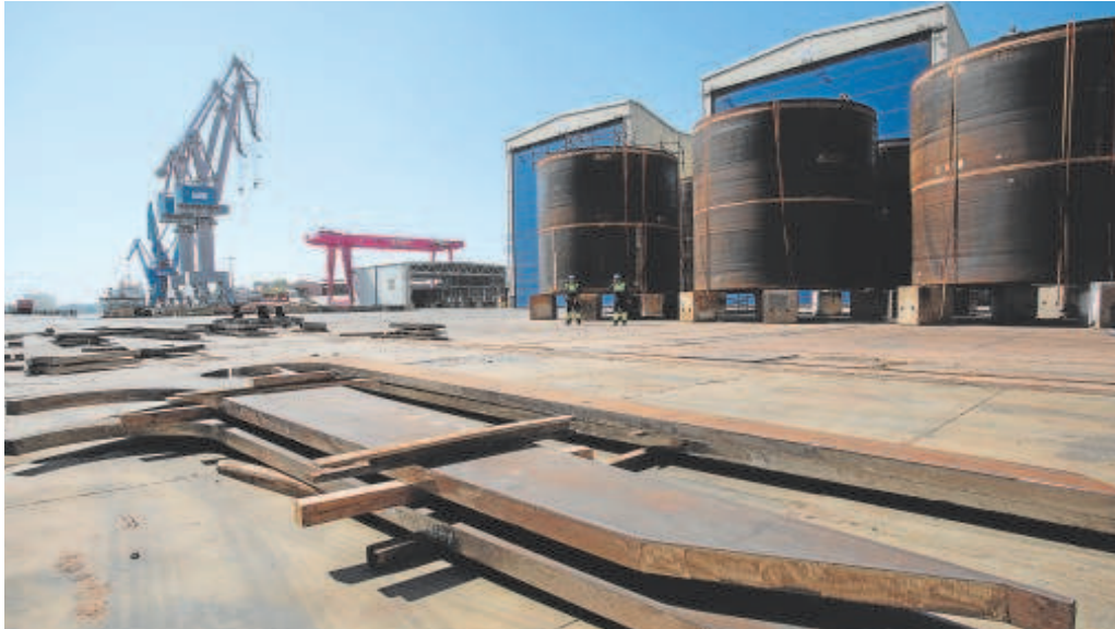
Imagen del Polígono Astilleros, en el que se instalará esta planta