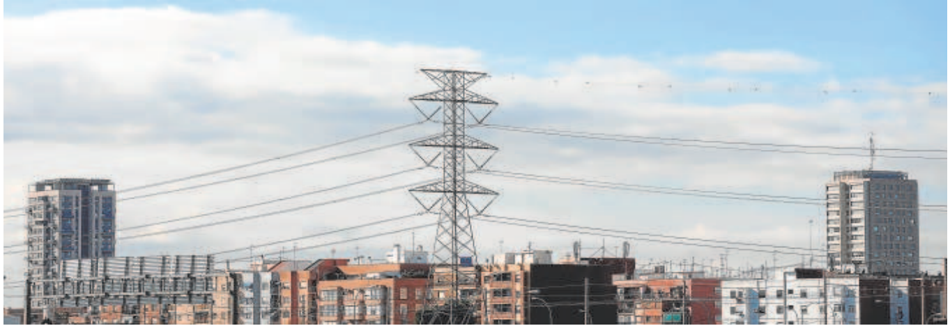
Vista general de una torre de alta tensión en Valencia