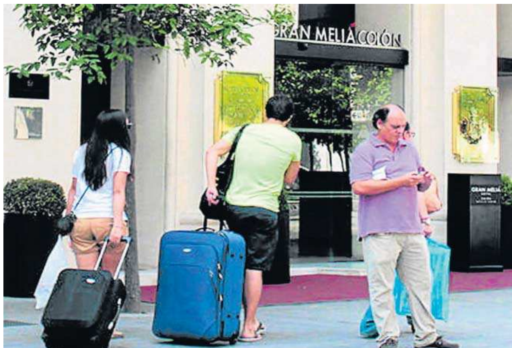
Dos turistas caminan hacia la entrada de un hotel en Sevilla.