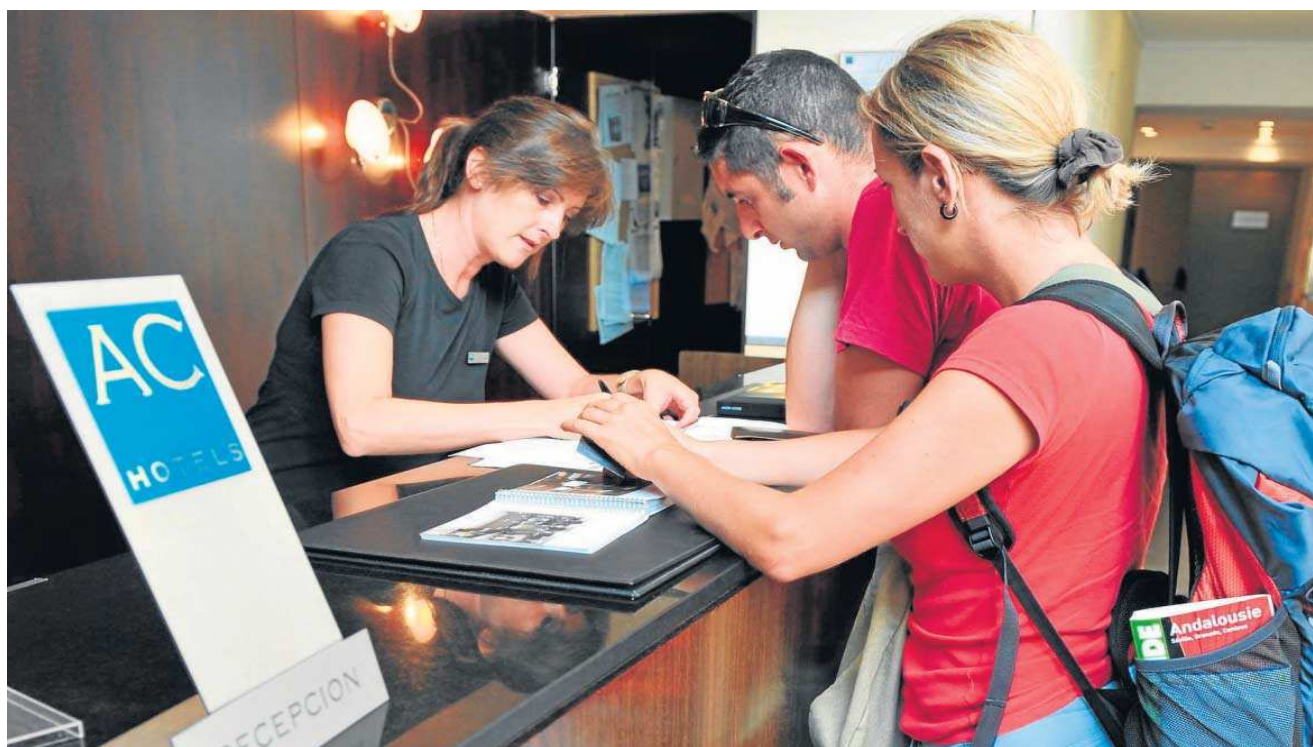
La tasa turística se ha implantado los últimos años en la práctica totalidad de las grandes capitales europeas.