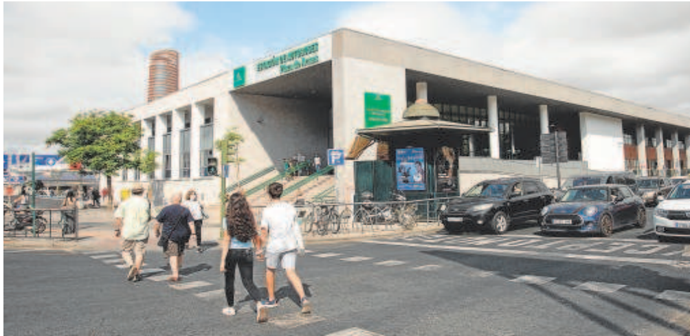
Las nuevas actuaciones en la estación serán en la fachada y en las cubiertas