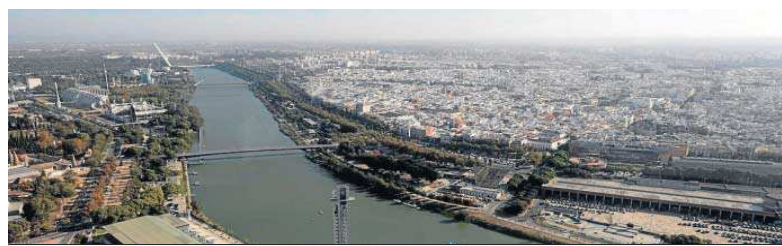
Vista aérea de la ciudad de Sevilla, sobre la que se habla en el dictamen del Consejo Económico y Social.

–Sobre el uso de la energía, cuestión directamente relacionada con la movilidad, se queja de que no hay ninguna mención al uso y dependencia de la ciudad respecto a las fuentes de energía, ni a su impacto socioeconómico. Y concluye que “no