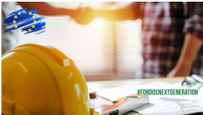
Apuesta de Unicaja Banco por la eficiencia energética