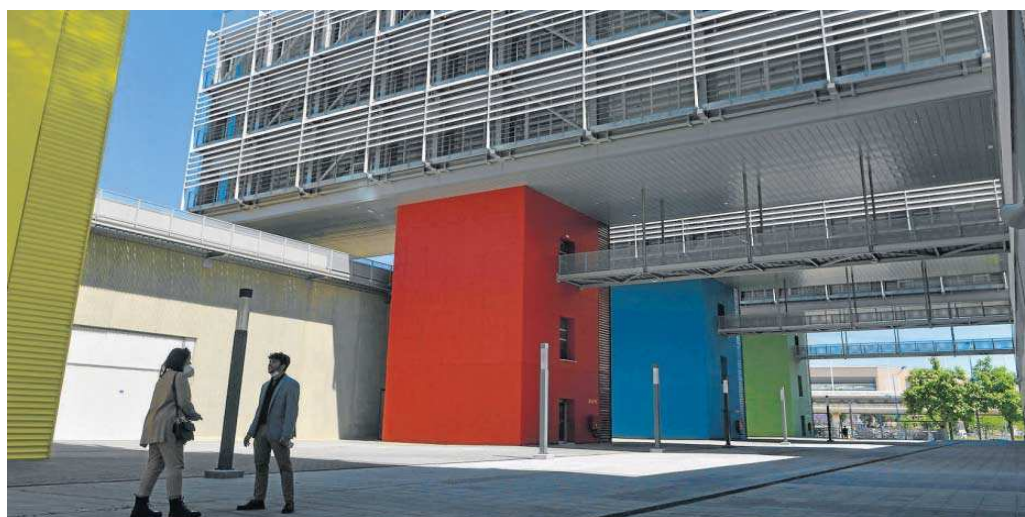
Las instalaciones del Cateps, en la Cartuja, destinadas a labores de investigación.

● La ampliación de Farmacia y la reforma de Medicina se empezarán a acometer en 2024 ● El traslado de la Politécnica está previsto para 2023