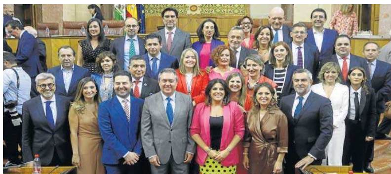
Foto de familia del grupo parlamentario socialista.