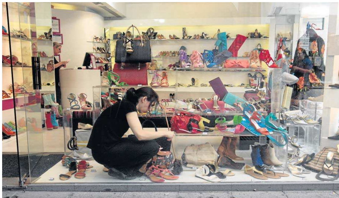
Trabajadora de un comercio en Sevilla.