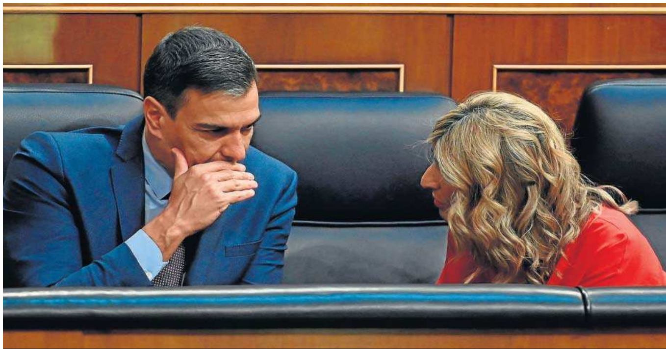
El presidente del Gobierno, Pedro Sánchez, charla ayer en su escaño con la vicepresidenta segunda, Yolanda Díaz.