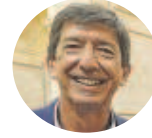
Juan Marín Ciudadanos

«Pondremos voz a todos los colectivos y conflictos andaluces»