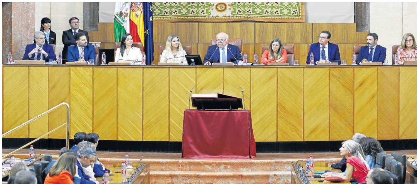
La nueva Mesa del Parlamento andaluz, ayer recién constituida.