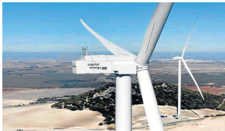
Imagen de los molinos instalados por Capital Energy en Lebrija y que están pendientes de autorizaciones.

Desde Capital Energy confirmaron que una vez que se ha superado “este importante hito administrativo, tanto estos proyectos renovables como su infraestructura de evacuación encaran el tramo final