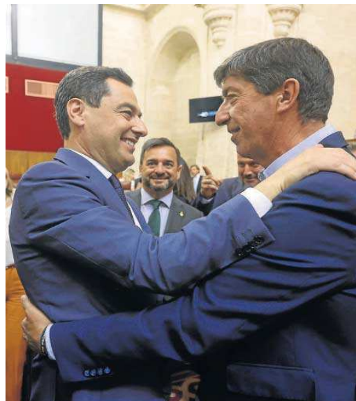
Juanma Moreno y Juan Marín, ayer.