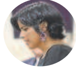
Teresa Rodríguez Adelante Andalucía

«No vamos a renunciar a hacer política y propuestas»