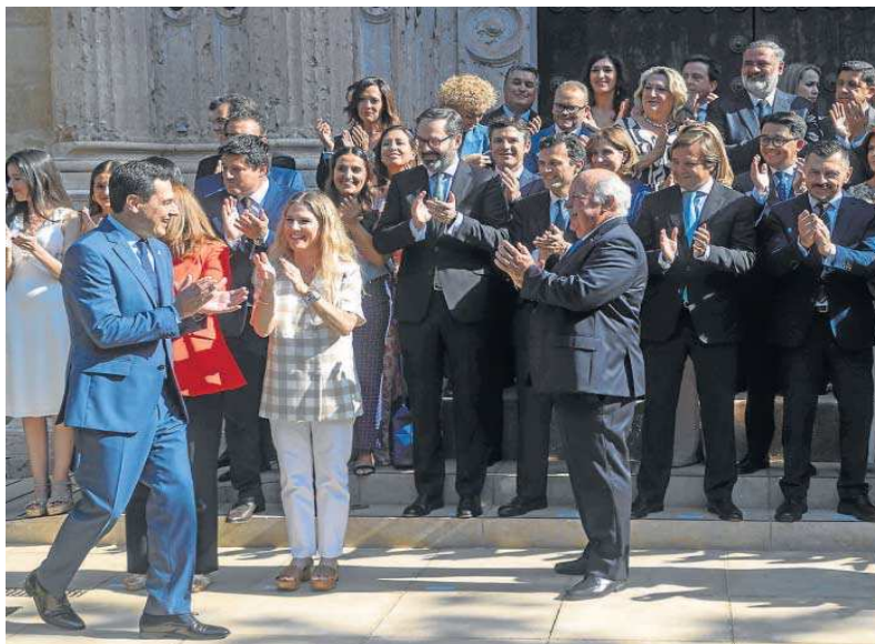
El grupo parlamentario popular aplaude a Juanma Moreno a su llegada.