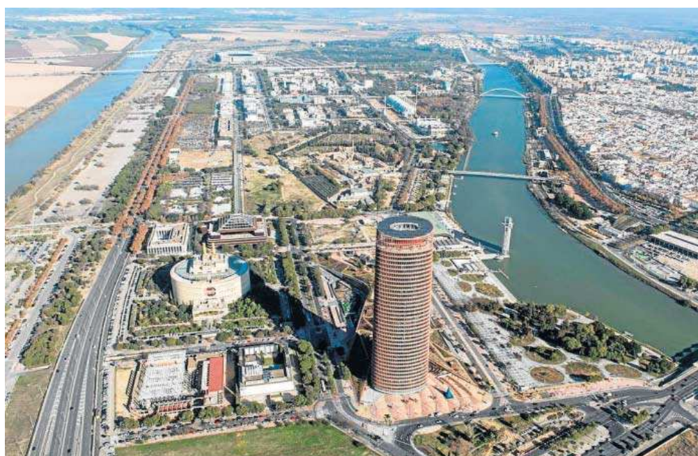
Una vista del Parque Científico Tecnológico (PCT) Cartuja.

Todas ellas se suman a empresas como Innovatecnic XXI (Novatecnic), Woodswallow, Adwalk Tech (Quodus), Secmotic Innovation, Verificaciones Industriales de Andalucía (Veiasa), CreaFab3D, Avante Formación, Extravaganza Communication, Semic, CWT Global España y Restaurantes Cartuja, todas ellas incorporadas al proyecto por la última Comisión, en noviembre de 2021.