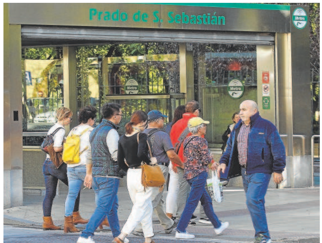
Los usuarios diarios de la Línea 1 del Metro de Sevilla rozaron los 60.000 durante el mes de junio