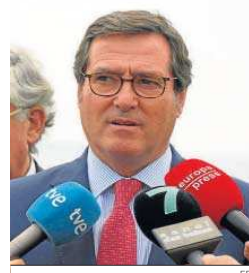
Antonio Garamendi (CEOE).

“El problema es la inflación que ahora tenemos, hay un problema