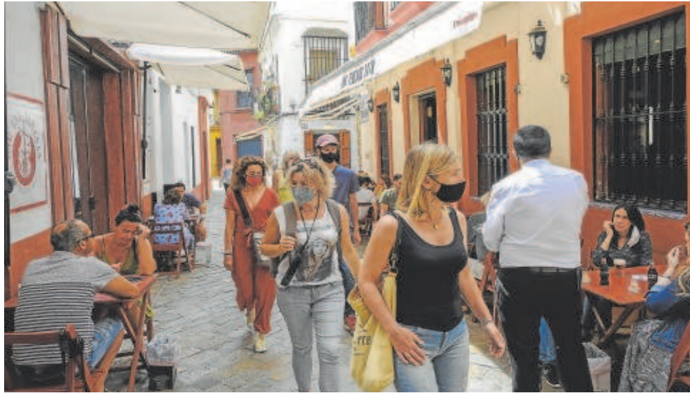
La asociación de la hostelería sevillana asegura que esa medida aún no existe en la ciudad // RAÚL DOBLADO