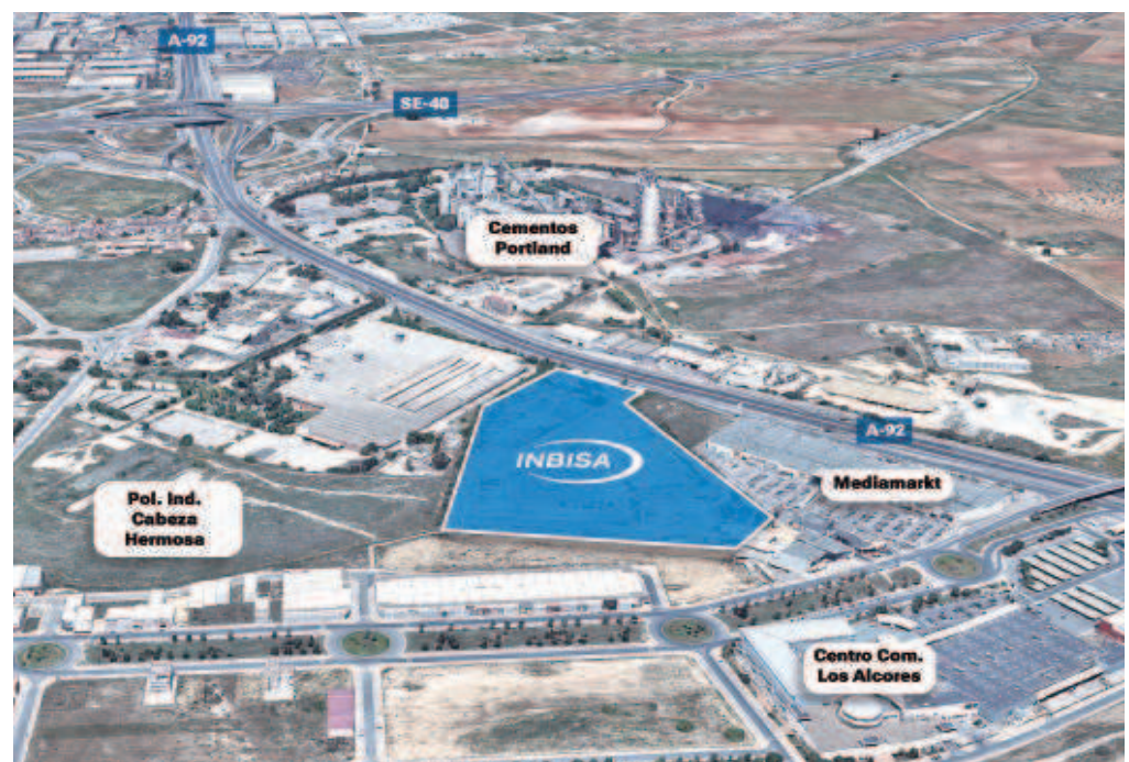
Espacio que ocupará el centro logístico en Alcalá