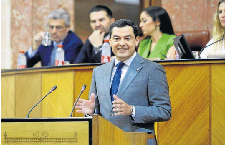
El presidente y candidato a la Presidencia de la Junta, Juanma Moreno, durante su discurso.

Raquel Montenegro Servicios públicos, reforma fiscal, simplificación administrativa y la nueva economía verde. Esos son los cuatro ejes en los que el candidato a la Presidencia de la Junta de Andalucía, Juanma Moreno, asegura que basará la nueva legislatura, la de la mayoría absoluta del PP que él prefiere denominar una "nueva mayoría", al igual que su Gobierno será el "de la confianza". Moreno desgarnó ayer algunas líneas básicas de su hoja de ruta para los próximos cuatro años en un discurso sosegado, en el que anunció sus medidas estrella, entre ellas una reforma fiscal que tendrá un impacto de 260