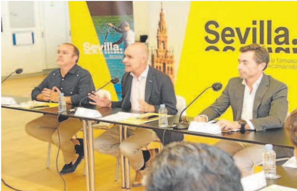
El alcalde de Sevilla presidió la reunión junto al delegado de Economía y al gerente de Contursa// JUAN FLORES