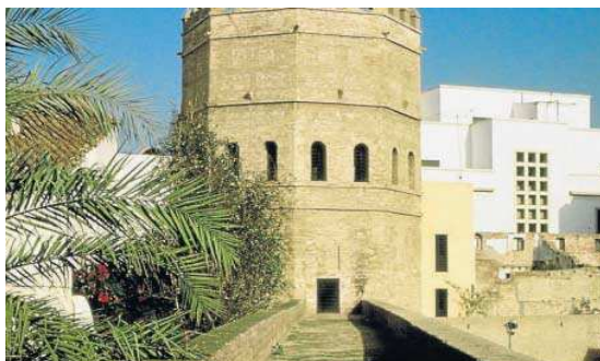
El paseo de ronda de la muralla que desemboca en la Torre de la Plata.