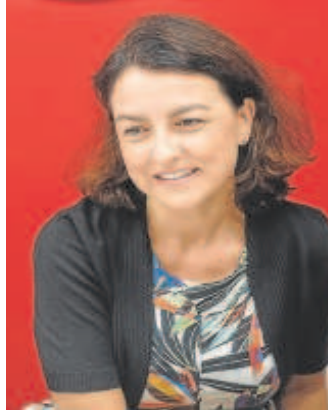
Eva Granados // ABC