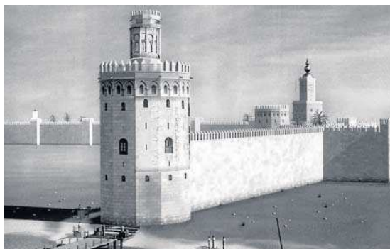
Recreación de la muralla de la ciudad en época almohade donde se observan las torres del oro, de la plata y el lienzo de muralla.