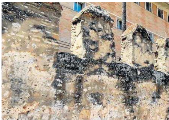
El lienzo de muralla sobre el que se está actuando.

Tolosa, en 1212, los musulmanes se dieron cuenta que tenían que defender mejor la ciudad. Para ello, amplían las murallas y construyen un nuevo lienzo en el barrio del Arenal, punto débil de Sevilla, que corta perpendicularmente al río, donde se construye en 1221, la torre albarra, llamada del Oro.