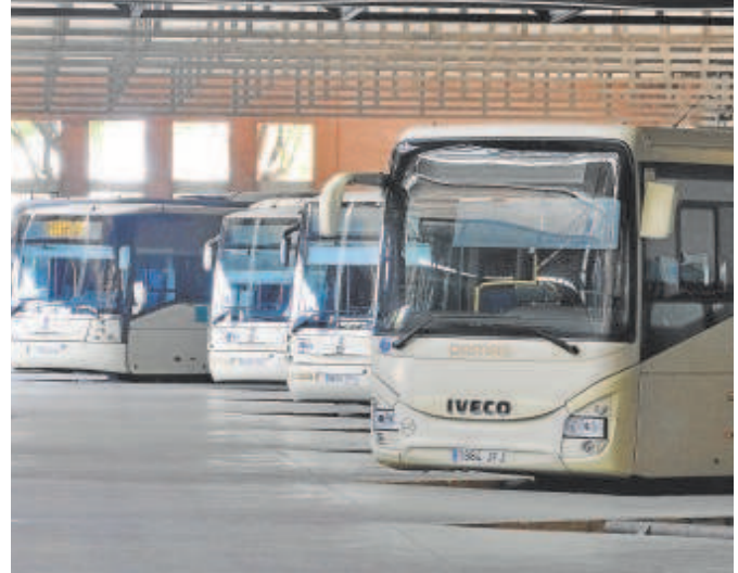
Estación de autobuses en Sevilla

El Gobierno ha prometido al sector que le dará incentivos si la iniciativa lastra su actividad en determinados