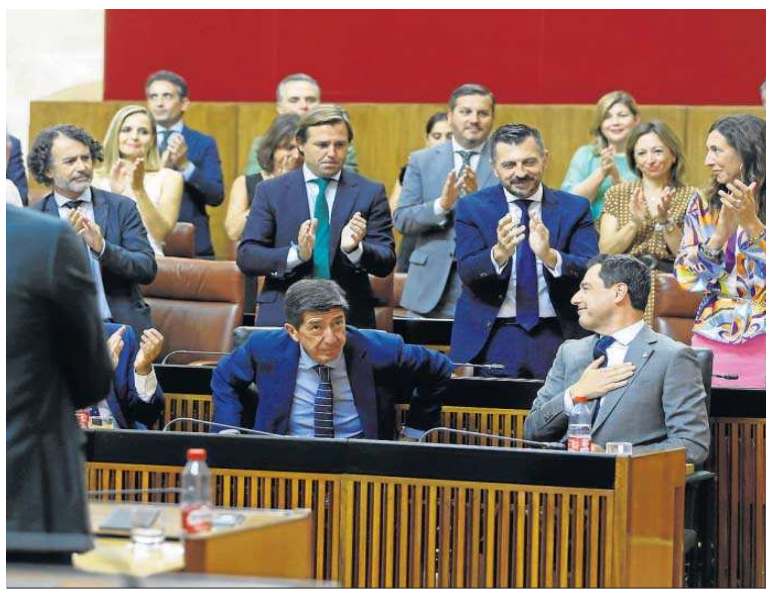
El grupo parlamentario popular aplaude a Juanma Moreno a su llegada.

Aquí se incluyen también las actuaciones a abordar en el marco de "la legislatura del agua", entre ellas buscar una solución "definitiva, clara y legal" para los agricultores de la Corona Norte de Doñana, el plan de regularización de los regadíos que amenaza con dejar una sanción europea a España por la desprotec-