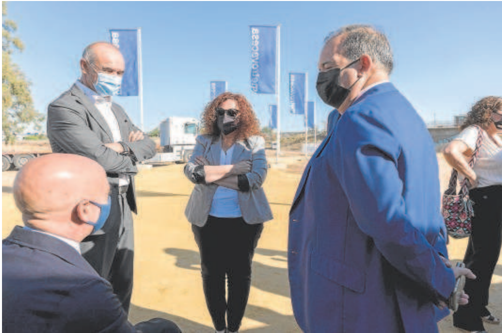
El alcalde y responsables de Metrovacesa, en la zona donde se construirá la primera promoción