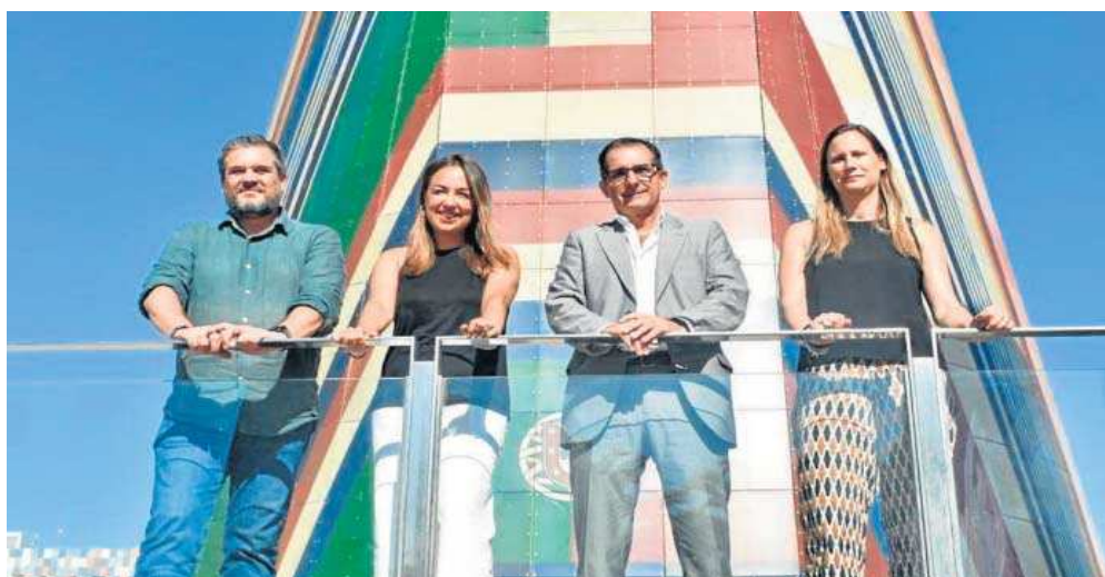
Los representantes de UNEI y el PCT Cartuja tras el encuentro en el que se ha acordado la colaboración.

● UNEI es la compañía que trabajará en el grupo de digitalización