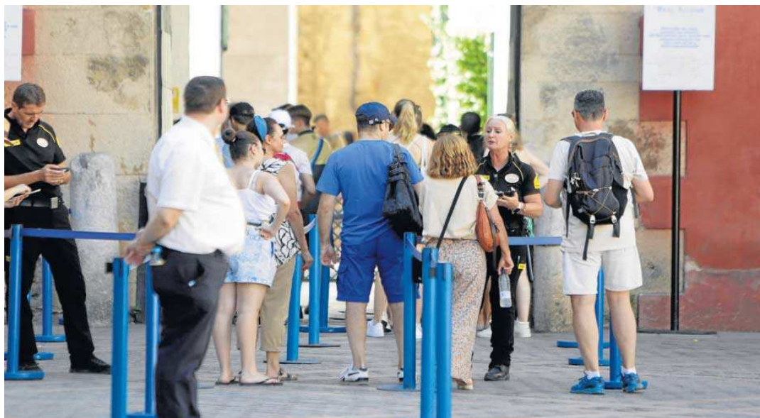
Turistas esperan para entrar en el Alcázar de Sevilla, uno de los monumentos más visitados de España.