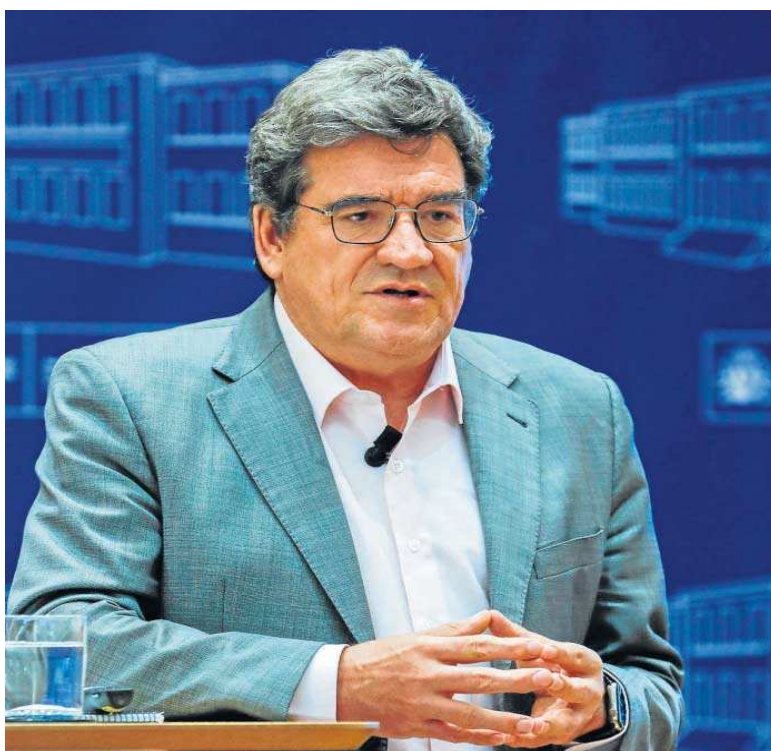
José Luis Escrivá, ministro de Inclusión, Seguridad Social y Migraciones.

También reduce la cuota a 240 euros para los que ingresen entre 670 y 900 euros; a 260 euros para