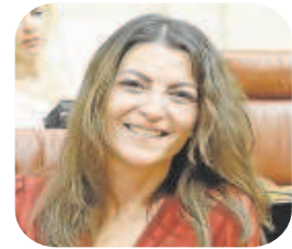
Macarena Olona Vox

«Moreno ha pasado muy por encima de los problemas»