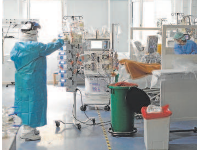
Sanitarios en el hospital Cruz Roja de Córdoba