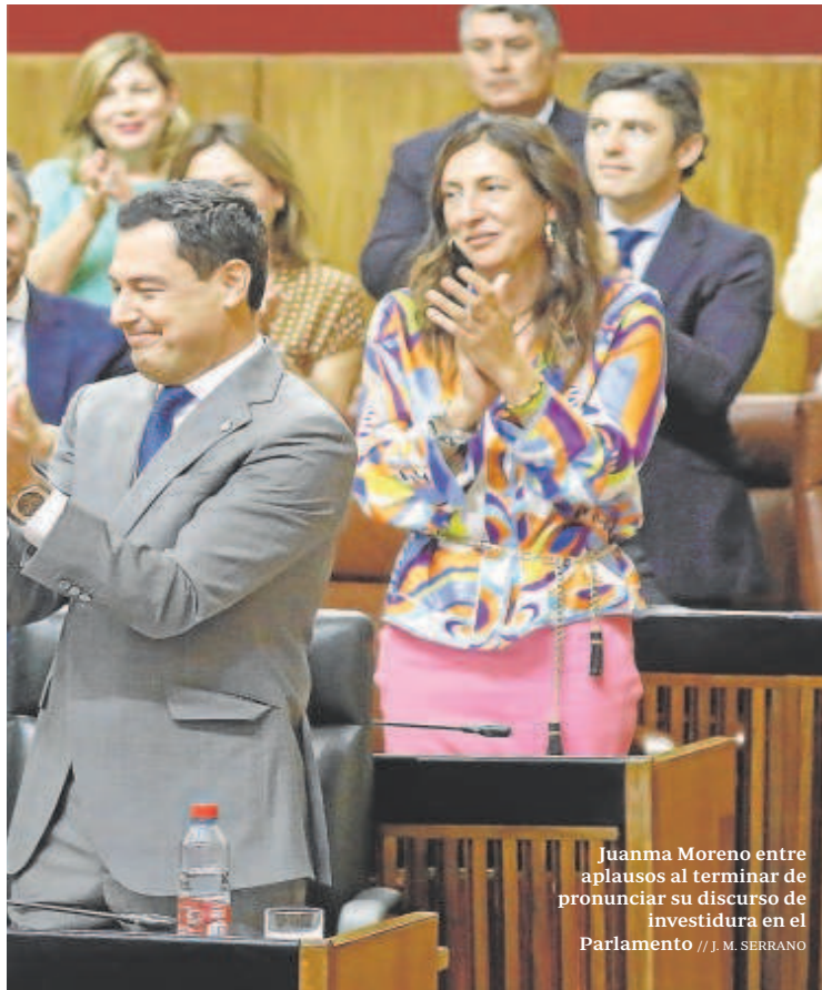
Juanma Moreno entre aplausos al terminar de pronunciar su discurso de investidura en el Parlamento