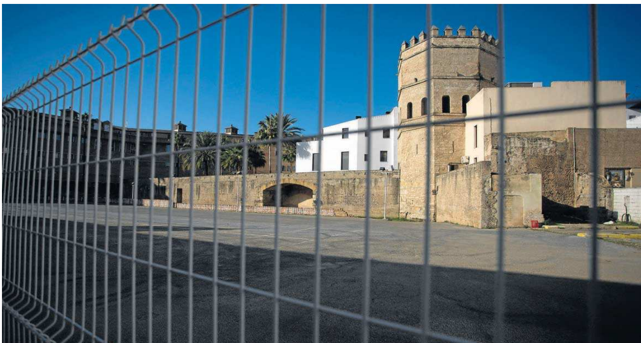
El solar del antiguo Corral de las Herrerías Reales, junto a la Torre de la Plata.