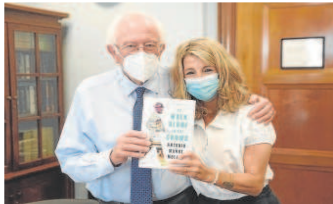
El senador Bernie Sanders con Yolanda Díaz

La vicepresidenta Díaz tuvo una agenda repleta en Washington, y la seguirá teniendo este jueves en Nueva York, con actos de alto contenido político. Se vio este miércoles con dos iconos de la izquierda crítica con el presidente Joe Biden, la diputada Ilhan Omar y el influyente senador Bernie Sanders, varias veces aspirante a la Presidencia con un programa de corte socialista con poca tracción en EE.UU. De Sanders, Díaz se deshizo en halagos, dijo que sólo con el Papa Francisco, con quien se vio en 2021, había tenido antes semejante conexión tan intensa. «No es sólo una conexión personal, sino una vocación compartida en agendas comunes», dijo Díaz, que le dio al senador Sanders una copia en