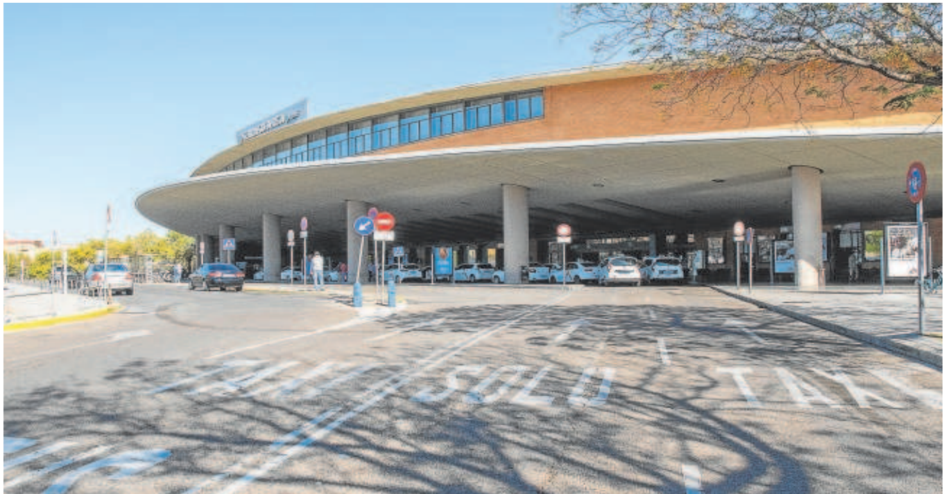
La ampliación del tranvía llegará desde San Bernardo a la estación de Santa Justa // JUAN JOSÉ ÚBEDA