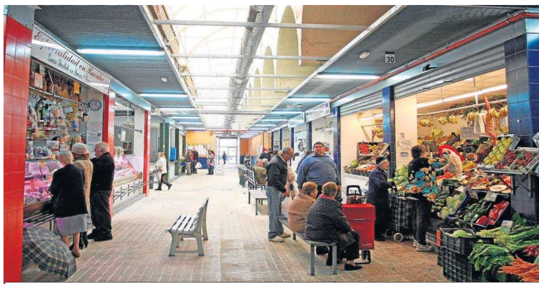
Mercado de abastos de la Candelaria.