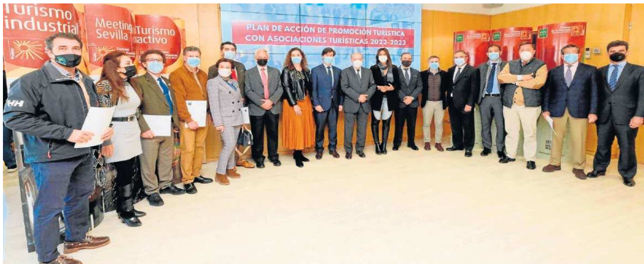
Foto de familia de la presentación del Plan de Acción de Promoción Turística del 'Destino Sevilla', en marzo pasado.

La provincia como eje. La Diputación organiza sendos encuentros profesionales y presentaciones del destino en estas dos capitales europeas para los días 4 y 5 de octubre