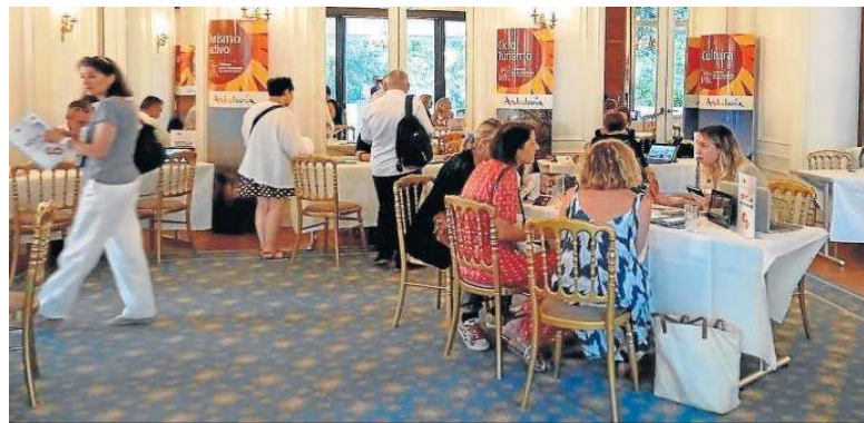
Momento del 'workshop' o misión comercial turística celebrada en París el pasado junio.

Se trata de la octava misión comercial que se realiza, este año, en el marco del Plan de Acción de Promoción Turística del 'Destino Sevilla', elaborado por la institución provincial en colaboración con la CES, las asociaciones empresariales turísticas de la provincia, la Consejería de Turismo