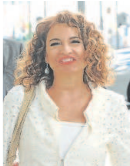
María Jesús Montero

La presión de los susanistas sobre Sánchez la llevó a Madrid para coger las riendas de Hacienda en 2018. Desde este departamento ha sido un azote de la gestión económica de los Gobiernos del PP. Para la hemeroteca que-