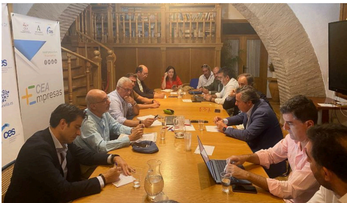
Los miembros de la Comisión Mixta Turismo CES y Cámara de Comercio de Sevilla