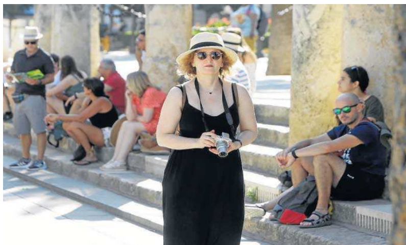
Turistas en las gradas de la Catedral.

El alcalde de Sevilla acordó el miércoles con los principales agentes del sector turístico impulsar y liderar desde Sevilla el debate sobre la implantación de un modelo de fiscalidad turística que sea voluntario para las ciu-