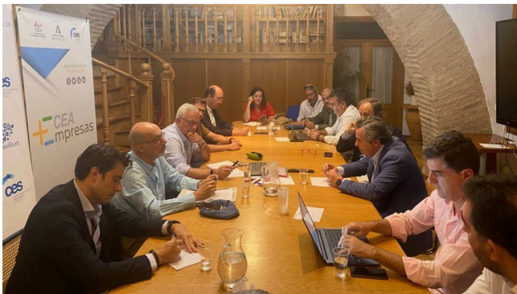
Reunión mantenida este jueves por los empresarios turísticos.