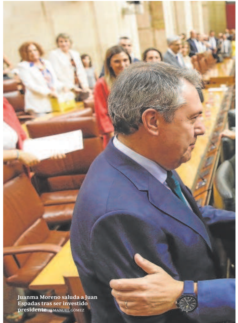
Juanma Moreno saluda a Juan Espadas tras ser investido presidente

Su principal interés estaba en tomar la medida a los portavoces de los grupos parlamentarios de la oposición que se estrenaban en los cargos, Juan Espadas, secretario general del PSOE, y Macarena Olona, portavoz de Vox, para determinar cuál será su tono y cómo eran capaces de defenderse en la siempre complicada tribuna del Parlamento. Había expectación en la Cá-