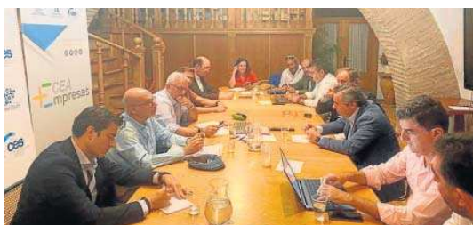
Reunión mantenida ayer por los empresarios turísticos.

Desde la Comisión de Turismo se insiste en que los empresarios no apoyarán la tasa si los recursos que se recaudan no se invierten íntegros en la mejora de la competitividad del destino turístico de Sevilla, es decir, si no repercuten en mejorar el sector. En este sentido, se pide que para el control de esta inversión (destino y grado de ejecución) se cree un órgano donde participen los responsables empre-