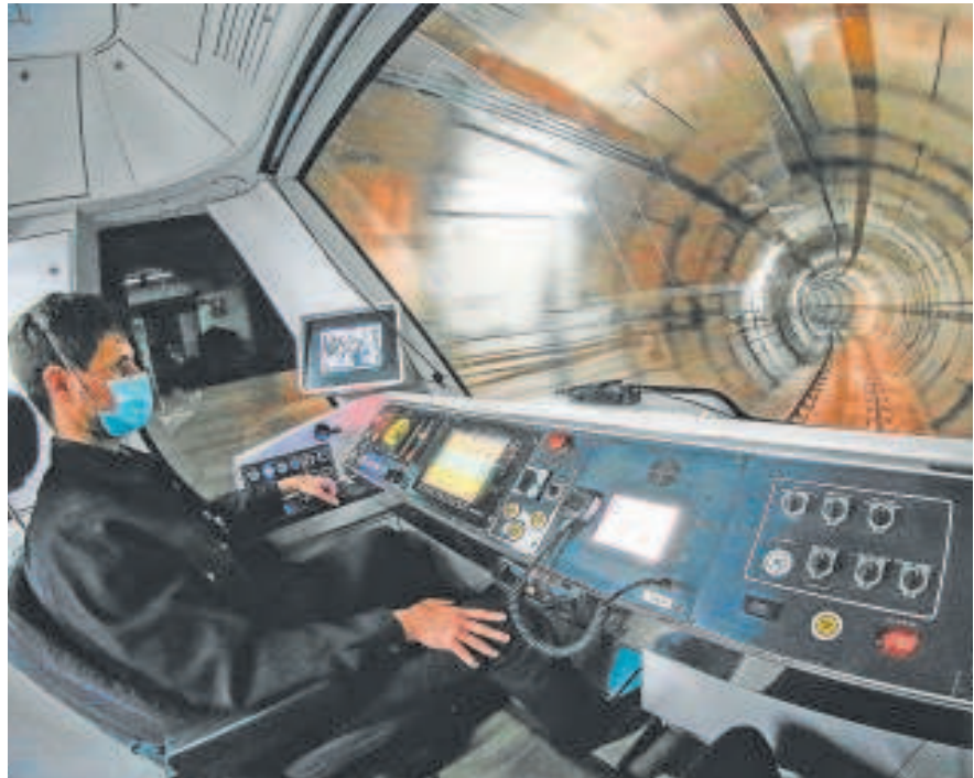
La ampliación del metro comenzará a construirse el próximo invierno // ABC

El ramal técnico del tramo Norte de la Línea 3 del metro de Sevilla atra-