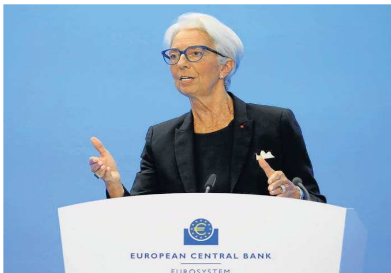
Christine Lagarde, presidenta del BCE.

Los altos precios de la energía, unido a los alimentos y los pro-