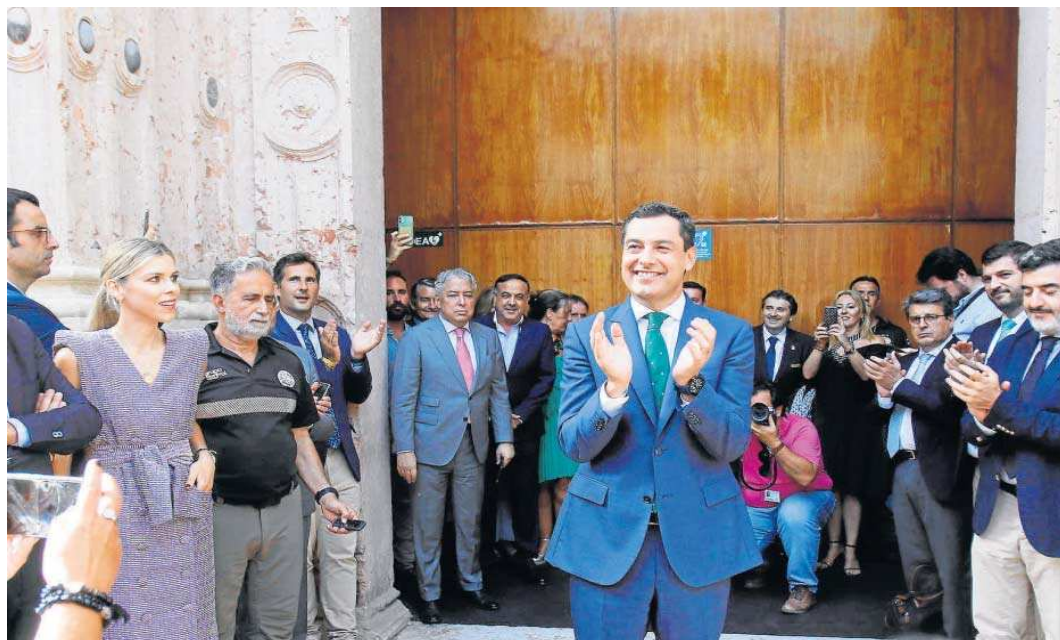
Juanma Moreno, ya investido presidente, a las puertas del salón de plenos.

El presidente garantiza que no subirá los impuestos a los andaluces