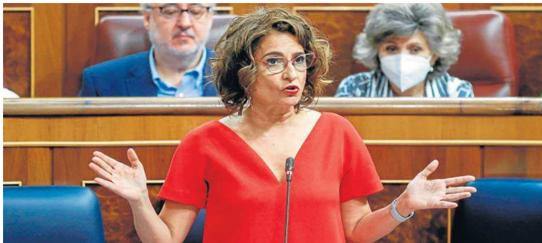
La ministra de Hacienda, María Jesús Montero, interviene en una sesión de control al Gobierno en el Congreso.