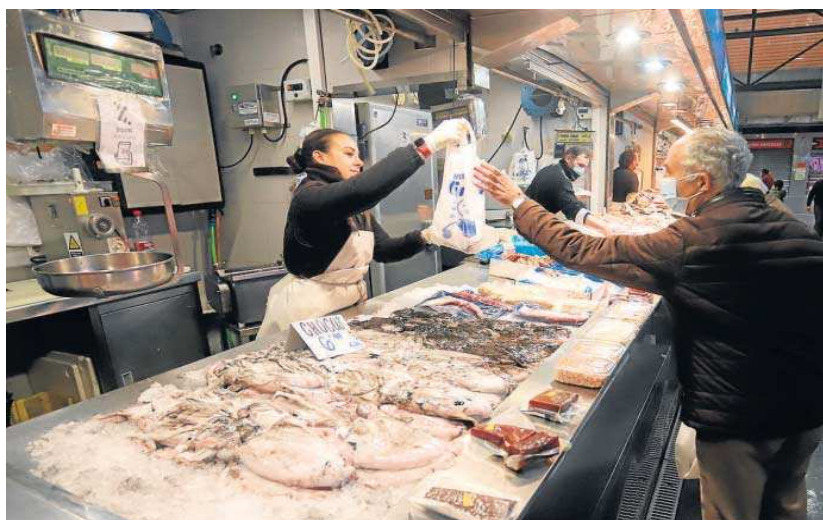
Puesto de pescado en un mercado de Jerez.

● Unos 370.000 tienen rendimientos inferiores a 1.300 euros y están dentro de los tramos en los que bajan las cotizaciones