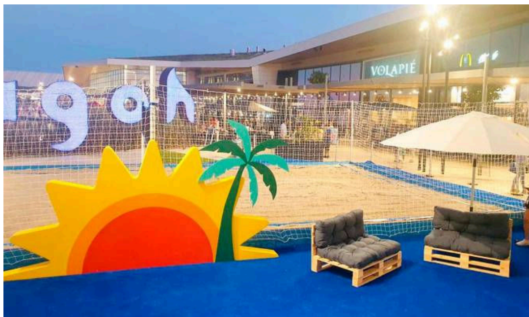
Playa creada en el centro comercial Lagoh.

La segunda fase será un campeonato amateur, que se jugará a lo largo del mes de agosto. Todas aquellas personas que quieran participar deberán realizar la inscripción a través de la web: https://www.lagoh.es/torneo-voley/ . El plazo de inscripción estará abierto hasta el día 30 de julio o hasta que se inscriban los 30 primeros equipos. Los ganadores de este torneo podrán llevarse 300 para gastar en Lagoh o 200 si resultan subcampeones. Lagoh promueve a través de esta iniciativa el ocio saludable, la diversión y los planes diferentes para realizar con amigos o en familia.