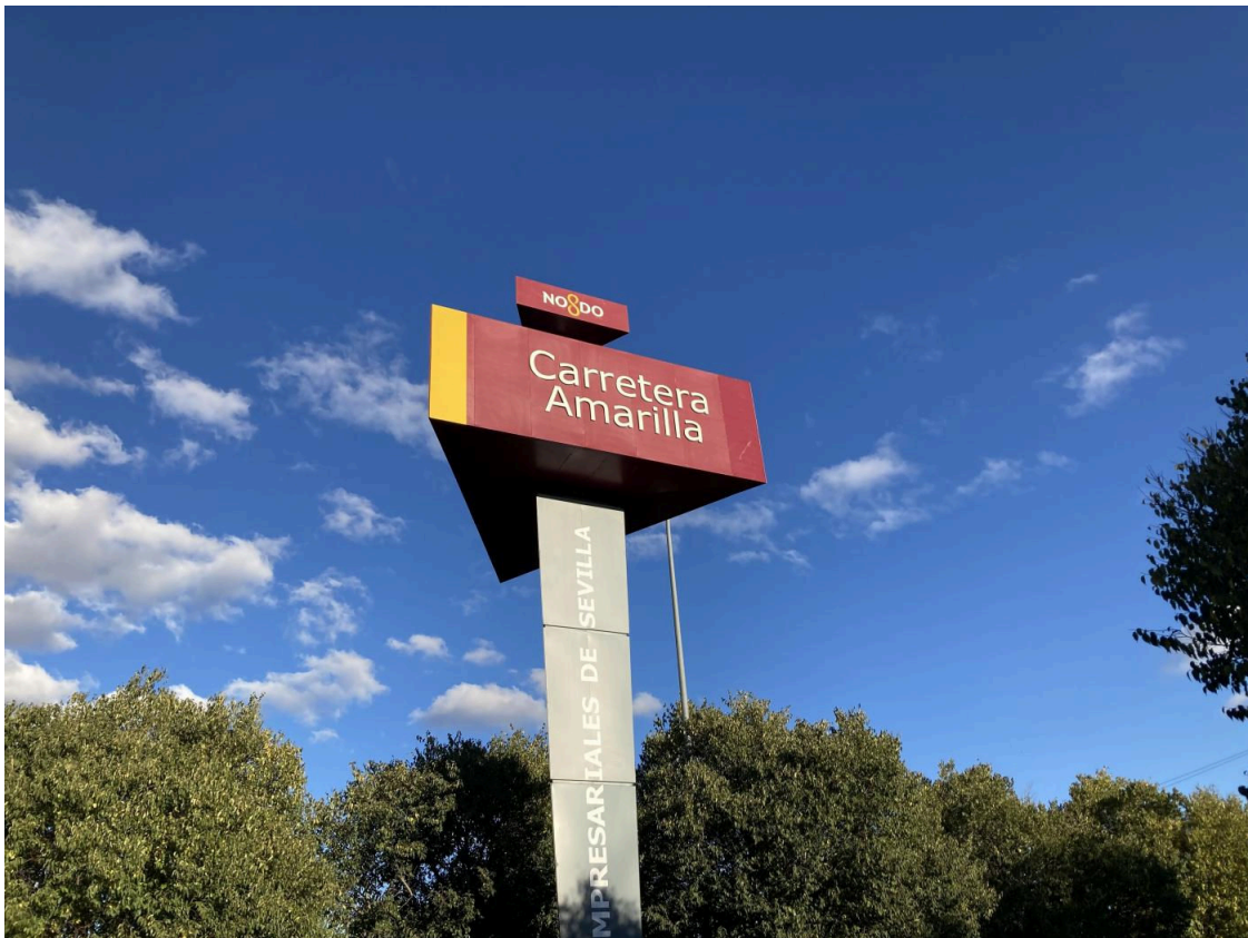
Parque Empresarial PICA en Carretera Amarilla. PICA

El alcalde de Sevilla, Antonio Muñoz, ha acordado con la Asociación de Parques Empresariales (APES) mantener el presupuesto de inversiones programado para 2022, cifrado en un millón de euros, y seguir, por tanto, con el ritmo de ejecución plurianual de proyectos que se viene desarrollando durante los últimos ejercicios.