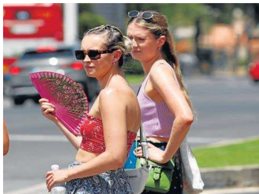
Una joven se refresca con el aire de un abanico.

Tras el pico del día 15, el consumo se ha mantenido alto durante todos los días, por encima de los 1.500 megavatios, y en términos muy superiores a los que se registraron en el mismo periodo de 2021, según fuentes de la compañía eléctrica. Destacan los 1.825 del lunes 18, día de la semana en el que se registra un mayor consumo de manera genera-