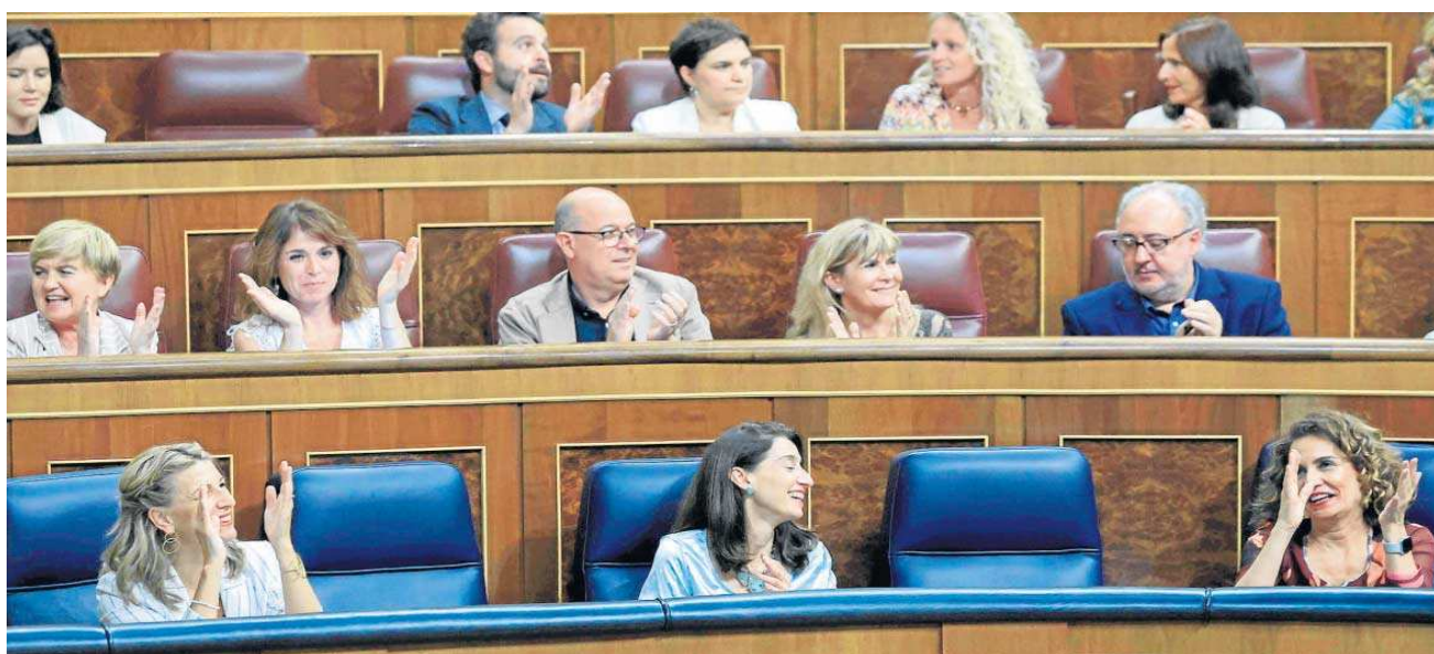
La bancada socialista durante una sesión plenaria en el Congreso.

● Las asignaturas pendientes son muchas, desde la Ley de Vivienda a la del 'sí es sí' ● La abolición de la prostitución o los impuestos a la banca y a las eléctricas quedan aparcados