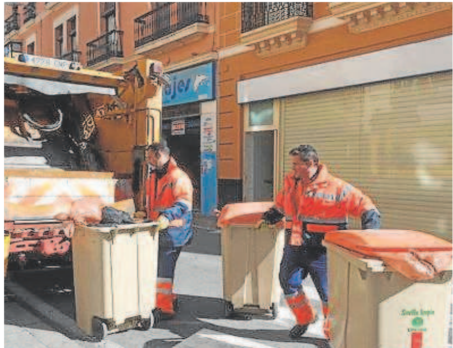
Operarios de Lipasam durante la recogida de contenedores

El primer objetivo de la revisión de la normativa es actualizar aspectos relacionados con la limpieza viaria y los servicios de recogida de residuos municipales y la adaptación de manera continua a la nueva realidad de la ciudad. La normativa municipal regula en este sentido cuestiones como el proceder de los servicios municipales ante las pintadas vandálicas o