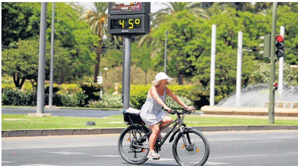
Una mujer en bicicleta por una céntrica calle de la ciudad el pasado fin de semana cuando el termómetro marca 45 grados.