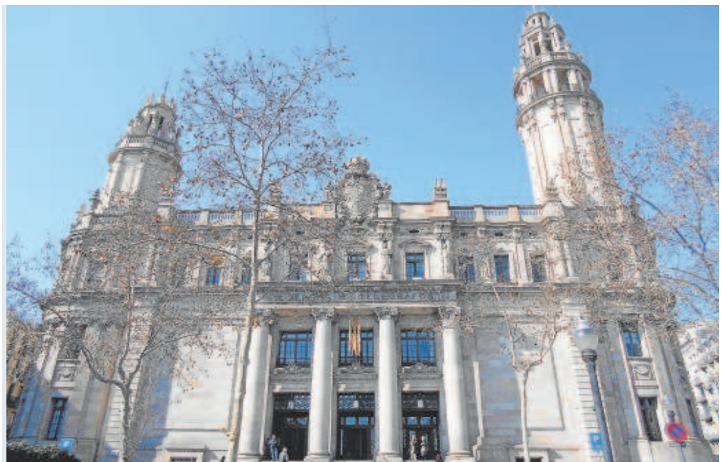
Sede de Correos en Barcelona, en la vía Layetana