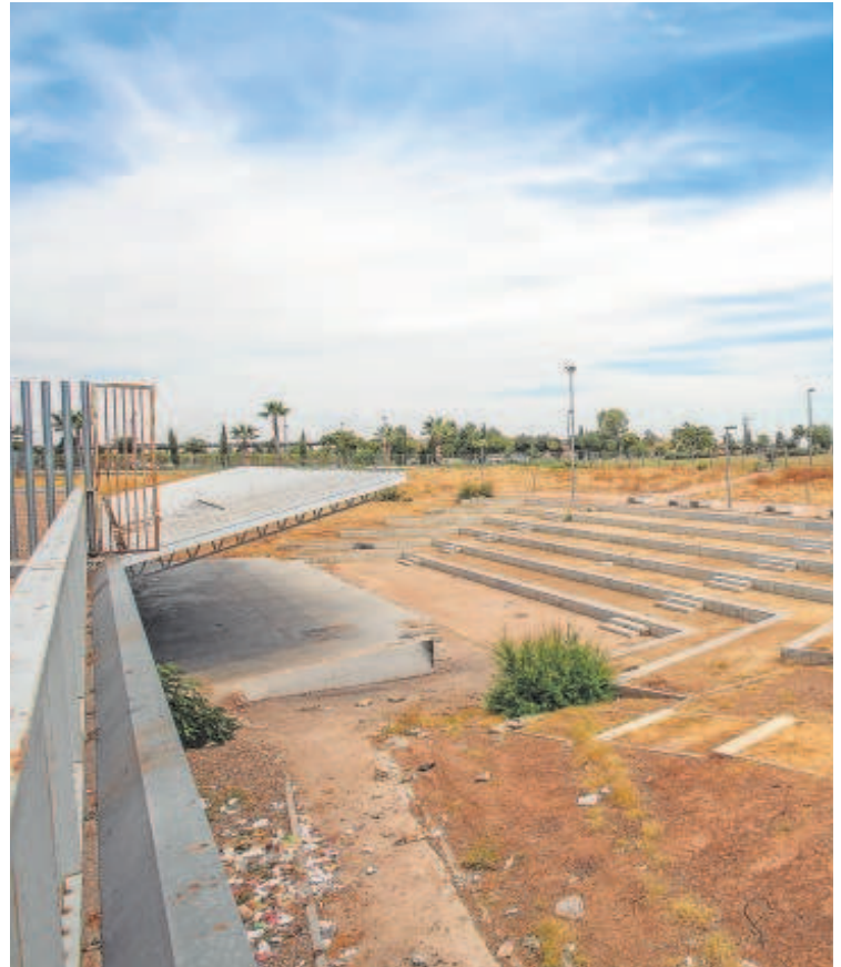
Espacio del Higuierón, al norte de Sevilla

La base estaba hecha. El Higuierón se podía convertir en un zona económica importante de cara a sectores como la logística o las comunicaciones. Diversos almacenes se instalaron en este punto y, cada vez más, los vecinos de los barrios adyacentes se acercaban a los grandes supermercados. También, estaba previsto en los proyectos de la red completa de metro de Sevilla, que la línea 3 del suburbano comenzaría en la zona con las primeras paradas en Pino Montano, en el entorno de la calle Estrella Canopus. Durante estos días, la consejería de Fomento anunció que había recibido doce ofertas para ejecutar la obra del ramal técnico del tramo Norte. Ahora, se iniciará el proceso de evaluación de las ofertas para la adjudicación de unos trabajos que tienen un presupuesto base de licitación de casi siete millones de euros y un plazo de ejecución de 11 meses y medio a partir del inicio de las obras que se prevé se produzca este invierno. El ramal técnico atravesará el futuro cauce del arroyo Tamarguillo, el arroyo Ranilla y tendrá un cruce con la carretera autonómica A-8005 proyectado mediante una glorieta. Entre las actuaciones previstas, están la