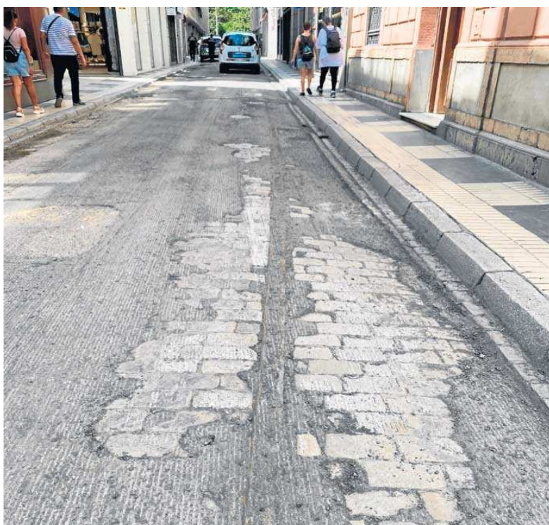
La huella del tranvía de Sevilla aflora en la calle Méndez Núñez.

Durante los trabajos para retirar la capa asfáltica ha quedado visible parte de las vías del antiguo tranvía que partía de la Plaza de San Francisco, seguía por Méndez Núñez y buscaba a través de la Plaza de la Magdalena y O'Donnell la Campana y Trajano para llegar a la Alameda, la Feria y la Macarena. Los raíles se encuentran insertados en los adoquines de Gerena que pavimentaban esta calle antes de que fuera cubierta directamente por el asfalto para permitir una mejor circulación de los coches. Esta práctica era muy habitual, por lo que es probable que las vías se encuentren prácticamente en su totalidad. En la calle Hernando Colón se conserva uno de los raíles como huella de este pasado al haberse mantenido los adoquines. Para la apertura de la