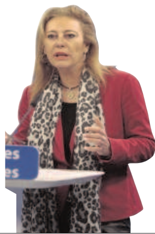
CAROLINA ESPAÑA ECONOMÍA, HACIENDA Y FONDOS EUROPEOS

Sanz tiene una dilatada experiencia en la administración: ha sido diputado andaluz; delegado del Gobierno en Andalucía con Mariano Rajoy; senador por la comunidad; y viceconsejero, cargo desde el que da el salto a titular de Presidencia. En ese puesto sustituye a Elías Bendodo y por tanto en virtual nuevo hombre fuerte de Juanma Moreno. En sus manos estará Diálogo Social, el medio para mantener la paz social con los sindicatos y trabajadores públicos que el PSOE no supo guardar y que le pasó factura.