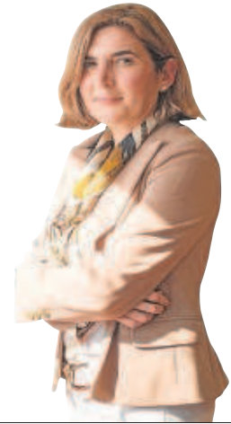
ROCÍO BLANCO EMPLEO, EMPRESAS Y TRABAJADORES AUTÓNOMOS

Del Pozo es otro de las cuatro mujeres que repiten en la foto del nuevo Ejecutivo. De Cultura salta a Educación, un terreno en el que se mueve con comodidad y conoce. Tendrá en sus manos el segundo mayor presupuesto tras Salud y una plantilla que supera los cien mil profesores. También se enfrenta al reto de la gestión de la Formación Profesional. Sevillana, licenciada en Derecho y especialista en legislación europea, ha sido diputada en el Congreso y, más tarde, en el Parlamento andaluz.