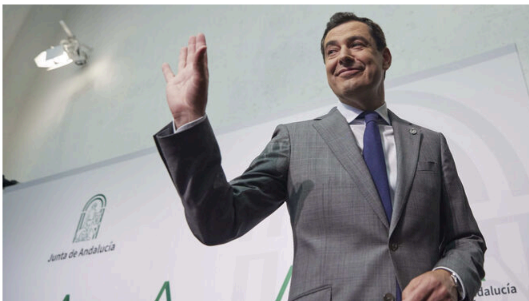
Juanma Moreno durante la rueda de prensa de este lunes.

La cita era a las 12:30, pero dio comienzo a las 13:45. Setenta y cinco minutos de retraso no es una demora baladí. Formar un gobierno no es una tarea fácil. Ni de la Junta de Andalucía, que gestiona los intereses de ocho millones y medio de andaluces, ni de cualquiera de las cientos de hermandades de la región. La gente, en general, rehúye de los cargos, no quiere compromisos ni mucho menos tener un jefe exigente. A Moreno le ha costado ocupar las trece consejerías. Lo advirtió en las vísperas y lo reconoció una vez que leyó la lista de los elegidos. O de los que pudo elegir, mejor dicho. Por cierto, Rajoy anunció su Ejecutivo (el que habría de hacer frente al desafío separatista catalán) leyendo una octavilla en la mano derecha, en una comparecencia de escasos minutos de duración y con mucha menos prosopopeya que la que apreciamos ayer, no digamos el sábado en la ya célebre toma de posesión .