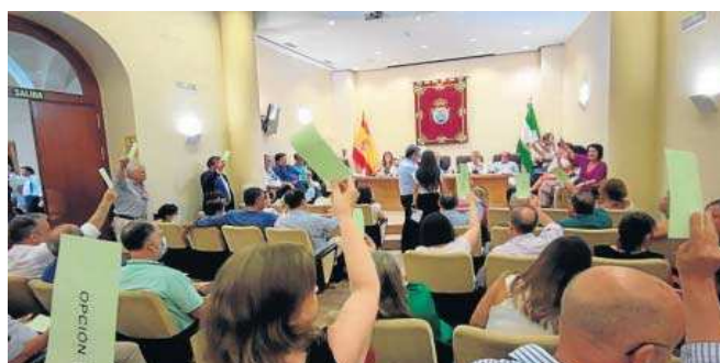
Un momento de la votación en el Colegio de Abogados.

Desde la Junta de Gobierno del Colegio “se ha querido evaluar el sentir del colectivo antes de plantear cualquier modificación de un nombre con más de 300 años de historia y sondear la postura generalizada. La opción de mantener el