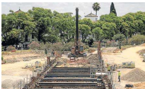
Las obras del colector en el parque a la altura de Padre García Tejero.

Estas asociaciones sostienen que el colapso de tráfico que se avecina va a ser enorme si se pretende añadir esa circulación a la Avenida de Reina Mercedes. Todo ello agravado con el comienzo de curso, con varias facultades repletas de alumnos, los colegios Claret y Doctrina Cristiana, los diferentes centros, el colapso cuando juega el Betis o la cantidad de personas que acuden a diario al centro comercial Lagoh. Los vecinos insisten en que esta medida