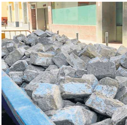
Los adoquines se acopian en una cuba para su traslado a los almacenes.