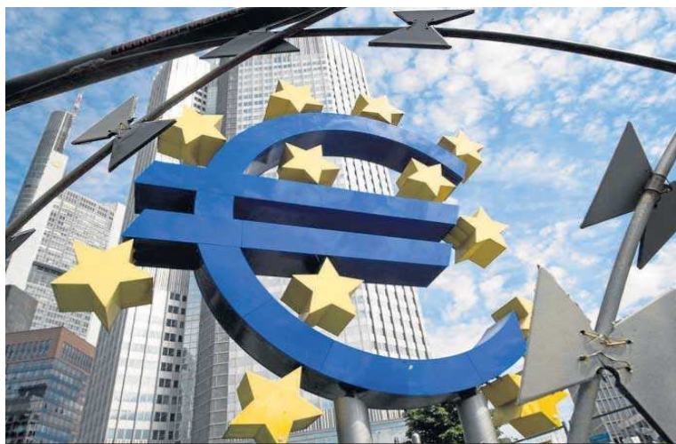
Logo del euro en los alrededores del Banco Central Europeo en Fráncfort.

En mayo, último mes del que ha facilitado datos el Banco de España, los depósitos de las familias alcanzaron la cifra más alta de toda la serie histórica, iniciada en 1989, y rozaron el billón de euros, tras sumar un 5,19% en tasa interanual, cerca de 46.000 millones de euros.