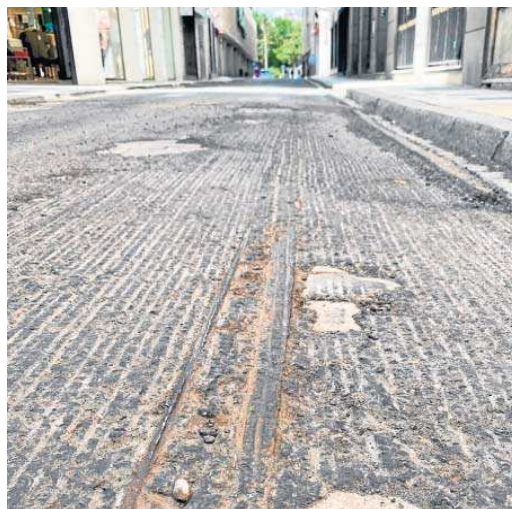
Detalle del pavimento donde se ve perfectamente la vía.

zanja, de momento sólo se ha abierto en el tramo entre la Plaza Nueva y Carlos Cañal, se han tenido que retirar los adoquines de Gerena. El pavimento se ha acopiado en una cuba para su traslado a los almacenes municipales. Estas piezas, tras su limpieza y adaptación, podrá ser utilizado en futuras obras.