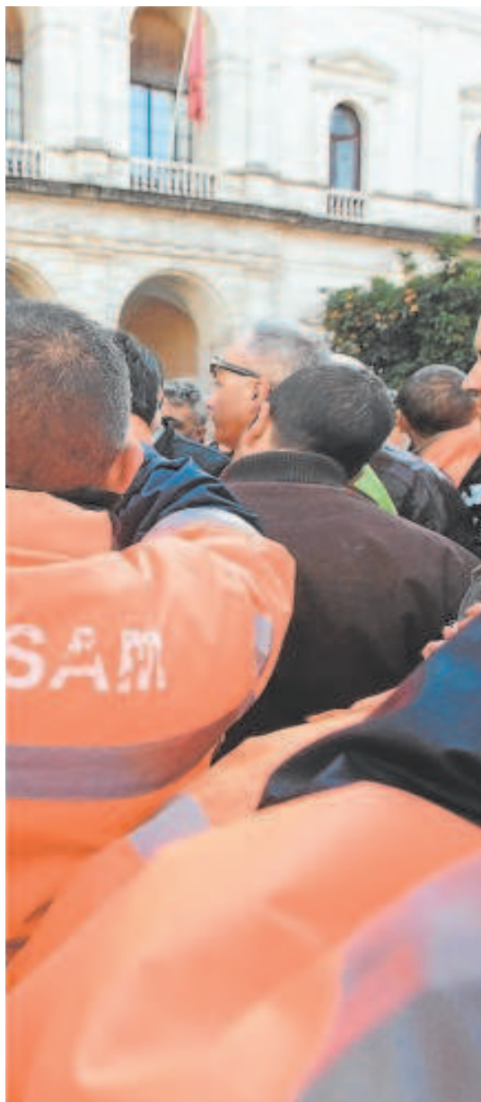
planteó acabar con el 'enchufismo' // ABC

to para la estabilización del empleo temporal de 450 plazas de los servicios estructurales de Lipasam; amén del refuerzo excepcional de 125 personas a partir del 1 de septiembre «para cubrir con garantías los actuales déficit de personal, tanto para las programaciones ordinarias de limpieza viaria como para poder atender los muy numerosos eventos y actuaciones especiales».