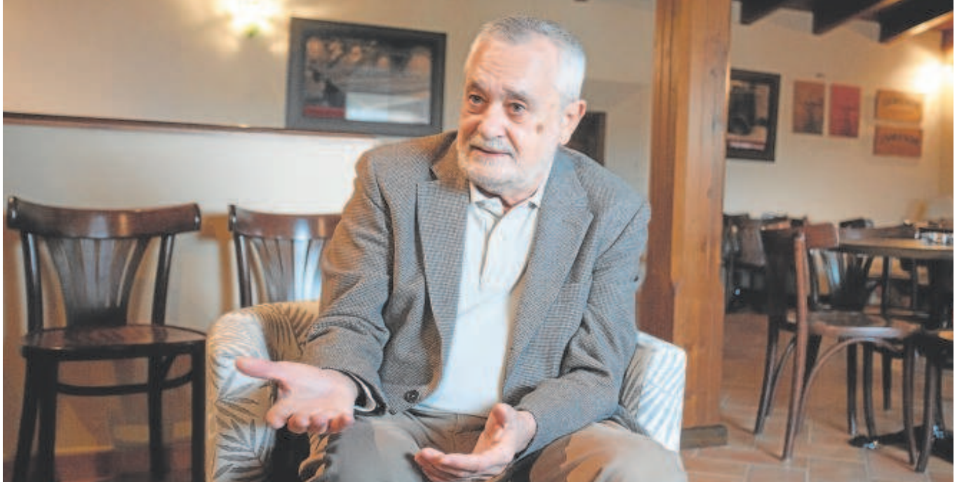
El expresidente andaluz, José Antonio Griñán, no descarta solicitar un indulto tras su condena a seis años de prisión en el caso ERE