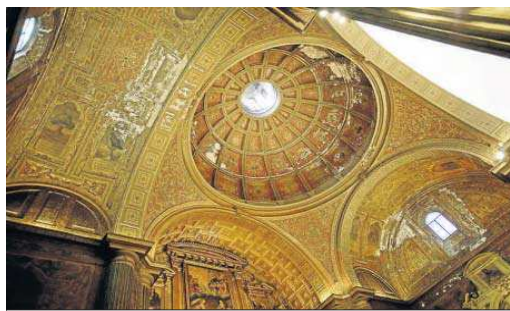
El interior de la iglesia, donde se observa la acción de la humedad.