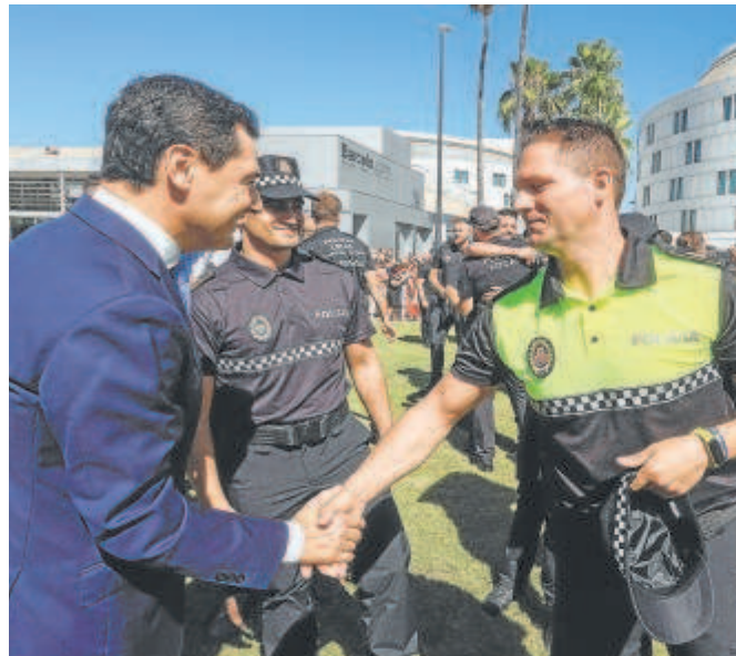
Juanma Moreno, ayer en Sevilla en un acto de la Policía Local

Pero antes que el agua, el presidente de la Junta volverá a abordar la cuestión de la financiación de Andalucía. Para el Gobierno andaluz, la comunidad está infrafinanciada. Según indicó ayer la consejera de Economía, Hacienda y Fondos Europeos, Carolina España, el Estado acumula cada año una deuda de «entre 800 y mil millones de euros». Así lo indicó antes de entrar en el Consejo de Política Fiscal y Financiera (CPFF), donde propuso que se cree un «fondo transitorio» para compensar a las comunidades que, como Andalucía,