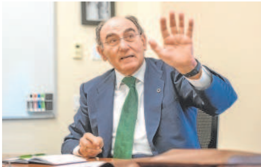
Ignacio Galán, presidente de Iberdrola

También puso en valor el tope al gas para producir electricidad. Aunque estimó que «medidas particulares» como la excepción ibérica mitigan la subida de precios, consideró que estas iniciativas «no solucionan el problema de fondo: el elevado precio del gas».