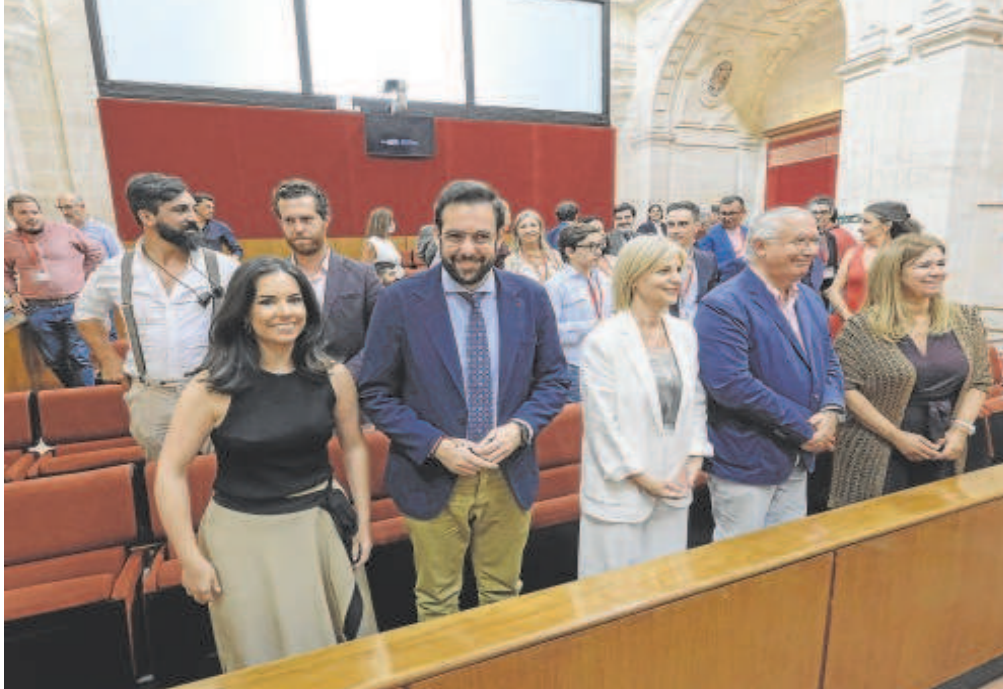
Los senadores que ayer resultaron elegidos en el Parlamento de Andalucía