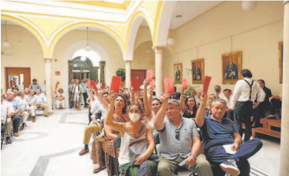
Los asistentes el pasado lunes a la junta del Colegio llenaron hasta el patio de la sede de Chapineros