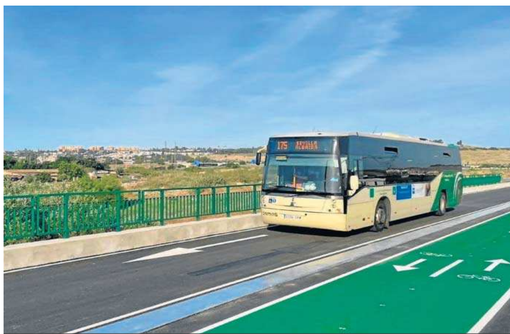
El carril Bus-Vao a su paso por el puente de la Señorita.

La consejera de Fomento, Marifrán Carazo, incidió ayer en un proyecto que supone una "apuesta decidida por el transporte público en una de las zonas con mayor tráfico como es la conexión entre Sevilla y el Aljarafe". "Ya dimos un primer paso con el puente de la Señorita y ahora encaramos una segunda fase, mucho más ambiciosa, para contar con un carril exclusivo para autobuses y vehículos de al-