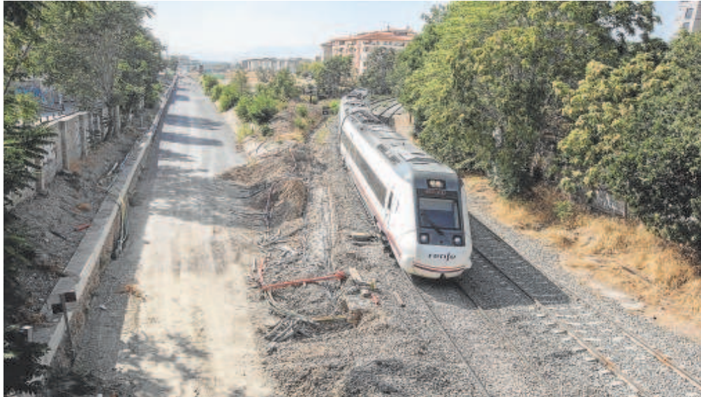
Un tren procedente de Almería atraviesa La Chana, en Granada // ALFREDO AGUILAR