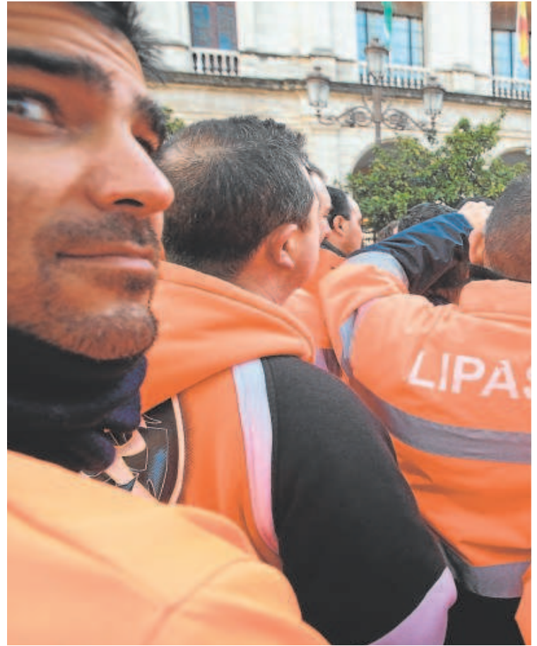
Los trabajadores de Lipasam convocaron una prolongada huelga en 2013 cuando Zoido

Uno de los privilegios extraordinarios que sí mantienen la plantilla de Lipasam es el incentivo que reciben sus trabajadores por asistir a su puesto de trabajo. Aunque extraño, es correcto: los trabajadores de la empresa pública de limpieza de Sevilla reciben una prima lineal de 1.400 euros anuales, aplicada en el mes de septiembre en todas sus categorías, por no presentar «días de incapacidad laboral transitoria, faltas injustificadas o sanciones en el periodo comprendido desde el 1 de septiembre de un