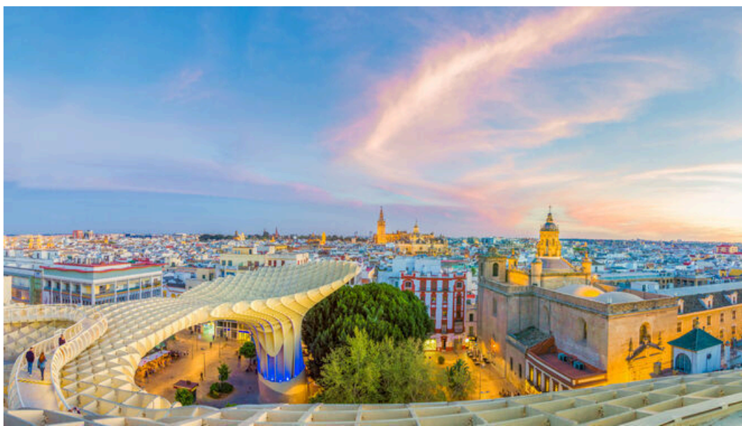
Panorámica de la ciudad de Sevilla / (Sevilla)

Sevilla es la capital de Andalucía. Así lo define el Estatuto de la Autonomía . Nunca ha habido debate al respecto, ni se trata de un título en juego o discusión más allá de algunas polémicas promovidas por políticos irresponsables de uno y otro lado. El propio presidente Moreno refirió la capitalidad en el inicio de su discurso de toma de posesión del pasado sábado . El objetivo del hoy alcalde, Antonio Muñoz , es que la capitalidad sea por fin desarrollada en la correspondiente ley autonómica. Y mientras tanto, que el Gobierno de España constituya la comisión de trabajo permanente donde estén representadas las tres administraciones para decidir con celeridad asuntos de financiación en caso en los que Sevilla acoja acontecimientos de relevancia internacional. ¿Recuerdan, por ejemplo, cuando la ciudad fue sede de una cumbre europea en tiempos del presidente Aznar? Pues a esa comisión hubiéramos elevado como ciudad las necesidades extras de financiación.