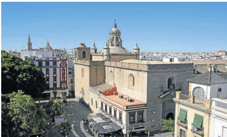
Vista aérea de la iglesia de la Anunciación desde el mirador de las 'setas'.

Las actuaciones en las cubiertas servirán también para recuperar todos los elementos cerámicos decorativos en la fábrica de la linterna y de los pretilos, la cubrición de la cúpula dispuesta en damero o los pináculos situados en los remates de los torreones. Ade-