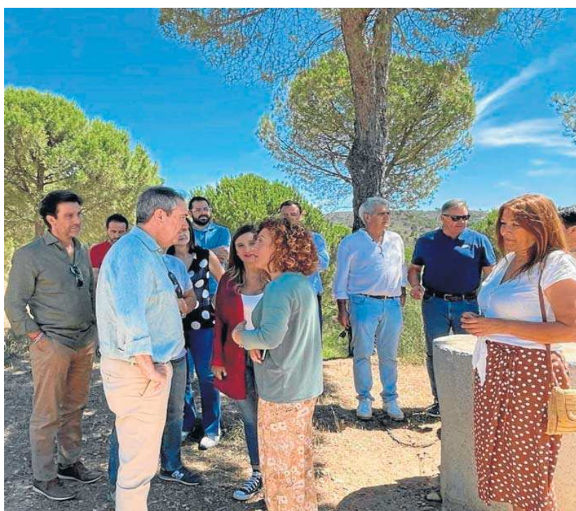
Juan Espadas, ayer en la Pata del Caballo, en el municipio onubense de Escacena del Campo.

Juan Espadas, que visitó ayer la comarca del Condado de Huelva, pidió que el próximo Gobierno andaluz recupere la consejería propia de Medio Ambiente y que, además, sea una “prioridad” de la legislatura. Para el socialista, fue “un error” hacerla “desaparecer” bajo Agricultura. En Escacena, donde ha estado en la zona forestal de la Pata del Caballo, criticó también la “pésima” gestión forestal de este enclave. “Lo digo con todas las letras –indicó–, la gestión de nuestros montes tiene que tener en ese departamento una prioridad en recursos humanos y en recursos económicos”. Y agregó que eso “significa invertir en el tratamiento