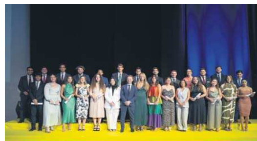
Alumnos del Máster en Asesoría Jurídica de Empresas.

nales, Máster en Marketing y Comunicación Digital y Master en Derecho Administrativo y Derecho Público Económico. Además, se ha reconocido, de cada uno de los másteres, al alumno/a más destacado en este curso académico.