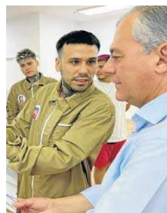
Sanz en Mogan's Barber Shop.

El candidato señaló que "dicho programa se podía ejecutar y llevar a cabo hasta el 31 de agosto de 2022. Es decir, hasta esta fecha el