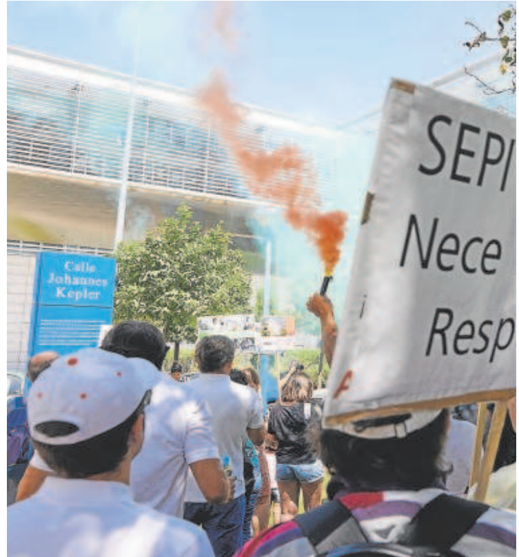
Trabajadores de Abengoa se reunieron ayer con el consejero de Economía de la Junta,