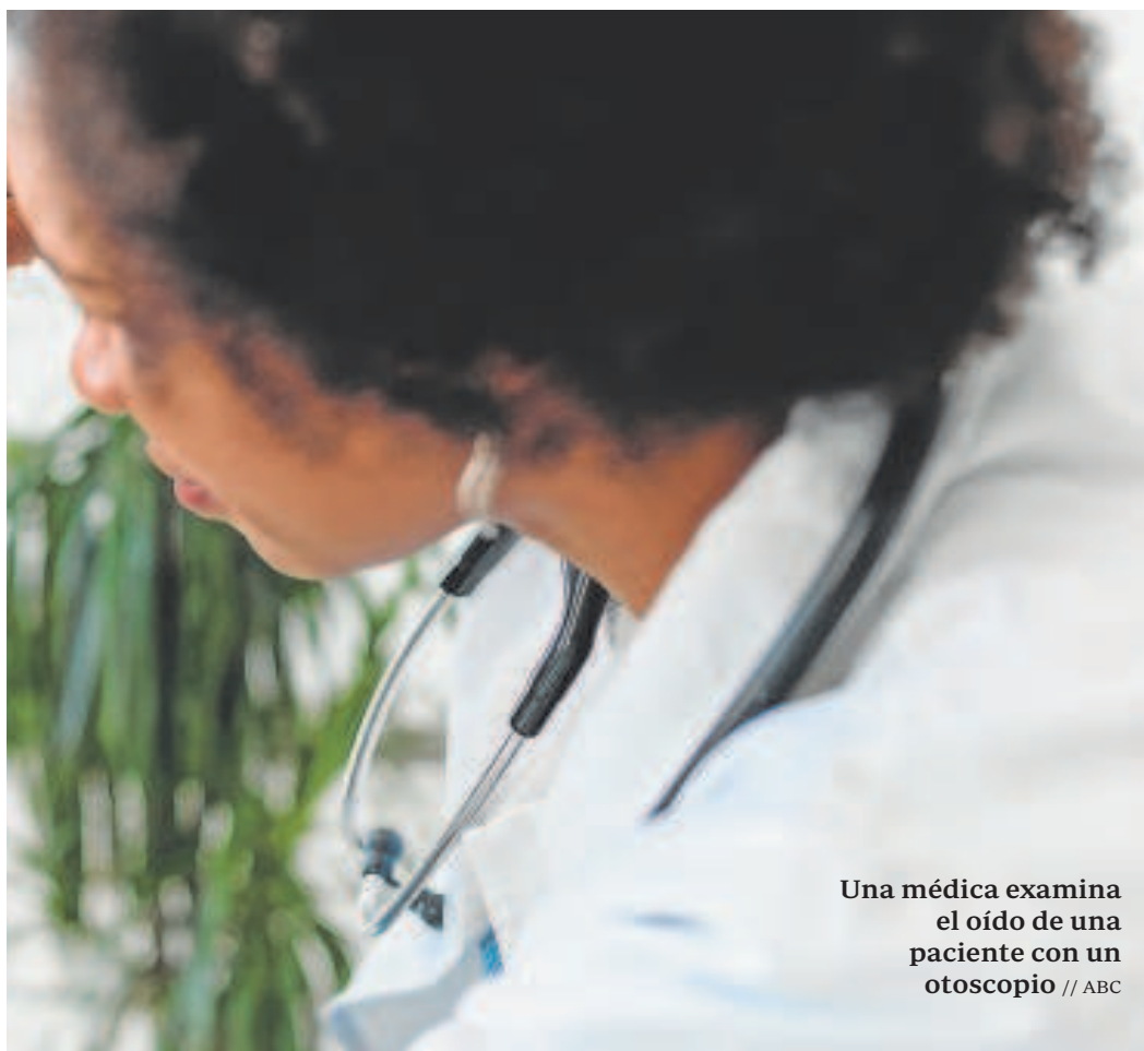
Una médica examina el oído de una paciente con un otoscopio