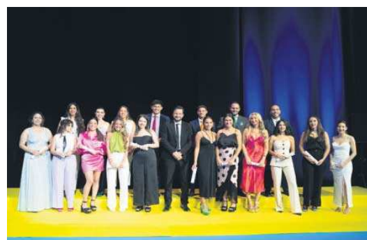
Alumnos del Máster en Marketing y Comunicación Digital.

Durante el acto se graduaron un total de 150 alumnos en los diferentes másteres desarrollados en la Escuela de Negocios: Máster en Asesoría Fiscal, Máster en Finanzas, Máster en Asesoría Jurídica de Empresas, Máster en Gestión de RRHH, Máster en Negocios Internacio-