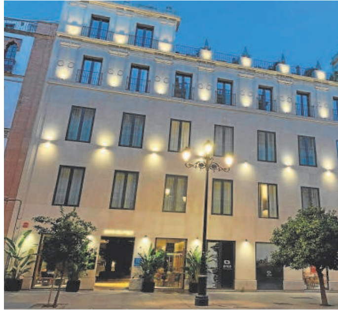
Establecimiento de Soho Hoteles, cadena malagueña rescatada por la SEPI