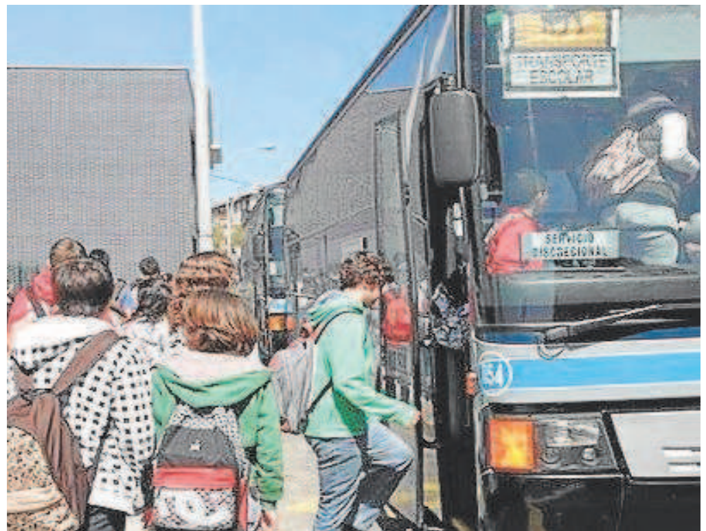
Sobre estas líneas, niños montándose en un autobús escolar

Además, según Atedibus, las administraciones solo quieren favorecer la compra de vehículos híbridos o eléctricos. Sin embargo, los empresarios afirman que, por su extensión, en Andalucía no es posible realizar traslados en estos vehículos eléctricos ya que no los hay con capacidad para realizar estos desplazamientos.