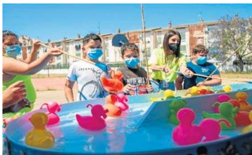
Actividades en una de las escuelas de verano.

Este verano han aumentado “considerablemente” los menores en las escuelas de verano, de modo que la cobertura alcanza a unos 1.000 menores, “debido a la normalización con respecto al año anterior, y así recuperamos el número de participantes de anteriores ediciones”.