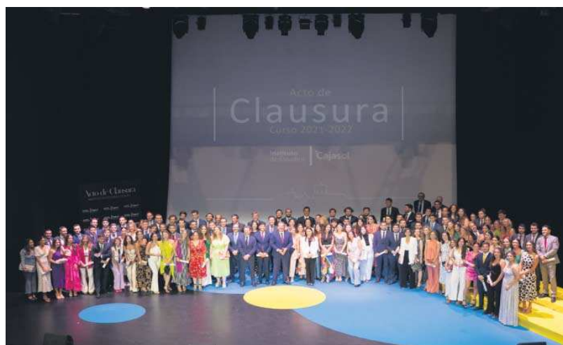
Foto de los alumnos del curso 2021-2022.