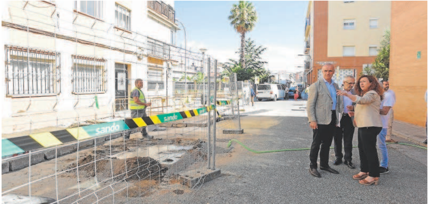
El alcalde de Sevilla, Antonio Muñoz, visitó ayer las obras del barrio de Bellavista