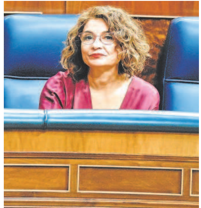
María Jesús Montero, ministra de Hacienda, en el Congreso

En otra de las comunicaciones a las que ha tenido acceso este periódico, del Ministerio para la Transición Ecológica, se pide a las regiones que informen en cuestión de tres días del «estado de ejecución de cada una de las líneas cuya transferencia se ha acordado», también mediante un excel que debía ser devuelto cumplimentado antes de que empezara el mes de julio para poder cumplir plazos. Incluso, fuentes autonómicas de-