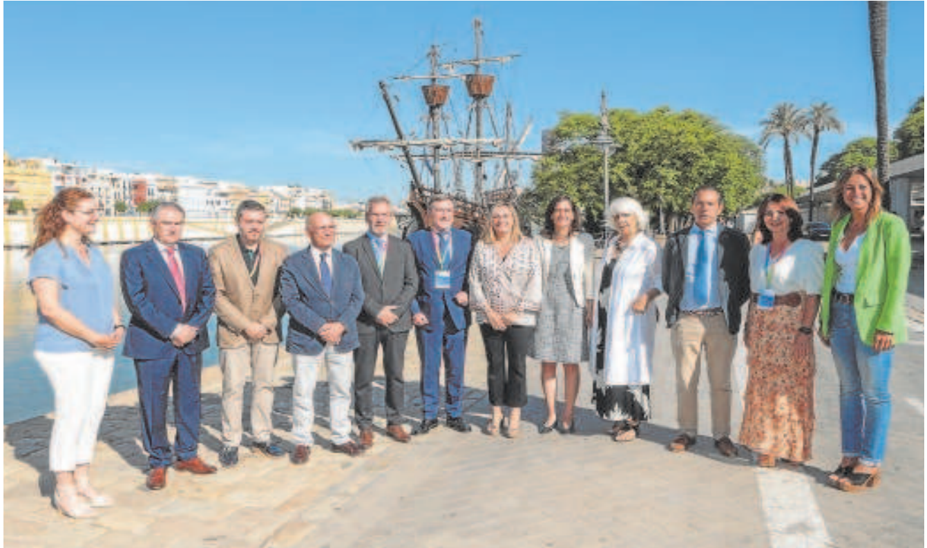
Los representantes de los puertos andaluces, junto al Guadalquivir