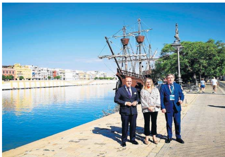
Un foro reúne en Sevilla a las autoridades de todos los puertos andaluces, administraciones públicas y navieras.