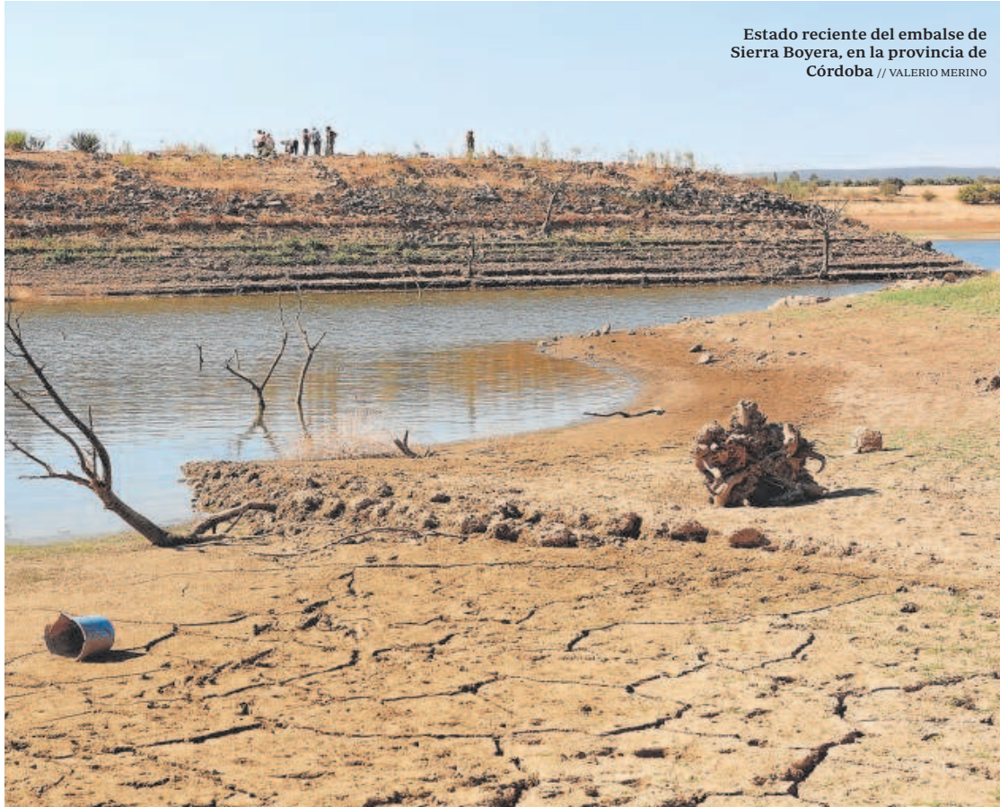
Estado reciente del embalse de Sierra Boyera, en la provincia de Córdoba

tación en situación de emergencia como La Viñuela (Málaga), Guadarranque Charco Redondo (Campo de Gibraltar) y Guadalhorce-Limonero (Málaga). En el segundo decreto se recogieron obras como la conexión del tratamiento terciario de la Estación Depuradora de Aguas Residuales (EDAR) del Rincón de la Victoria (Málaga) con el ámbito geográfico del Plan Guaro para el aprovechamiento de aguas regeneradas en el riego de explotaciones agrícolas; así como las obras para el aumento de la capacidad y calidad de los tratamientos terciarios en las EDAR de tres municipios almerienses (Adra, El Ejido y Roquetas de Mar).