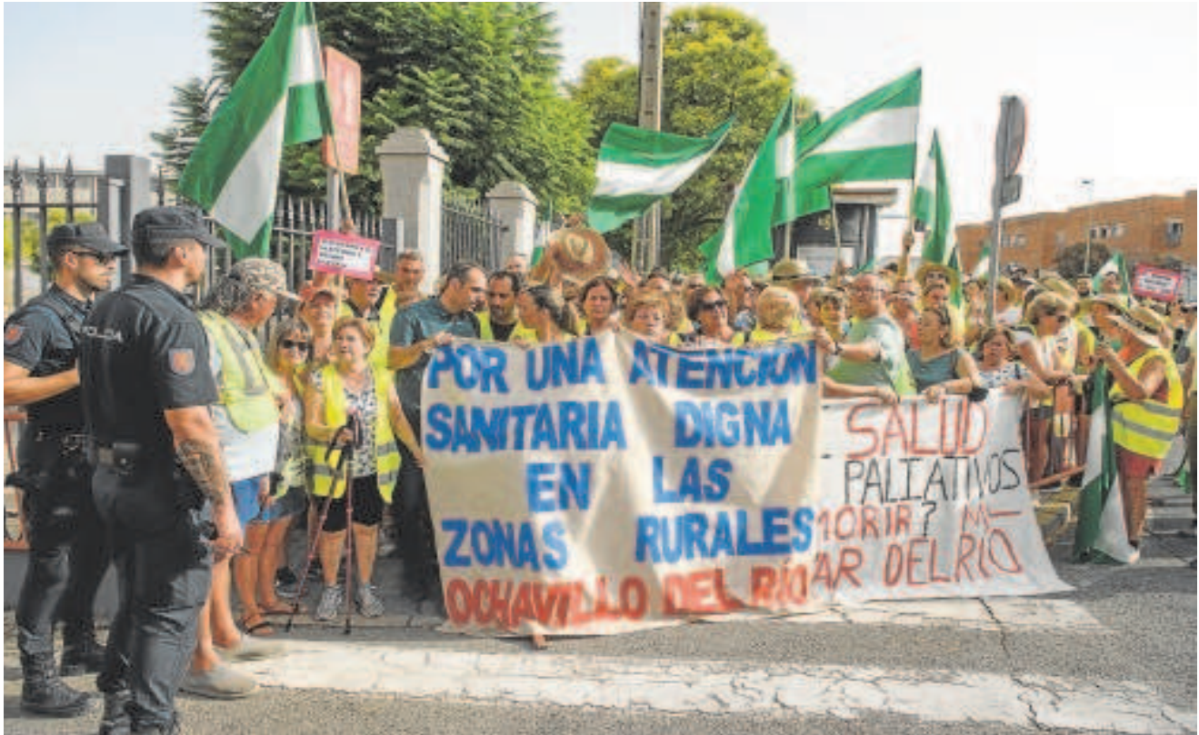
Vecinos de Ochavillo del Río ayer ante la sede de la Cámara andaluza