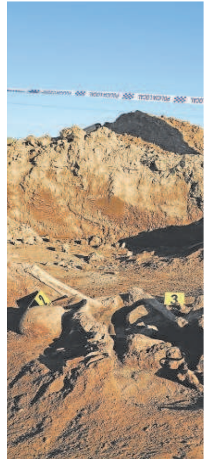
Trabajos de exhumación en una fosa de Recas (Toledo)

Once de los diecisiete gobiernos autonómicos cuentan con organismos dedicados específicamente a esos efectos. La que más entramado tiene montado al efecto es la Generalitat de Cataluña. También es la que más gasta en ello. Desde hace años cuenta con tres entes: dos consorcios, el Memorial Espacios de la Batalla del Ebro y el Museo Memorial del Exilio, y un ente de derecho público, el Memorial De-