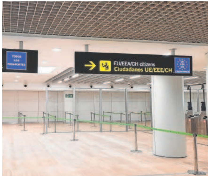
Aspecto de una de las zonas que se estrenaron ayer en San Pablo

Los primeros pasajeros que han embarcado desde la nueva zona lo hicieron en un vuelo con destino a Londres de la compañía Vueling. El área de salidas internacionales No Schengen cuenta con cinco puertas de embarque, a las que se sumará, en breve, una mixta que, según las necesidades operativas, podrá habilitarse para vuelos del espacio comunitario europeo. También dispone de bancadas con tomas eléctricas y de USB y de un espacio con mesas de trabajo. Tiene, además, dos pasarelas de embarque de última generación —una de ellas, ya en servicio, mientras que la segunda lo hará a finales de septiembre—, un núcleo vertical de comunicación, dos cabinas dobles para el control manual de pasaportes y una tercera para cuando ese control se realice a través de los seis equipos ABC System que se han instala-