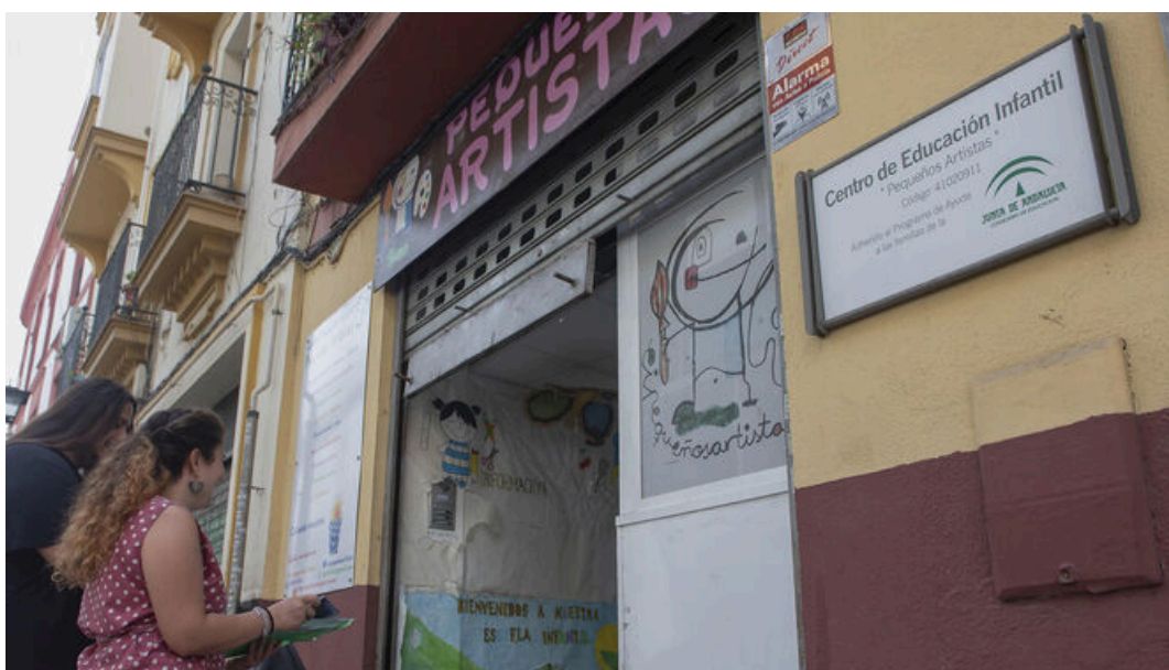
Una guardería en el centro de Sevilla, que ya se prepara para el inicio de curso.

La bajada de la natalidad en Sevilla, con cifras que se sitúan por debajo de las registradas en la posguerra, tiene sus primeras consecuencias en el ámbito educativo. Las guarderías , ahora llamadas escuelas infantiles , son las principales perjudicadas de un descenso que no tiene, a corto plazo, visos de cambiar. Sin embargo, el nuevo curso -que comenzará en dichos centros este jueves 1 de septiembre- registra un dato positivo. Tras dos años marcados por la pandemia del Covid y con una escolarización a la baja, ha aumentado el número de niños matriculados , que se acerca ya a los niveles de 2019.