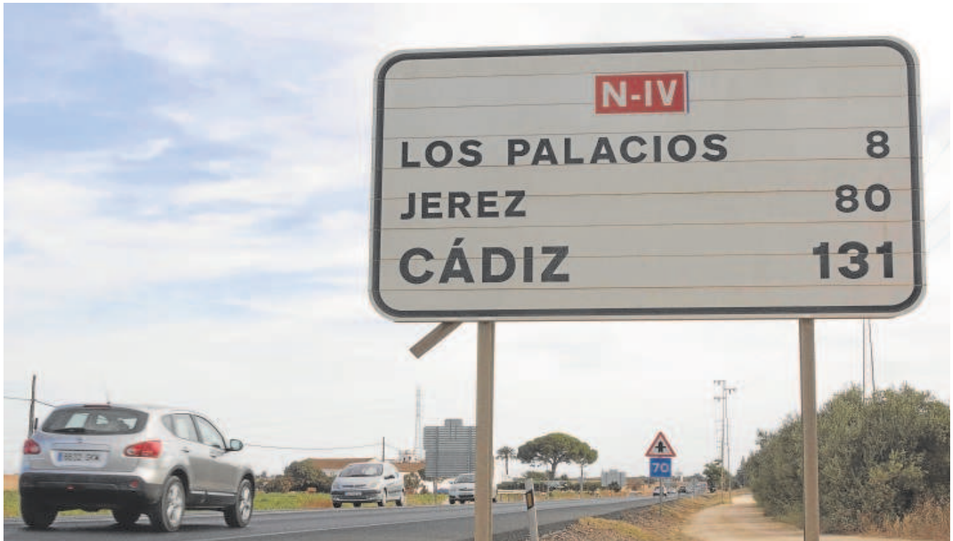
Cartel con la denominación antigua de Nacional IV, hoy llamada A-4, a su paso por Dos Hermanas sin el actual desdoble hasta Los Palacios

El Gobierno de Pedro Sánchez guardó en un cajón el proyecto completo del desdoblamiento de la A-4 tras liberalizar la autopista pero los atascos en la AP-4 abren de nuevo el debate