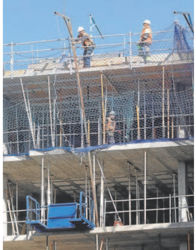
Obreros trabajando en una promoción de viviendas en Córdoba

Con la futura norma reguladora de la vivienda en Andalucía también se quiere simplificar la burocracia legislativa. Actualmente, «hasta cinco normas regulan la política de vivienda», especificó Carazo, quien recordó que «en 2005 con la Ley de Vivienda Protegida de Andalucía nos dijeron que se po-