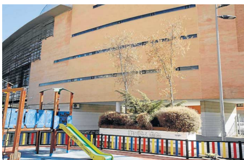
La zona de juegos infantiles.

La reurbanización arrancó en 2013 cuando Mercadona resultó adjudicataria en el concurso con-