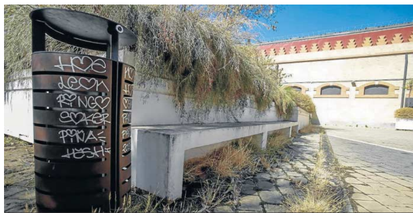
Una papelera pintada y vegetación descuidada.

● Seis años después de su reurbanización, luce un estado muy deficiente ● La comunidad ha vallado el perímetro para impedir el vandalismo y la 'botellona'