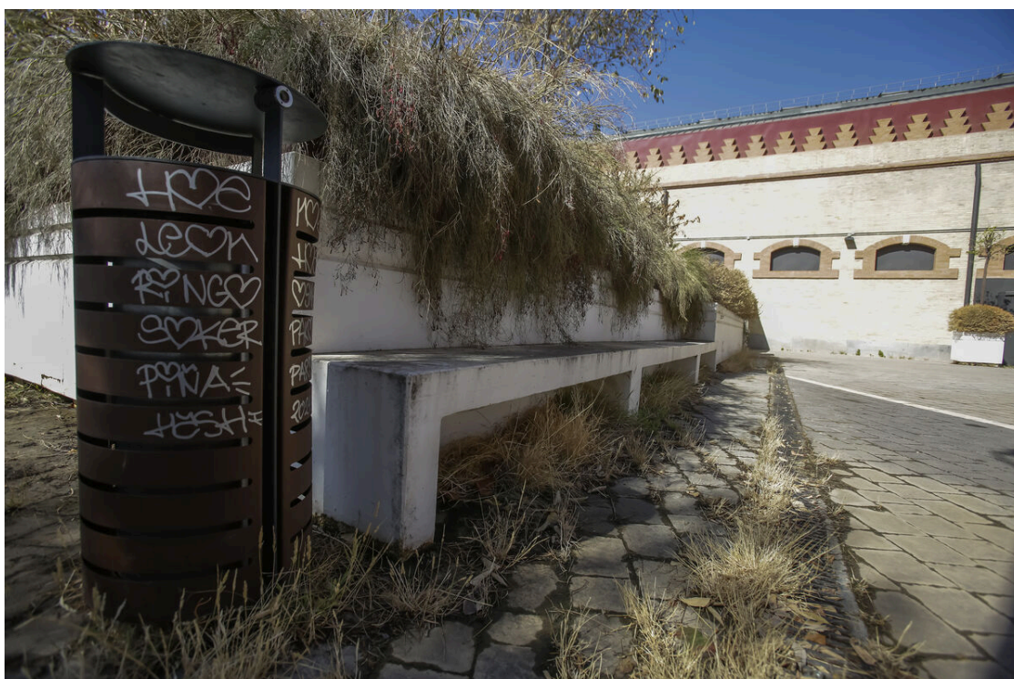
Una papelera pintada y vegetación descuidada.

Aunque la plaza es propiedad de Adif, la gestión del espacio corresponde a la comunidad de propietarios que componen todas las actividades establecidas. Fuentes de la misma consultadas por este periódico han asegurado que son conscientes del estado de la plaza, achacándolo a la empresa que se encargaba del mantenimiento, por lo que están en el proceso de contratar a una nueva para que regenere la plaza. Este proceso podría estar terminado este mismo mes y, a continuación, se acometería una batida de limpieza y puesta a punto.