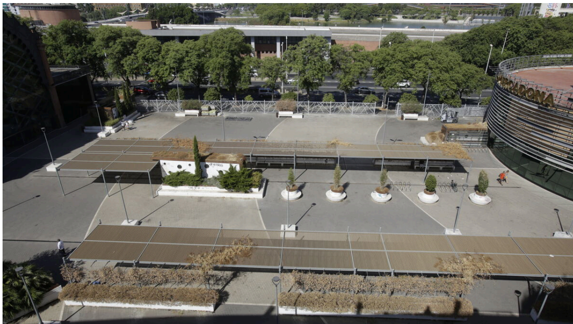
Vista aérea de Plaza de Armas con el vallado ya colocado para su cierre por las noches.

inauguración de la nueva Plaza de Armas, ya que pensaba serviría de revulsivo para la zona: "Es una completa pena después de lo que costó. Da asco estar aquí. En los bancos no te puedes sentar. Y, ¿qué pasa con el riego? No funciona. Han dejado que todo se muera. La falta de mantenimiento es total. Los husillos están llenos de hojas y en invierno se atascan y producen malos olores porque no los limpian. Ahora lo vallan para acabar con una botellona que no es tanta. Se han saltado el acuerdo tácito que había de no hacerlo".