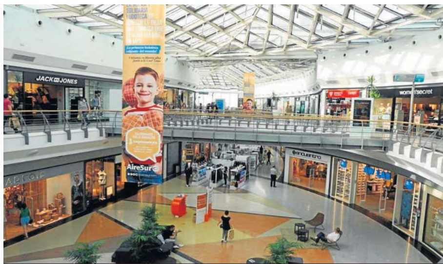
El centro comercial Airesur, en la localidad de Castilleja de la Cuesta. D. S.