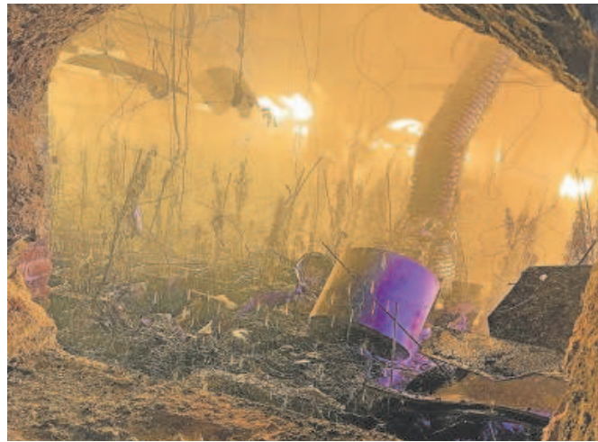
Plantación ilegal de marihuana // ABC

Los datos del Ministerio del Interior indican que, desde 2015, las incautaciones de marihuana y plantas de cannabis en España han experimentado fuertes incrementos de entre un 150 y un