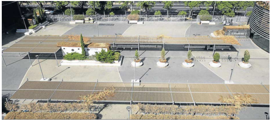
Vista aérea de Plaza de Armas con el vallado ya colocado para su cierre por las noches.

Aunque la plaza es propiedad de Adif, la gestión del espacio corresponde a la comunidad de propietarios que componen todas las actividades establecidas. Fuentes de la misma consultadas por este periódico han asegurado que son conscientes del estado de la plaza, achacándolo a la empresa que se encargaba del mantenimiento, por lo que están en el proceso de contratar a una nueva para que regene la plaza. Este proceso podría estar terminado este mismo mes y,