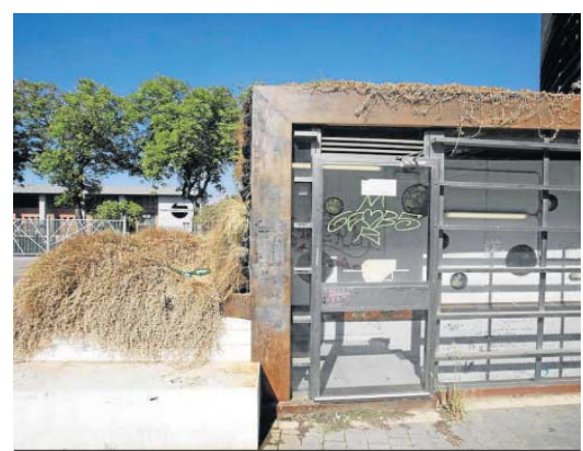
El acceso al aparcamiento subterráneo.

a continuación, se acometería una batida de limpieza y puesta a punto. En cuanto al vallado, sostienen que era una demanda de todos los propietarios y que el proyecto se ha trabajado, por lo que era una actuación planificada.