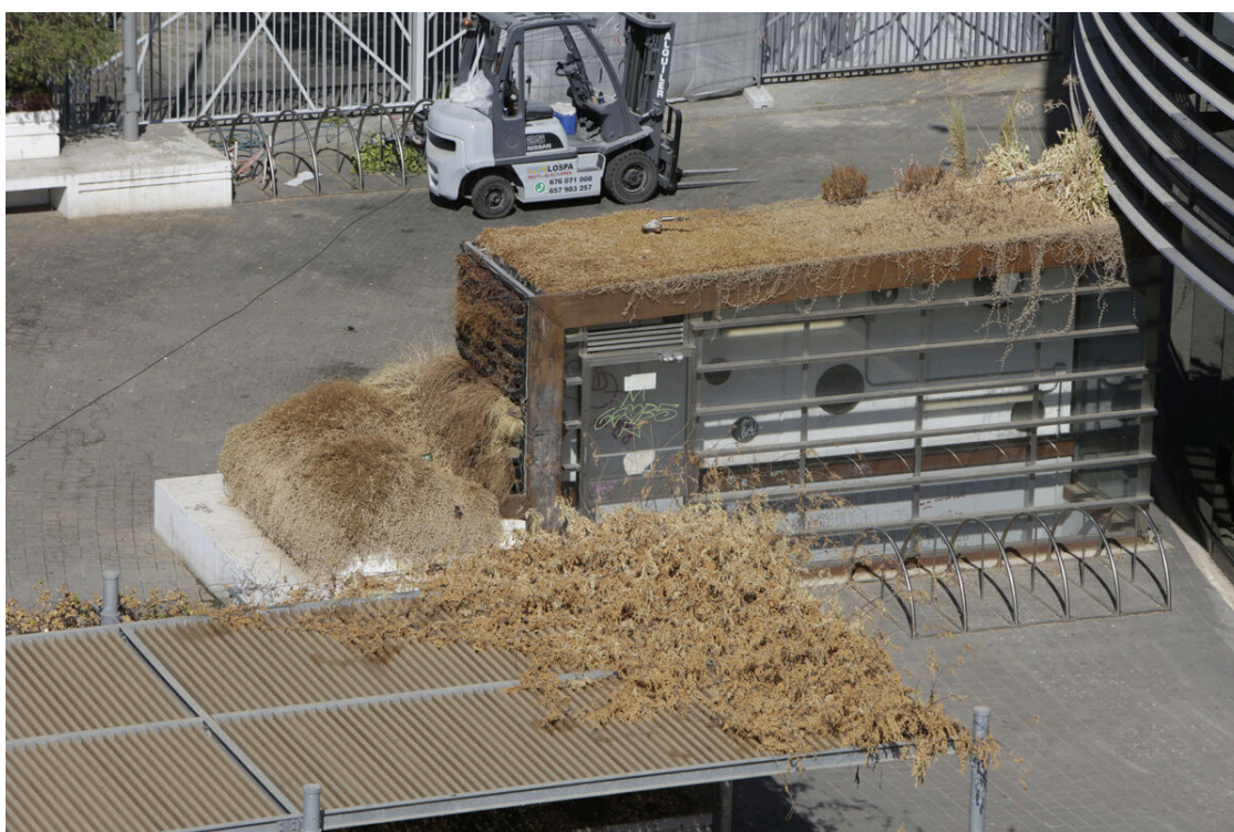
El acceso al aparcamiento subterráneo.

botellona o la presencia de jóvenes a horas indeseadas.