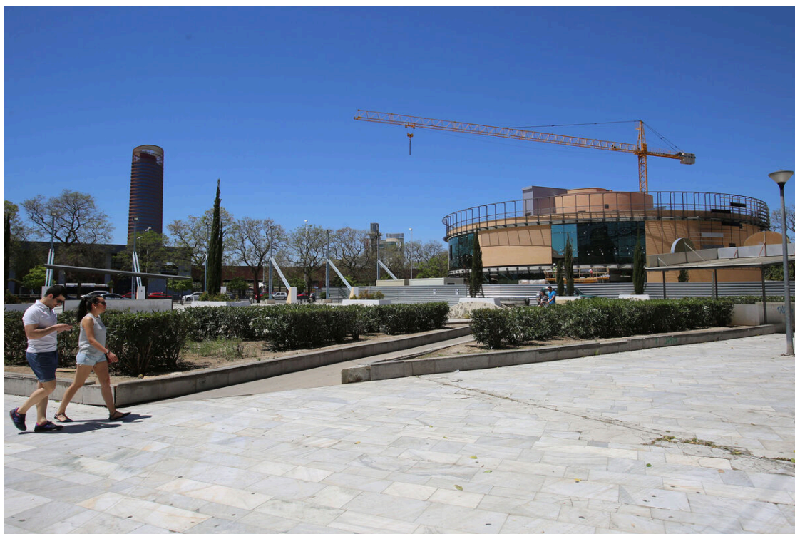
La antigua Plaza de Armas.

Las actuaciones consistieron en un incremento notable de las zonas verdes (unos mil metros cuadrados), mediante grandes jardineras con olivos y naranjos, entre otras especies, y enredaderas sobre pérgolas. Las salidas del aparcamiento subterráneo cuentan con cubiertas vegetales y jardines verticales. También se instalaron un nuevo pavimento de adoquines en dos colores y con una textura suave que sustituyó al sufrido mármol. Tres pérgolas dan sombra al espacio y en el extremo más próximo a Torneo se reservó un área para exposiciones y eventos de tipo lúdico y cultural. A ello, hay que añadir el parque infantil que se encuentra en el lateral de la calle Marqués de Paradas y la gran cantidad de bancos. Además, se impermeabilizó toda la superficie de la plaza para evitar filtraciones al aparcamiento subterráneo existente.