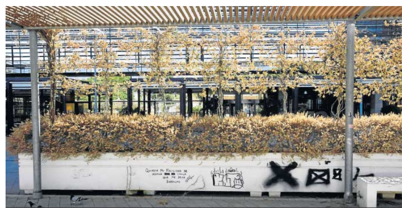
Jardinería con vegetación seca y pintadas.