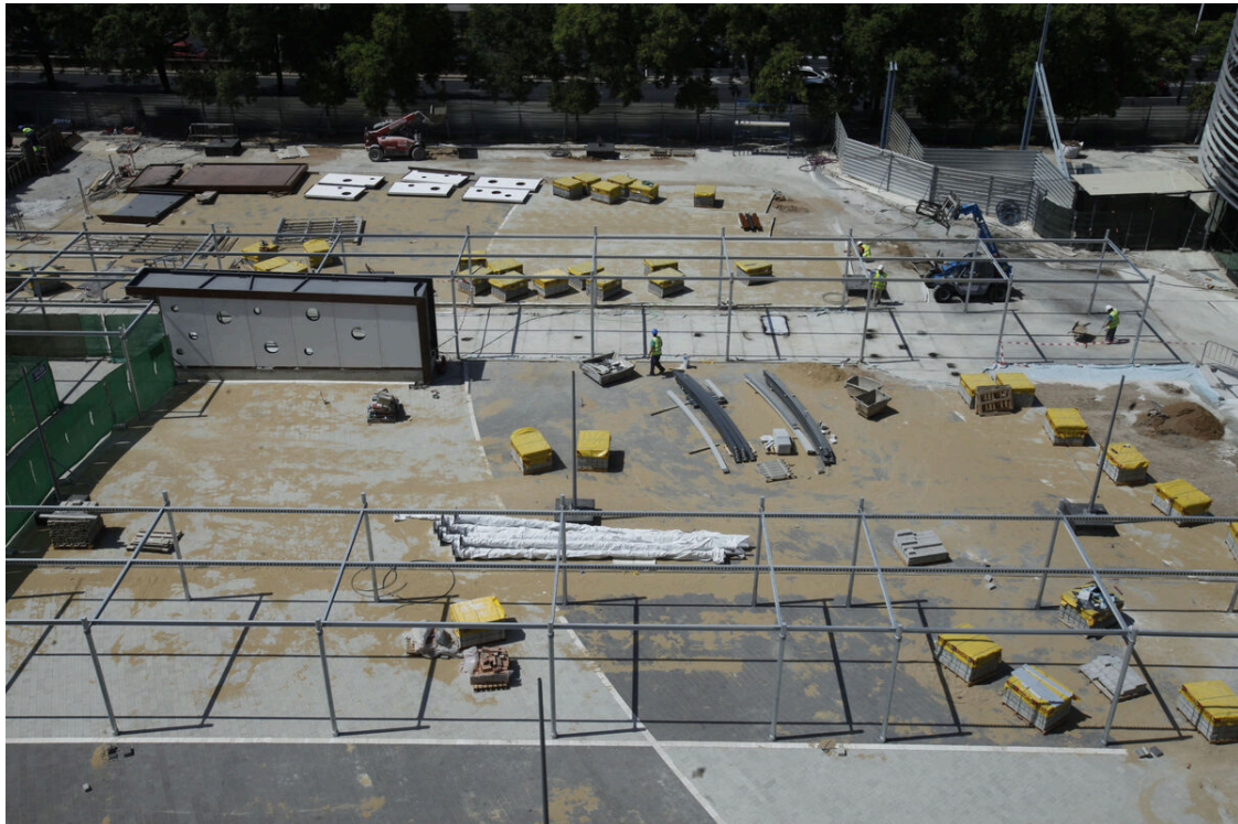
Las obras en Plaza de Armas.

Después de 25 años, Sevilla recuperó Plaza de Armas finales de 2016 para el disfrute de todos sus vecinos, fundamentalmente para los del entorno de Marqués de Paradas y los Humeros, que llevaban muchos años reclamando al Ayuntamiento inversiones en la zona. La reurbanización fue realizada por Mercadona , que también abrió un nuevo supermercado en superficie en la misma plaza. La única duda en ese momento era cuánto tiempo resistiría este nuevo espacio a los actos vandálicos.