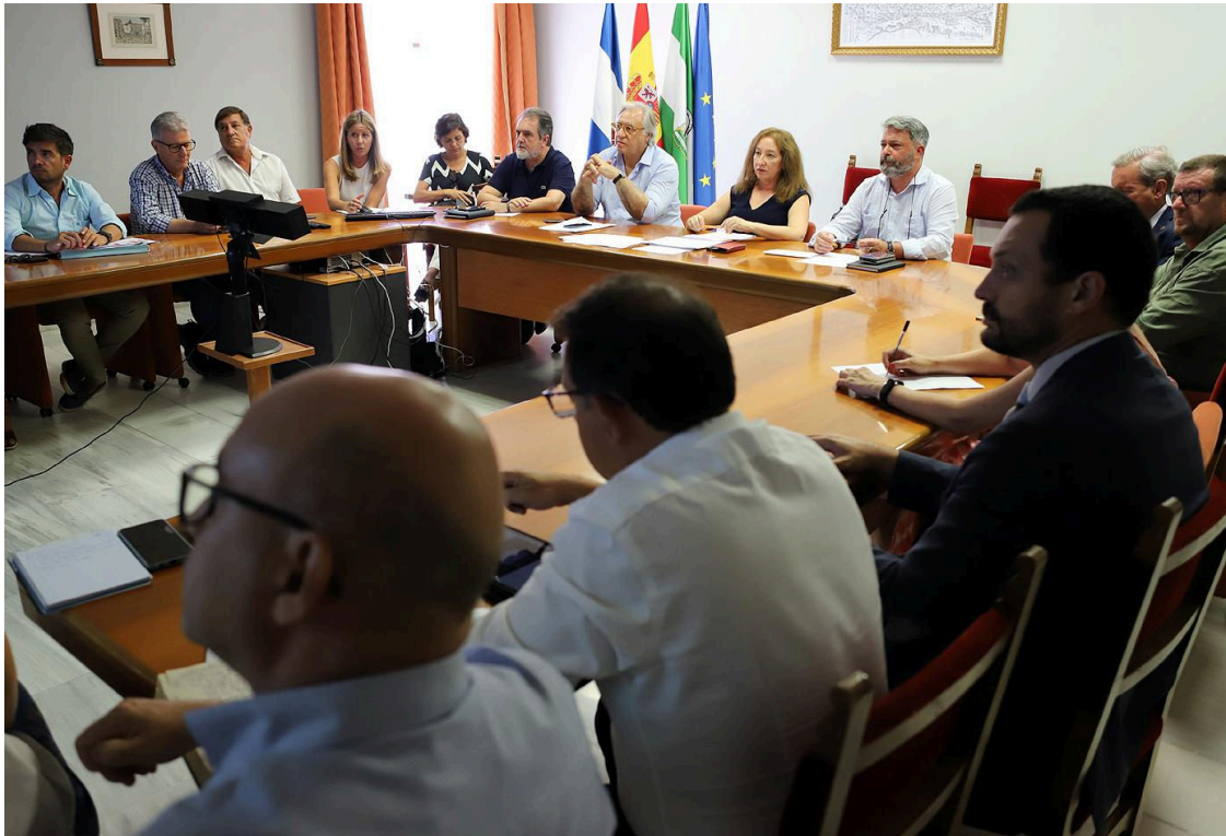
Imagen de la reunión de la Mesa de Turismo

La delegada de Turismo, Comercio y Consumo, Isabel Gallardo, junto al teniente de alcaldesa Dinamización Cultural y Patrimonio Histórico, Francisco Camas, y el delegado de Fiestas, Rubén Pérez, ha presentado a la Mesa del Turismo el balance de actuaciones, proyectos, adhesiones y la actividad de promoción turística llevada a cabo durante el primer semestre de 2022.