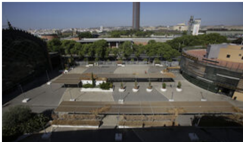
Abandono y mal estado de la plaza entre Mercadona y y...

Abandono y mal estado de la plaza entre Mercadona y Plaza de Armas