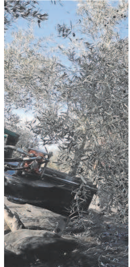
Aceitunas de la variedad manzanilla en

ros el kilo, lo que supone un incremento del 12% respecto a la media de los últimos cuatro años y del 8% respecto a la campaña anterior.