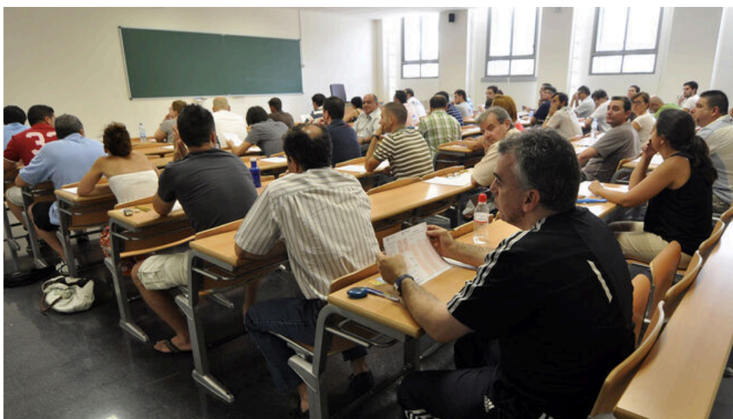
Imagen de archivo de oposiciones para el Ayuntamiento de Sevilla.

El Juzgado de lo Contencioso Administrativo número 11 de Sevilla ha dictado sentencia por la cual anula la convocatoria para plazas de peón de los años 2016 y 2017 por haber excedido el plazo de tres años fijado legalmente como máximo para terminar el proceso selectivo . Se da la circunstancia de que las bases fueron aprobadas al límite del plazo de tres años y la primera de las pruebas se realizó el pasado abril , es decir, seis años más tarde.