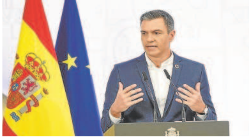
Sánchez comparece ante los medios sin corbata para dar ejemplo

La anécdota de la corbata (o en este caso su ausencia por motivos de eficiencia energética para los ciudadanos que no para el presidente que recorrió veintitantos kilómetros en helicóptero con el contrasentido que ello representa) es un caso más de la vileza o indignidad de este sujeto. Nos toma por tontos. Como su ministro de consumo que aconseja, por motivos similares, que nos hagamos veganos y le dejemos la cabaña ganadera para su entero disfrute. Pero, el 11% de inflación no se soluciona con peregrinas declaraciones como llevar o no corbata. Todo ello me retrotrae al oscarizado documental 'Una verdad incómoda' de Al Gore que predicaba un contrasentido si observamos su propio estilo de vida. Pareciera que las toneladas de CO2 emitidas en sus múltiples