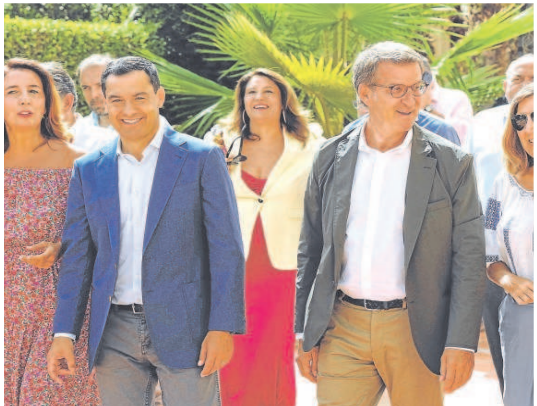
Juanma Moreno y Núñez Feijóo ayer en el inicio del curso político andaluz del PP en Alhaurín de la Torre

Un debate de propuestas y no de insultos. «Es bueno que comparezca en el Senado porque, mientras comparece en el Senado, los ministros no nos van a insultar y eso es muy importan-