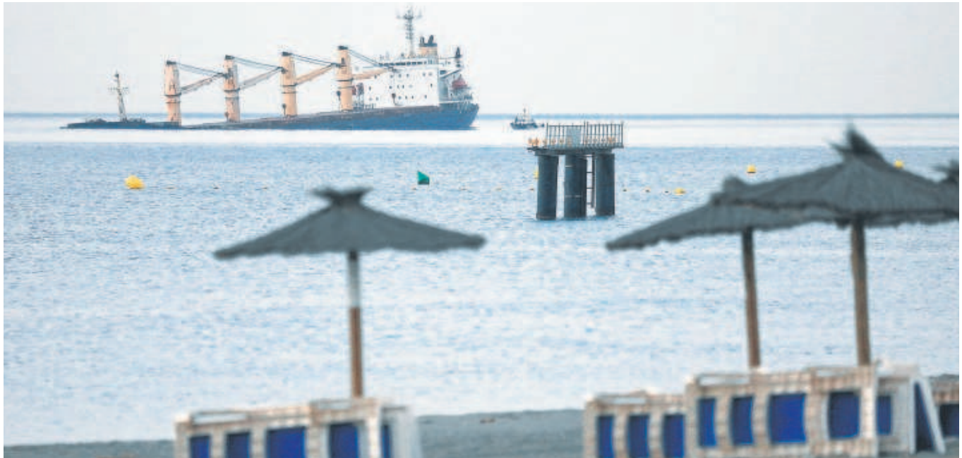
El OS 35 ayer con la proa más hundida en la bahía del Estrecho frente a la playa de los catalanes de Gibraltar