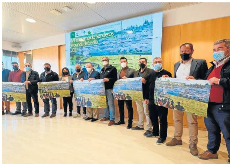
Imagen de archivo, durante la presentación del IV Programa Senderos Provincia Sevilla en febrero pasado.

En cuanto a la participación por géneros, el total de participantes femeninas ha sido de 456 y en general, en todas las