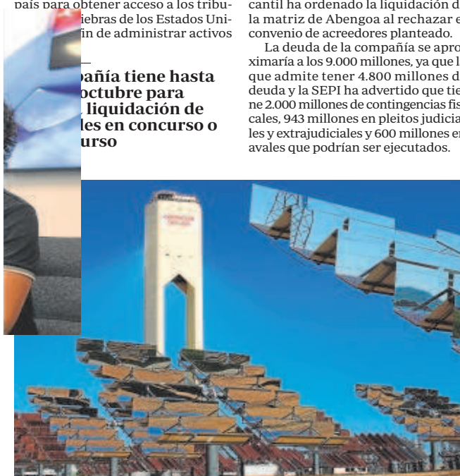
La matriz de Abengoa está en proceso de liquidación

La deuda de la compañía se aproximaría a los 9.000 millones, ya que la que admite tener 4.800 millones de deuda y la SEPI ha advertido que tiene 2.000 millones de contingencias fiscales, 943 millones en pleitos judiciales y extrajudiciales y 600 millones en avales que podrían ser ejecutados.