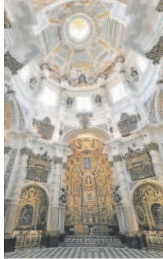
San Luis de los Franceses

La Diputación, a través de su Área de Cultura y Ciudadanía, presta apoyo al flamenco, seña identitaria indiscutible de la provincia, en todas sus manifestaciones y, de manera muy especial, colaborando con la Bienal de Flamenco de Sevilla desde hace ya varios años. En esta XXII edición, San Luis de los Franceses acoge una parte de su programación, la englobada en el ciclo denominado 'Gratia Plena', centrado en tres mujeres cantaoras de raíz, que se desarrollará en tres domingos de septiembre, a la hora del Ángelus, las 12 del mediodía: el domingo 11 con Juana la