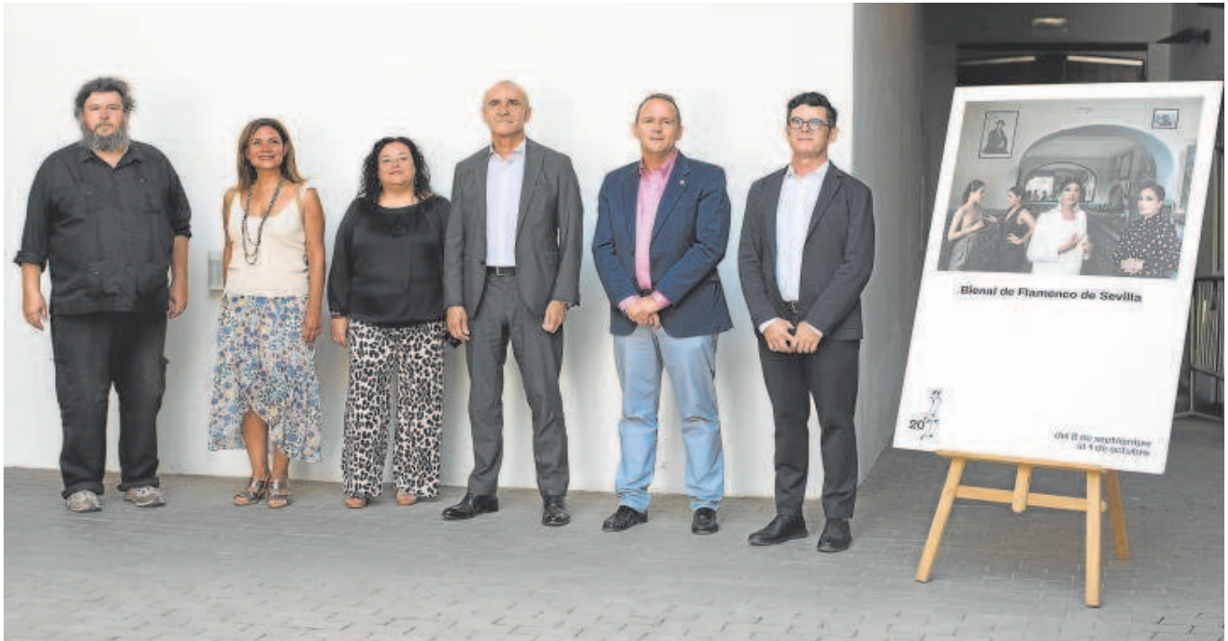
Presentación ayer de las jornadas sobre el Concurso de Cante Jondo de la Bienal