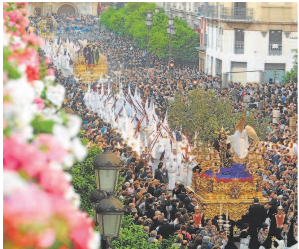
Montesión, San Gonzalo y la Amargura en el último Santo Entierro Grande de 2004

Las hermandades de la Madrugada del Viernes Santo analizarán la situación de sus cortejos después de que, en la reunión que se tuvo tras la pasada Semana Santa, algunos hermanos mayores señalaron que daban por finalizado el acuerdo aprobado en 2018 por el que el Calvario pasaba por la plaza del Museo o el Silencio rodeaba la Gavidía. De cara al año que viene, habrá que buscar otras posibilidades para el buen desarrollo de esta noche cenital de la Semana Mayor. Entre medio, el Consejo de Hermandades tendrá que elegir al pregonero o pregonera, al cartelista, a la imagen que presidirá el vía crucis de las cofradías en un primer lunes de cuaresma que será víspera del festivo del día de Andalucía. También se anunciará el pregonero de las Glorias, la imagen que presidirá este acto a principios del mes de mayo y el cartelista.