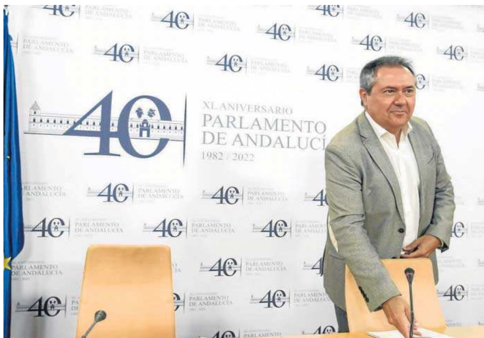
El secretario general del PSOE-A, Juan Espadas, ayer, en el Parlamento de Andalucía.

Espadas comienza la legislatura más complicada a la que el PSOE hace frente desde la creación de la Cámara autonómica.