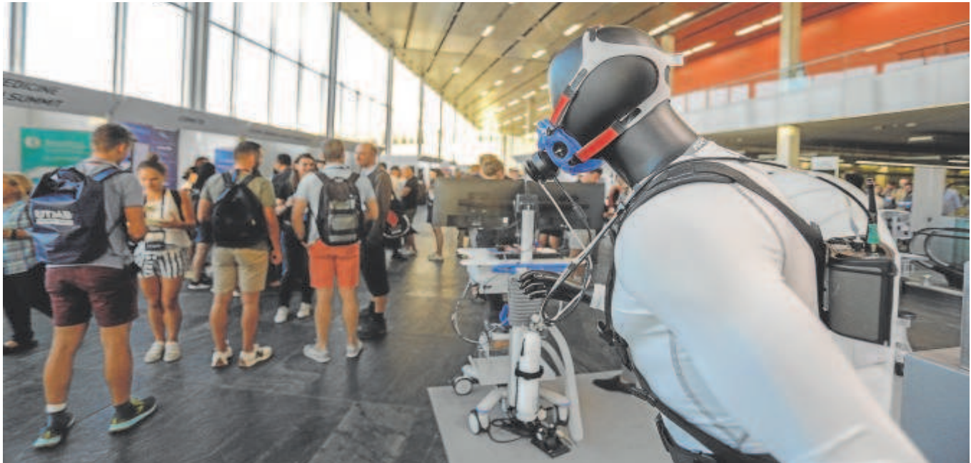
En la imagen, visitantes que asistieron ayer a la jornada inaugural del European College of Sport Science en Fibes