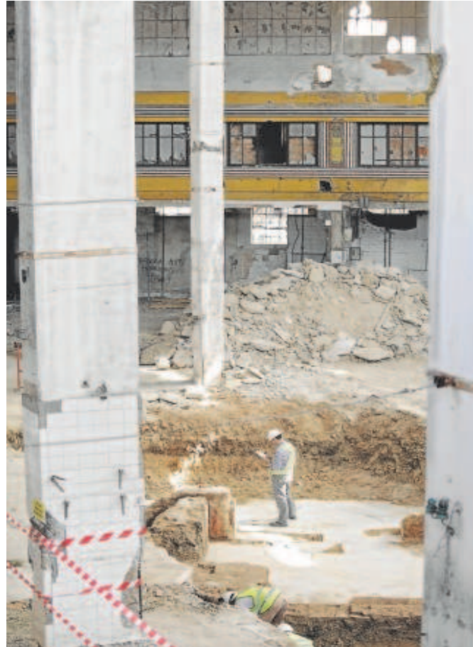
Obras en el antiguo mercado de la Puerta de la Carne en 2017

También, se refirió a que «hay que sumarle, 59.641 euros del contrato de vigilancia de este inmueble por el periodo de julio a marzo de 2023». Por tanto, el candidato del PP a la Alcaldía de Sevilla señaló que «casi ocho años perdidos, ya que la realidad es que todo sigue igual y el antiguo mercado de la Puerta de la Carne continúa su proceso de deterioro galopante y sin sacarse a licitación un nuevo proyecto de recuperación de este histórico edificio municipal».