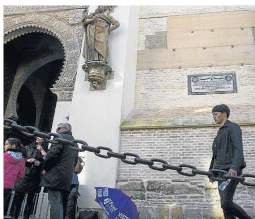
La lápida de Cervantes instalada junto a la Puerta del Perdón de la Catedral. ANTONIO PIZARRO

de cuartel, barrio o manzana; 42 de número de vivienda y 7 de enclaves o lugares destacados de la ciudad. Si bien se encuentran repartidas tanto por el Casco Antiguo como por Triana, es en el cuadrante suroccidental del centro donde su presencia es mayor. En total, se protegerán 120 placas de Olavide.