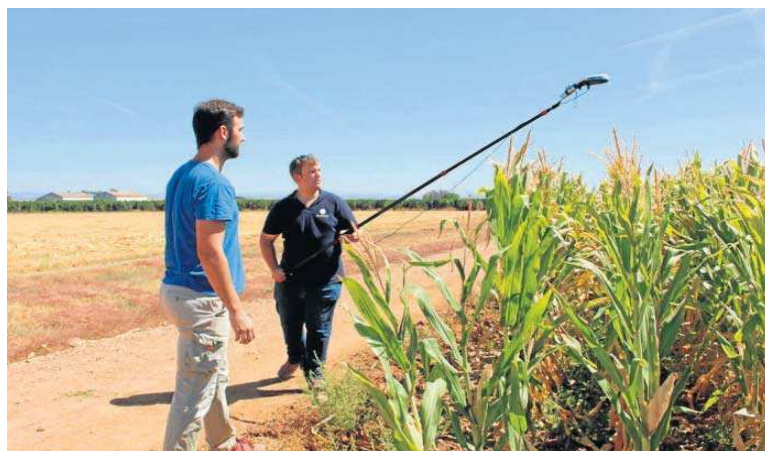
Las nuevas tecnologías ya se están introduciendo en el sector agrario para el seguimiento de los cultivos.