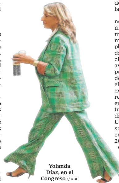
Yolanda Díaz, en el Congreso

Y es que si así fuera no se explica el júbilo reinante ayer en Podemos.