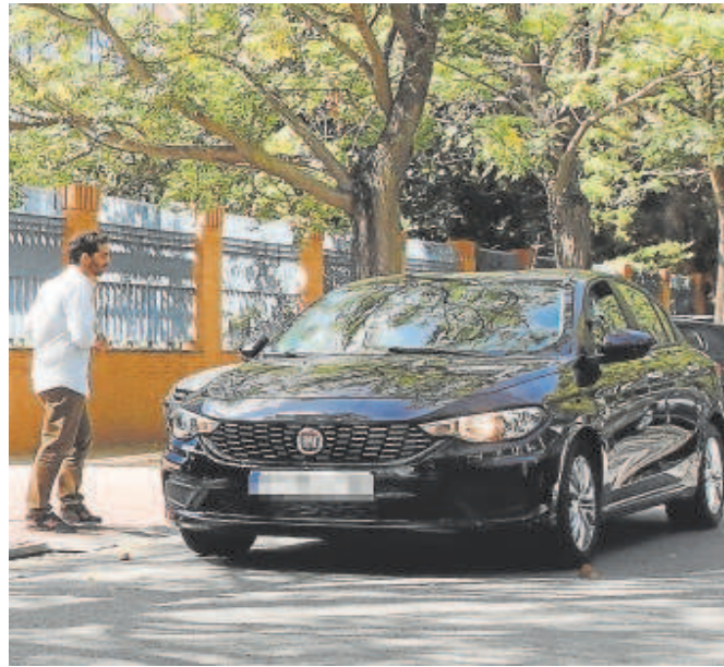
Los VTC son por ley concertados de forma telemática

Uno de estos artículos, el tercero, se refiere a la precontratación de servicios por el que se establece que, salvo casos de urgencia, ésta deberá realizarse, «al menos, con una antelación de quince minutos previos a su efectiva prestación y deberá quedar constancia de los mismos para evitar problemas de movilidad, congestión de tráfico y medioambientales». Los magistrados no encuentran razón alguna para sostener esta limitación de tiempo ya que la precontratación telemática de estos servicios ya viene impuesta por la normativa estatal (artículo 182 del Real Decreto 1211/1990 de 28 de septiembre).