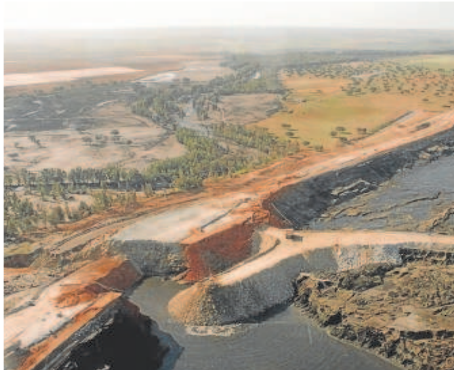
Imagen de la rotura de la balsa de lodos que causó el desastre ecológico

La Administración andaluza, según la representación jurídica de la misma, asumió la «intervención coordinada» para combatir el citado macro vertido y restaurar el daño medioambiental, aunque desde un primer mo-