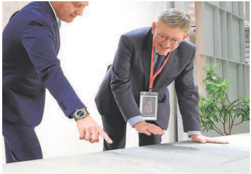
Ximo Puig, presidente valenciano

En el Gobierno valenciano se trataba de limitar ayer el choque. Pero en último término ponían en valor su autonomía: «Cada uno tiene sus competencias». Desvelaban que llegó a ser necesaria una conversación entre Pedro Sánchez y Ximo Puig. Aunque pilotó los contactos la ministra de Hacienda, María Jesús Montero. Que también se vio obligada a hablar con el consejero de Hacienda valenciano, Arcadi España. Desde otros gobiernos regionales reconocen que trabajan en reformas fiscales, pero que han espe-