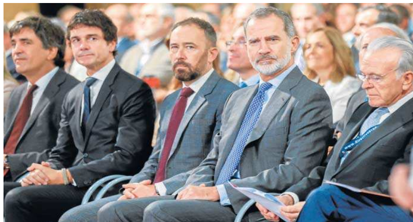
Felipe VI, acompañado por el presidente de La Caixa, Isidro Fainé, asiste al XXI Congreso de la CEDE.