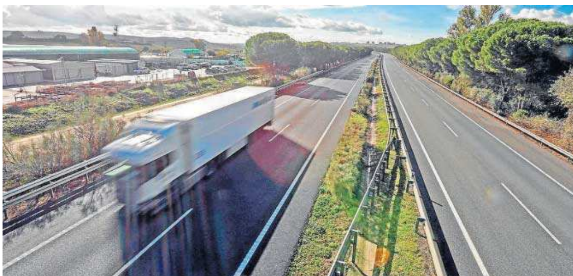
Una vista de la AP-4.