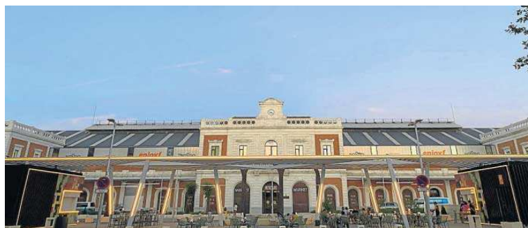
La Placita de San Bernardo, el nuevo proyecto de Puerto de Cuba.

● El Grupo Puerto de Cuba abre La Placita de San Bernardo, un nuevo proyecto que ayuda a recuperar un rincón para la ciudad