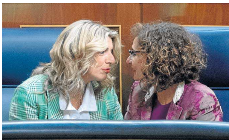
Yolanda Díaz y María Jesús Montero, ayer en el Congreso de los Diputados.