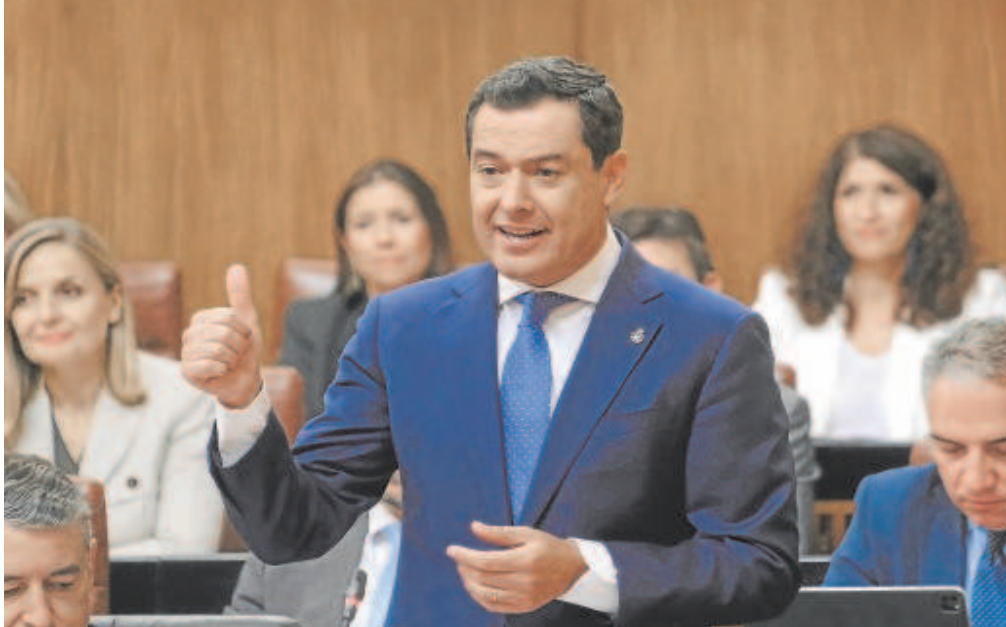
Juanma Moreno (arriba) y Juan Espadas (abajo), en la sesión de control de eayer en el Parlamento