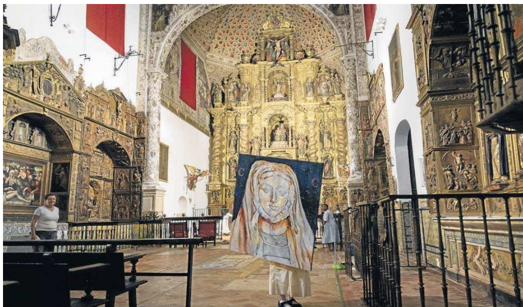
Las religiosas de Madre de Dios dando ayer los últimos retoques a la iglesia para su reapertura. ANTONIO PIZARRO

apreciar muy bien. En el interior, adosado al muro de la calle San José, ha aparecido un pozo, un elemento que ha sorprendido mucho a los técnicos y que les ha llevado a hacerse muchas preguntas.