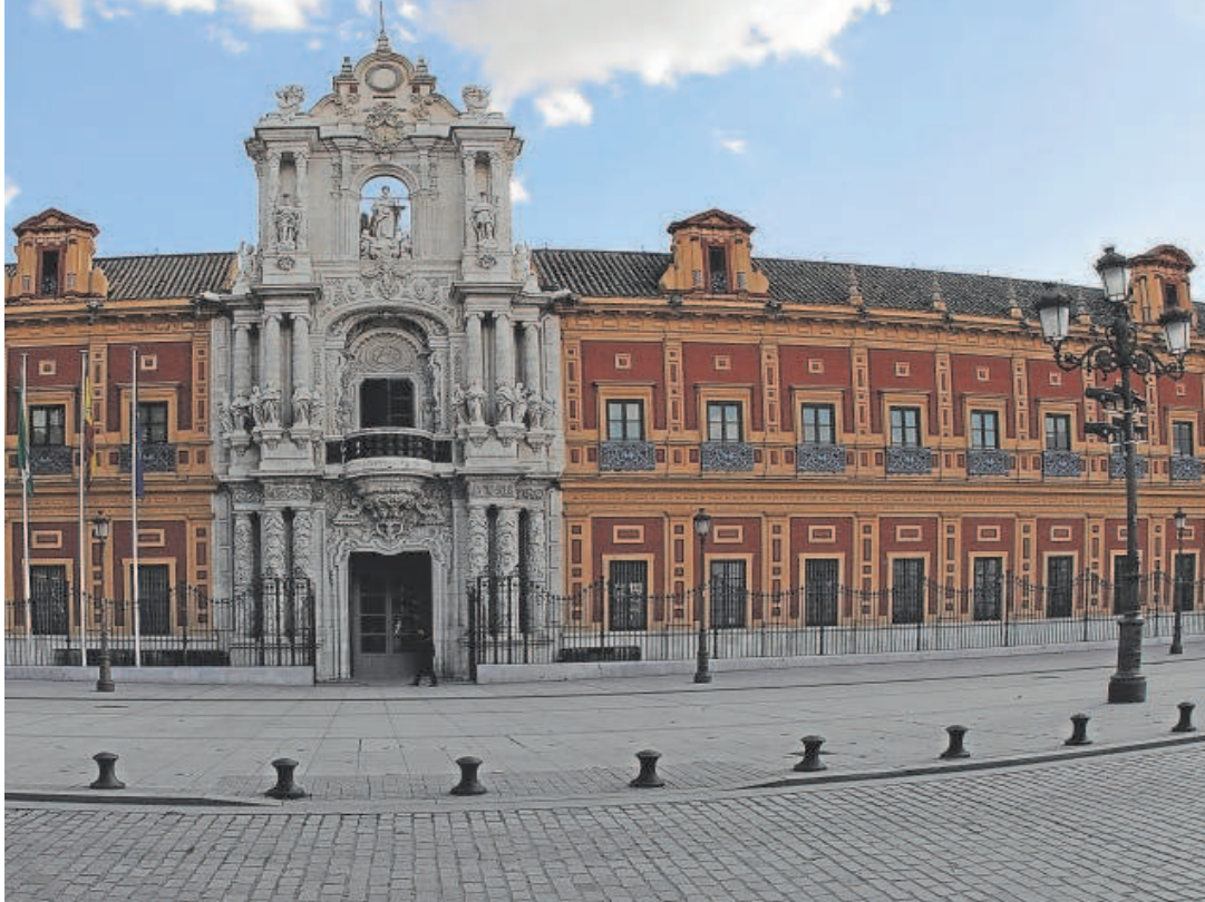
Fachada del Palacio de San Telmo en Sevilla, sede del presidente de la Junta