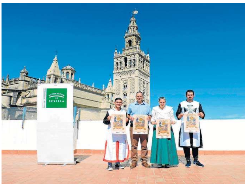
Acto de presentación de las Jornadas Medievales de La Puebla de los Infantes en la Casa de la Provincia.

La Puebla de los Infantes tiene una rica y variada gastronomía, por lo que en las inmediaciones del castillo, habrá tabernas de tapas tematizadas al Medioevo, platos tan singulares como el