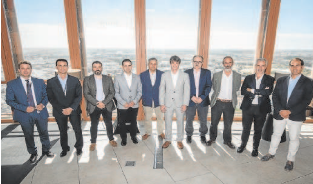
Representación de los patrocinadores de la KH-7 Carrera Nocturna del Guadalquivir en Torre Sevilla