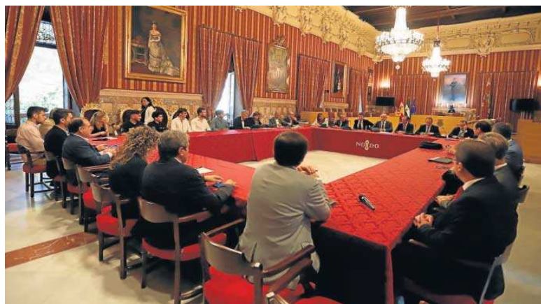
Primera reunión ayer para preparar la candidatura de Sevilla como sede de la Agencia Espacial Española. M. G.

El primer edil socialista aseguró que todos los integrantes