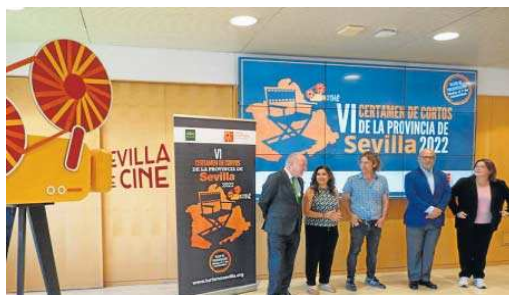
Presentación del Certamen de Cortos.

La Diputación, a través de Prodetur, tiene abierto el plazo de presentación de trabajos, hasta el próximo 7 de noviembre de este año, al Certamen de Cortos de la Provincia de Sevilla, en su sexta edición. Se trata de una iniciativa con la que se pretende que el cine sirva de escaparate internacional del territorio como destino turístico, además de potenciar la creatividad y el talento de los profesionales del sector audio-