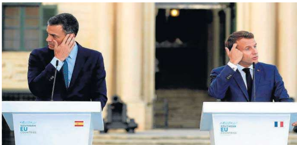
Pedro Sánchez y Emmanuel Macron en el transcurso de una cumbre en Malta.

En concreto, Macron dijo que no comprende “el problema a corto