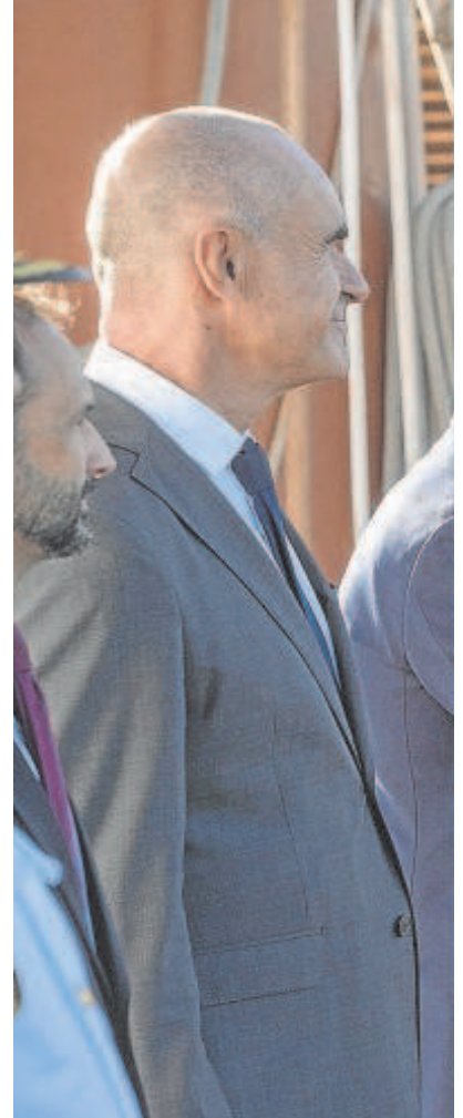
Felipe VI saluda al presidente de la Junta en la cubierta del Juan Sebastián Elcano

Tras ello, el Juan Sebastián de Elcano, rodeado de todos los buques mencionados y de aproximadamente al menos un centenar de embarcaciones civiles ha navegado en demanda de la boya anteriormente conocida como del Perro y que desde hace tres años lleva el nombre del ilustre marino, situada en la desembocadura del río Guadalquivir y que es punto tradicional