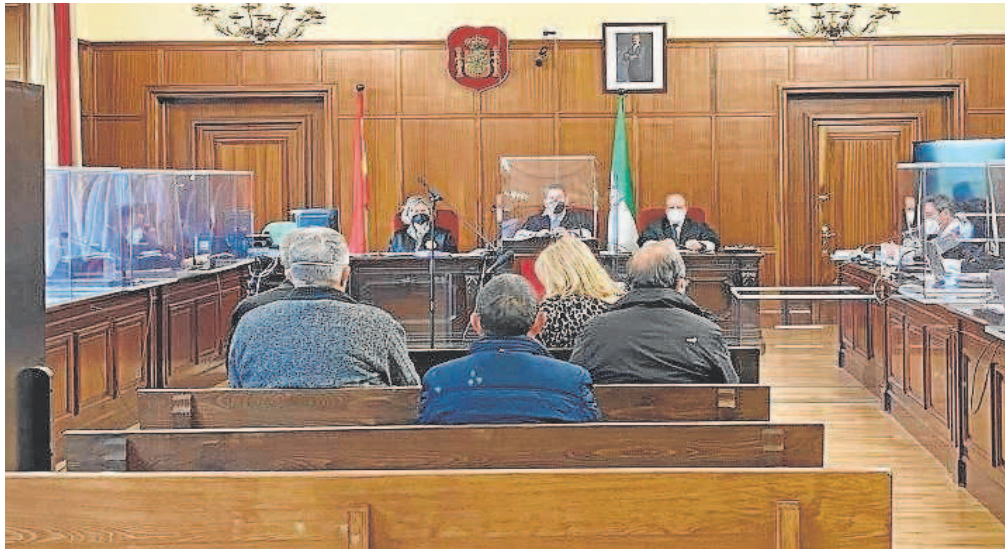
Primera sesión del juicio de los ERE por la ayuda a Novomag en Sevilla