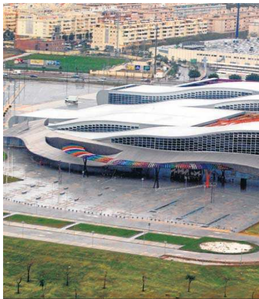
El congreso se celebra en el Fycma de Málaga.

Se trata de compañías como Activacar, Aertec, Applus, BAE Systems, Bigbelly, Bosch, Dekra, Europcar Mobility Group, Fundación Once, Gecor, Iberdrola, Innovasur, Inta, Itron, Link by Superpedestrian, Minsait, Renfe,