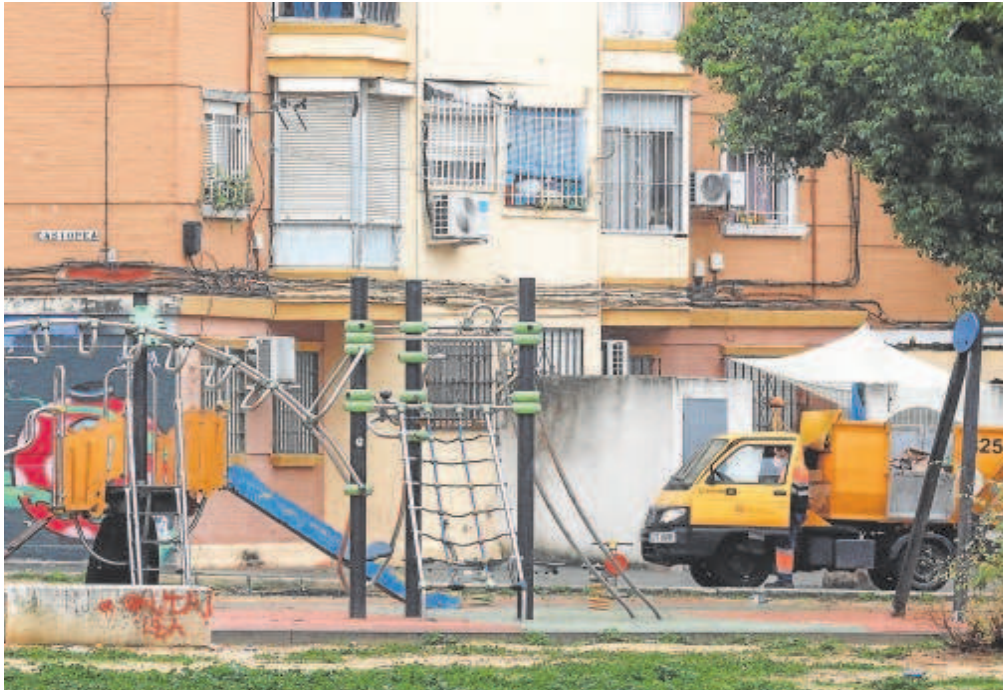
El candidato del PP a la Alcaldía lamenta que varios distritos aún no hayan recibido inversión // MANUEL GÓMEZ