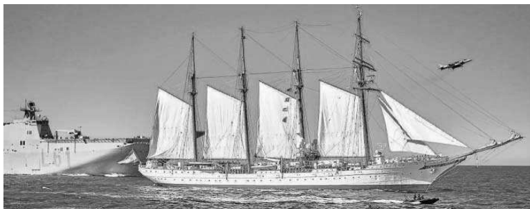
'Elcano' flanqueado por el buque insignia de la Armada y un caza de la Novena Escuadrilla.

“Su esfuerzo y tesón permitieron completar por primera vez en la historia de la humanidad una circunnavegación al globo terráqueo”, recordaron en una alocución que resumió la historia de la gesta iniciada por Magallanes, bajo los auspicios de la corona española, en 1519 y terminada en 1522. Estuvo llena de “múltiples avatares, dificultades y sufrimientos” pero hoy en día, 500 años después, por lo que significó, ha convertido a Elcano en “un personaje capital en la historia de la navegación”. Un hito que merece ser recordado en su lugar de partida y llegada al cumplirse su V Centenario.