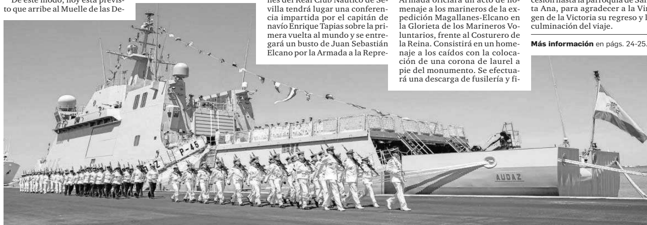
La Armada abre a las visitas el buque 'Audaz', del 8 al 10 de septiembre.