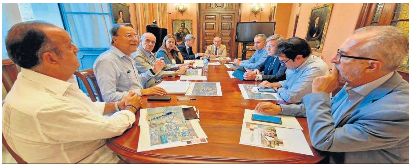
Una instantánea del Pleno del Consorcio de la Zona Franca.