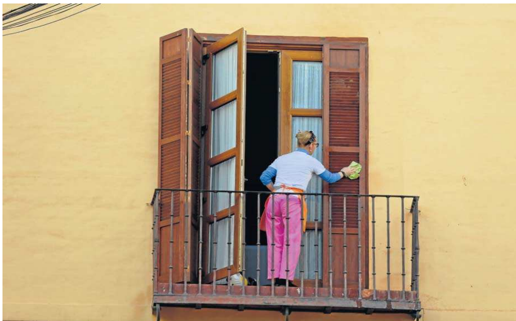
Una empleada del hogar durante sus labores.