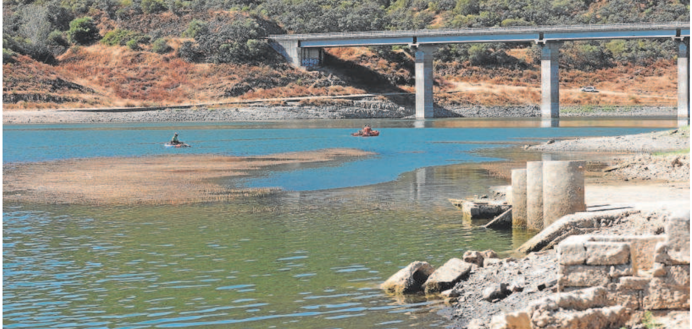
Estado del embalse de Navallana en la provincia de Córdoba