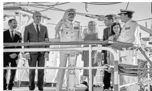
El rey Felipe saluda a su llegada a 'Elcano', junto a las autoridades.

Sanlúcar se vistió de fiesta y la Armada quiso poner de su parte: una revista naval con nada menos que 12 de sus buques, aviones y helicópteros –casi todos con casa en la provincia gaditana– para homenajear a Elcano y los marinos que completaron junto a él la primera vuelta al mundo. Justo en este mis-