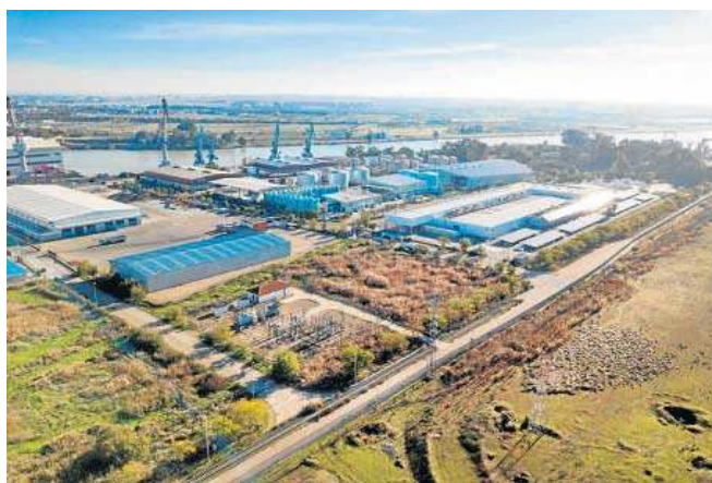
Vista aérea de la Zona Franca a finales de 2021.