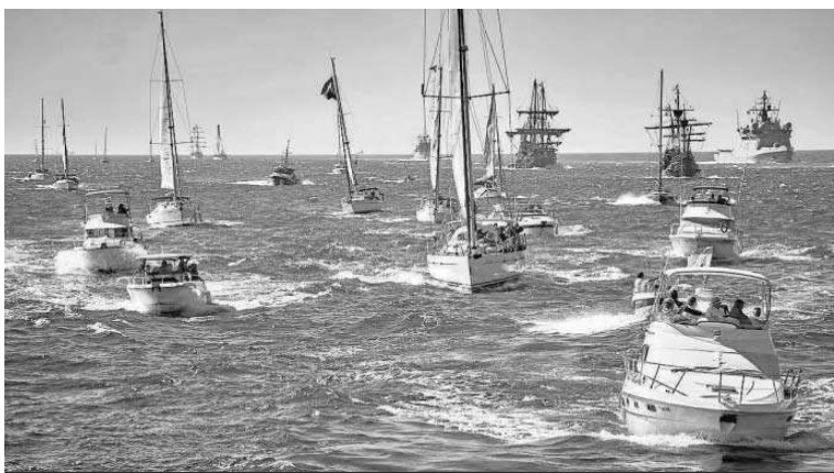
Barcos de recreo siguen el rumbo de 'Elcano', con las naves históricas nao 'Victoria' y el galeón 'Andalucía'.

Poco antes de las once de la mañana ya era visible la formación, uno detrás de otro, de los buques que iban a dar una pasada por delante del Juan Sebastián de Elcano . Liderando iba el LHD Juan Carlos I desde donde despegaron hasta cuatro aviones Harrier para dar el pistoletazo de salida a esta parada naval.