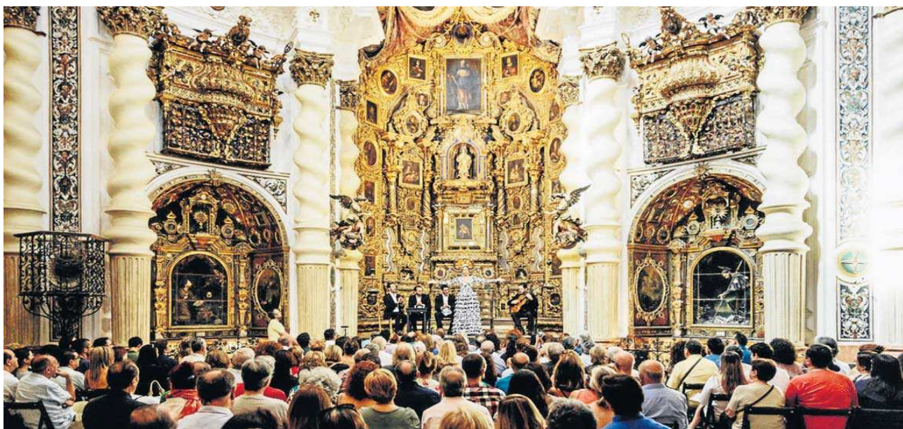
Iglesia de San Luis de los Franceses.