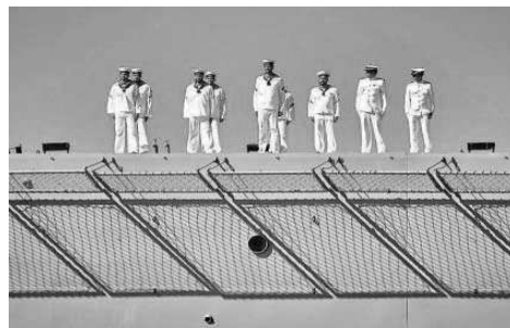
La dotación del 'Juan Carlos I' formado en cubierta.