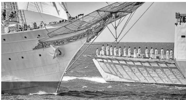
Uno de los buques pasa por delante del bergalín goleta durante la revista naval.