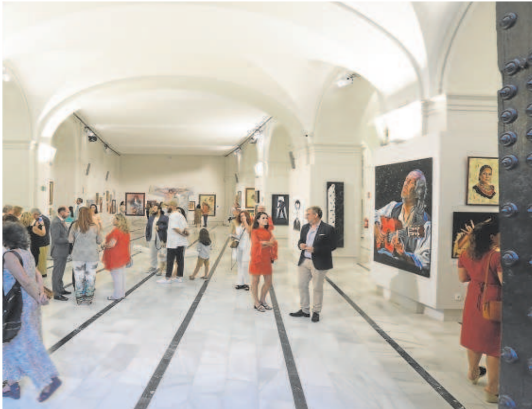
Aspecto de la Galería de ABC con algunos de los cuadros que conforman la exposición