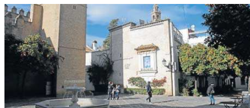
Plaza de la Alianza en el barrio de Santa Cruz.

al Centro de Iniciativas Culturales de la Universidad de Sevilla (Cicus) y el convento Madre de Dios. Allí el hotel que se levantará será de dos estrellas y nueve habitaciones.