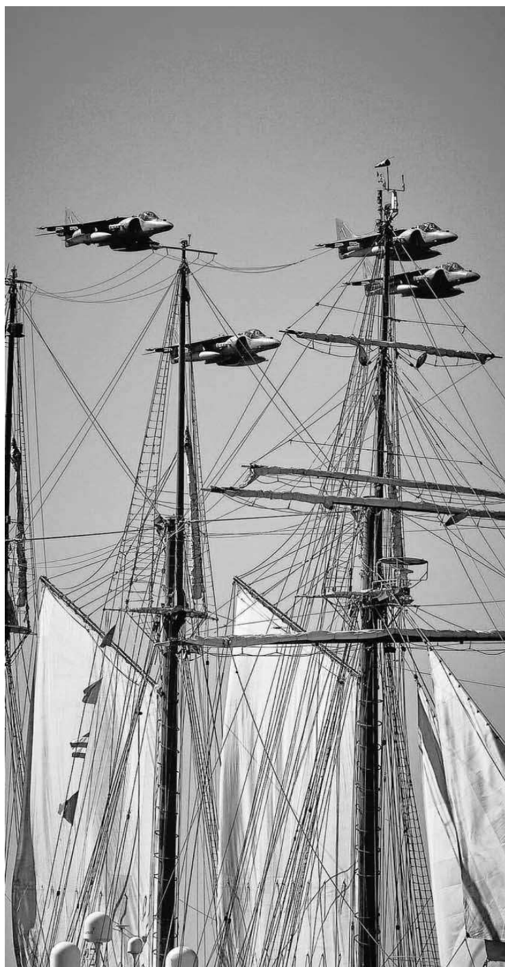
Cuatro Harrier sobrevuelan el buque escuela 'Juan Sebastián de Elcano'.