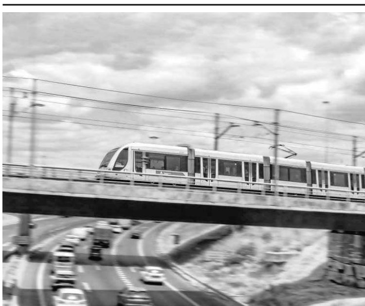
Un vehículo de la línea 1 del Metro de Sevilla.

Las instituciones y empresas que suscriben este escrito son el Real Betis Balompié, Grupo Ybarra, Gaesco (Asociación de Constructores y Promotores de Sevilla), Pinturas Eurotex, Asociación Sevillanemueve, UITP (Unión Internacional del Transporte Público), Club Náutico de Sevilla, Gipia Estudio y Obras, Fundación Don Bosco, Colegio de Economistas de Sevilla, Colegio Oficial de Arquitectos de Sevilla, Colegio de Ingenieros de Caminos, Canales y Puertos de Andalucía y el Colegio