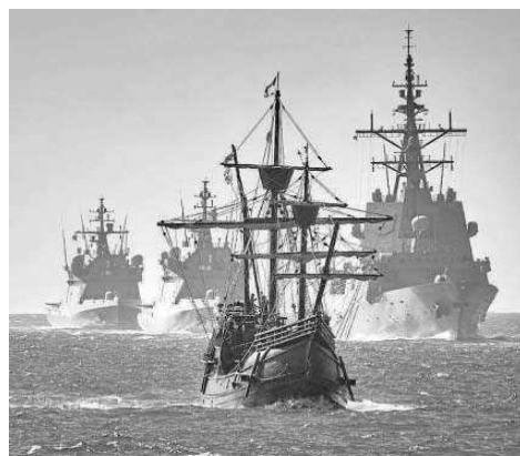
El galeón delante de varias fragatas de la Armada.

Aplausos y bocinas desde los barcos respondían entonces a los saludos del Rey, que casi tres horas antes había subido al buque escuela atracado en la Base Naval de Rota con honores de ordenanza y veintiún cañonazos. A bordo le acompañaron en la navegación el presidente de la Junta de Andalucía, Juanma Moreno; la presidenta del Congreso, Meritxell Batet; la ministra de Defensa, Margarita Robles, el almirante jefe del Estado Mayor de la Arma-