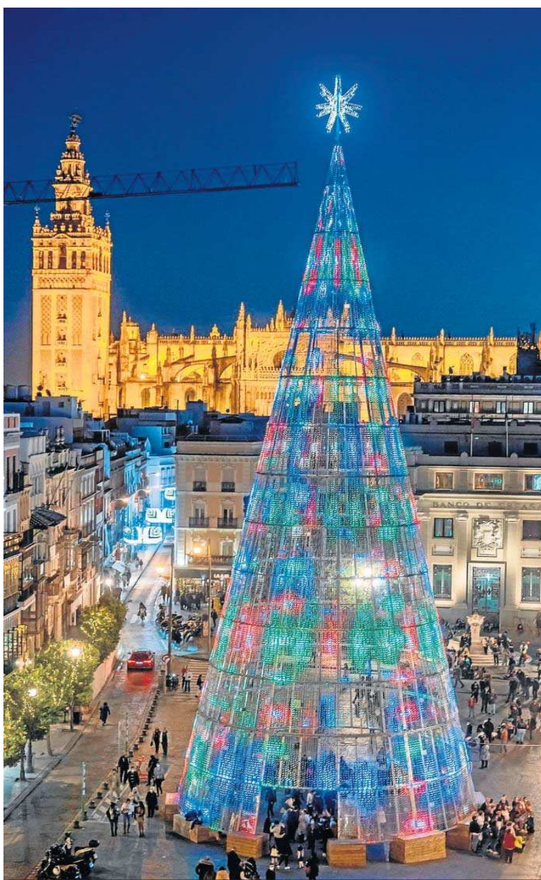
Un enorme árbol en la Plaza de San Francisco fue lo más destacado de la iluminación de la Navidad pasada.

La investigación, que aún continúa abierta, ha pasado por diferentes fases, la última de ellas finalizó el pasado mes de junio. La Policía Nacional ha advertido a las empresas de la ciberestafa del intermediario y ha dado recomendaciones para evitar ser estafados a través de este método.