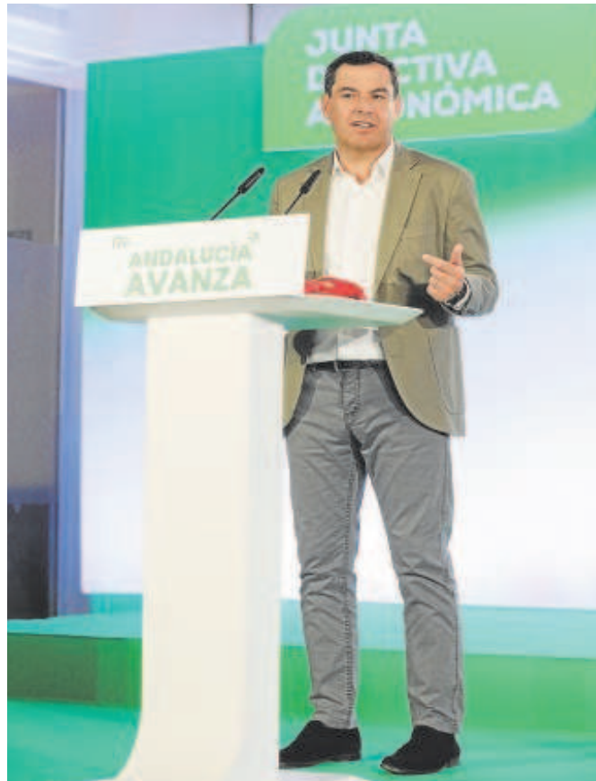
Juanma Moreno, presidente de la Junta de Andalucía

«En la sociedad quizá no hablamos con la suficiente claridad con los ado-