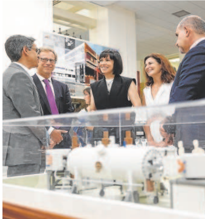
Diana Morant, ministra de Ciencia (en el centro) ayer en Sevilla

Morant recordó que antes, cuando se hablaba de abrir cualquier agencia o organismo, siempre se pensaba que «iba a ir a Madrid», algo que el Gobierno central tiene intención de cambiar con la descentralización que ha anunciado. «Los jóvenes que estudian en Sevilla o en cualquier parte de España entendían que su futuro tenía que ser abandonar su tierra e irse a Madrid, a Londres o a Estados Unidos», admitió la ministra en la puerta de la ETSI, una escuela de la que salen cada año cientos de egresados de varias titulaciones de ingeniería, muchos de los cuales deben marcharse fuera para