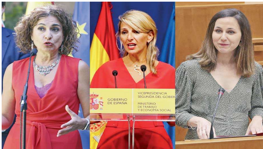
María Jesús Montero, Yolanda Díaz e Ione Belarra.