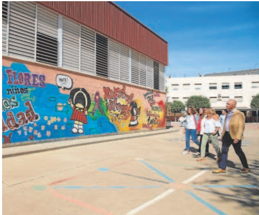
El alcalde, Antonio Muñoz, visitando el colegio Pino Flores

El alcalde, Antonio Muñoz, destacó tras la visita al centro escolar Pino Flores que «este centro ha contado con la mayor inversión que se ha ejecutado en mucho tiempo gracias a este programa de actuaciones que ha supuesto la transformación de 21 centros educativos y que miles de familias de los barrios de Sevilla van a ver en su vuelta a las aulas a partir del próximo lunes» y recordó que «a esta transformación sin precedentes realizada con fondos europeos obtenidos a través de la Agencia Andaluza de la Energía se suma otro conjunto de 26 actuaciones con un presupuesto municipal de 2,8 millones de euros en todos los barrios y distritos de la ciudad, lo que supone que 2022 ha sido probablemente el ejercicio en el que hemos concluido un mayor vo-