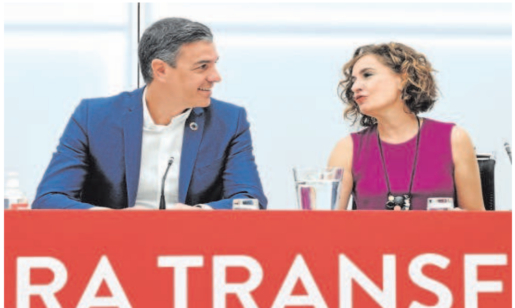
Pedro Sánchez, presidente del Gobierno, y María Jesús Montero, ministra de Hacienda

La proposición de ley prohíbe que las empresas repercutan los gravámenes a los consumidores; lo que sí quedó descartado de plano fue incluir esto como delito en el Código Penal, como reclamaba la formación de Ione Belarra. ¿Cómo se hará eso? No lo aclara el Ejecutivo. La realidad es que se encomiendan a que la Comisión Nacional de los Mercados y la Competencia (CNMC) y el Banco de España articulen la forma para vigilar este aspecto y sean las que impongan sanciones de hasta un 150% sobre la cantidad que se traslade al cliente.