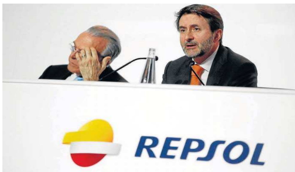
El consejero delegado de Repsol, Josu Jon Imaz.

En el acuerdo se incluye la cartera global de exploración, desarrollo y producción de Repsol, con una producción estimada para el año 2022 de 570.000 barriles