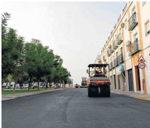
Imagen de una de las calles asfaltadas por el Ayuntamiento.