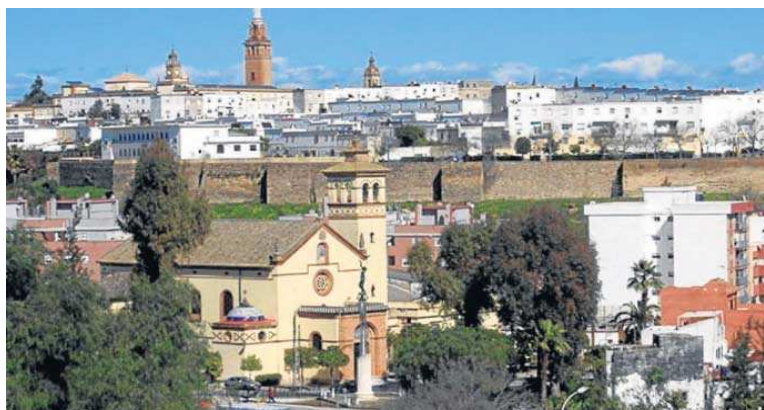
Imagen de archivo de San Juan de Aznalfarache.

En el comunicado, el Ayuntamiento sanjuanero ha explicado que, además de estos proyectos, "que ya se encuentran en fase avanzada y que en la mayoría de los casos deberán estar concluidos en el primer trimestre de 2023", se continúa buscando la "mejor solución" para las Plazas de la Constitución y Félix Rodríguez de la Fuente. En este senti-