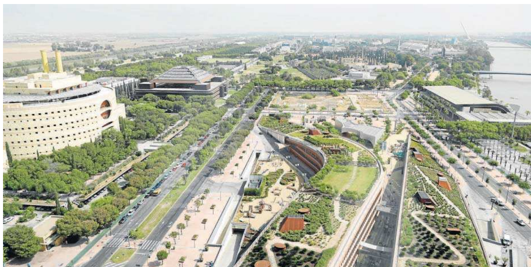
Vista aérea de la Isla de la Cartuja desde Torre Sevilla.