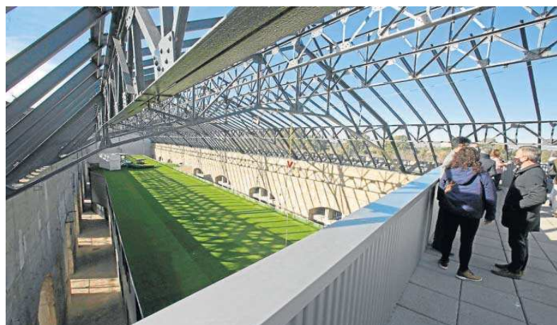
Una de las últimas visitas a las obras en las Naves de Renfe de San Jerónimo.

puesta en marcha está pilotando el Consejo del Espacio. El futuro ente integrará servicios que hasta ahora están en distintos ministerios, y en particular en dos: los de Ciencia y Defensa.