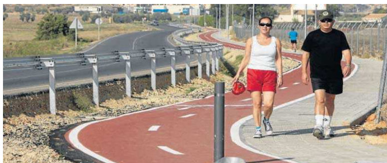
Dos personas pasean por el carril bici de Salteras a Olivares.

El alcalde, Antonio Valverde, expresó que la corporación "está encantada porque ya el teatro municipal y el centro cultural de Salteras se ponen en funcionamiento con los accesos ya finalizados para unas infraestructuras imprescindibles y necesarias para nuestros vecinos". Además del teatro, que cuenta con una actividad cultural importante y con dos sociedades filarmónicas, el espacio cultural dispone de espacios expositivos, de reuniones y con