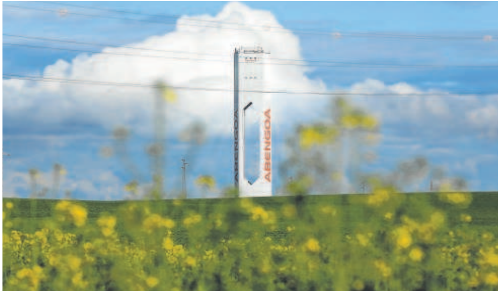
El Juzgado Mercantil de Sevilla se ocupa de los preconcursos y concursos de filiales del grupo Abengoa