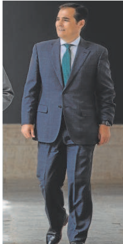
patios de San Telmo en Sevilla

Cuando el puesto lo permita, la Junta facilitará el teletrabajo, que se vio impulsado durante la pandemia. En aras de facilitar la conciliación familiar, la norma también incluye el derecho del empleado a desconectar del uso de los medios tecnológicos de comunicación en sus periodos de descanso.