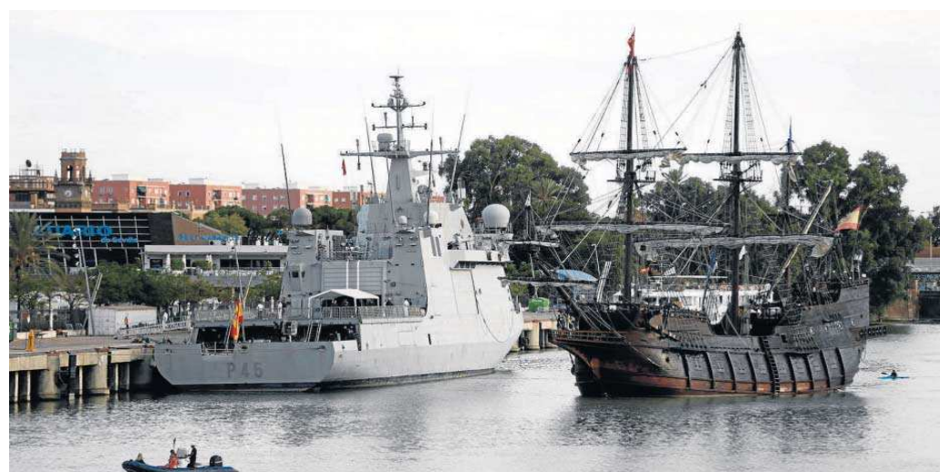
Llegada ayer a Sevilla del galeón 'Andalucía' por los actos de celebración del V Centenario de la vuelta al mundo.