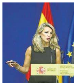
Yolanda Díaz.

que carece de encaje en los tratados de la UE. Pero la ministra de Defensa, Margarita Robles, cuya cartera no se circunscribe a asuntos económicos y que ya había mantenido diferencias con Díaz, fue la más contundente. Robles criticó la propuesta porque es algo que "no le corresponde hacer" a Díaz, a la que acusó de anunciar lo que se le "ocurre" para "quedar bien", y en ese sentido, lamentó que dentro de un "órgano colegiado" como es el Gobierno "algún ministro quiera en-