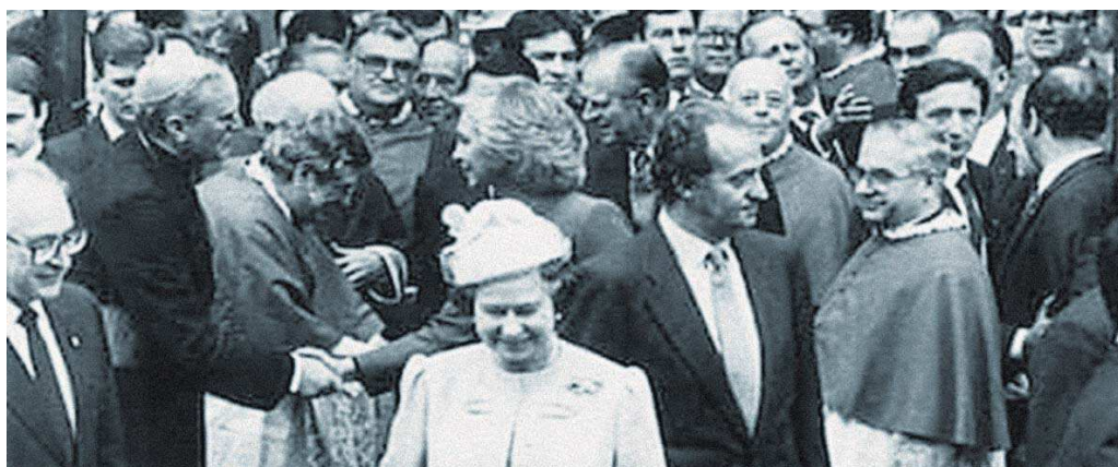
La reina de Inglaterra junto al rey Juan Carlos.