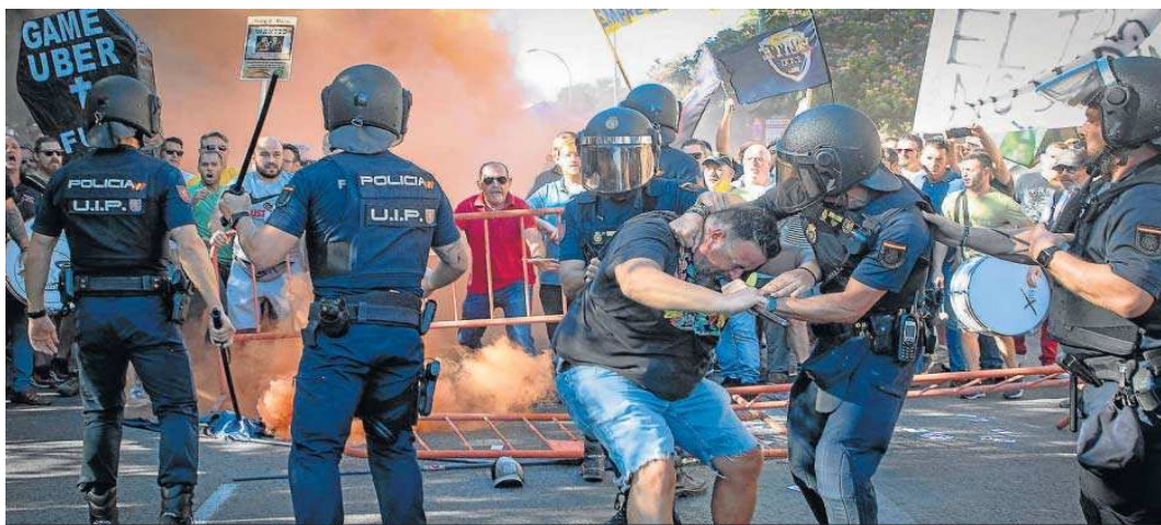
Enfrentamiento con la Policía de uno de los taxistas que fueron detenidos ayer en Sevilla.