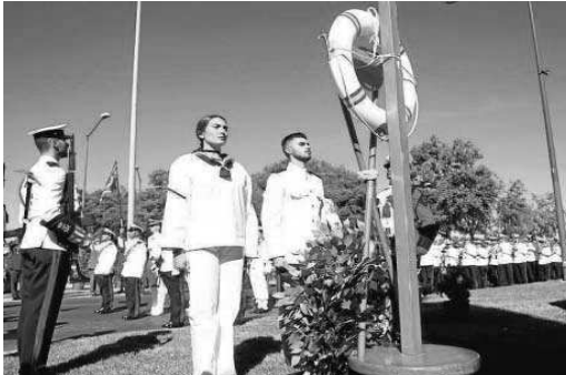
Homenaje a Elcano y ofrenda a los caídos.

● La llegada de la réplica de la nave de Elcano da el pistoletazo de salida a la conmemoración de los 500 años de la gesta