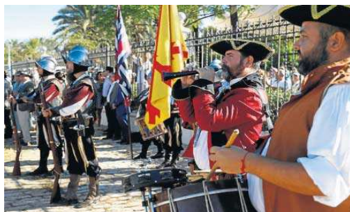
El Tercio Duque de Olivares recibe a los marineros de la nao 'Victoria'.

que, caracterizados como los 18 marineros que regresaron de la expedición, emularon a la ciudad de Elcano y sus marineros y posteriormente realizaron una procesión religiosa hasta la Iglesia de Santa Anta, para agradecer su regreso y la culminación de su viaje.