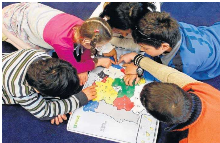
Alumnos con discapacidad visual trabajan con un mapa adaptado a sus necesidades.