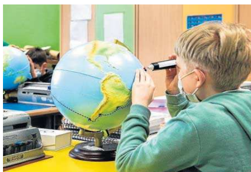
Instrumental usado en el aula para este tipo de alumnos.

La accesibilidad es un aspecto fundamental para lograr esa inclusión. Por ello, desde los diferentes grupos Acceso (Accesibilidad a Contenidos Educativos Digitales de la ONCE) se está en co-