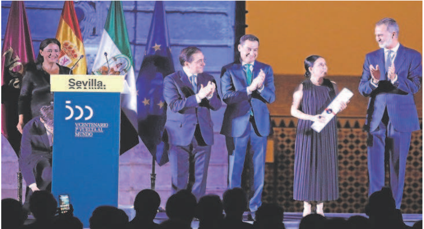
Felipe VI hizo entrega del galardón a Eva Yerbabuena en el Real Alcázar, en la imagen junto al resto de autoridades