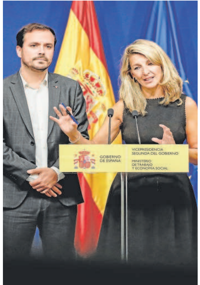
Alberto Garzón y Yolanda Díaz

Dicen que los sacrificios en los márgenes que piden Díaz y Garzón ya los hacen las empresas desde hace meses. Fuentes del sector ponen como ejemplo la leche, uno de los productos que los ministros de Unidas Po-