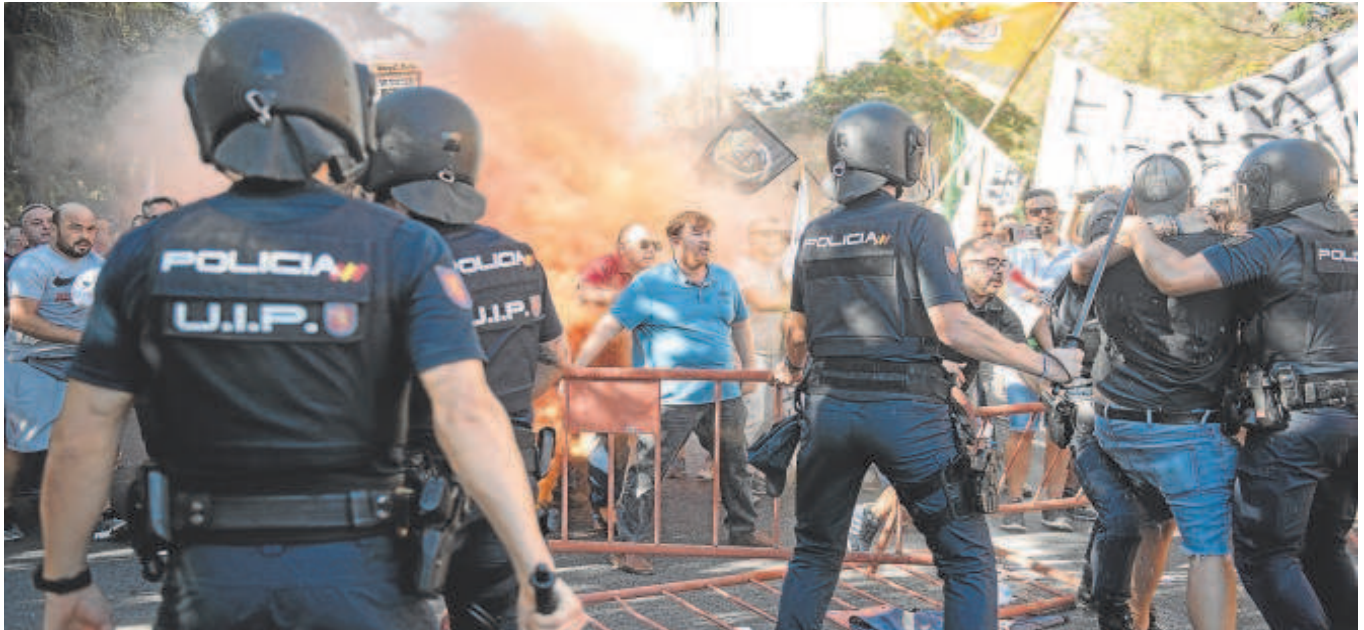
La protesta de los taxistas en Sevilla derivó en altercados con la Policía en el entorno del Parlamento andaluz