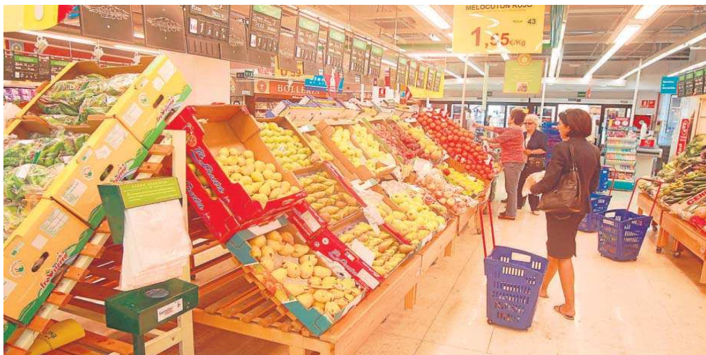
Sección de frutas de un supermercado.

países de nuestro entorno, el 52%. En el hipotético caso de que hubiera un acuerdo entre las grandes para limitar precios, ¿qué pasaría con los operadores locales o las tiendas de barrio? La ministra defiende la viabilidad de la medida y se escuda en que ya se aplicó en Francia en 2011. Es la llamada cesta imprescindible , que es algo parecido a lo que ha anunciado Carrefour. La cadena creará, hasta el 8 de enero, una cesta básica con 30 productos a precios reducidos. Hace 11 años, bajo el mandato de Nicolas Sarkozy, nueve cadenas hicieron algo parecido bajo el impulso del propio Gobierno francés. La medida duró unos pocos meses y fue criticada por algunas asociaciones de consumidores por su escaso alcance.