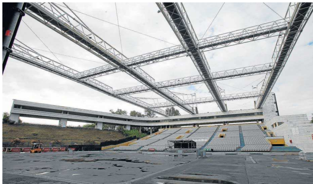
Imagen de archivo que muestra el estado del interior del Auditorio Rocio Jurado tras la celebración de un evento.