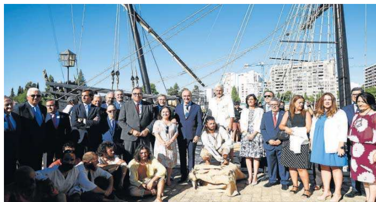
Inauguración del Festival Marítimo V Centenario de la Primera Vuelta a la Mundo con las autoridades.

Cuaderno de Bitácora del V Centenario. Asimismo, tuvo lugar en Sevilla una reunión entre los ministros de Asuntos Exteriores de España y Portugal.