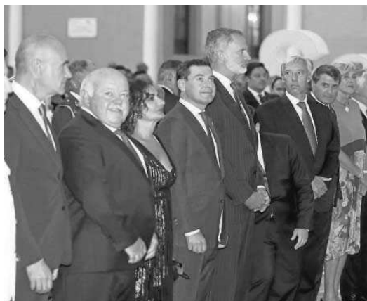
El Rey, entre las autoridades invitadas al acto de ayer.