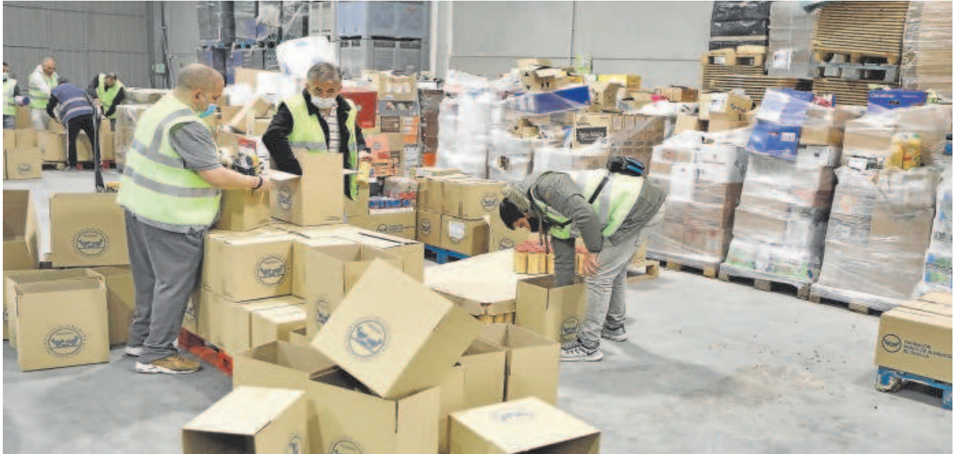
Voluntarios en la sede del Banco de Alimentos de Sevilla