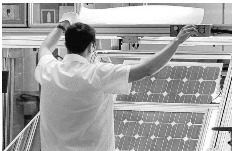
Un empleado de la empresa malagueña Isofotón.

Varias defensas comenzaron a plantear en septiembre de 2020 una línea de actuación que puede dar al traste con la macrocausa relacionada con Isofotón, que recibió más de 80 millones de fondos públicos en ayudas, avales y préstamos. Las defensas consideraban que este caso, en el que hay imputadas 38 personas —entre ellas, 12 ex altos cargos socialistas de la Junta de Andalucía—, se han vulnerado los plazos procesales de la instrucción, además de estimar que se ha actuado durante cinco años "a espaldas de los investigados", generando su indefensión.