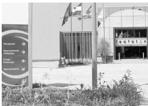
La sede de la empresa malagueña Isofotón.