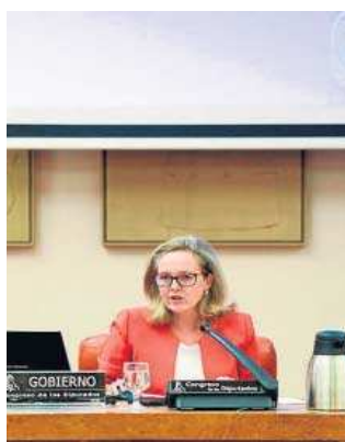
Nadia Calviño en su comparecencia.

Por ello, a finales de julio la vicepresidenta primera y ministra de Asuntos Económicos y Transformación Digital, Nadia Calviño, envió sendas cartas a los presidentes de los gobiernos de las comunidades y ciudades autónomas con el fin de fomentar su participación en la elaboración de esta adenda.