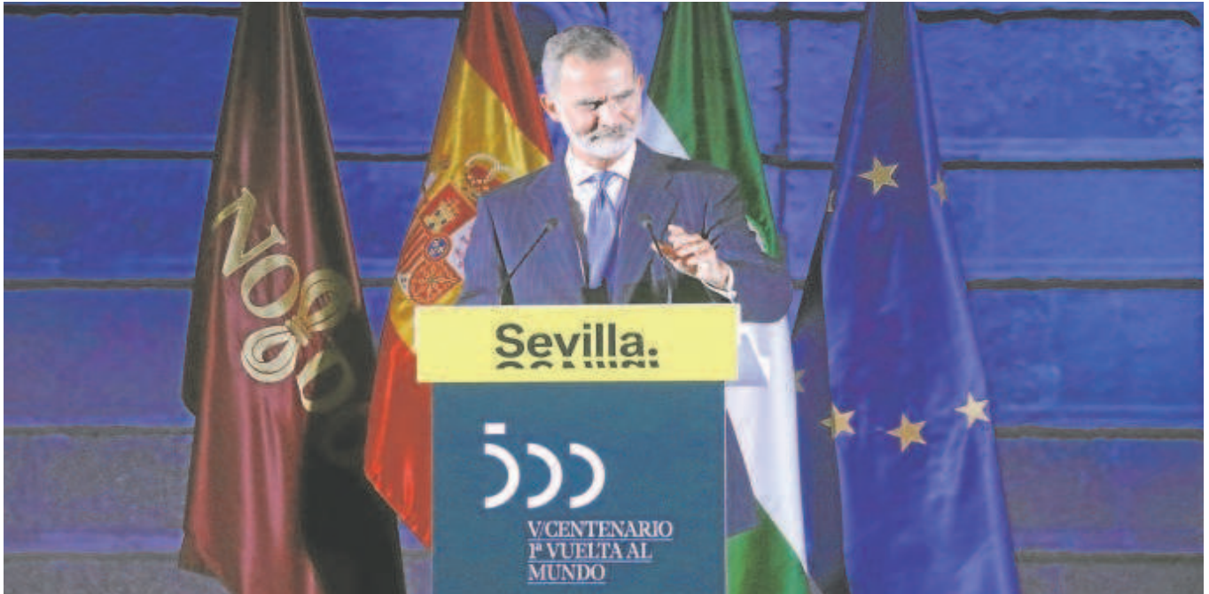
Don Felipe durante su intervención ayer en el Real Alcázar