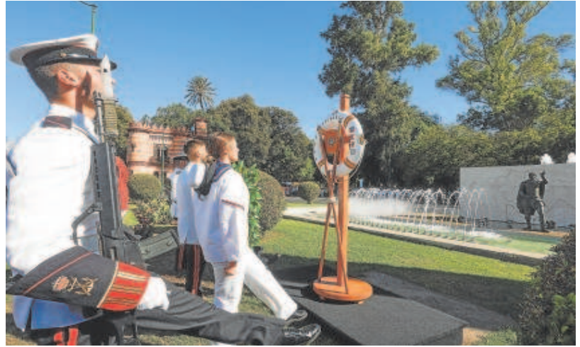
A la izquierda, la nao Victoria en el muelle. Arriba, ofrenda floral a Juan Sebastián Elcano. A la derecha, ceremonia en la que se arrió la bandera del quinto centenario del viaje de Magallanes.