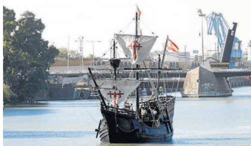
La nao 'Victoria' podrá visitarse hasta el 11 de septiembre.

Ayer, a las 20:00, organizado por el Ayuntamiento de Sevilla, la Fundación Nao Victoria y con la colaboración de la Armada, se realizó una recreación por parte de un grupo de actores del Tercio Duque de Olivares