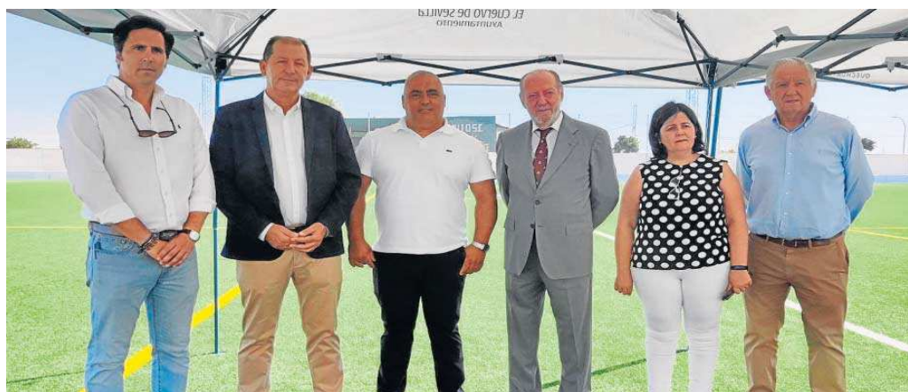
El presidente Rodríguez Villalobos durante su visita a El Cuervo, en el campo municipal de fútbol, junto al alcalde y otros consejeros del municipio.

Se trata de fondos que según el alcalde "llegan para invertir en El Cuervo y conseguir mejoras para toda la ciudadanía", como las acometidas en el campo de fútbol municipal Andrés Villaceros que han permitido la renovación del césped artificial y el graderío de