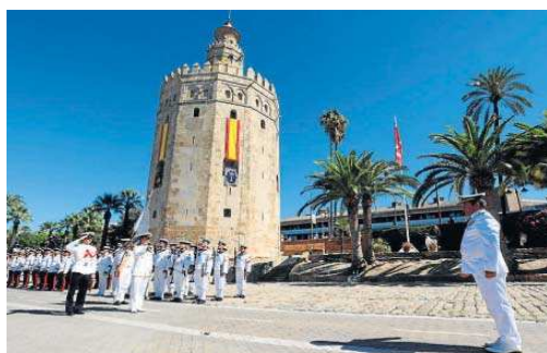
Arriada de la bandera del V Centenario de la Primera Vuelta al Mundo.

También en este emblemático monumento, presidido por el rector de la Universidad CEU San Pablo, se presentó el tercer