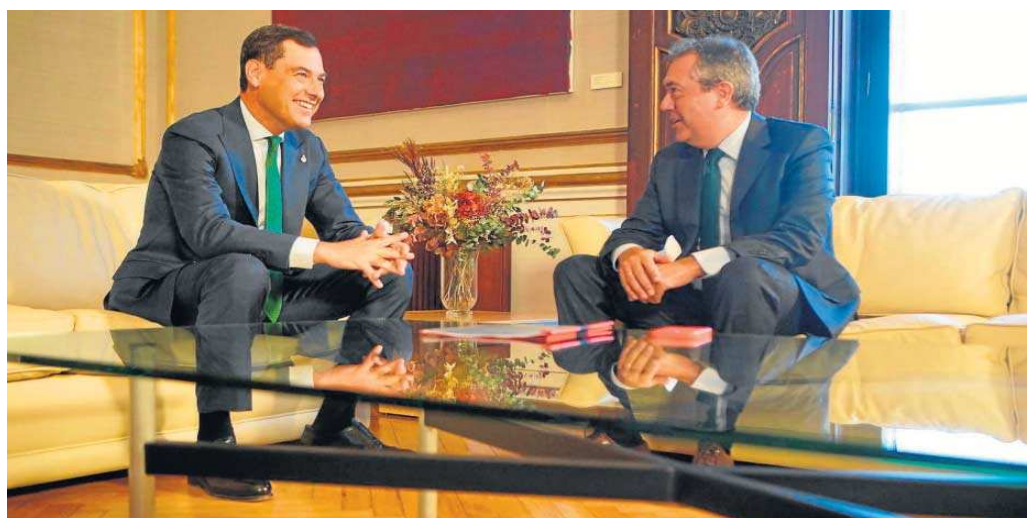
Reunión de Juanma Moreno con Juan Espadas.

Los socialistas llevaron a San Telmo su plan de acción ante los efectos del fuerte aumento de la inflación y la grave situación de sequía, un adelanto de las ideas que defenderán la próxima semana en el Pleno del Parlamento. Un plan financiable, destacó el portavoz del PSOE, Juan Es-