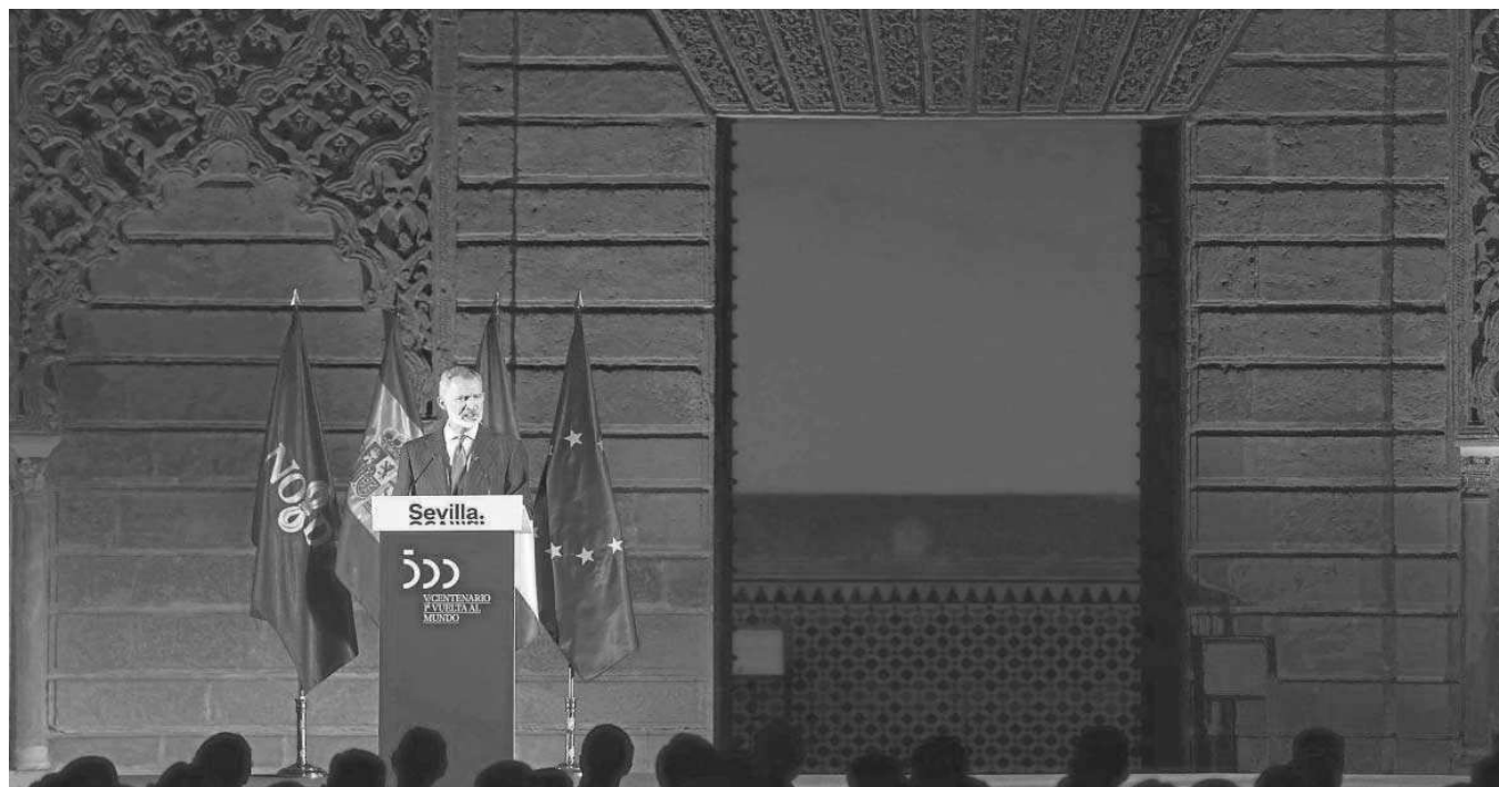
Felipe VI pronuncia su discurso de clausura del V Centenario de la Primera Vuelta al Mundo en el Patio de la Montería del Alcázar.