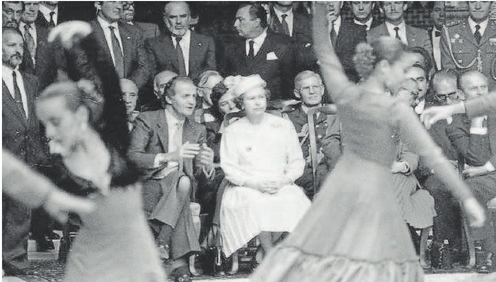
El Rey Don Juan Carlos le explica a la Reina Isabel los pasos del baile flamenco durante un espectáculo celebrado en el Alcázar de Sevilla