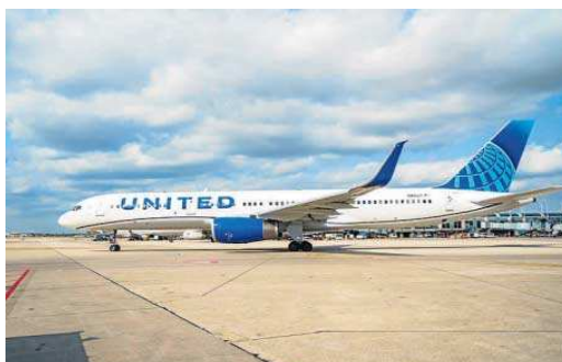
Avión de United Airlines, compañía que operará en vuelo con Málaga.