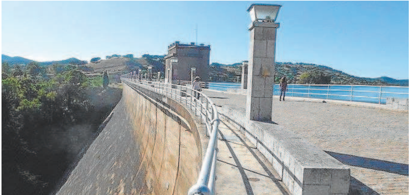
Imagen de la presa del pantano de El Pintado, cuya cola alcanza los términos municipales de Cazalla, El Real de la Jara y Guadalcanal