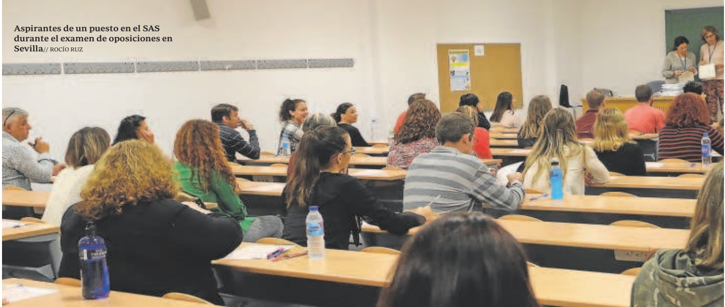
Aspirantes de un puesto en el SAS durante el examen de oposiciones en Sevilla