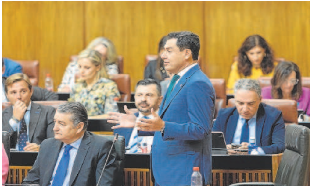
El presidente de la Junta, Juanma Moreno, en la sesión de control al Gobierno

La Cámara andaluza inició ayer la tramitación de dos leyes de distinto calado. La de Atención Temprana que pretende garantizar la atención a los menores entre cero y seis años que presenten alguna necesidad especial y que genera mucha polémica entre los grupos parlamentarios que ahora tendrán que afinar el proyecto del Gobierno andaluz en comisión. La otra norma, la Ley de Emergencias, busca solucionar la carrera profesional de los bomberos forestales.