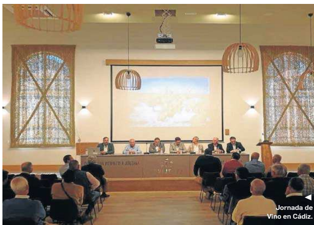
Jornada de Vino en Cádiz.

La Reforma Laboral, por su impacto directo en la contratación de las cooperativas, ha sido otro de los grandes temas expuestos en estos encuentros. Asimismo,