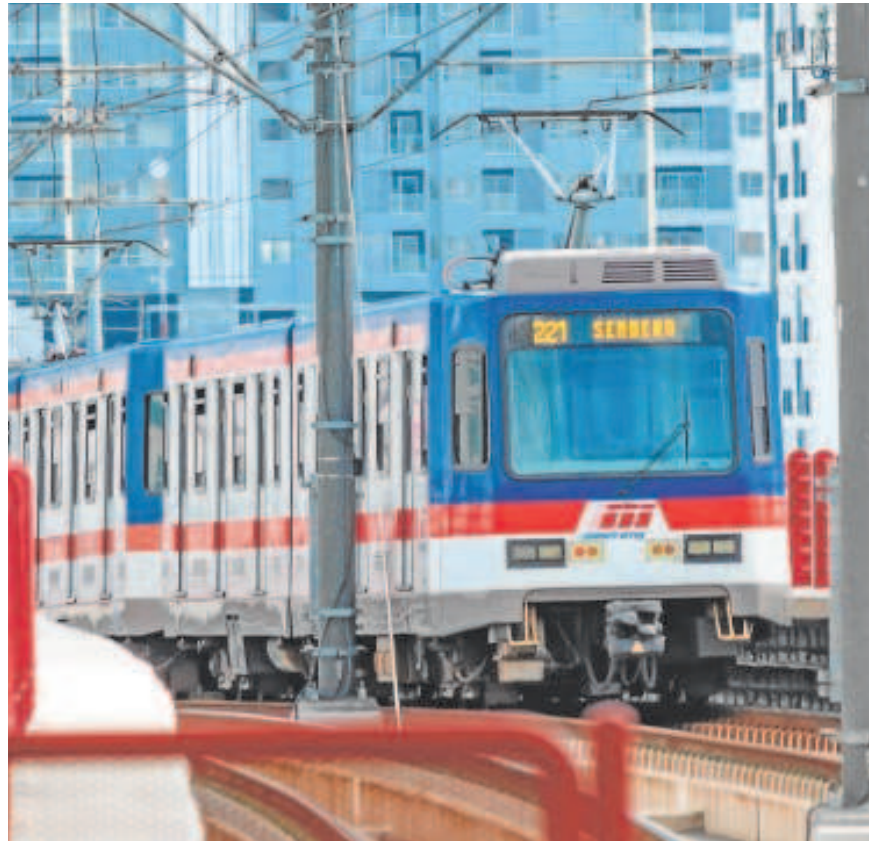
Un tren del metro de Monterrey

Ayesa es una de las mayores ingenierías del mundo y la tercera de Latinoamérica, donde lleva implantada desde hace 20 años. Concretamente, en México ha participado en los mayores proyectos de infraestructuras del país, como la planta depura-