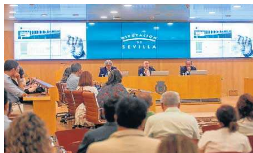
Instante de la presentación del nuevo BOP.

De esa forma, en el nuevo Boletín Oficial de la Provincia de Sevilla se podrán encontrar a partir de ahora nuevas interacciones