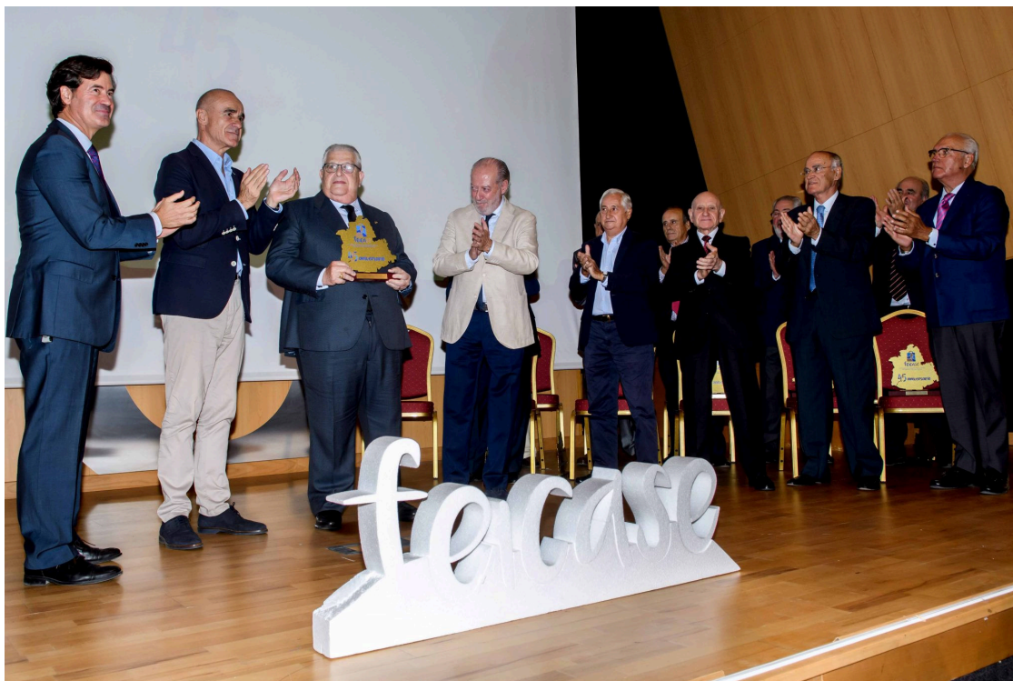
45ANI RECONOCIMIENTO BAREA

El jueves 6 de octubre de 2022, numerosas representaciones del ámbito institucional y corporativo-empresarial se dieron cita en el Edificio CREA (Sevilla) junto a un gran número de empresarios y empresarias, así como de otros invitados para la ocasión, para conmemorar el 45 Aniversario de FEICASE.