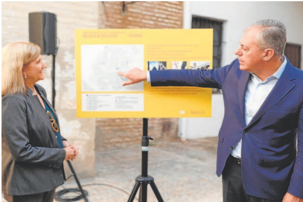
El candidato del PP a la alcaldía de Sevilla, José Luis Sanz

Distribuido para CONFEDERACIÓN N DE EMPRESARIOS DE SEVILLA * Este artículo no puede distribuirse sin el consentimiento expreso del dueño de los derechos de autor.