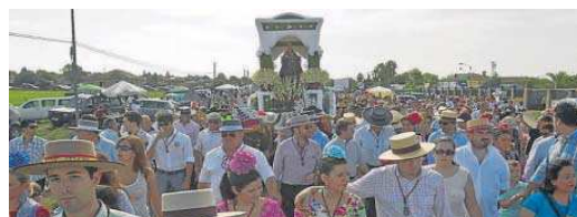
Peregrinos acompañando a la Virgen de Valme en su romería.

más numerosa de cuantas se celebran en la provincia de Sevilla. La Junta la acaba de declarar Bien de Interés Cultural.