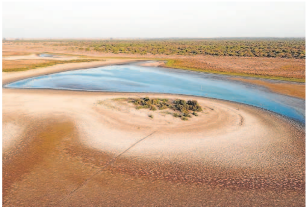
Una de las lagunas de agua dulce de Doñana seca. // EFE

Por otro lado, se contempla un informe de viabilidad económica, técnica, social y ambiental de la alternativa seleccionada, así como la redacción del documento ambiental de la alternativa seleccionada y la edición y presentación final de los trabajos. Una vez realizado el estudio de alternativas se procederá a licitar las primeras obras para las que el Plan Hidrológico del Guadalquivir destina en su programa de medidas, en principio, 15 millones de euros.