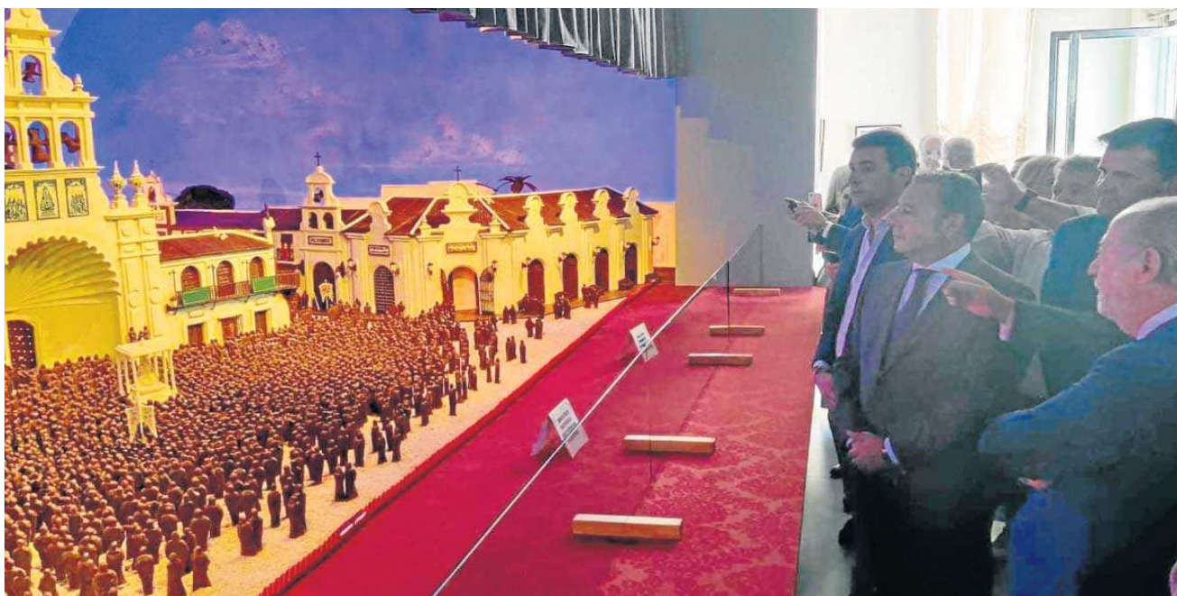
El presidente de la Diputación durante su visita a la empresa La Estepeña, acompañado por el alcalde de la localidad y miembros de la Hermandad del Rocío de Almonte.

El presidente de la Diputación de Sevilla, Fernando Rodríguez Villalobos, ha asistido este jueves a la inauguración de la recreación que la empresa La Estepeña ha hecho de la aldea del Rocío en la sede de su museo La Ciudad de Chocolate, localidad elegida este año para su reproducción en chocolate como en años anteriores lo fueron París, Venecia o Madrid.