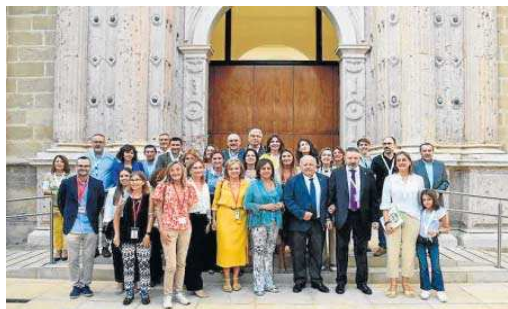
La consejera y familias afectadas tras la sesión del Parlamento andaluz. M. G.

A partir de esta población diaria, la nueva ley estima que, con ocho sesiones al mes por menor, en Andalucía se alcanzarían al año casi 1,9 millones de sesiones