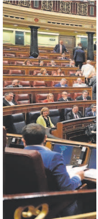
Entrada de los diputados de Vox ayer al pleno, con Sánchez en la tribuna