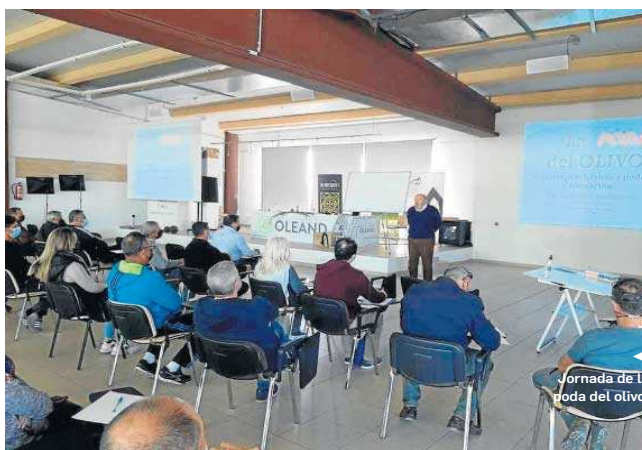
Jornada de Poda del Olivo.

en provincias como Almería, se ha analizado el convenio colectivo del manipulado y envasado de frutas y hortalizas.