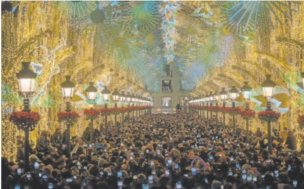
Imagen de la calle Larios correspondiente a la Navidad del año pasado