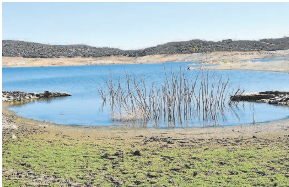
Imagen actual del pantano de Aracena, uno de los seis que abastecen a Sevilla capital y su área metropolitana

Lo más destacado estos días es el aumento de las temperaturas, nada habituales en esta época del año en Sevilla, con máximas que se situarán en los 30 grados en los próximos días y en torno a los 25 grados a partir del domingo. Para hoy incluso se espera aumentar un par de grados las máximas en Sevilla y para los dos siguientes días, viernes y sábado. A partir del domingo, según las previsiones de Aemet, se espera una bajada de las temperaturas, que quedarán sobre los 25 grados hasta el martes, destacando la nubosidad de estos días, si bien no traerán lluvia a la provincia sevillana.