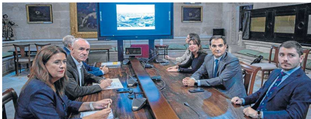
El alcalde de Sevilla se comprometió ayer a "implementar las líneas de transporte público necesarias".