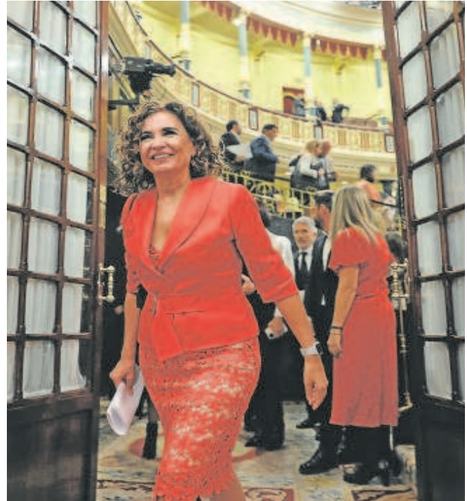
La ministra Montero, ayer, tras su defensa de las cuentas para 2023

PP, Vox y Ciudadanos denuncian la vocación electoralista de las cuentas del presidente Sánchez: «Es 'pedrocentrista'»