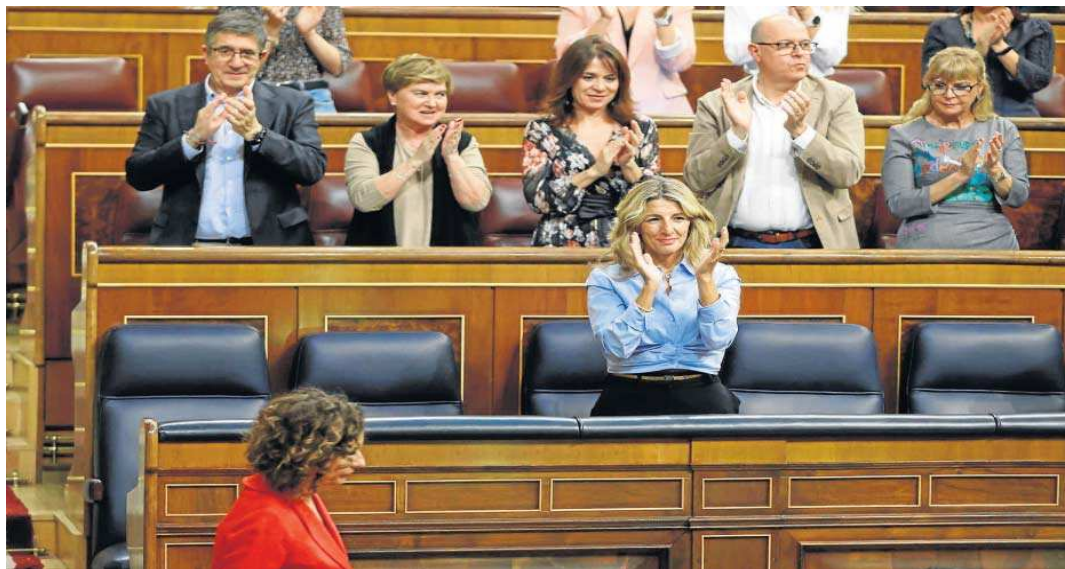
María Jesús Montero es aplaudida por Yolanda Díaz y varios diputados socialistas.