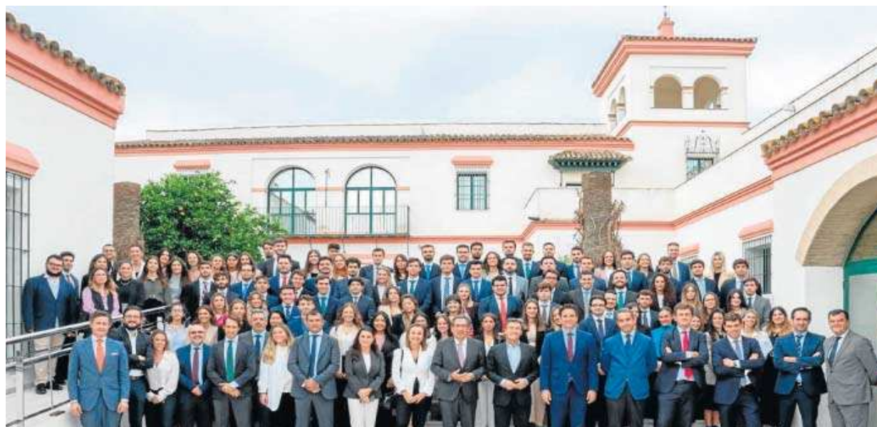
Foto de familia del acto de inauguración del curso en el Instituto de Estudios Cajasol.