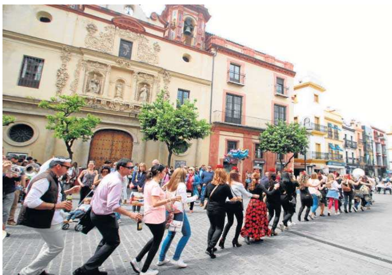
Foto de archivo de una despedida de soltera en la Plaza del Salvador.