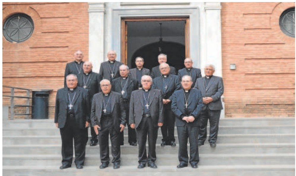
Imagen de los Obispos del Sur de España en su asamblea, reunida ayer en Granada