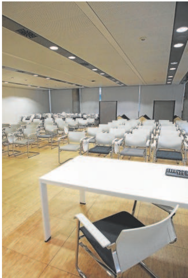
El consejero anunció que la primera mudanza a las instalaciones de Palmas Altas, en la imagen, será antes de verano

El Gobierno municipal se molestó por el encuentro anunciado un día antes entre el consejero y el candidato del PP