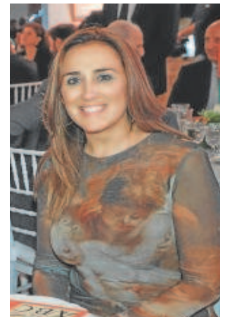
Verónica Martos, diputada del PP en el Parlamento de Andalucía