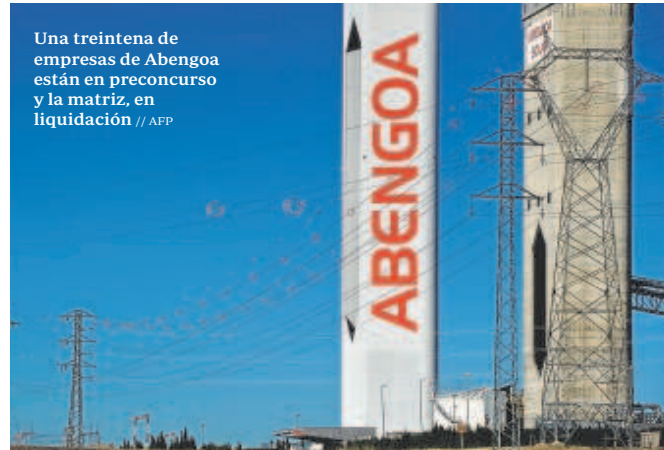
Una treintena de empresas de Abengoa están en precurso y la matriz, en liquidación