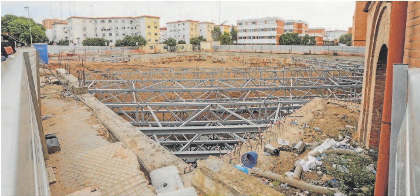
Estado del solar donde se encuentra el centro deportivo Virgen de los Reyes