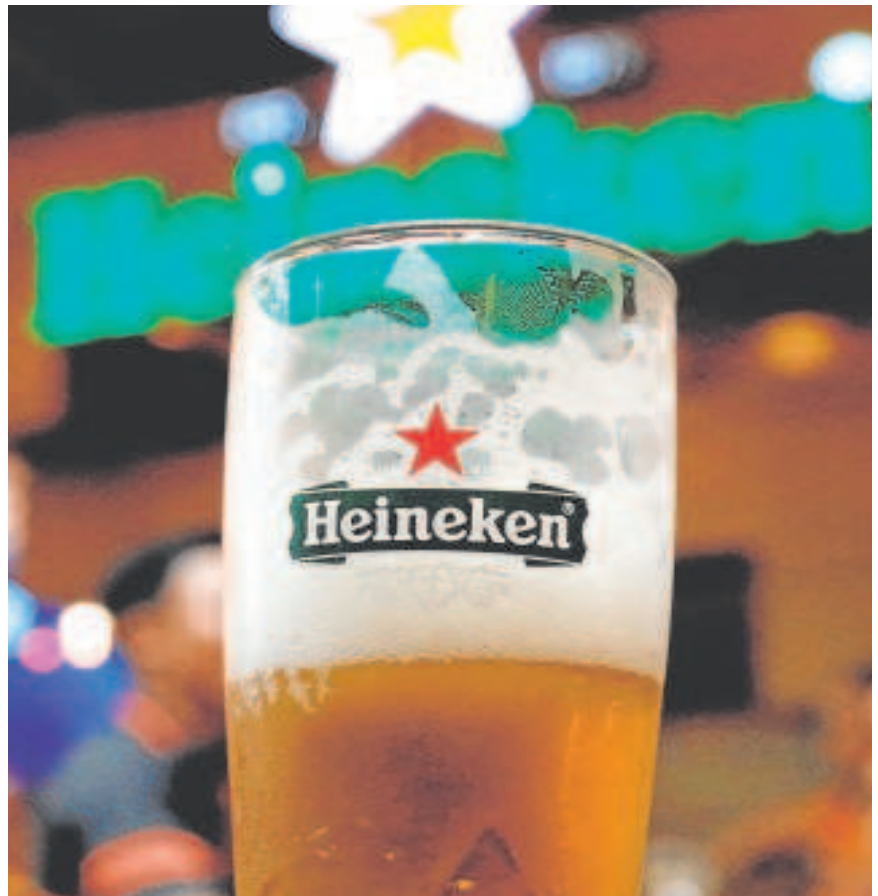
La cervecera Heineken tiene su sede española en Sevilla

27,5% de su facturación global en el tercer trimestre, impulsada especialmente por el repunte de ventas en Asia, que compensó la caída de la demanda en el resto del mundo, según el comunicado difundido ayer.