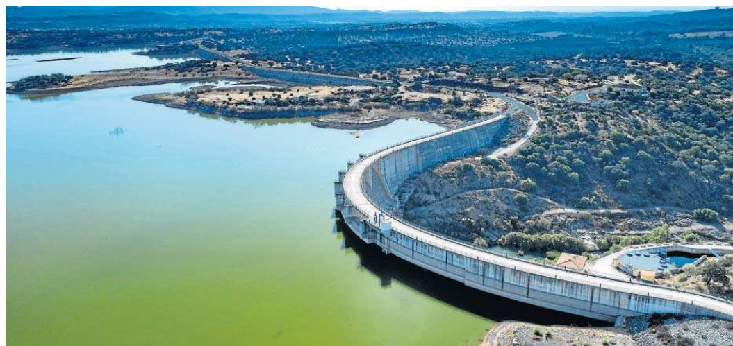
El pantano de Melonares a finales del pasado septiembre.