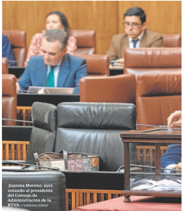
Juanma Moreno, ayer, votando al presidente del Consejo de Administración de la RTVA