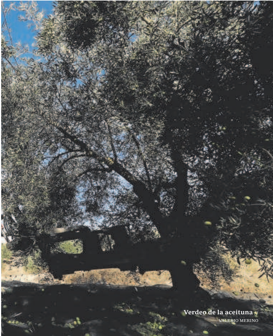
Verdeado de la aceituna