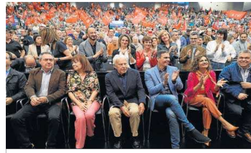
La primera fila del patio de butacas estuvo plagada de líderes socialistas.

● El ex presidente del Gobierno recuerda que su prioridad de 1982 era la misma que ahora: una convivencia en paz