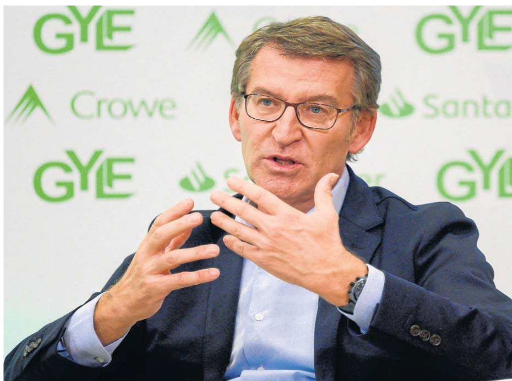
El presidente del PP, Alberto Núñez Feijóo.

Y la coyuntura les ha traído un problema añadido: tanto se les ha pasado el arroz que las negociaciones para renovar el CGPJ coinciden con las presiones de ERC para que el Ejecutivo reforme el Código Penal para rebajar las penas a la mitad y la voluntad de Pedro Sánchez de hacerlo. El trágala reformista, pese a la veracidad de parte de los argumentos respecto al tratamiento diferenciado del delito en otros países europeos, favorecería en muchos sentidos –incluido el retorno a España y su concurso futuro en política– a gente como Puigdemont. Para Sánchez, modificar el Código Penal para seguir contando con el apoyo de ERC –básicamente, aunque los argumentos europeos avalen técnicamente la reforma– no le saldrá gratis. Por