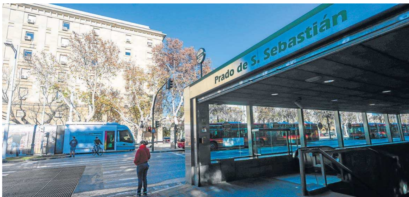
La estación del Prado es la última del tramo Norte y enlaza con la línea 1.

● Esta aportación se suma a los 21 millones del Gobierno central ● Las cuentas andaluzas incluyen 81,7 millones para el tranvía de Alcalá y partidas para actualizar la línea 2 del Metro