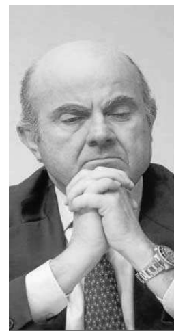
Luis de Guindos.

Aquella operación formaba parte del rescate a la banca. Eran los días en los que se hablaba del riesgo sistémico, del rescate y los hombres de negro. De