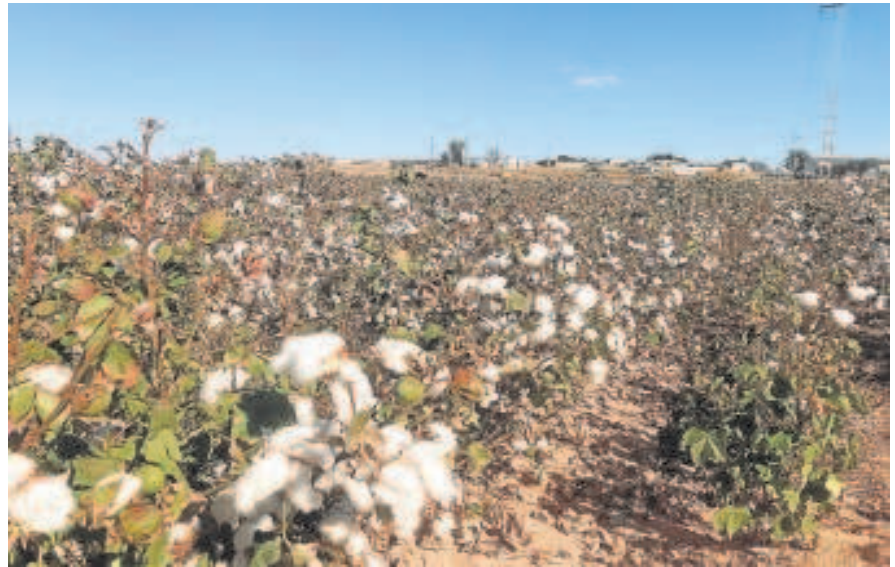
Cultivo de algodón en Andalucía

Y es que los estudios ponen de manifiesto, entre otras cuestiones, que la sequía ha provocado una importante reducción de las dotaciones de riego disponibles para el cultivo de algodón en Andalucía. Esta circunstancia es el elemento principal en que se basa la disminución del rendimiento mínimo exigible para acceder a las ayudas, pero no es el único argumen-