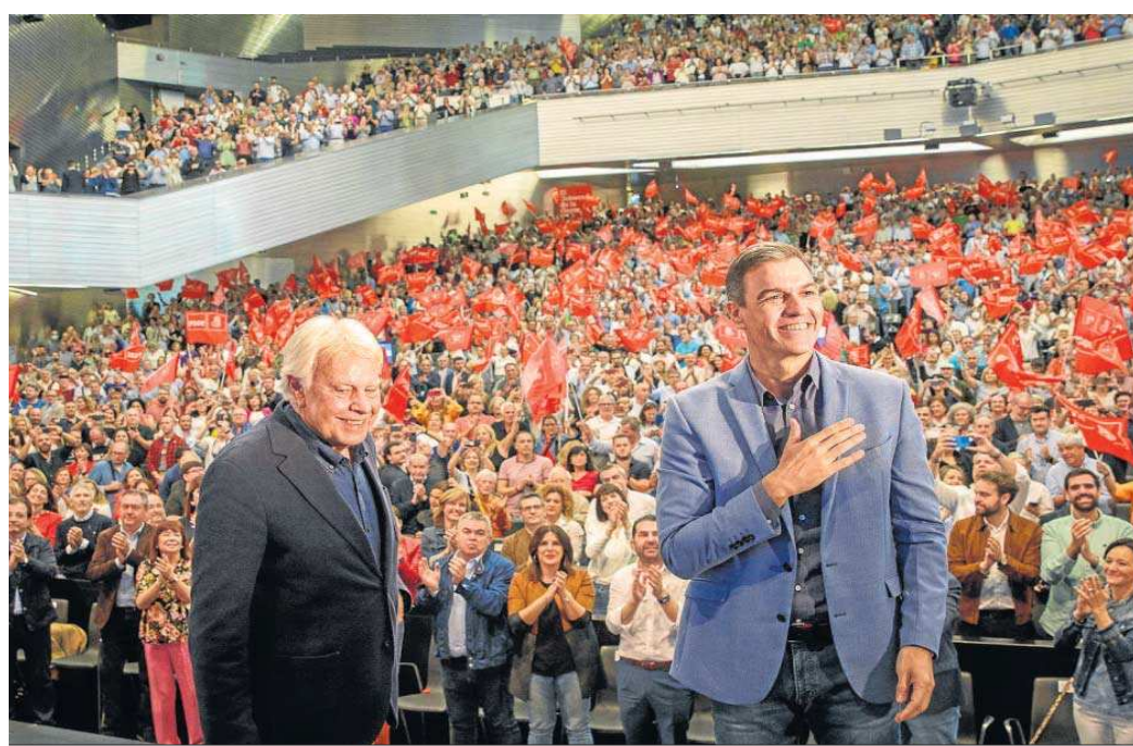
Felipe González y Pedro Sánchez, ayer ante el auditorio de Fibes, en Sevilla.

Distribuido para CONFEDERACIÓN DE EMPRESARIOS DE SEVILLA * Este artículo no puede distribuirse sin el consentimiento expreso del dueño de los derechos de autor.