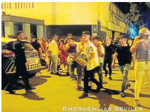
Jóvenes sacando en volandas a un adolescente.

Ante esta situación, los agentes retiraron las vallas y liberaron las salidas de emergencias, permitiendo la salida de los asistentes al exterior. Tras esto, accedieron al interior y encontraron completamente saturadas las diferentes estancias. Encon-