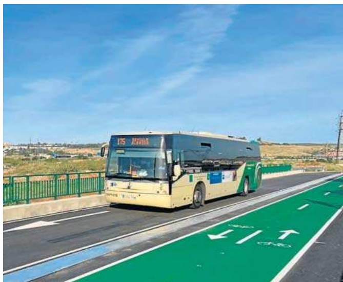
El carril reservado del puente de la Señorita se prolongará a Salteras.

El carril Bus-VAO, que ha sido licitado por la Junta, es un carril exclusivo para autobuses y vehículos de alta ocu-