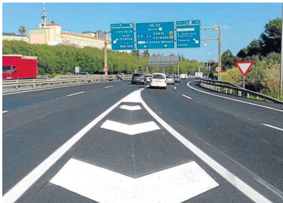
Carretera que une el Polígono PISA con la SE-30.