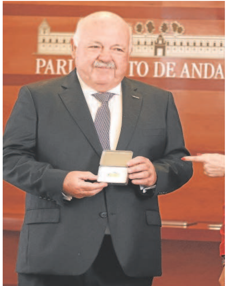
La consejera de Economía, Carolina España, entrega las cuentas a Jesús Aguirre // MANUEL

autonómica en un 4,3% - medida copiada por comunidades autónomas incluso del PSOE- y suspendido el canon del agua, a lo que se suma una rebaja del Impuesto de Transmisiones Patrimoniales hasta el 7% desde abril