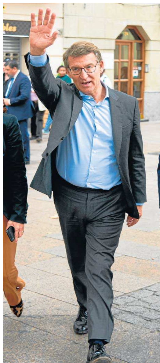
El presidente del PP, Alberto Núñez Feijóo, pase ayer por Vitoria.

Y respecto al principal motivo aducido por el PP para suspender las conversaciones, es decir, la reforma del delito de sedición, aseveró que el Ejecutivo ha dicho lo mismo “en público que en privado” sin que haya habido novedades al respecto.