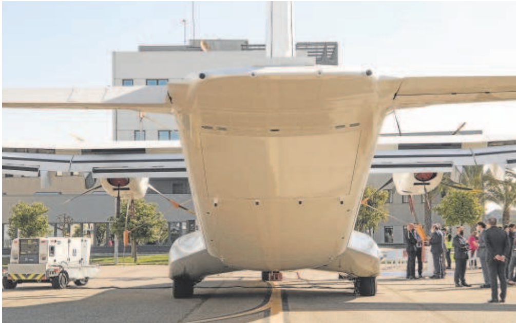
La industria aeroespacial tiene un gran peso en Sevilla