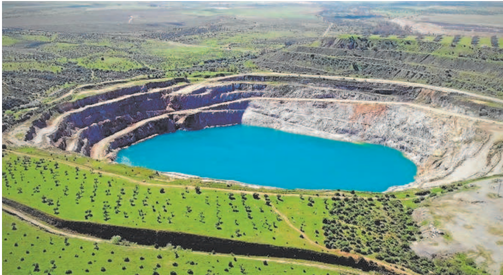
Corta minera de Aznalcóllar con las aguas superficiales

Grupo México prevé obtener la autorización ambiental en 2023, seis años después de iniciar los trámites