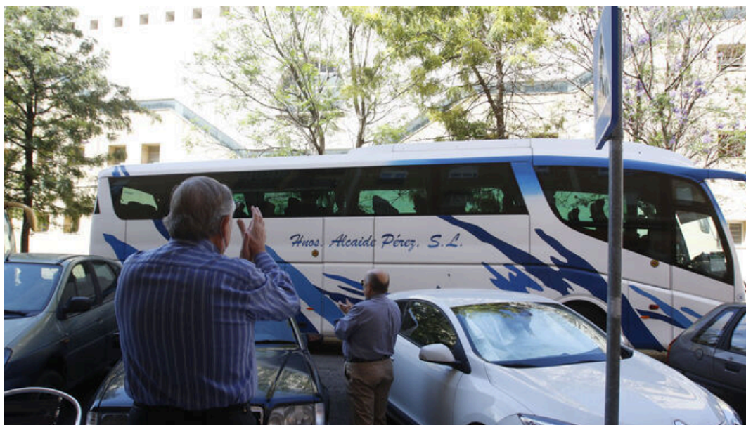
Un autobús de transporte de viajeros.

La Asociación Provincial de Empresarios del Transporte de Viajeros de la provincia de Sevilla (Atedibus) ha advertido que "la falta de profesionales" para cubrir todas las necesidades de este colectivo "agrava la situación del sector.