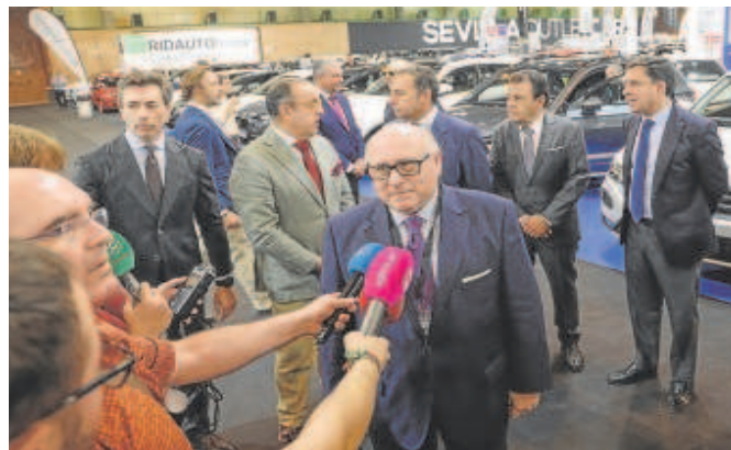
El presidente de Fedeme, Francisco Javier Moreno

Durante cinco días, Fibes se convertirá en un gran hipermercado automovilístico para ofrecer a los visitantes la posibilidad de disfrutar de la más amplia variedad de vehículos, de las principales marcas y modelos dis-