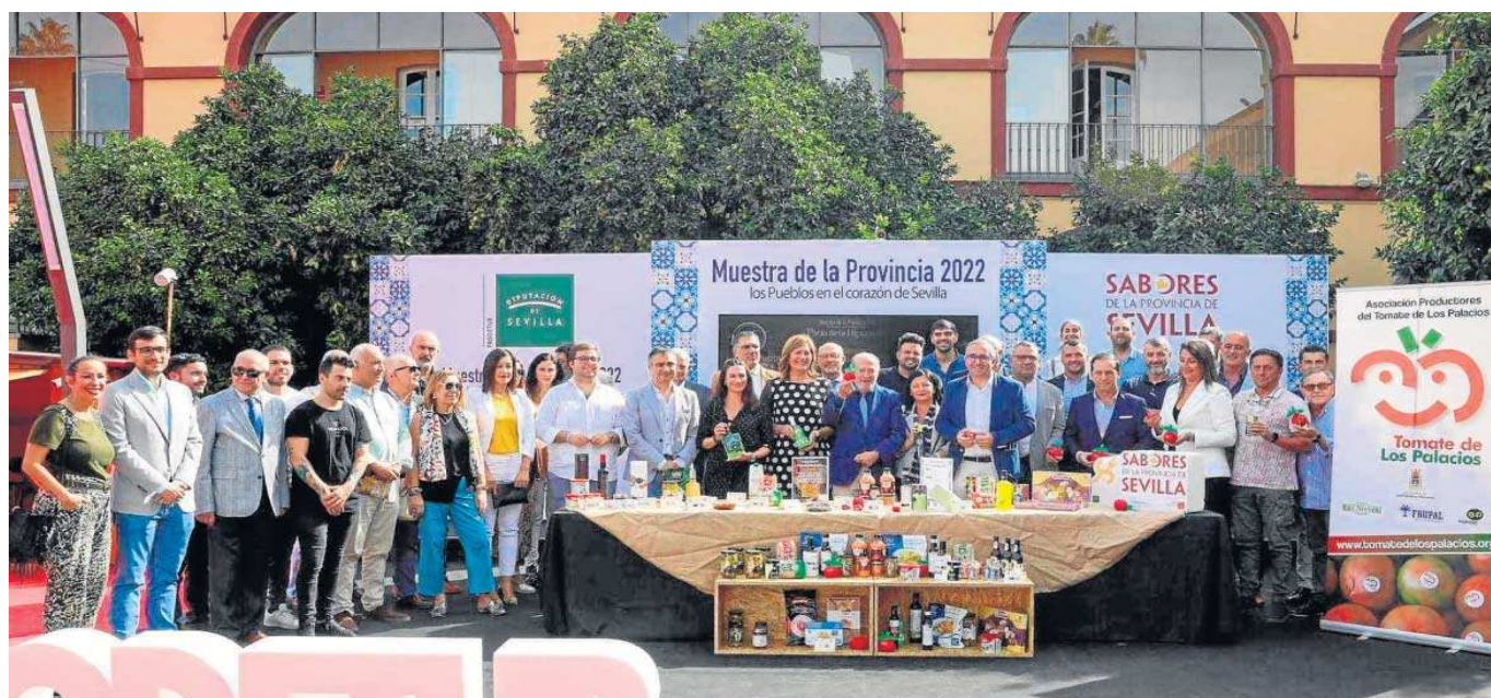
El presidente Rodríguez Villalobos durante la inauguración, ayer, de la primera de estas ferias que reunirán en el Patio de la Diputación los mejores productos locales de la provincia.

Muestra. Participan 37 casetas de productos 'Sabores de la Provincia', de empresas de una treintena de municipios sevillanos. Mañana, degustación de platos con tomates de Los Palacios