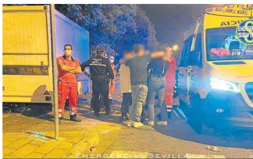
El 061 atiende a varias personas.

traron a jóvenes caídos en el suelo que estaban siendo atendidos por otros menores. Todos presentaban la piel enrojecida, estaban fatigados, tenían un exceso de sudoración y mareos, y se quejaban a los agentes de la falta de agua para su hidratación.