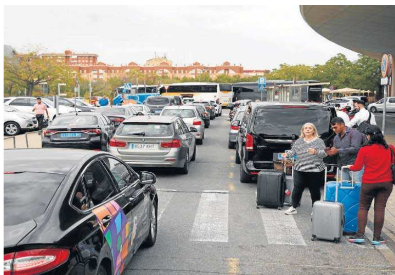
Cola de vehículos para entrar al único carril de carga y descarga de viajeros de Santa Justa.