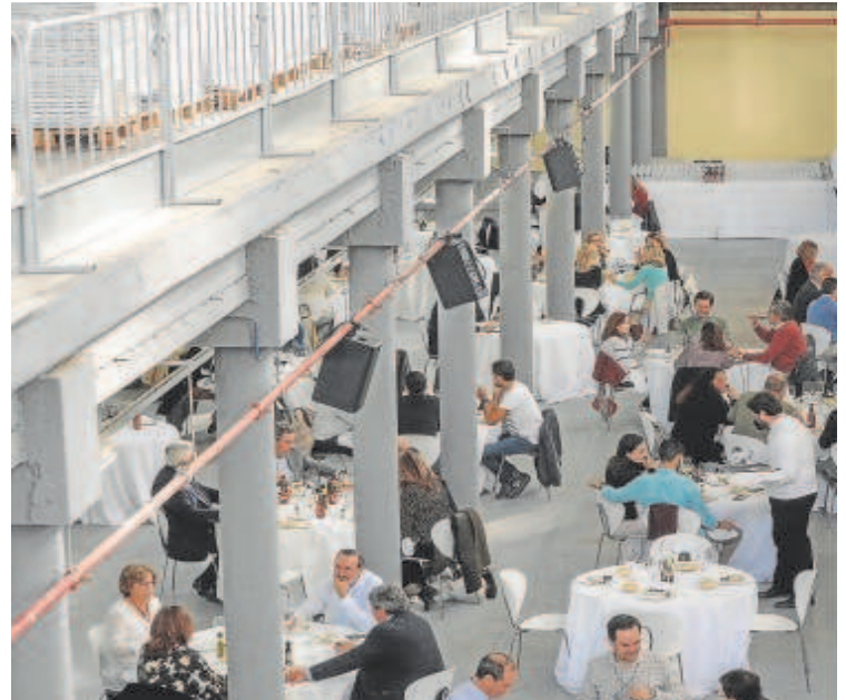
Las jornadas se celebran en la antigua rotativa de ABC de Sevilla. En la imagen, un

medio día y otro por la noche, cada uno de ellos con capacidad para 150 comensales.