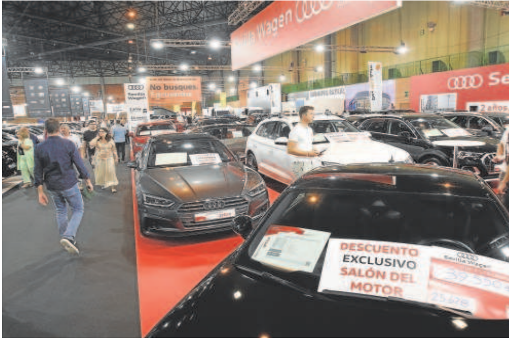
Uno de los pabellones del Salón del Motor en el Palacio de Exposiciones y Congresos

Distribuido para CONFEDERACIÓN DE EMPRESARIOS DE SEVILLA * Este artículo no puede distribuirse sin el consentimiento expreso del dueño de los derechos de autor.