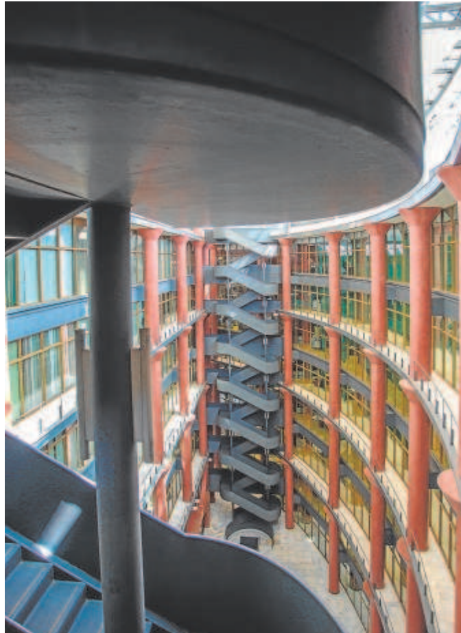
El edificio de Torre Triana acoge varias consejerías de la Junta // VANESSA GÓMEZ

En la comparativa entre 2023 y 2021 se constata que hay más personal sanitario y menos docente. Los sanitarios aumentan en 1.422 empleados, una subida de un 1,49%, mientras que los docentes retroceden en 932, un 0,85 menos. La Junta aumenta sus efectivos en Administración General y en