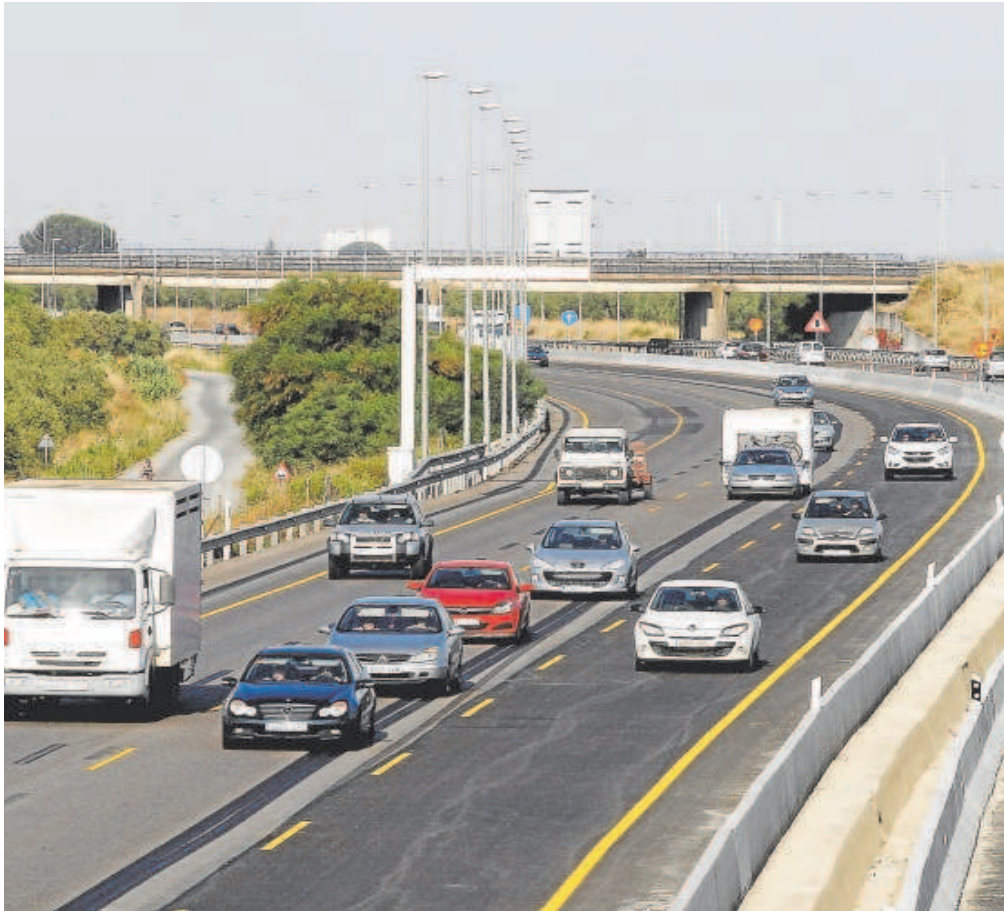
El tercer carril de la A-49 es una obra inconclusa desde hace 20 años

Distribuido para CONFEDERACIÓN DE EMPRESARIOS DE SEVILLA * Este artículo no puede distribuirse sin el consentimiento expreso del dueño de los derechos de autor.