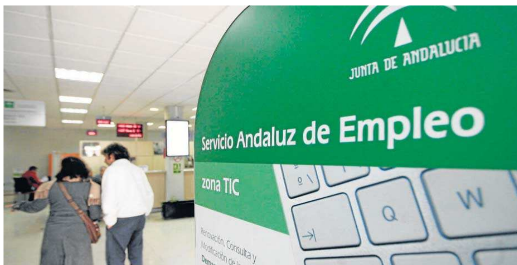
Los altos cargos también tendrán un aumento retributivo para 2023.

En total, el gasto de personal supone uno de cada tres euros de los presupuestos: ascenderá a 14,7 millones de euros, un 5,6% más que en el Presupuesto de 2021, el último aprobado (en 2022 fue prorrogado tras rechazarse el proyecto en el Parlamento). Ahí se incluye el aumento retributivo que tendrán los empleados públicos andaluces, en consonancia con lo acordado en la Mesa General de Negociación de la