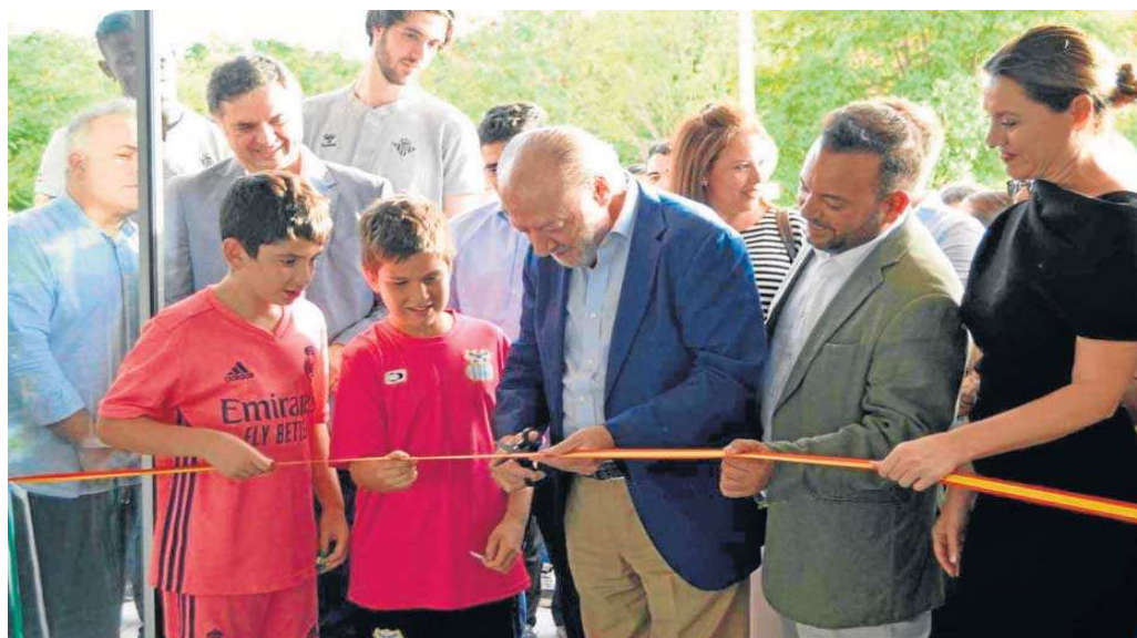
El presidente de la Diputación en el acto de inauguración del nuevo pabellón junto al alcalde de La Algaba. Abajo, una imagen general de las pistas interiores.

El presidente de la Diputación de Sevilla, Fernando Rodríguez Villalobos, se ha reunido esta semana con el alcalde Diego Manuel Agüera en La Algaba, para inaugurar las instalaciones del nuevo Pabellón Deportivo de la localidad, junto a la delegada provincial de Turismo, Cultura y Deporte de la Junta de Andalucía, Minerva Salas.