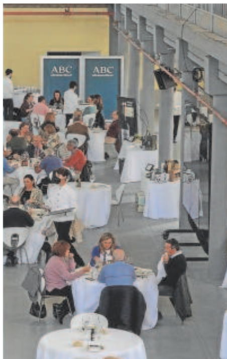
momento de la pasada edición

encurtidos. Lolita Fusión (Ronda Norte, 48. Carmona) participa en las jornadas con huevos de codorniz y bechamel de whisky con taquitos de jamón, mientras que Abacería La Familia (avda. de Sevilla, 1. Castilleja de la Cuesta) lo hace con una crema de jamón de Lazo con alcachofas confitadas en aceite de oliva y langostinos.