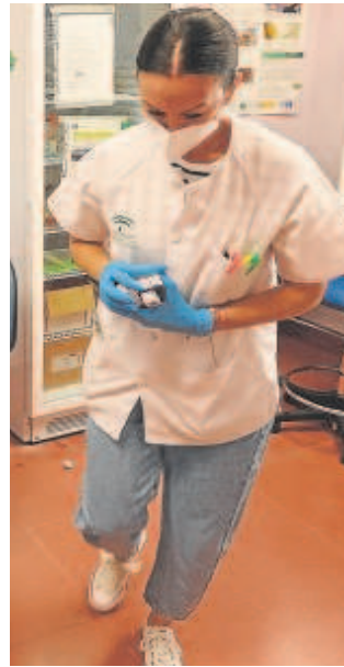
Una sanitaria en Córdoba

Sanidad gasta más del 40 por ciento de su presupuesto en pagar al personal, que ronda los 120.000 efectivos