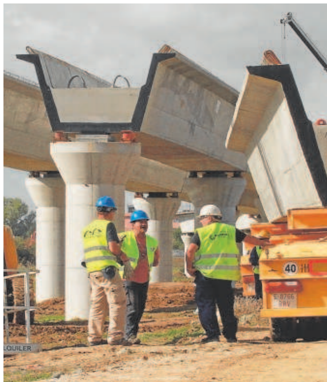
Obras del tranvía de Alcalá de Guadaíra en el año 2015

También destaca la partida de casi 4 millones de euros que se destinará a la restauración del pabellón del siglo XV de la Expo 92, como ampliación