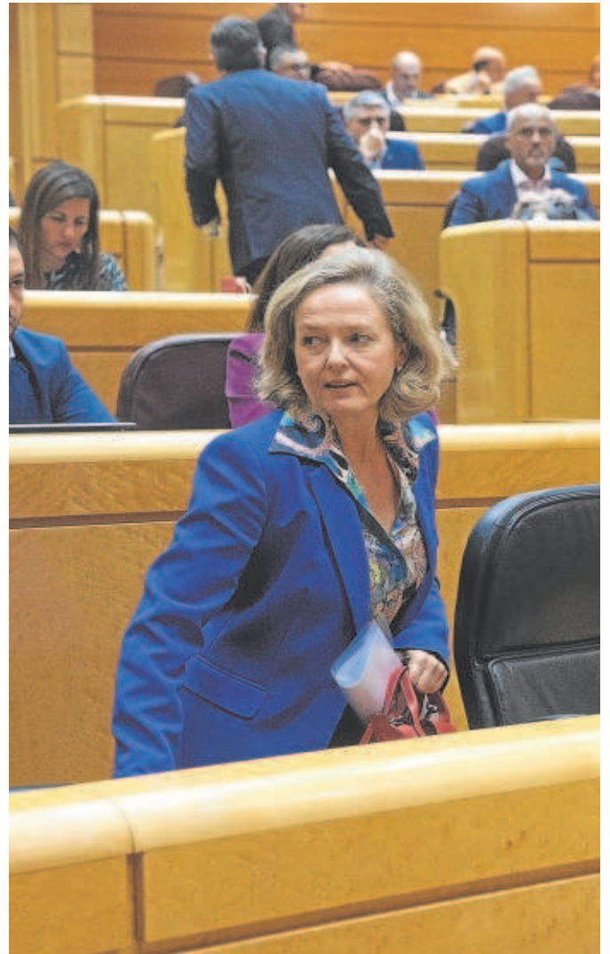
La vicepresidenta de Asuntos Económicos, Nadia Calviño

En realidad, lo que separa la previsión oficial del resto son dos cosas: la evolución de la inversión y el comportamiento del comercio exterior. Mientras el Ministerio de Asuntos Económicos trasladó al cuadro macro su certeza de que la inversión se sostendrá en 2023 gracias al impulso de los fondos europeos y crecerá por encima del 9%, y que las exportaciones y las im-