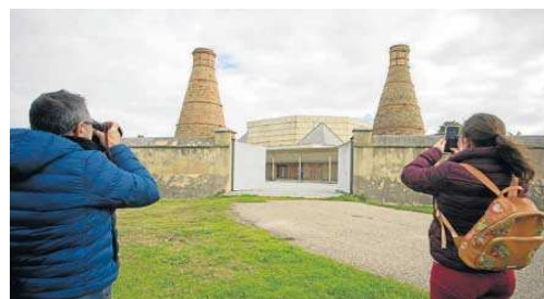
El pabellón del siglo XV ligado al CAAC.

antigua Urso romana. Los nuevos presupuestos incluyen 871.704 euros para el proyecto de reforma parcial de la Sala Santa Inés, enclavada en la céntrica calle Doña María Coronel, y la adecuación de sus espacios, para acoger una selección de piezas de la colección del Museo Arqueológico de Sevilla, actualmente cerrado en espera de su demandado proyecto de rehabilitación y renovación integral; después de que esta actuación fuese licitada la pasada primavera.