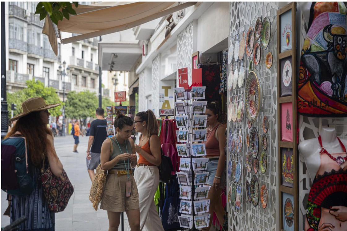
Turistas en tiendas de souvenirs. A 11 de agosto de 2022, en Sevilla (Andalucía, España).

La Junta de Gobierno del Ayuntamiento de Sevilla, por iniciativa de la Delegación de Economía, Comercio y Turismo, ha aprobado este viernes financiar con 320.000 euros proyectos que presenten las asociaciones, federaciones y confederaciones de comerciantes destinados a "mejorar la competitividad" del comercio minorista y a "paliar" las consecuencias de las crisis energética y económica derivadas de la guerra en Ucrania.