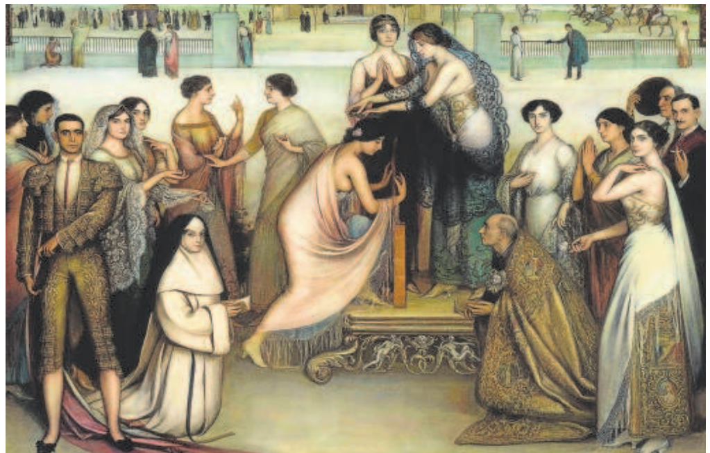
'La consagración de la copla' del pintor cordobés Julio Romero de Torres // ABC

El cuadro es una suerte de compendio magistral del simbolismo telúrico del autor sobre los mitos ancestrales de lo andaluz, en una composición centralizada inspirada en la pintura de los maestros del Renacimiento italiano. En el centro, una bella joven que representa a la copla, escoronada de laurel por otras dos sensuales mujeres, muy representativas del refinado erotismo fetichista del pintor, que están en pie sobre un podio barroco.