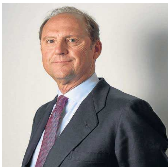
Javier Molina, presidente ejecutivo de Befesa.

El Ebitda ajustado del tercer trimestre se situó en 45,9 millones de euros, frente a los 42,7 millones de euros del mismo trimestre del año anterior, lo que supone un incremento del 7,6% interanual. El crecimiento en lo