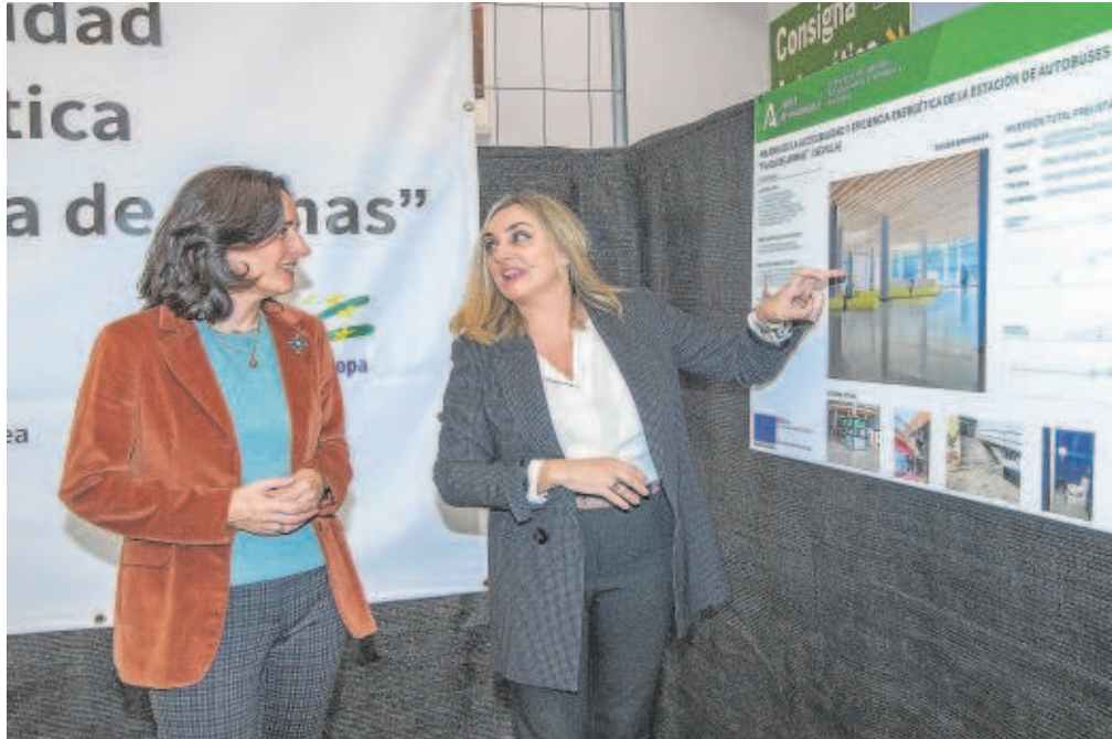
La consejera de Fomento de la Junta de Andalucía en la estación de Plaza de Armas