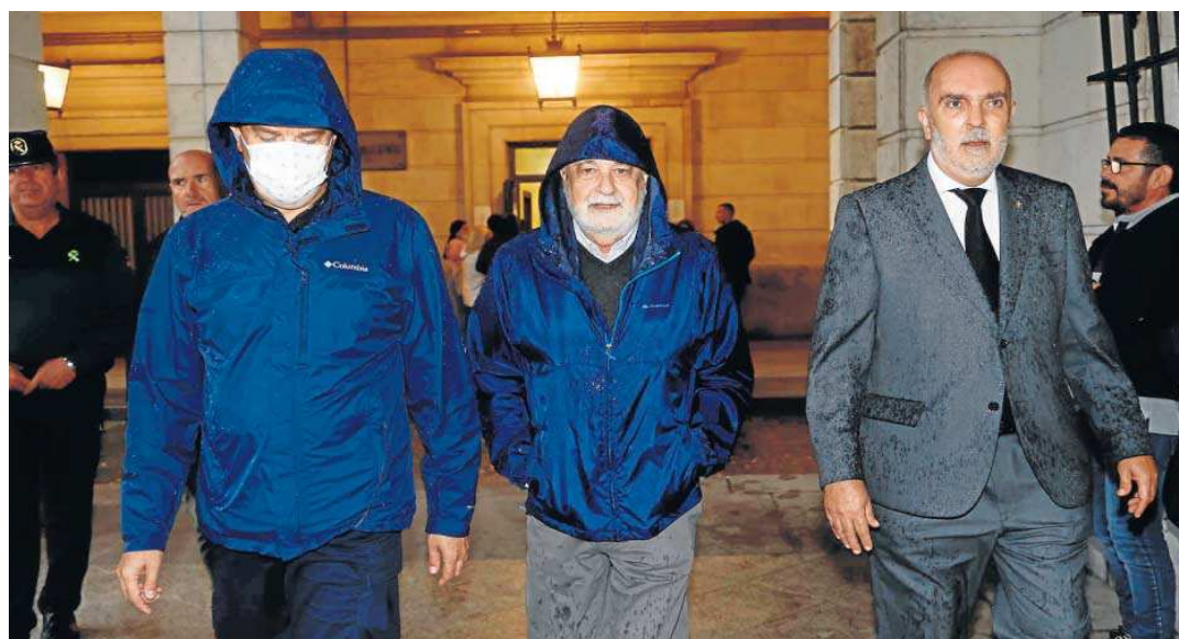
Griñán y Chaves salen de la Audiencia tras recibir la notificación de la condena de inhabilitación.

El Supremo ha respondido ahora que el incidente de nulidad de actuaciones “no suspende la ejecución de la sentencia, debiendo en su caso ser solicitada ante el órgano encargado de la ejecución de la misma”, en este caso, la Audiencia de Sevilla, que ya resolvió el martes denegando dicha suspensión. Contra esta resolución, la defensa de Griñán puede presentar al Supremo un recurso de reposición en el plazo de tres días.