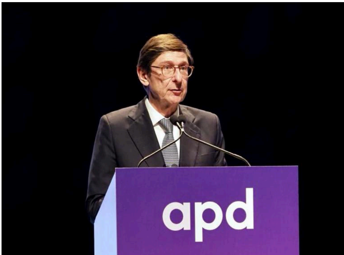
El presidente de CaixaBank, José Ignacio Goirigolzarri.

El presidente de CaixaBank, José Ignacio Goirigolzarri, ha defendido este miércoles en un acto con empresarios en Sevilla que el sector bancario cuenta hoy con el músculo financiero necesario para estar muy cerca de empresas y familias y poder, de esta forma, contribuir a la recuperación socioeconómica de nuestro país.