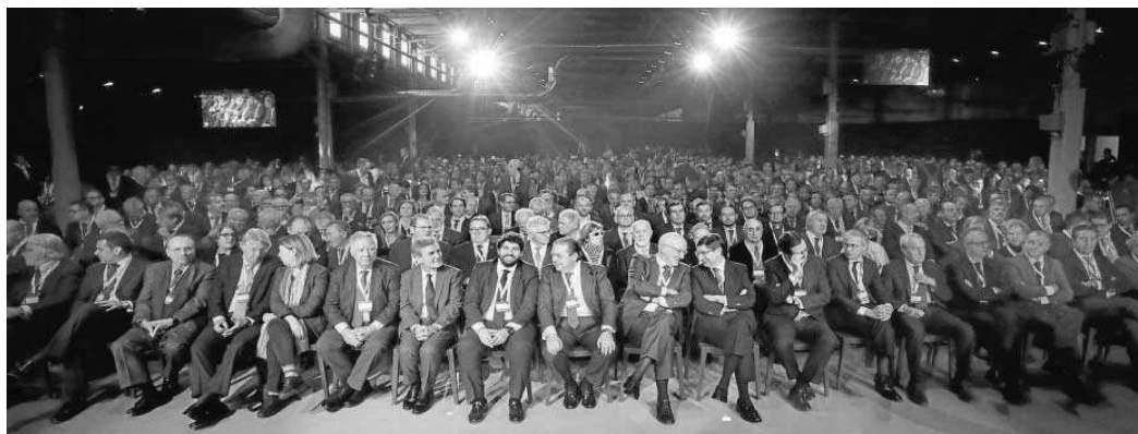
Imagen del V Acto Empresarial del movimiento '#QuieroCorredor'.

● La consejera de Fomento, Articulación del Territorio y Vivienda, Marifrán Carazo, acude al acto reivindicativo en Barcelona