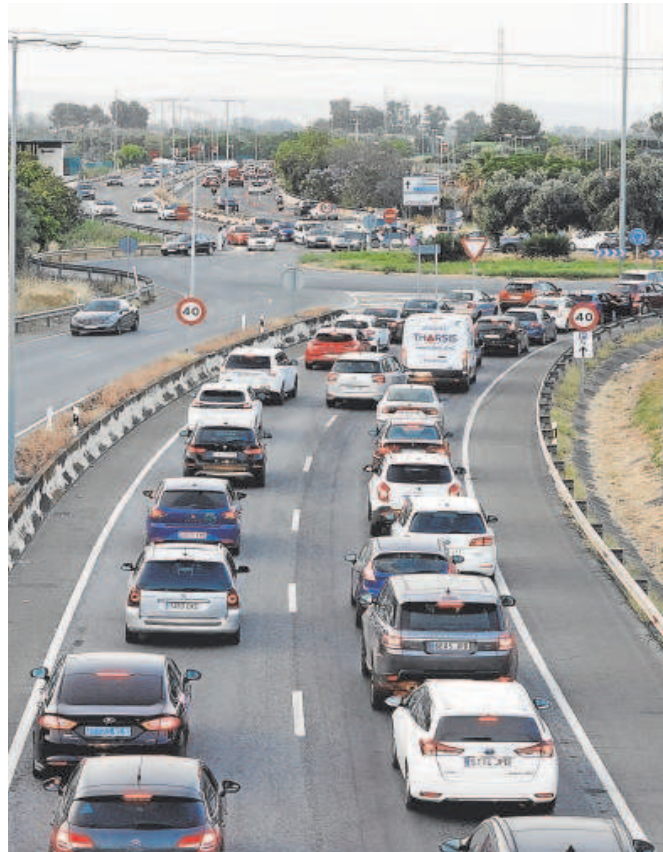
Cola de vehículos en una carretera sevillana

El parque móvil de la provincia está compuesto por 969.620 turismos, de