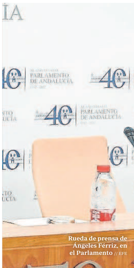
Rueda de prensa de Ángeles Ferriz, en el Parlamento

Desde el PP las reacciones fueron otras. Toni Martín, portavoz en el Parlamento, censuró la actitud del partido. «El PSOE le está regalando una tarta con una lima dentro para que se escape de la cárcel. Es una tragedia personal y familiar, pero tiene que cumplir su condena» .