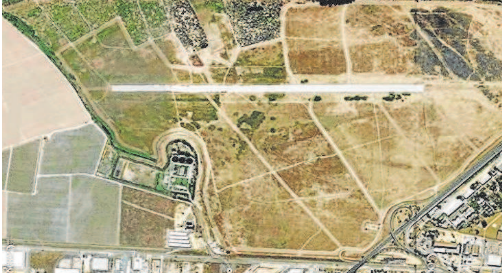
Vista aérea de la dehesa de Tablada, con la pista del antiguo aeródromo