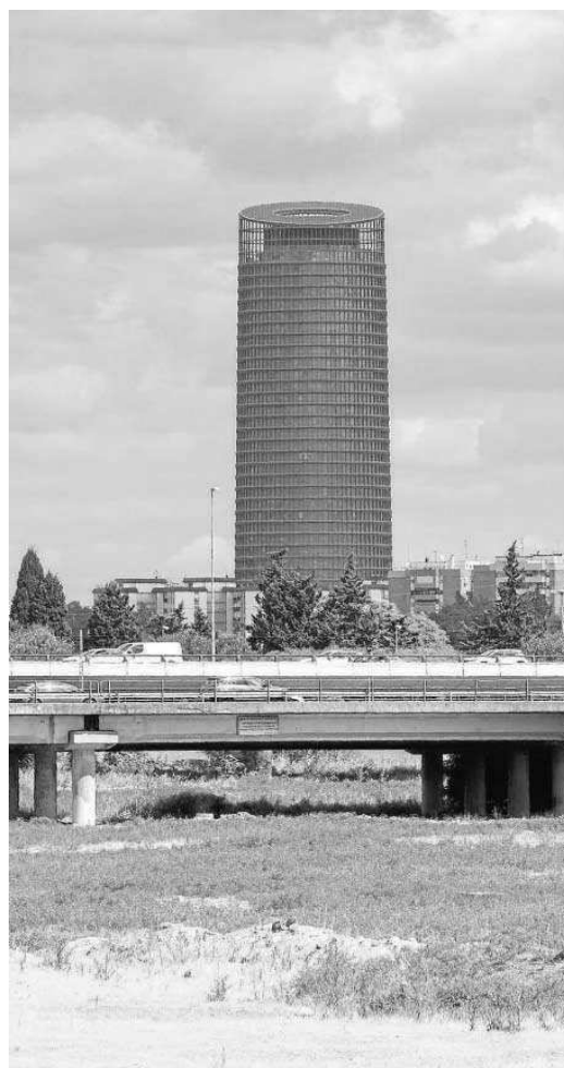
Los suelos de Tablada con la Torre Sevilla al fondo.

El estudio fue encargado después de que en marzo el alcalde de Sevilla mantuviera una reunión con la mesa ciudadana por Tablada para lograr el objetivo de que la dehesa sea una gran zona verde y pública. En esa sesión de trabajo se acordó una hoja de ruta que tenía como pri-