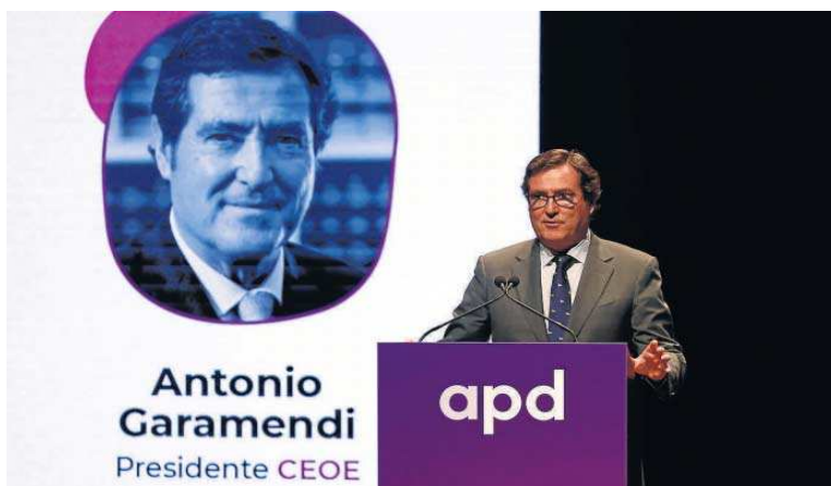
Antonio Garamendi, presidente de la CEOE, durante su intervención.