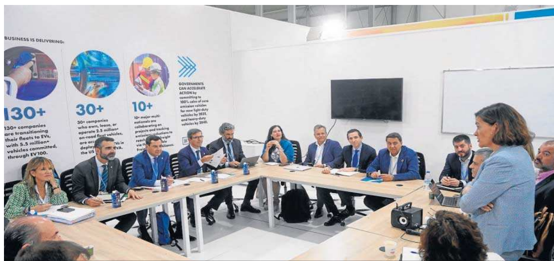
Reunión de la Junta de Andalucía con el Grupo Español para el Crecimiento Verde en la COP27.

● El presidente presenta el nuevo sello 'Carbono Zero' y la Unidad Aceleradora de Proyectos