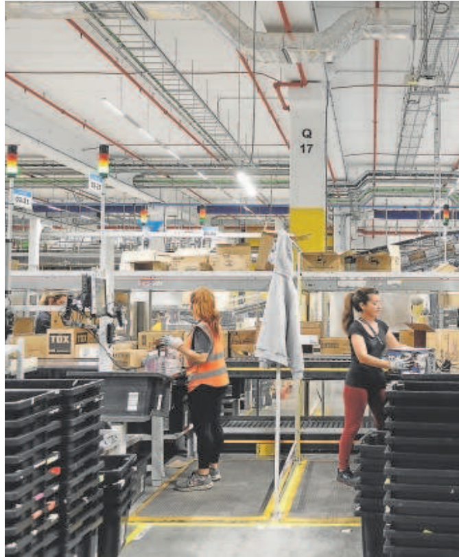
Centro logístico de Amazon en Dos Hermanas

Amazon tiene seis centros en Andalucía repartidos entre Sevilla (4), Málaga y El Puerto de Santa María (Cádiz). La estructura más amplia se concentra en la provincia sevillana donde la multinacional americana cuenta con una gran base logística localizada en el municipio de Dos Hermanas, donde trabajan unas 1.400 personas, la mayoría mozos de almacén y empleados dedicados a las tareas logísticas. «De momento no se está planteando ningún despido» señalan fuentes de UGT en el comité de empresa de este centro sevillano, que está altamente robotizado pese a su importante plantilla de trabajadores, la mayoría con contratos fijos, según apuntan las fuentes del sindicato. Es más, añaden que, «como en todos los centros de Amazon en España, la compañía está contratando gente de refuerzo con carácter eventual para afrontar el ‘Black Friday’ y la campaña de Navidad». La firma suele recurrir a ETT (empresas de tra-