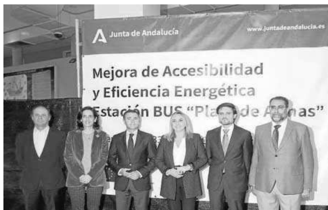
La consejera, con diversas autoridades, en su visita a las obras de la estación.

ra fase tienen una duración de ocho meses y una inversión de casi un millón de euros. El objetivo es que el edificio "esté plenamente adaptado a las necesidades de accesibilidad de los usuarios, sobre todo las perso-