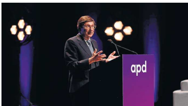
José Ignacio Goirigolzarri, durante su intervención en el Congreso Internacional de Directivos.