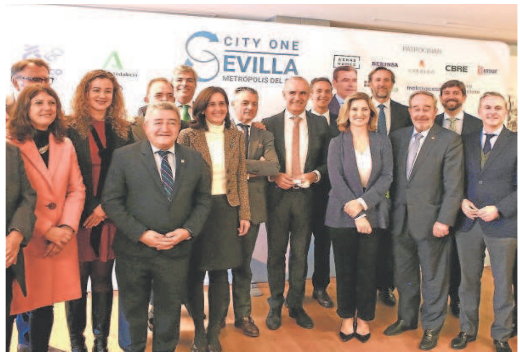
Miembros de Gaesco y las inmobiliarias junto al alcalde y otros representantes de la Junta o el Puerto de Sevilla

El alcalde reconoce que municipios como Dos Hermanas son un espejo donde mirarse «por sus políticas»