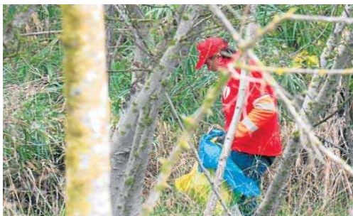
Voluntarios en la recogida de residuos en el río Guadalquivir.

Esta iniciativa, que se enmarca en el programa Mares Circulares –desarrollado por Asociación Chelonia, Fundación Ecomar, Asociación Vertidos Cero y Liga para la Protección de la Naturaleza (LPN) e impulsado por Coca-Cola–, consiguió recoger un total 522 kilos de residuos, entre los que destacan 67 kilos de PET. El PET recogido será reintegrado en la cadena de valor de Coca-Cola como parte de su hoja de ruta hacia la economía circular.