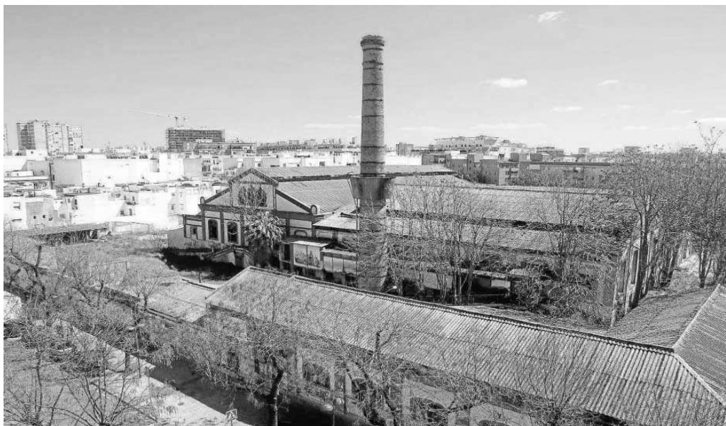
Vista aérea de la antigua fábrica de Vidrios de la Trinidad desde la avenida de Miraflores.

Finalmente, aunque la parcela que ocupa la antigua fábrica