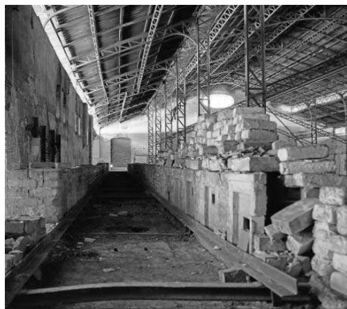
Interior de una de las naves del antiguo complejo fabril.

● El proyecto de urbanización que será aprobado hoy contempla un centro social y cultural vinculado al patrimonio industrial en la nave principal del anterior complejo fabril