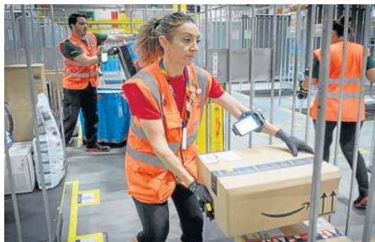
Empleados de Amazon preparan las rutas de los repartidores.

dad de 2020, muy marcada por las restricciones de la pandemia, con 71.000 envíos, recuerda