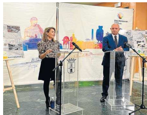
La ministra Raquel Sánchez y el alcalde Francisco Rodríguez, ayer.

Los Presupuestos Generales del Estado de 2023 incluyen una partida para el Estudio Informativo que desarrollará las soluciones definitivas. "Hoy hemos presentado al alcalde el estudio de viabilidad con el que hemos hecho un análisis preliminar de distintas opciones de soterramiento, disposición de apartaderos, encajes de trazado y arquitectura de la estación", aseguó Sánchez.