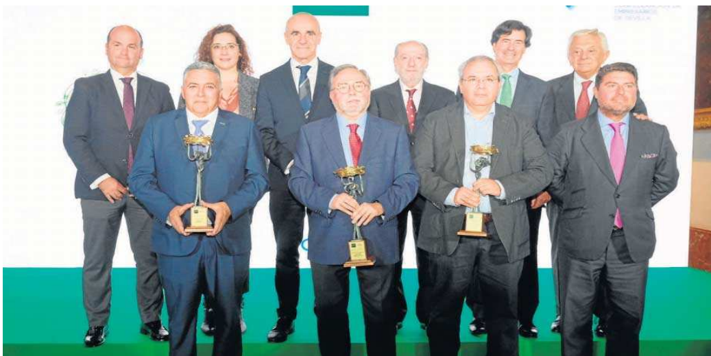
En la imagen, el presidente de la Diputación con Miguel Rus (CES) y el alcalde de Sevilla, Antonio Muñoz, junto a todos los galardonados.

El alcalde de Sevilla, Antonio Muñoz, y los presidentes de la Diputación de Sevilla y de la Confederación de Empresarios de Sevilla (CES), Fernando Rodríguez Villalobos y Miguel Rus Palacios, respectivamente, han entregado los X Premios de Responsabilidad Social Empresarial (RSE) en el transcurso de un acto celebrado en el Real Alcázar de Sevilla. Se trata de unos galardones, de carácter anual, convocados por la CES y la Diputación, a través de Prodetur, con la colaboración de Endesa y el Ayuntamiento de Sevilla, al objeto de reconocer públicamente las mejores iniciativas y buenas prácticas en Responsabilidad Social y Sostenibilidad de las empresas que desarrollan su actividad en Sevilla.