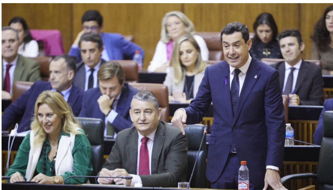
Juanma Moreno durante la sesión de control en el Parlamento andaluz.

El presidente de la Junta de Andalucía, Juanma Moreno , ha asegurado que su Gobierno recurrirá en los tribunales el impuesto de solidaridad a las grandes fortunas del Ejecutivo de la nación una vez que se apruebe de manera definitiva porque es un "ataque" a la autonomía andaluza, después de la decisión de eliminar el Impuesto de Patrimonio en la comunidad.