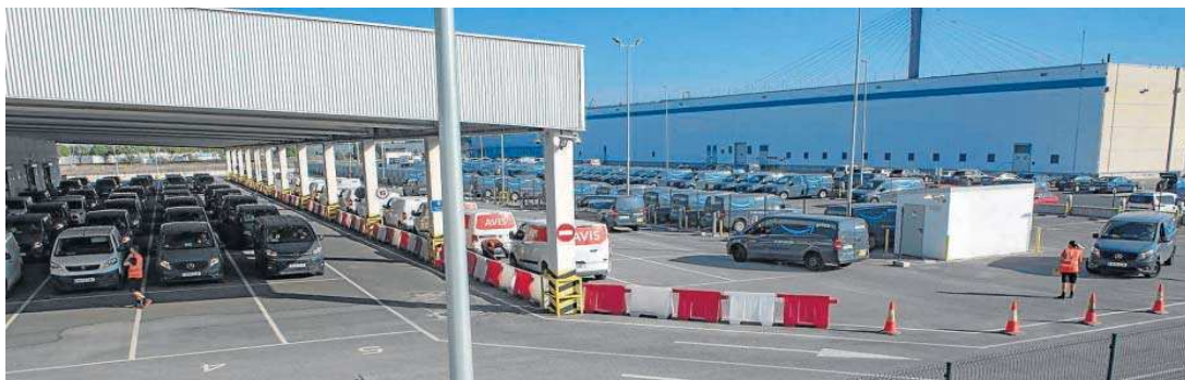
Imagen de las furgonetas preparadas, tras ser revisadas una a una, para cargar los paquete en la Delyvery Station de Sevilla.