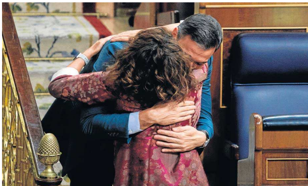
El presidente del Gobierno, Pedro Sánchez, abraza ayer a la ministra de Hacienda, María Jesús Montero, tras la aprobación de los Presupuestos.