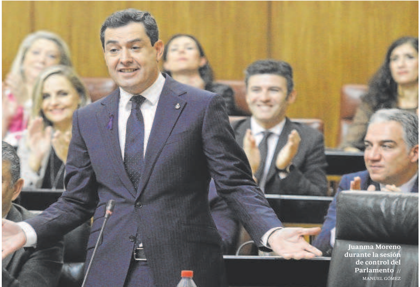
Juanma Moreno durante la sesión de control del Parlamento