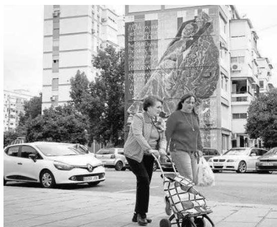
Dos vecinas pasean en el Polígono San Pablo.

La asociación de vecinos Amanecer ha trabajado durante estos dos últimos años (desde junio 2020) junto con