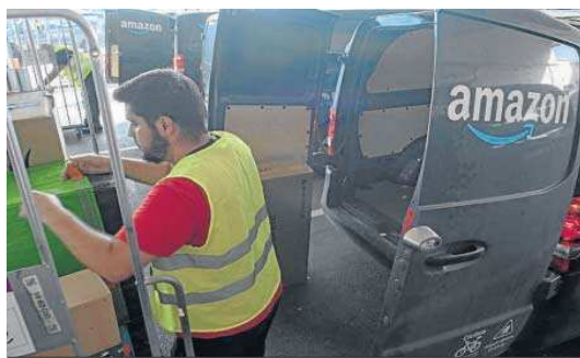
Un empleado de un Delivery Service Partner carga una furgoneta eléctrica.

El récord de paquetes repartidos en una sola jornada de este centro para Sevilla y parte de Huelva se estableció en la Navi-