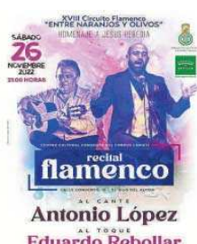
Detalle del cartel.

Este joven aficionado al flamenco comienza su formación