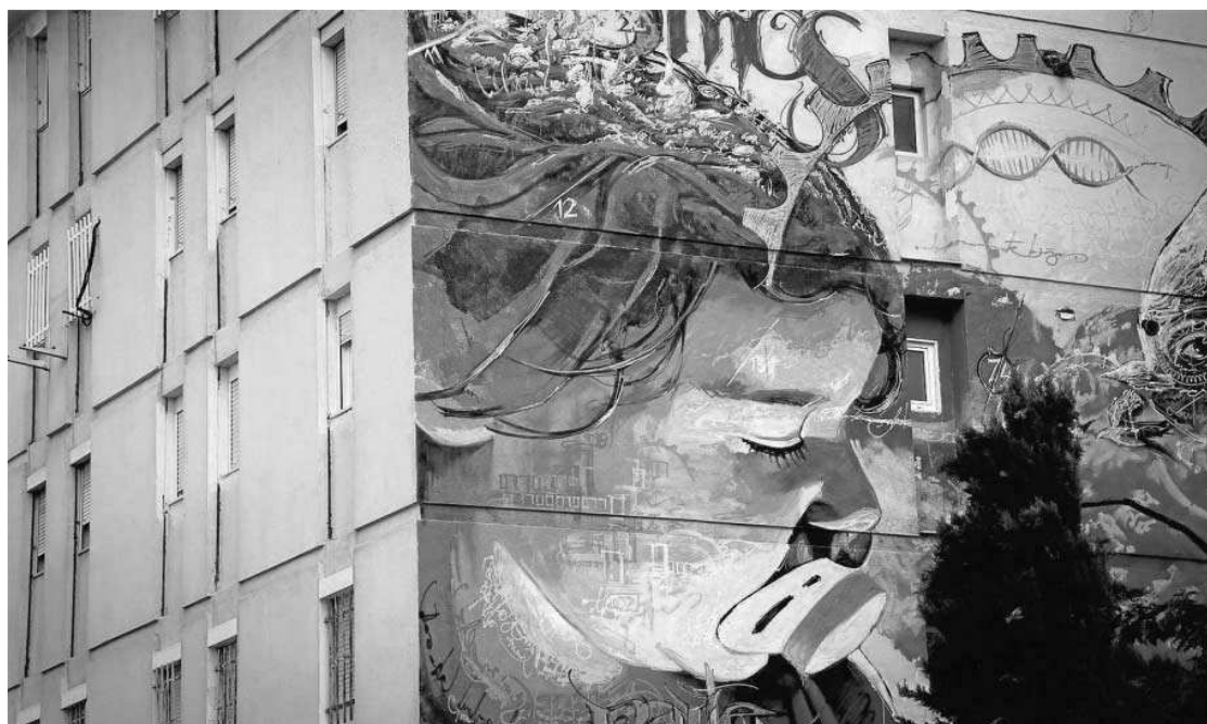
Una de las pinturas murales que decoran los bloques del Polígono San Pablo.