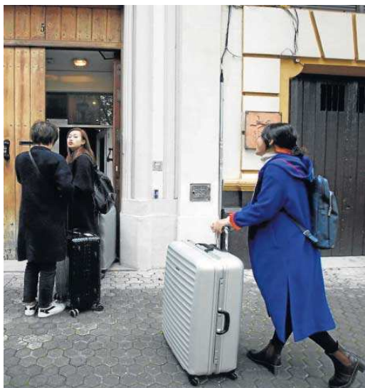
Turistas a las puertas de una vivienda turística en Sevilla.