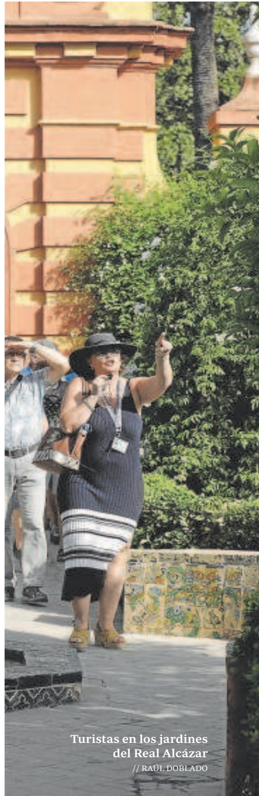
Turistas en los jardines del Real Alcázar