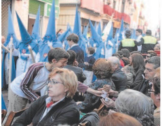
Algunas zonas de Sierpes perderán la tercera fila de sillas en 2023

De esta forma, se abrirán las dos bandas de sillas y se eliminarán las que no quepan en función a la estrechez de la calle. Es decir, en aquellas zonas que por su angostura sea necesario, se eliminará la tercera fila —las de la parte trasera— a un lado, al otro, o a ambos, dependiendo del espacio. Los huecos que queden libres al crear este pasillo se rellenarán de sillas para evitar una pérdida mayor.