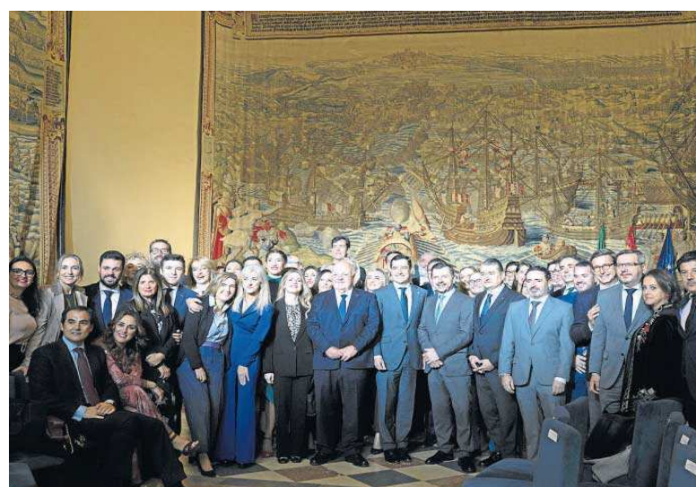
Foto de familia en el acto del 40 aniversario de la creación del Parlamento.

Aquel día hacía más calor, mucho más, era 21 de junio, de 1982, y en el salón de los Tapices del Alcázar de Sevilla no había ni hay aire acondicionado. La primera sesión del primer Parla-