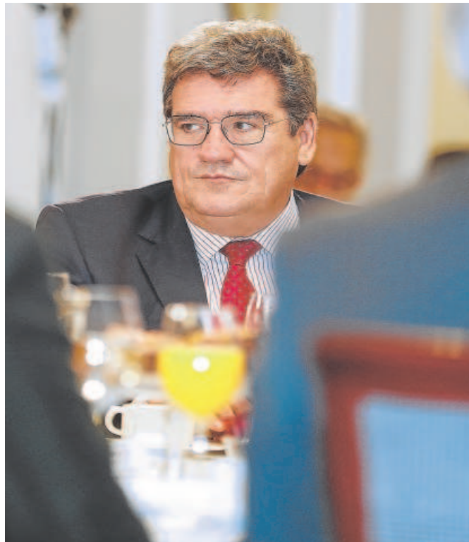
El ministro de Seguridad Social y Migraciones, José Luis Escrivá

Será para 2024 cuando también se añada la subida por el destope de cotización. Desde entonces la subida será del IPC más el destope más el mecanismo de equidad intergeneracional. Concretamente, el Gobierno estima que la senda de aumento de las bases