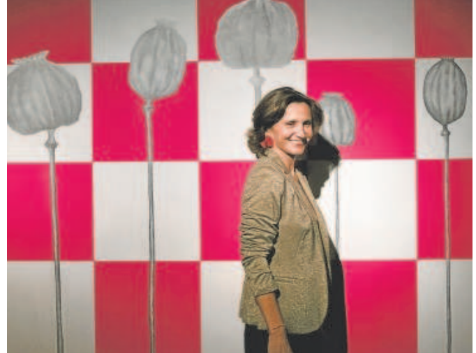
Beatriz Zamora, ante una de sus creaciones

Con 'Cabezarrasa' Beatriz Zamora se desnuda y, a través de la instalación, crea una atmósfera personal e íntima que inmiscuye al espectador a entrar en sus recuerdos, en sus obsesiones y en su propia mente a través de púas, pinchos y objetos cortantes que se dulcifican en la mano de la artista para