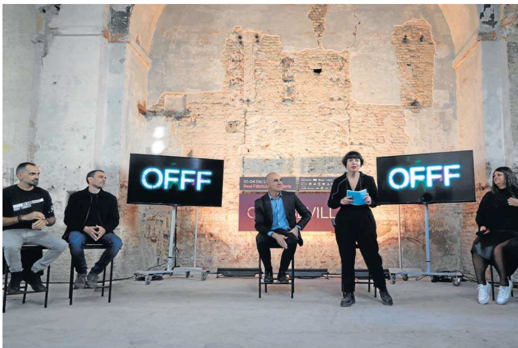
Presentación de OFFF Sevilla.