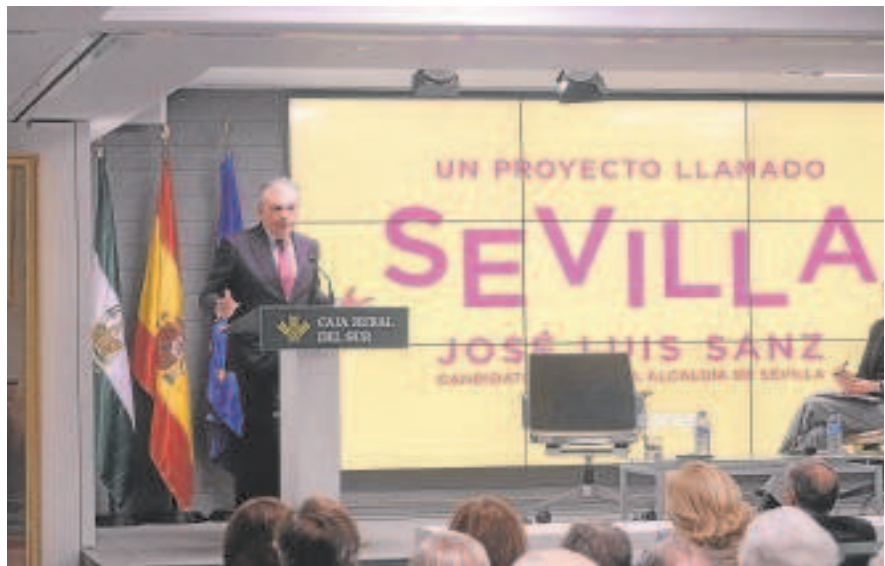
El candidato del PP a la Alcaldía, José Luis Sanz, en un acto ayer

La modificación urbanística aprobada en el Pleno del Ayuntamiento de Sevilla el 28 de abril para «reconocer el fenómeno de uso» de los pisos turísticos entró en vigor el 7 de junio. El recurso se presenta al entender la Agencia de la Competencia que la nueva regulación impone limitaciones a la unidad de mercado, explican desde la Consejería. La modificación urbanística no tiene carácter retroactivo, es decir, no es de aplicación a las viviendas turísticas que ya estaban funcionando. El Ayuntamiento regula y ordena, por vez primera, esta actividad, en los «límites» marcados por sus competencias y tras un «amplio periodo de consultas». Hasta el momento, carecía de una regulación específica a pesar del crecimiento que ha experimentado en los últimos años como consecuencia del auge del turismo en la ciudad, tal