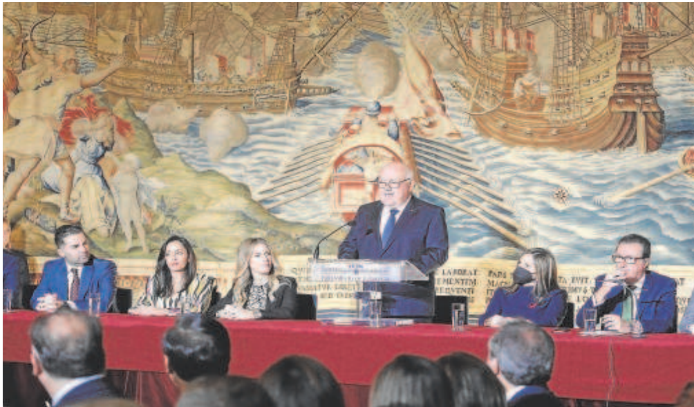
Jesús Aguirre, presidente del Parlamento, durante su discurso institucional

El Parlamento de Andalucía conmemora su aniversario en el mismo lugar donde se constituyó pero en un clima más tenso y con la ausencia de Vox, que boicoteó el acto