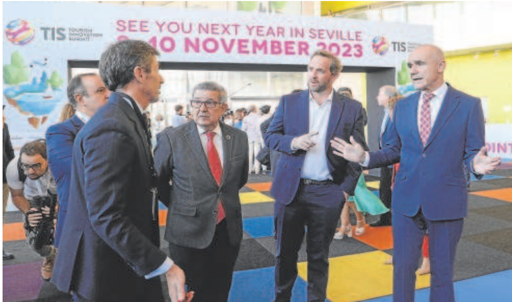
El alcalde de Sevilla junto al secretario de Estado de Turismo y el delegado del Gobierno en el TIS