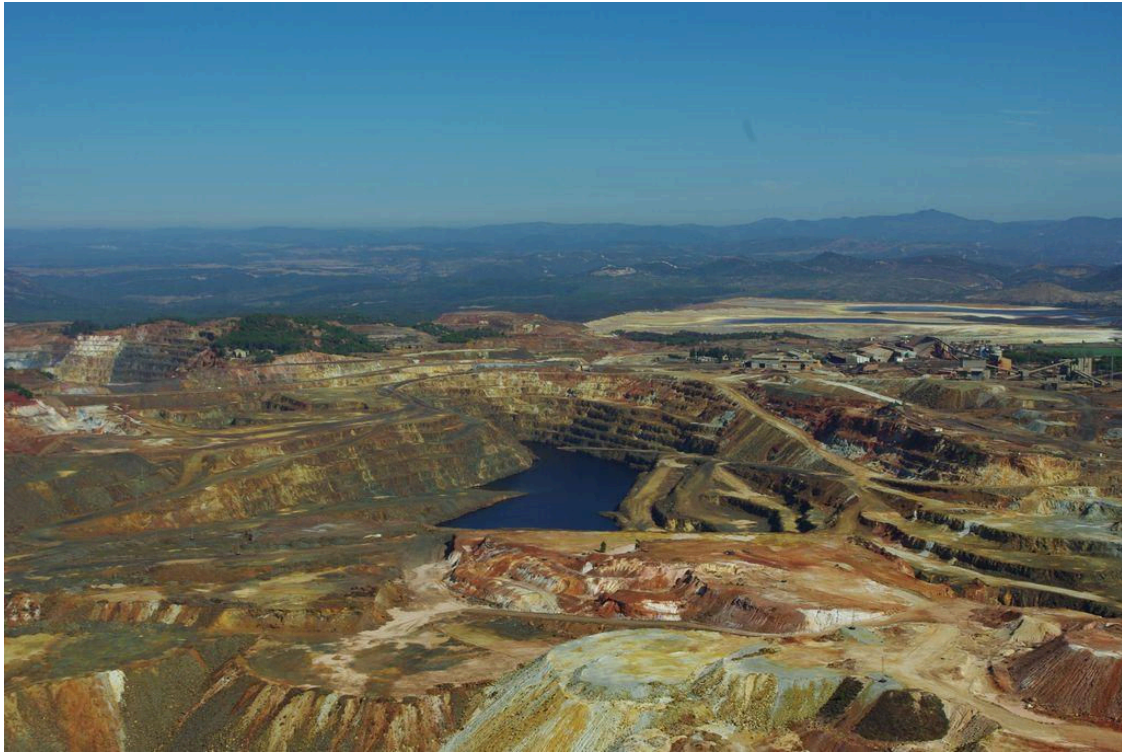
Mina de Riotinto.