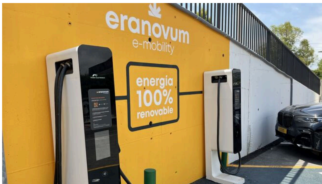
Puntos de carga para coches eléctricos de Eranovum. / M. G.

La compañía Eranovum será una de las empresas que facilitará la carga de vehículos eléctricos en la vía pública en Sevilla.