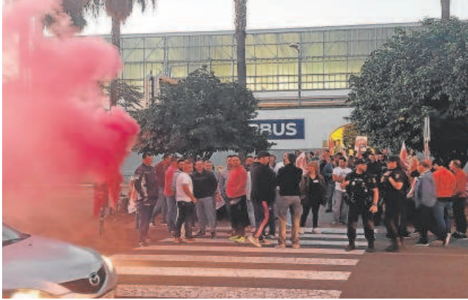
Planta de Tablada durante la huelga de ayer