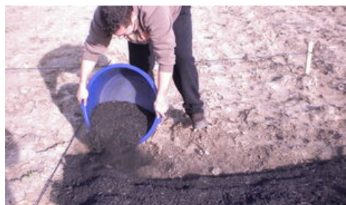
Trabajador del campo con las faenas agrícolas en su plantación. Trabajador del campo con las faenas agrícolas en su plantación.