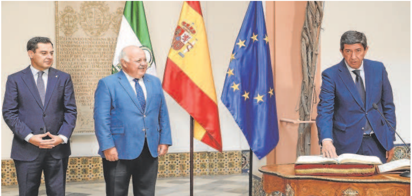
Juanma Moreno y Jesús Aguirre presiden la toma de posesión de Juan Marín como presidente del Consejo Económico y Social