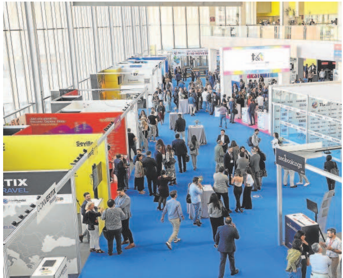
Algunos de los stands que se dan cita en el TIS de 2022, en el Palacio de Exposiciones y Congresos de Sevilla

Turbosuite, CoverManager, Unblock, PastView, Misscar o Infotactile son nuevas empresas de Sevilla que operan en todo el mundo