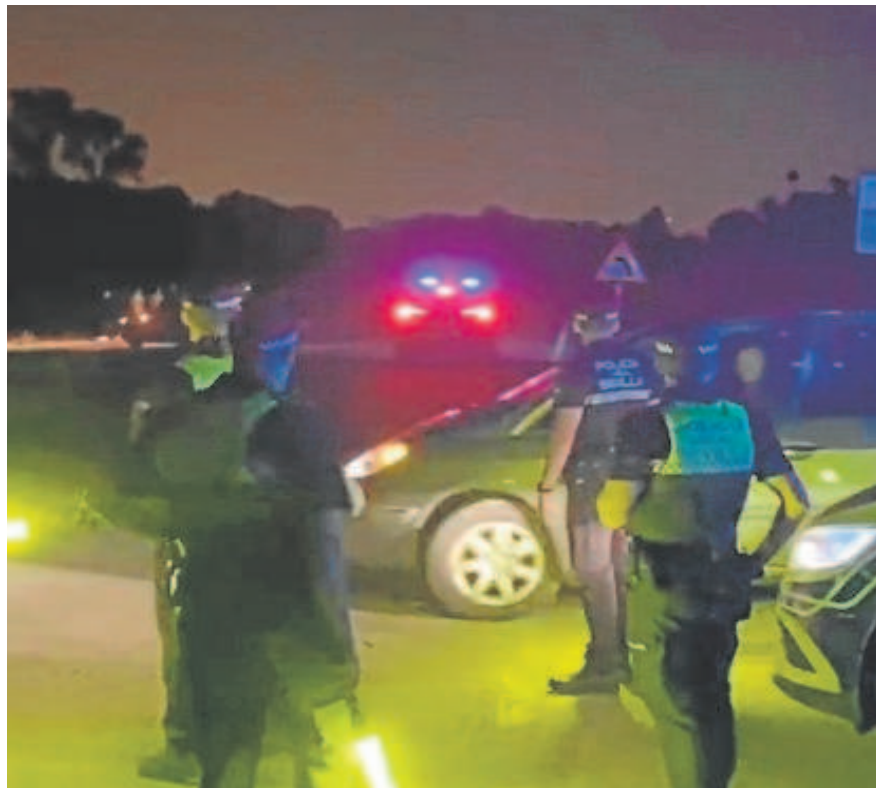
Agentes de la Policía Local en un control

Ésta era la programación sobre el papel, aunque luego esos equipos estuvieron moviéndose por una ciudad en fiesta. Fuentes policiales confirman que a partir de las diez de la noche, el 092 empezó a recibir decenas de llamadas de jóvenes alertando de la presencia de una pandilla agredien-