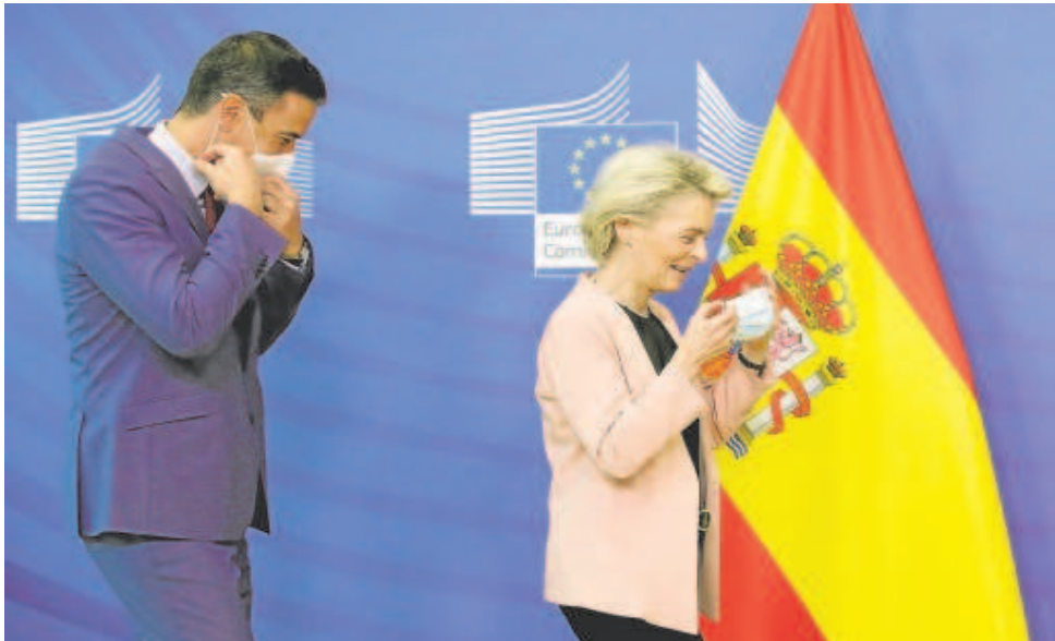
Pedro Sánchez, presidente del Gobierno de España, junto a Ursula von der Leyen, presidenta de la Comisión Europea