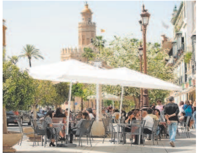
Los bares piden que la clientela se sume a la protesta