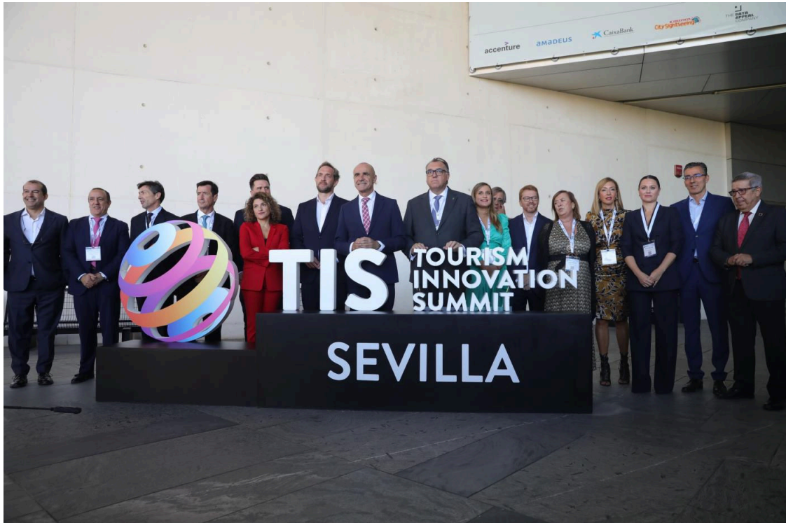
Foto de familia de las autoridades políticas en el acto de inauguración del TIS, en Fibes.

La cumbre de la innovación aplicada al turismo, Tourism Innovation Summit (TIS, por su siglas en inglés), crece en su tercera edición y "consagra a Sevilla como un referente internacional". El evento, que se celebra en Fibes hasta el 4 de noviembre, se ha iniciado este miércoles con la asistencia de más de 6.000 congresistas y 400 expertos que debatirán sobre los retos de futuro de la industria turística.