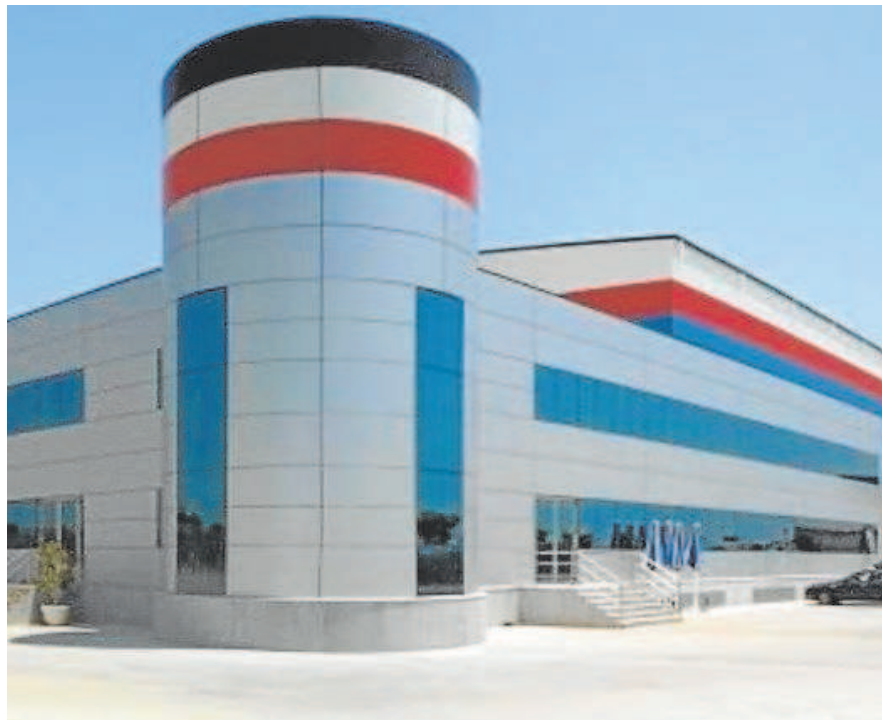
Planta de procesado de pescado en Huelva de Marti Peix

Según el plan de liquidación, una vez recibido el precio de venta del activo hipotecado, la empresa Alkali Europe III, como acreedor privilegiado, se comprometía a cancelar la totalidad del crédito especial de 10,8 millones de que pesa sobre las naves y terrenos de Marti Peix en Huelva, no así los referidos a suelos en Palencia. En 2021, la administración concursal puso a la venta los activos de Marti Peix, valorados en 26,2 millones. La 'joya' de esos bienes es la planta de procesado de pescado que tiene en el Parque Huelva Empresarial, de 18.000 metros cuadrados construidos, en la que la Marti Peix invirtió 25 millones (el