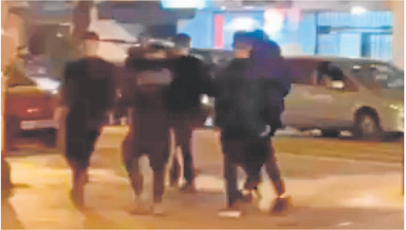
Varios de los jóvenes sospechosos captados por uno de los vecinos que grabó los altercados