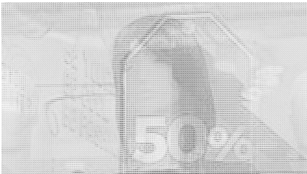
Varios maniqués ataviados con prendas negras en referencia al Black Friday.

La compañía de de recursos humanos Randstad ha publicado este miércoles sus previsiones de contratación con motivo de la llegada del Black Friday , el próximo viernes 25 de noviembre, y el Cyber Monday , el lunes 28. Unas fechas que se han convertido en los últimos años en hitos de consumo por sus ofertas y promociones, por las que muchas empresas se ven obligadas a aumentar su contratación. Para llevar a cabo estas previsiones, Randstad ha tenido en cuenta los sectores de comercio y logística y transporte, directamente relacionados con el incremento del consumo durante este periodo.