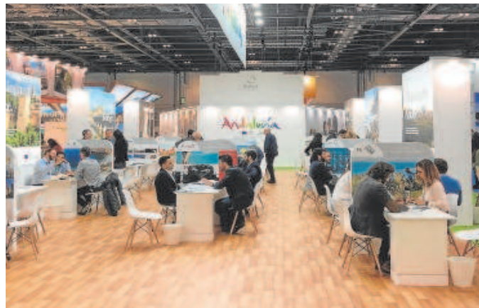
Aspecto de las mesas de trabajo del Pabellón de Andalucía // ABC

En primer lugar porque serían ellos los encargados de cobrarla lo que les generaría un trámite con la administración autonómica además de la incomodidad de sus huéspedes en un cobro que no va destinado a su sector. También habría que determinar el precio de esa tasa ya que si es muy baja, un euro como se ha planteado, los hoteleros entienden que no sería rentable porque el dinero se perdería en los trámites administrativos. Y si es muy elevada retraería la visita de familias a las ciudades andaluzas, que son precisamente uno de los principales sectores que eligen la comunidad autónoma para sus visitas.