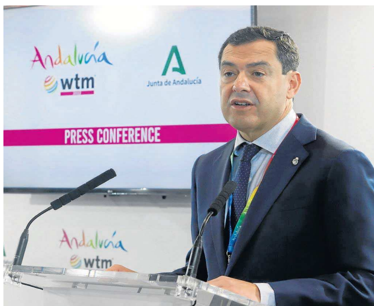
Juanma Moreno, ayer en la World Travel Market de Londres.

Así las cosas, los planes para impulsar Andalucía pasan por consolidarla como un destino “seguro”, muy en especial entre los británicos—su principal emisor extranjero—, pero también aplicar algunas de las enseñanzas que ha dejado la pandemia, como el auge del teletrabajo, en el que se enfocará la gran novedad anunciada por Moreno, una campaña para “nómadas ener-