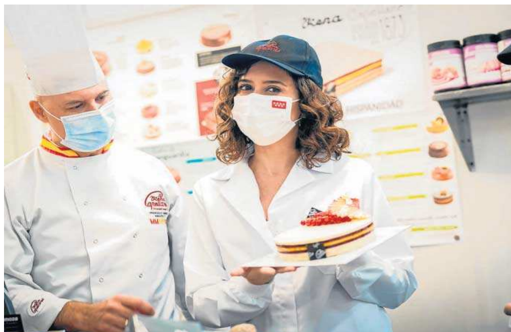
La presidenta madrileña, Isabel Díaz Ayuso, visita ayer un obrador en Alcorcón.

● La presidenta madrileña acusa a Pedro Sánchez de ser el “Le Pen de la izquierda” y querer meter en la cárcel a la oposición