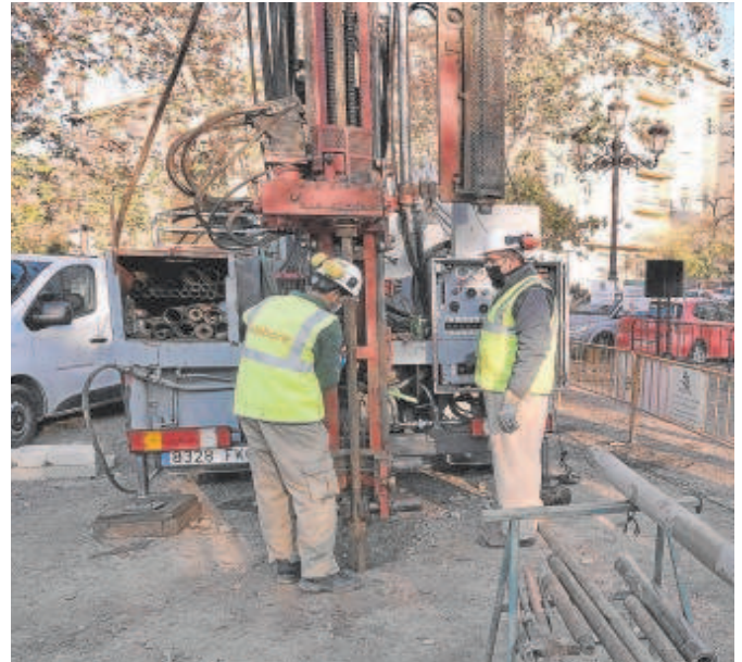
Trabajos previos para la redacción del proyecto de la línea 3

El borrador, entregado a la Consejería de Fomento el pasado 25 de octubre, ha sido tramitado de forma urgente por la Junta de Andalucía, que cuenta ya con los últimos informes solicitados de la Consejería de Hacen-