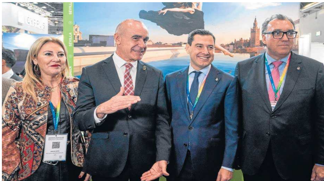
Moreno y Muñoz charlan en Londres ayer durante la celebración del World Travel Market.

● El trabajo en la World Travel Market (WTM) busca nuevas rutas aéreas y llamar la atención del turista 'premium' a los eventos