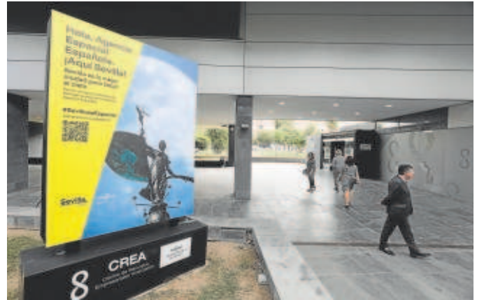
Edificio del CREA, donde se ubicaría la Agencia Espacial