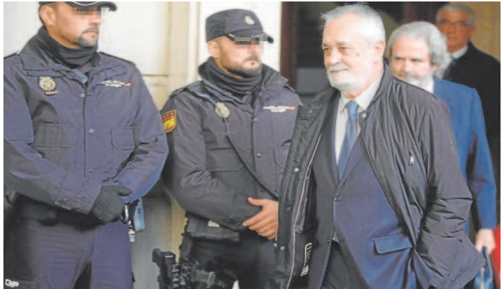
El expresidente de la Junta de Andalucía José Antonio Griñán saliendo de la Audiencia de Sevilla en 2019

El exdirigente socialista argumenta que dichos «descalificativos» no son empleados por el Tribunal Supremo. Éste determinó que Griñán «tuvo conocimiento también de las ilegalidades que se venían produciendo en la concesión y pago de las ayudas, haciendo posible con su pasividad que esta situación se prolongara» en su