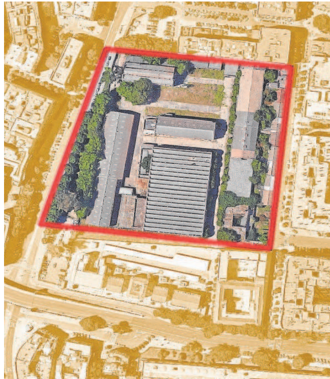
Las antiguas naves militares de Santa Bárbara están entre las calles Eduardo Dato, José María Moreno Galván y Jiménez Aranda, en el barrio de Nervión de Sevilla

Ese traspaso se produjo en virtud de un acuerdo que se firmó un día antes de que concluyese el plazo fijado