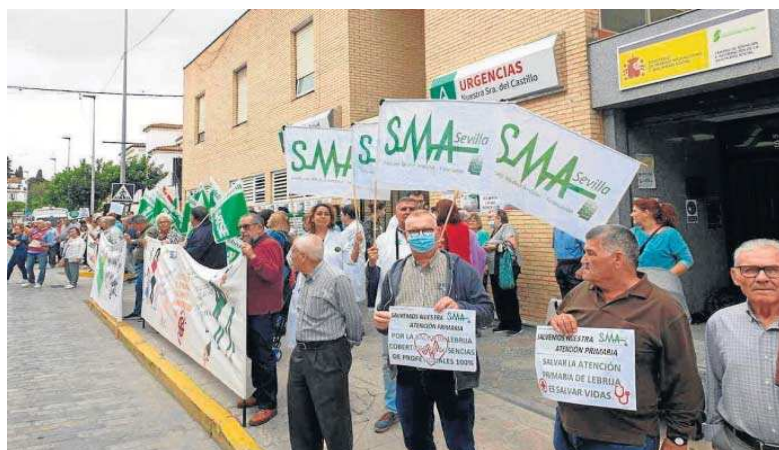
SIGUEN LOS PAROS EN LEBRIJA. Profesionales del centro de salud y vecinos del municipio siguen con las protestas contra la reestructuración del SAS de la atención urgente, centralizada en Atención Primaria, y hoy concluirán con los paros de 10 minutos protagonizados desde el jueves pasado.