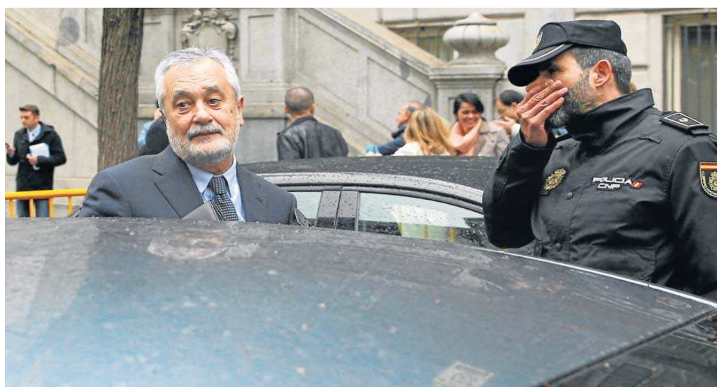
José Antonio Griñán tras declarar en el Tribunal Supremo.

● La defensa del ex presidente considera que se da el escenario para que la Fiscalía informara “favorablemente” a la medida de gracia por la fecha de los hechos y por ser su “única condena”