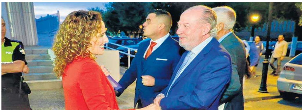
El presidente de la Diputación, en su visita a Benazacón para la inauguración del nuevo auditorio.

El presidente de la Diputación ha puesto de relieve "el afán de los ayuntamientos de la provincia por disponer de unas magníficas instalaciones con las que reactivar los espectáculos culturales. De tal manera, que destinamos 9,5 millones de euros con carácter extraordinario para reforzar