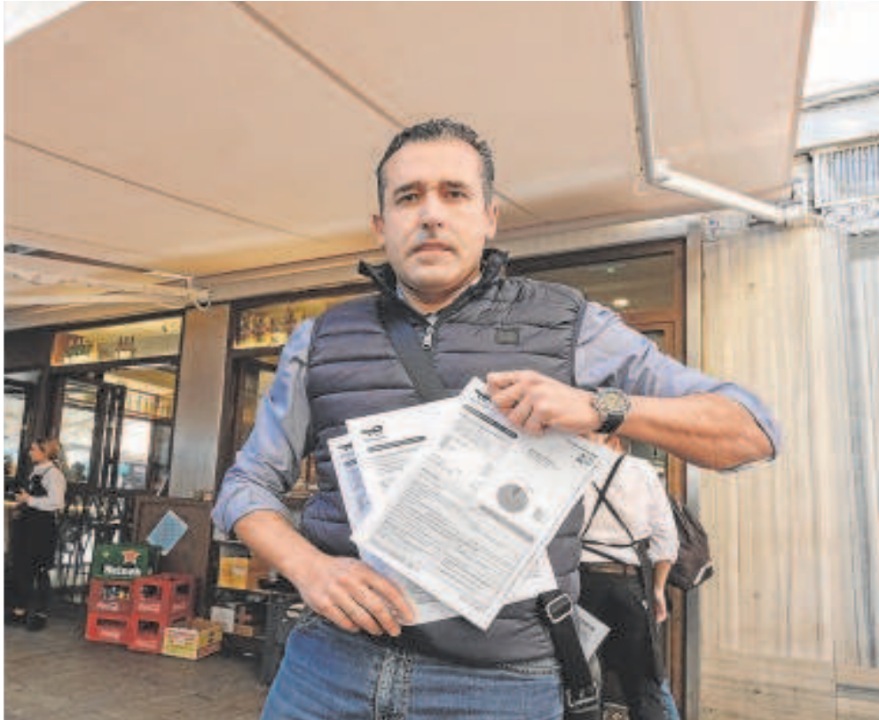
luz en Casa Manolo

bre todo porque además del recibo de la luz también ha sentido la inflación en las materias primas. «Después de la pandemia esto es un palo más pero las administraciones no nos ayudan. Lo único que hacen es inspecciones y ponernos multas y con esa situación te dan ganas de pegar un cerrojazo», explica Moro, que cuando recibió la primera factura con la subida se preguntó qué era aquello. «Al final no tienes más remedio que pagar pero hay restaurantes que tendrán que cerrar», advierte.