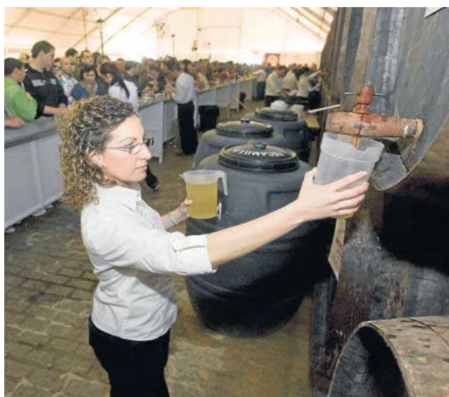
Una edición pasada de la Fiesta del Mosto y de la Aceituna Fina del Aljarafe.

● Junto a las degustaciones gratuitas se podrá disfrutar de la gastronomía local en los diferentes 'stands' del recinto ferial