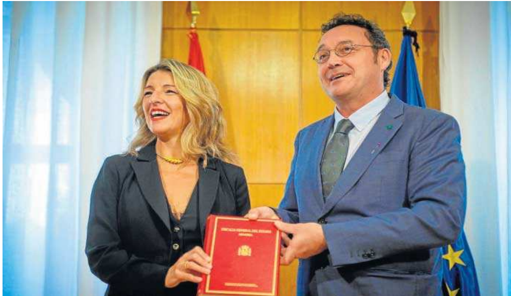
La vicepresidenta segunda, Yolanda Díaz, sostiene la Memoria Anual de la FGE con el fiscal general, Álvaro García Ortiz.