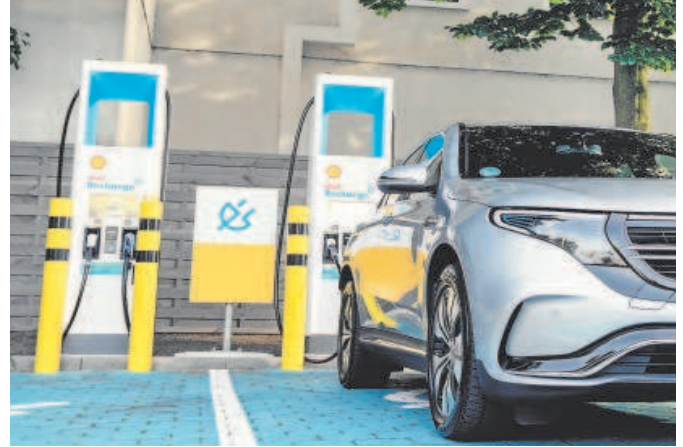
Los puntos de Cable Energía se harán bajo la marca Shell Recharge

uno de los distritos, con un máximo por distrito de 28 posiciones y 56 puntos de recarga. No obstante, se hará una especial incidencia en el Parque Científico y Tecnológico Cartuja (PCT), dentro de la línea de cooperación con el programa #eCity, ya que se pretende la declaración de la isla de la Cartuja como zona de bajas emisiones.