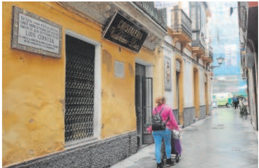
La casa natal de Luis Cernuda será rehabilitada en 2023

El Ayuntamiento compró el inmueble ubicado en la calle Acetres por 460.788 euros en 2019 y lo con-