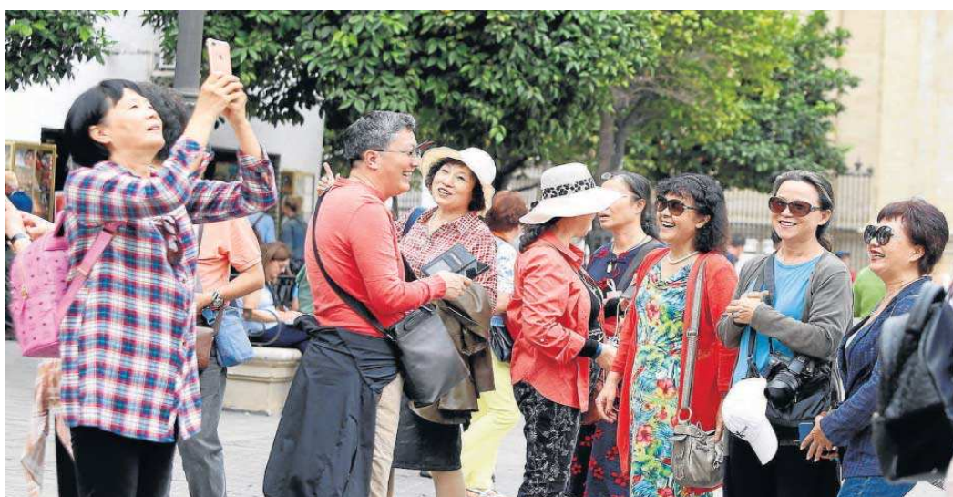
Un grupo de turistas se fotografía en Sevilla antes de la pandemia.