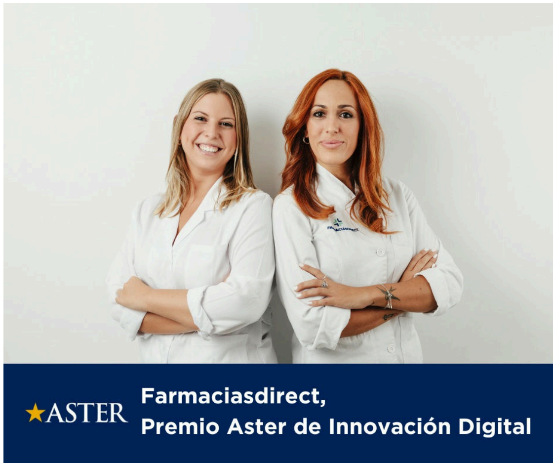
Farmaciasdirect.com Premio Aster de Innovación Digital 1 Moncloa

La escuela de negocios ESIC reconoce la innovación digital de esta farmacia online por su liderazgo en la transformación digital del sector farmacéutico y la premia por su estrategia de digitalización pionera y diferenciadora