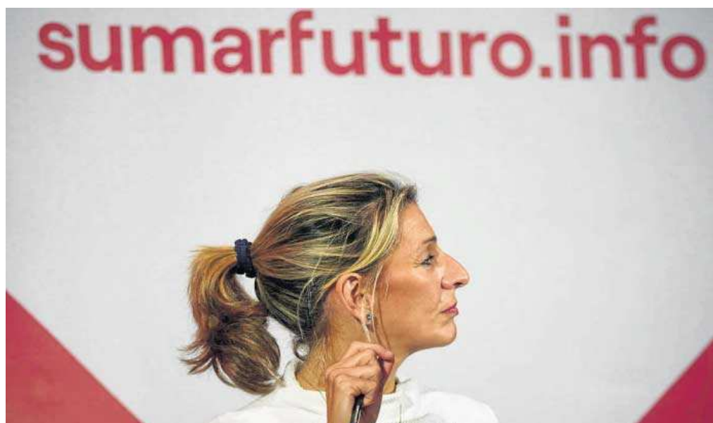
La vicepresidenta segunda, Yolanda Díaz, saluda ayer a una militante en la presentación de Sumar en Pamplona.

● La vicepresidenta afirma que su plataforma “no es complemento de nadie” y que es “ya imparables”, en plena tensión con Podemos