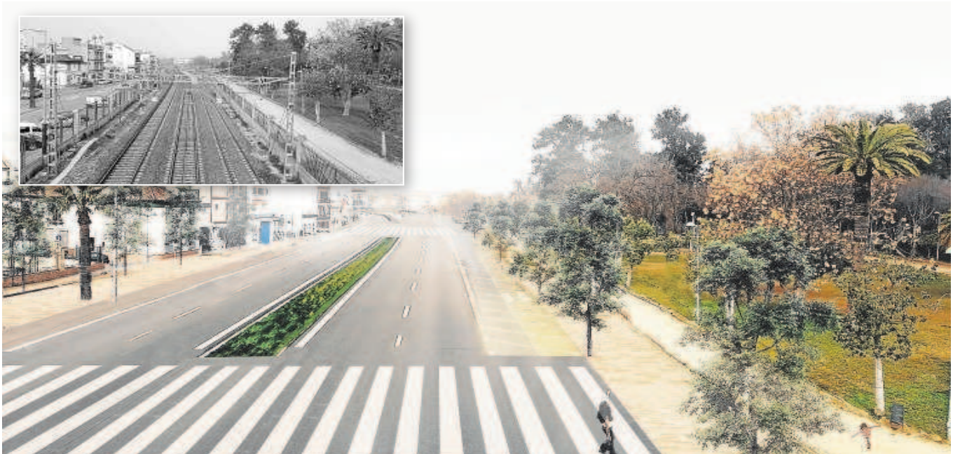
Recreación del nuevo bulvar que resultaría del soterramiento y detalle de una imagen antigua de las vías a su paso por el casco urbano nazareno