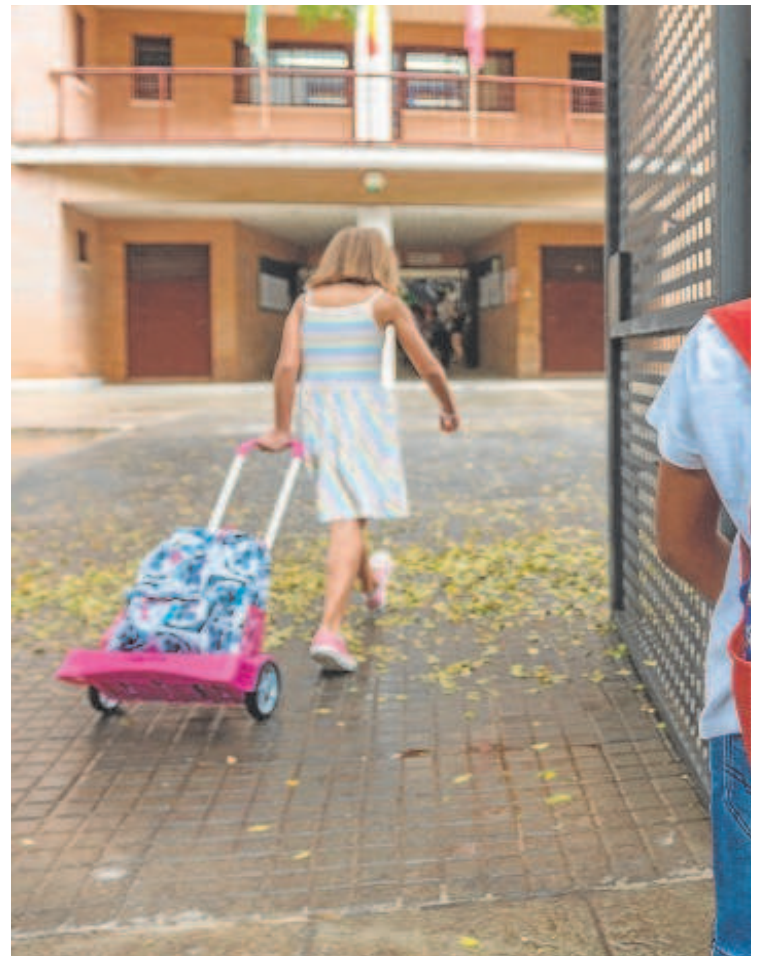
Niños a la entrada del colegio de Infantil y Primaria Alfonso Grosso

Una operadora automática contestará al teléfono en la delegación de Educación. Es una iniciativa que ha decidido poner en marcha el nuevo delegado para agilizar las consultas ya que cuando llegó se encontró largas colas en la delegación. Para evitarlo y porque muchos padres se quejaban de que no le