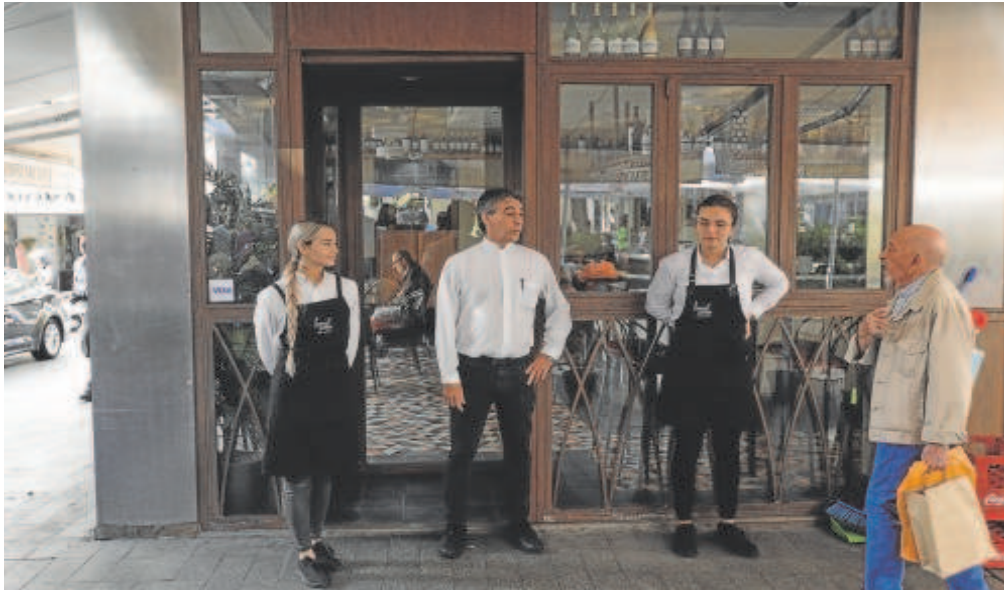
Los camareros de un local de la Alfalfa, ayer durante el paro para protestar por la inflación