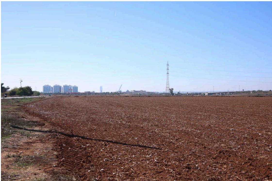
Terrenos donde se construirá el ramal técnico del tramo norte de la línea 3 del Metro.

JOAQUÍN CORCHERO/EUROPA PRESS • original