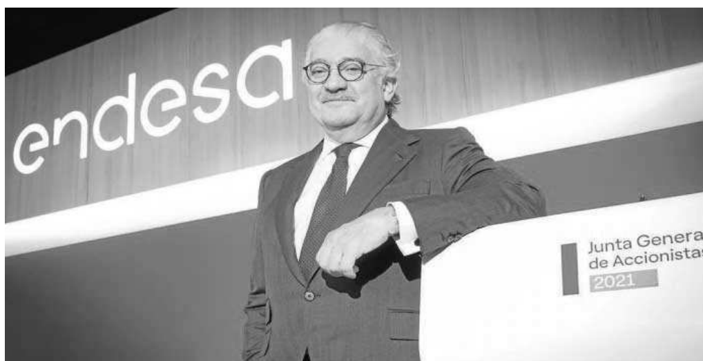
José Bogas, consejero delegado de Endesa, en una imagen de archivo.

La compañía destacó que el resultado se produce en un contexto de mercado más complejo y volátil que el del primer semestre, aunque señala que la aplicación de la denominada "excepción ibérica" en España y Portugal ha mantenido bajo control los precios de la electricidad en el mercado mayorista en comparación con otros países europeos.