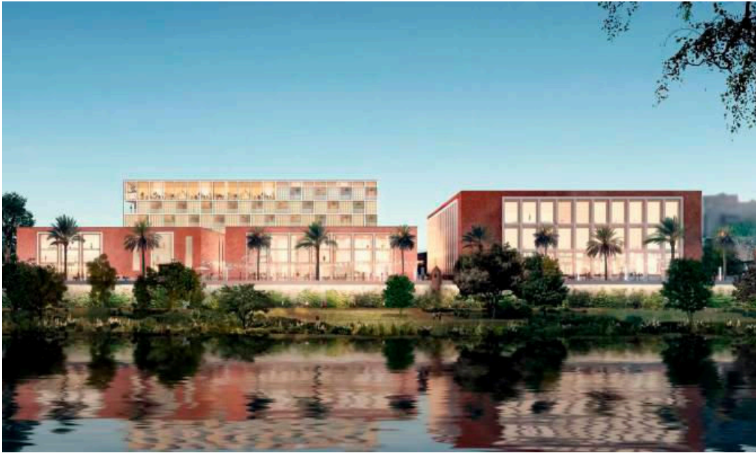
Imagen virtual del proyecto Altadis.