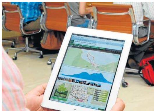
Imagen de archivo de la presentación de mapas en ediciones anteriores.

La serie cartográfica de mapas de senderos e itinerarios de la Sierra Morena Sevilla-Parque de la Sierra Norte-Vega de Sevilla. En lo que se refiere a la línea de trabajo para la elaboración de cartografía de ámbito municipal, se presentó hace unos dos años el mapa