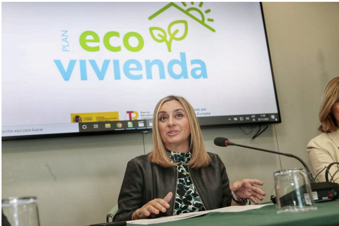
La consejera de Fomento, Articulación del Territorio y Vivienda, Marifrán Carazo.

La Consejería de Fomento, Articulación del Territorio y Vivienda ha recibido más de 1.200 solicitudes de los vecinos y las comunidades de propietarios para optar a las ayudas a la rehabilitación del Plan Ecovivienda, el mecanismo ideado por la Junta de Andalucía para gestionar los fondos europeos Next Generation en materia de vivienda.