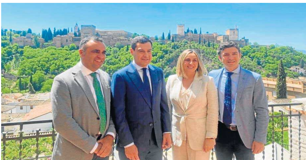
Juanma Moreno y Marifrán Carazo, acompañados por dirigentes del PP granadino Francisco Rodríguez y Jorge Saavedra.

Los andaluces escogen a concejales el próximo 28 de mayo, en unas elecciones municipales que serán más disputadas allí donde los alcaldes aún no están consolidados. Eso convierte a las ciudades de Sevilla, Cádiz, Granada y Jaén como las más inciertas. En