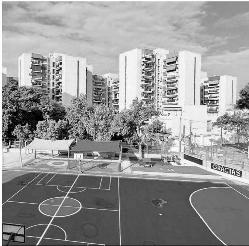
Zona deportiva de un colegio público de la capital.

Distribuido para CONFEDERACIÓN DE EMPRESARIOS DE SEVILLA * Este artículo no puede distribuirse sin el consentimiento expreso del dueño de los derechos de autor.