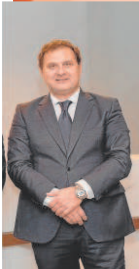
multinacional Abengoa están en concurso de acreedores // RAÚL DOBLADO