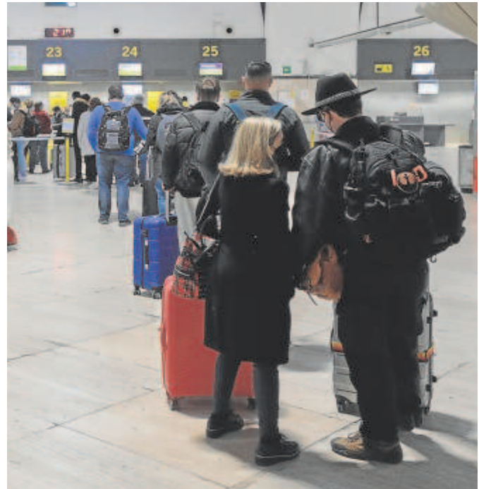
Un total de 575.978 pasajeros pasaron en noviembre por el aeropuerto

Respecto a las operaciones, el Aeropuerto de Sevilla atendió a lo largo del mes pasado 4.897 movimientos (4.190 de ellos, comerciales), de modo que rozó los vuelos contabilizados en noviembre de 2019. En cuanto a la carga, se transportaron más de 890 toneladas, un 92% de la mercancía que se movió en el mismo mes de 2019. La positiva tendencia del tráfico durante noviembre favoreció el ba-