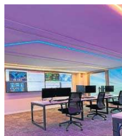
Instalación del SOC de Ayesa.

La compañía añade un equipo de analistas monitorizan la acti-