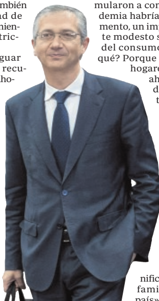
El gobernador Hernández de Cos

De cara a futuro, además, el Banco de España no espera que cambie excesivamente la tendencia. «En los próximos trimestres no cabría esperar que dicho ahorro acumulado vaya a proporcionar un impulso muy significativo al gasto de las familias en nuestro país», incide.