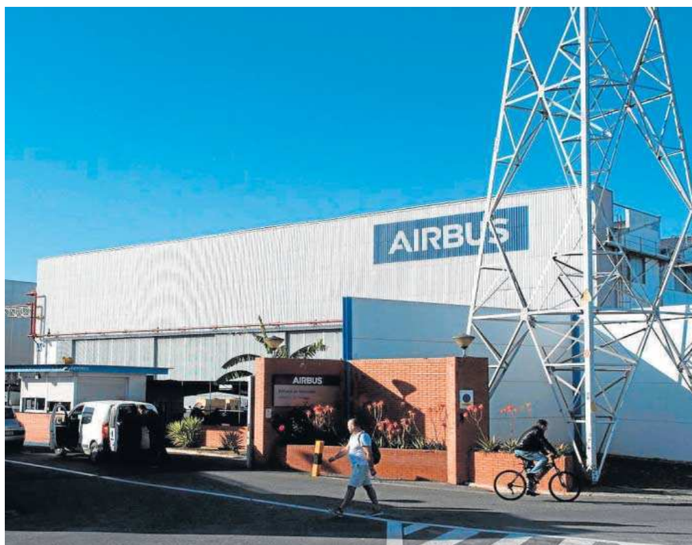
Planta de Airbus en Tablada.

Tablada y Cádiz serán las dos únicas plantas de Airbus en España que participarán en la industrialización y producción del