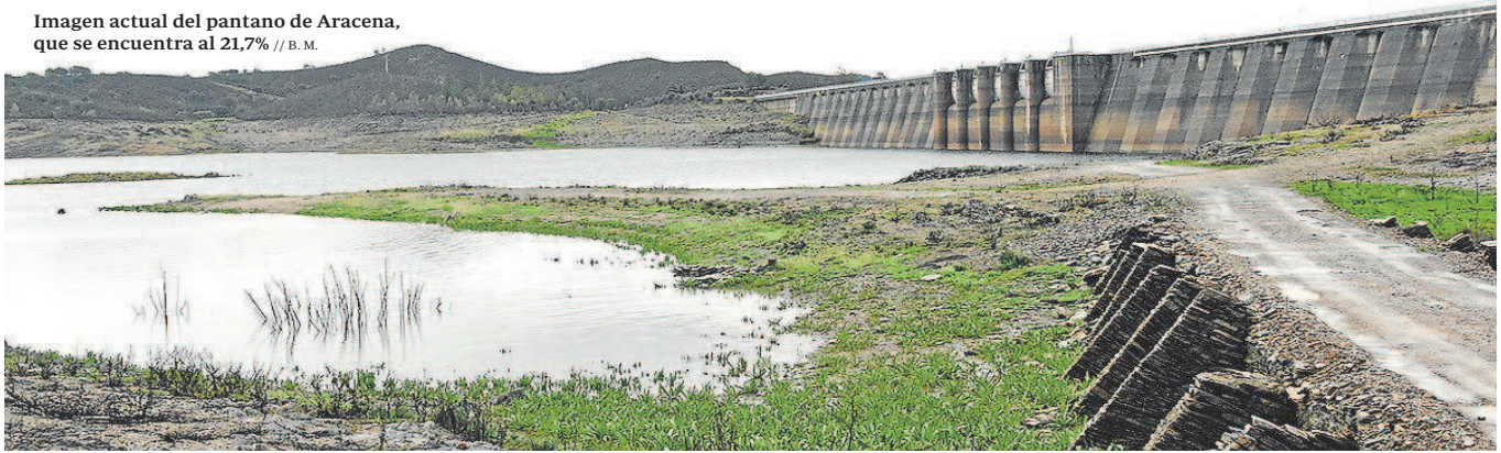
Imagen actual del pantano de Aracena, que se encuentra al 21,7%