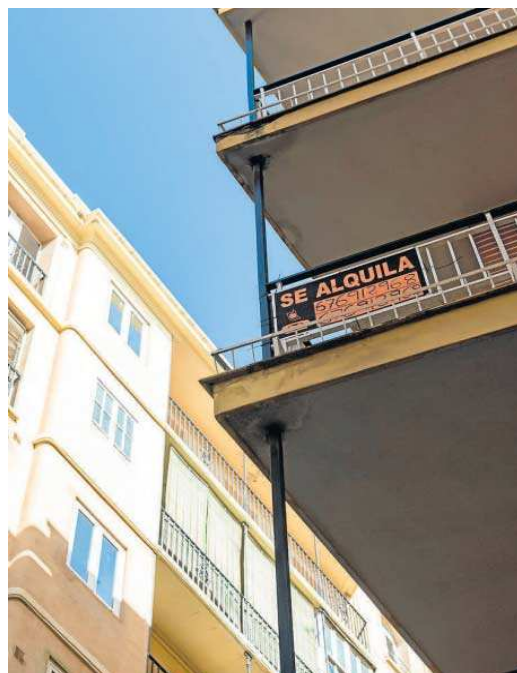
Una vivienda en alquiler.

Resulta indiscutible que un considerable incremento de la oferta de viviendas en alquiler, entre otros muchos efectos positivos, conseguiría abaratar sustancialmente los precios de los arrendamientos y de manera indirecta es muy probable que también nos beneficiemos de una reducción en el precio de venta de los inmuebles.