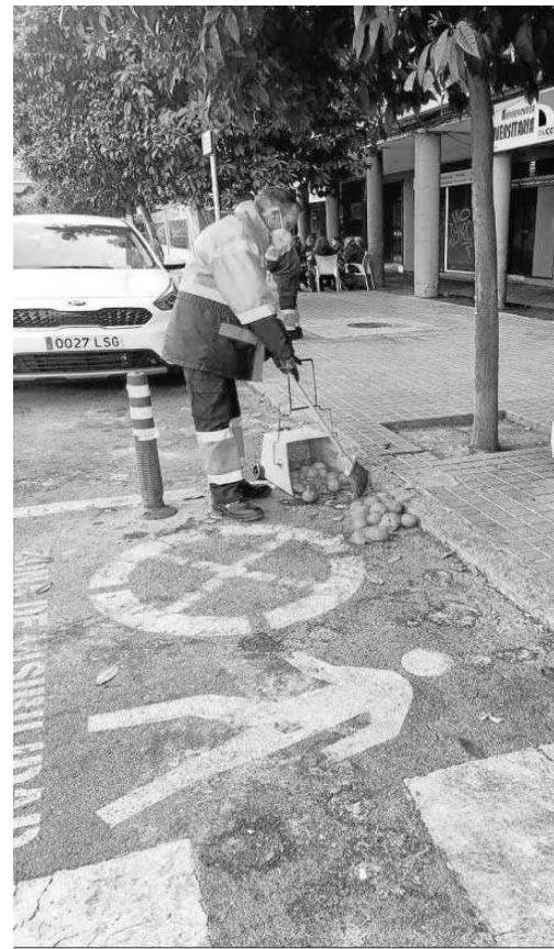
Un operario de Lipasam recoge naranjas de una calle de la ciudad.

villa en el comercio de barrio, el presupuesto para políticas turísticas crece un 17%, hasta los 20,8 millones de euros, para así afrontar los retos de la recuperación económica y la sostenibilidad, los mercados de abastos incrementan sus partidas hasta los 826.000 euros incorporando el mantenimiento y limpieza de los mercados de acuerdo con la nueva ordenanza y se mantiene una previsión anual de un millón de euros en inversiones para los parques empresariales.