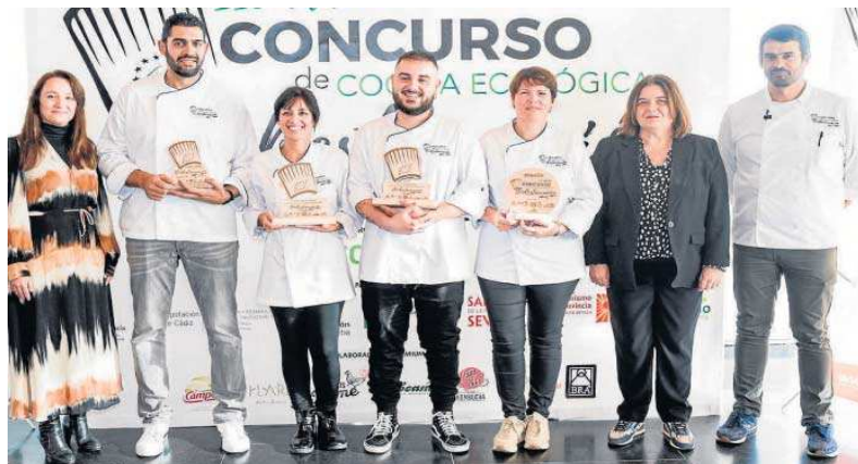
Foto de grupo de los ganadores del III Concurso junto a la diputada Trinidad Argota (segunda por la derecha).

Argota ha destacado la importancia de participar en este tipo de eventos, que ponen de manifiesto la "excelencia" de los productos ecológicos locales. "Este concurso contribuye, además, a la promoción de los productos agroalimentarios del territorio, que, en el caso de la provincia de Sevilla, impulsamos a través de la marca Sabores de la Provincia de Sevilla ".