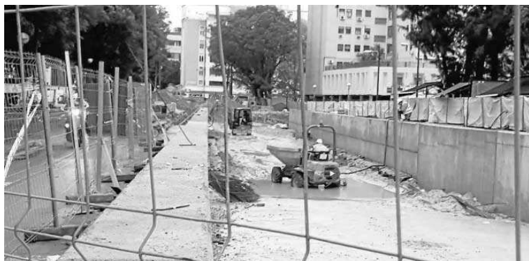
El túnel de Ramón y Cajal está sin excavar. Solo se han hecho las paredes laterales.