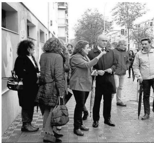
El alcalde durante su visita al entorno del centro de mayores San Eugenio. M. G.

Durante la visita realizada al entorno de este centro de mayores para comprobar el avance de las obras que se están llevando a cabo, el alcalde destacó que "se trata de una de las iniciativas de intervención urbanística en los barrios más ambiciosas que hemos llevado a cabo en este mandato y supone dar respuesta a las demandas de los vecinos". "Estamos al 95% de ejecución de lo planificado y en lo que resta de año se rematarán el resto de proyectos. Gracias a este programa, hemos podido detectar las deficiencias existentes en el viario, llevar a cabo obras muy necesarias en materia de accesibi-