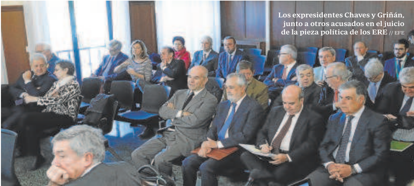
Los expresidentes Chaves y Griñán, junto a otros acusados en el juicio de la pieza política de los ERE