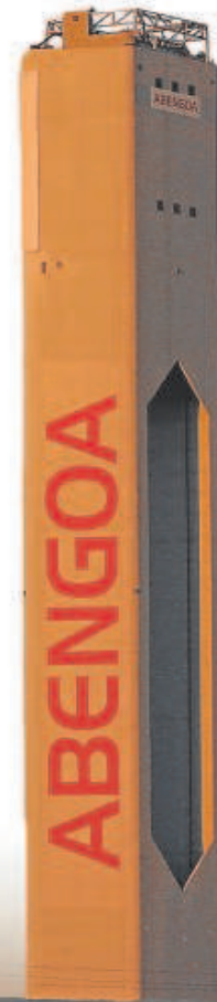
Por ahora hay tres candidatos para comprar Abengoa: Urbas, RCP/Sinclair y el fondo inglés Ultramar Energy

esa aclaración, pero aún no ha sido publicada. Santander, uno de los principales acreedores de Abengoa, presentó escrito solicitando aclaración del inicio del plazo. Urbas Grupo Financiero y la propia Abengoa se opusieron a la ampliación del plazo por entender que perjudicaban el proceso, mientras que otros acreedores, como CaixaBank y Exim, se adhirieron a la petición de Santander.