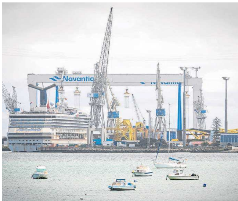
Pórticos de los astilleros de Navantia Puerto Real, en una imagen de archivo.

En el Astillero de Puerto Real están esperando que se cumpla aquello de “Año Nuevo, vida nueva”. Las expectativas para el 2023 son buenas en el dique de la Villa, pero el 2022 ha sido un año para olvidar, en el que la falta de carga de trabajo ha dejado imágenes de un astillero casi fantasmagórico, apenas aprovechado para la reparación de algunos cruceros que –por espacio o capacidad– no tenían cabida en el astillero de Cádiz. El 2023 sí se afronta con una