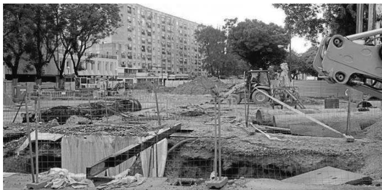
Otra vista de las zanjas abiertas en la esquina de Ramón y Cajal con San Francisco Javier.