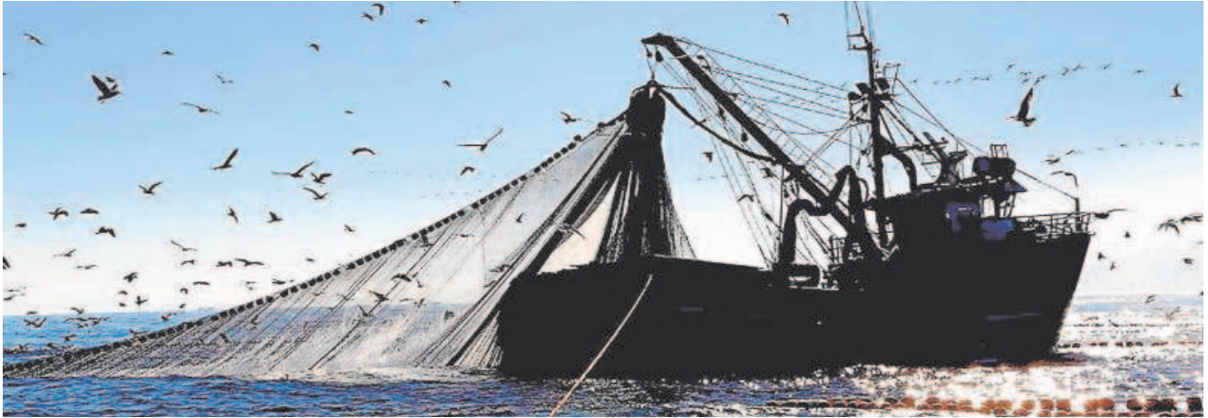
La «histórica» cuota de la merluza sur (un 10% más de la lograda para este año) beneficiará a 1.200 barcos del Cantábrico