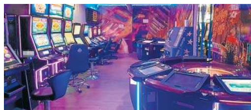
Un salón de juegos de Sevilla.

tales, fraude y usurpación de estado civil. En todo caso, la investigación continúa abierta y no se descarta que el número de perjudicados aumente en las próximas semanas.