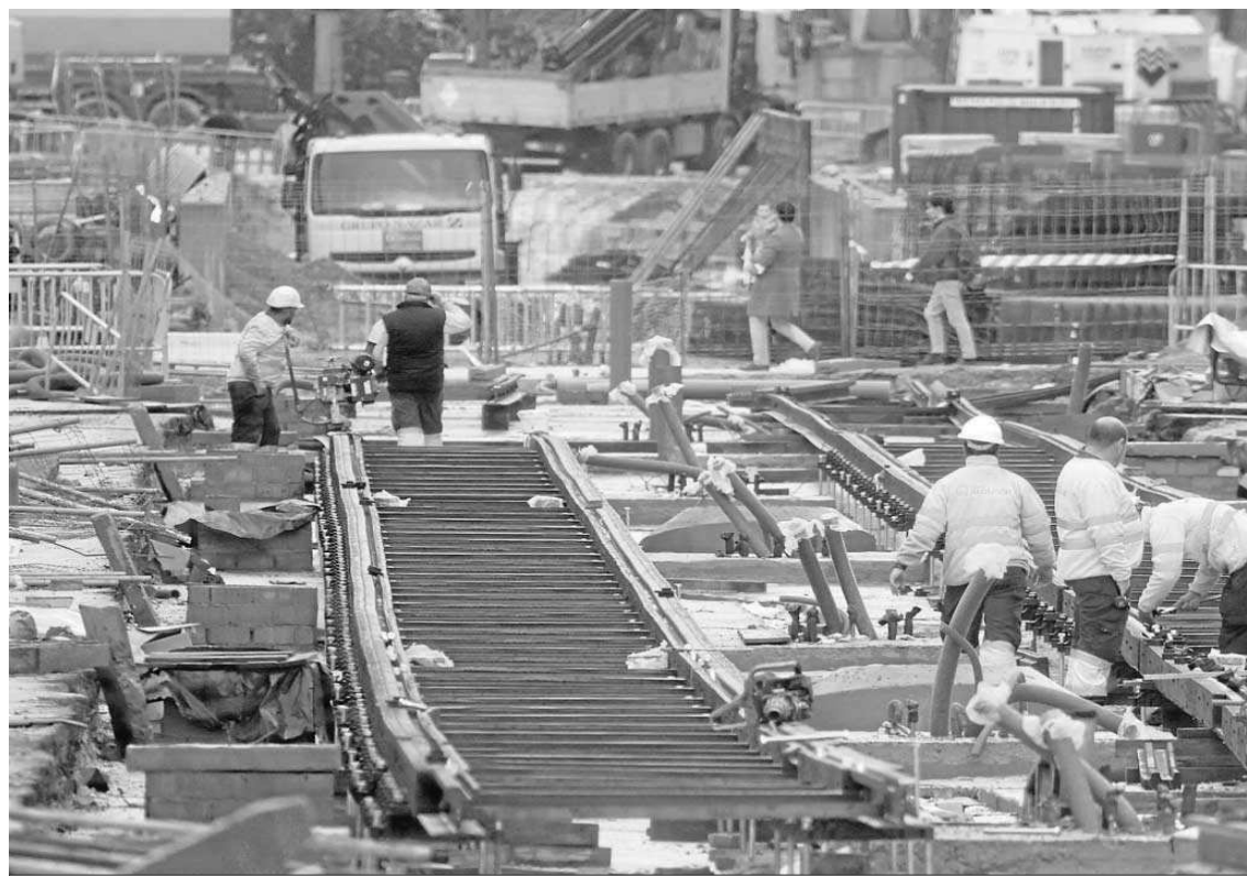
Colocación de vías en el tramo de San Francisco Javier alejado del túnel.

● Cabrera admite retrasos por el subterráneo de Ramón y Cajal ● Es complicado acabar la obra en mayo de 2023 ● El túnel no se ha excavado por problemas con el desvío y reposición de los servicios afectados