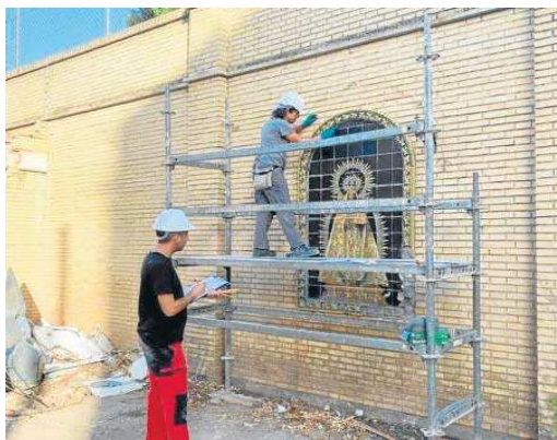
Trabajos de desmontaje de los retablos cerámicos.

El rescate de estas obras de arte ha sido posible gracias al servicio de Proyectos y Obras de la Gerencia de Urbanismo, que advirtió la importancia de estas piezas, pese