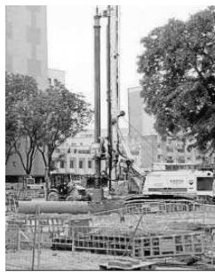
Máquinas en Ramón y Cajal.

La obra civil de ampliación del tranvía a Nervión se adjudicó a finales de diciembre de 2021 a la UTE formada por las constructoras Sando y Vías y Construcciones por un importe de 14,9 millones de euros y un plazo de ejecución de 12 meses. El corte de tráfico para el inicio de obras en las