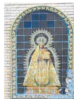
La Virgen del Valle de Kiernam.