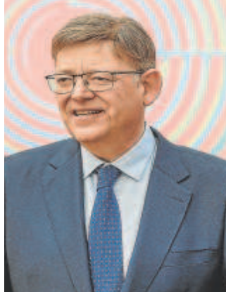
Ximo Puig