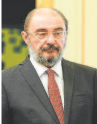
Javier Lambán