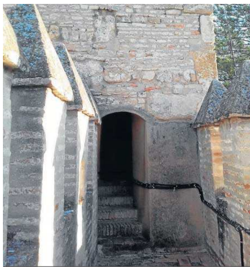
El recorrido por uno de los lienzos de la muralla.

En cuanto al proyecto de actividad arqueológica preventiva aprobado ayer por Patrimonio, se debe al interés que tiene el Patronato del Real Alcázar de Sevilla de abrir a la visita pública un nuevo itinerario que incorpore el paseo de ronda de las murallas de su primer recinto. Para ello, con carácter previo al futuro proyecto de adecuación del espacio, resulta necesario realizar una investigación de los lienzos amurallados y de sus torres, pues los resultados obtenidos