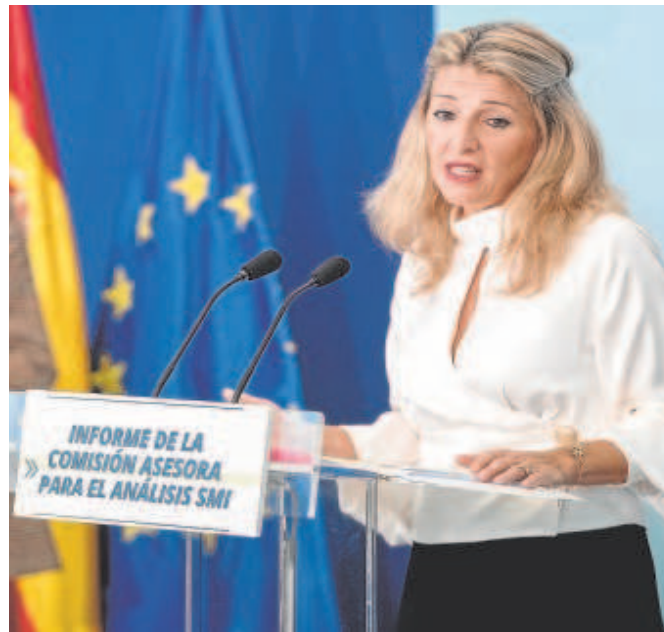
La ministra de Trabajo y Economía Social, Yolanda Díaz

incremento del 4% superaría a la subida salarial medio pactada en los convenios firmados en 2022 (3,03%) y de la subida aplicada a los funcionarios (3,5%). «Cabe recordar que el salario mínimo incide especialmente en las pequeñas y medianas empresas, que conforman la gran mayoría del tejido productivo, puesto que presentan menores niveles de productividad y, por tanto, salarios más bajos», explican las patronales en su propuesta.