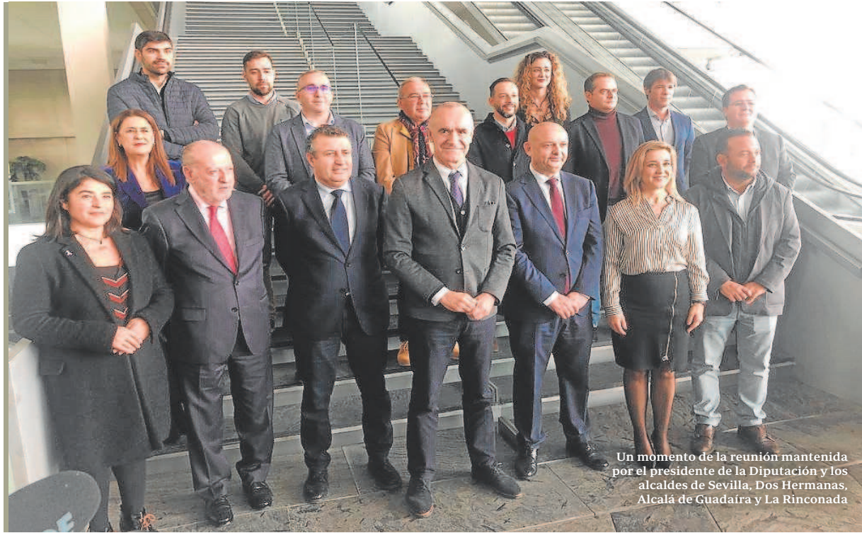
Un momento de la reunión mantenida por el presidente de la Diputación y los alcaldes de Sevilla, Dos Hermanas, Alcalá de Guadaíra y La Rinconada