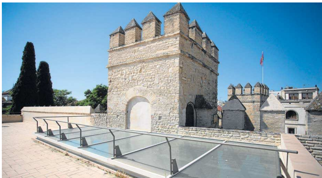
Las torres de la Puerta del León desde la azotea de las casas 7-8 del Patio de Banderas.