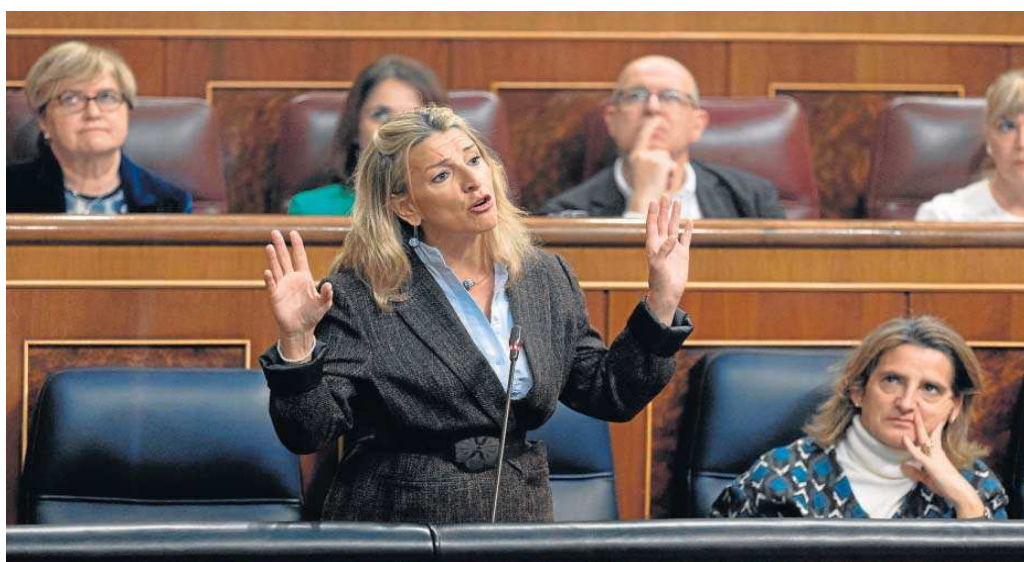
La vicepresidenta segunda y ministra de Trabajo y Economía Social, Yolanda Díaz, ayer en el Congreso.