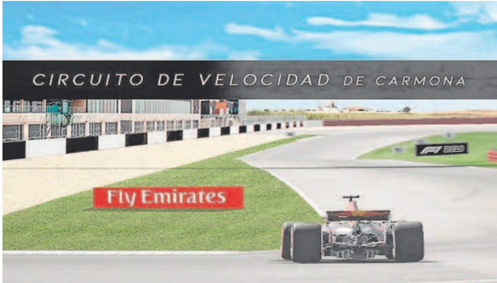
Proyecto del circuito de velocidad de Carmona // ABC