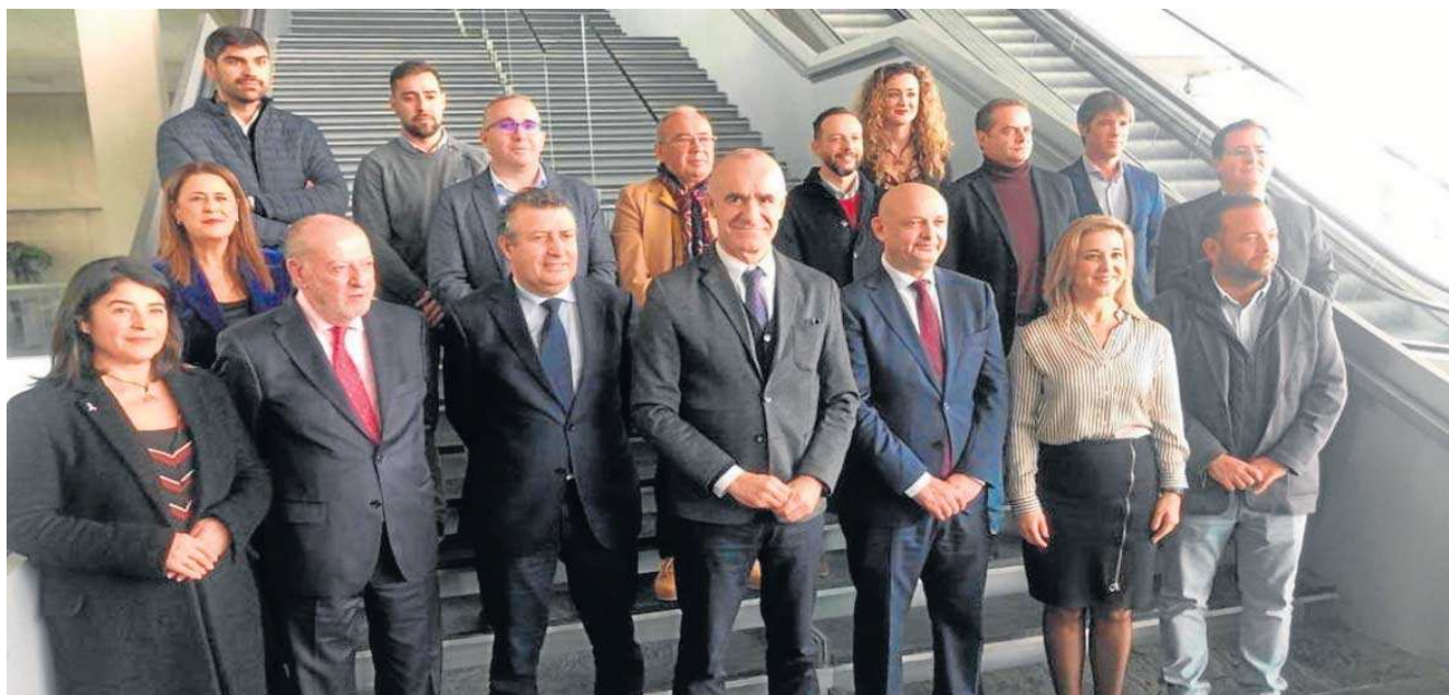
Participantes en 'Avanzando hacia la Agenda Urbana Metropolitana de Sevilla 2030'.