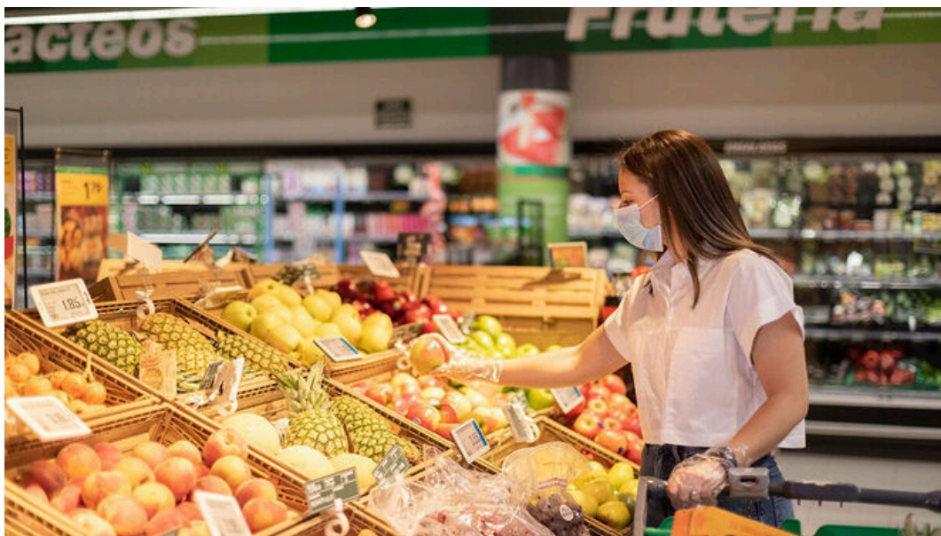
Sección de frescos en un supermercado

Estas Navidades es importante saber cuándo abren los supermercados más cercanos, para no llevarse una sorpresa y necesitar algo mientras los establecimientos están cerrados. Estas fiestas los festivos suelen coincidir con fines de semana (el 25 de diciembre y el 1 de enero en domingo ) por lo que el festivo pasa al lunes siguiente, otra cosa que se debe tener en cuenta.