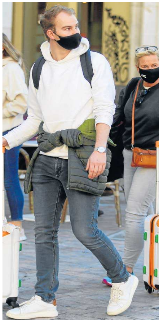
Turistas en Sevilla durante estos días.

El sector de las viviendas turísticas en Andalucía está pendiente de las reservas de última hora para la Navidad, un periodo en el que prevé registrar la mayor ocupación, entre el 70% y el 75%, en el tramo del 27 de diciembre al 1 de enero, mientras que los demás días rondará el 50%.