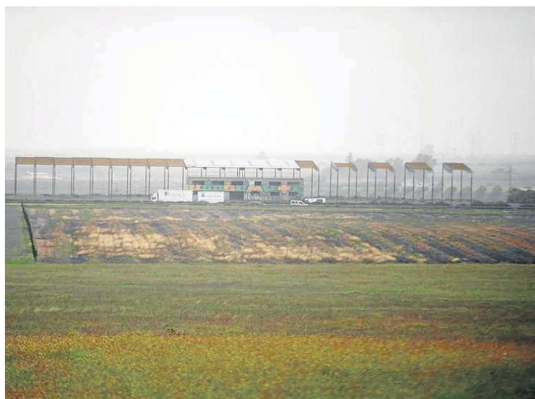
Los terrenos donde irá el circuito de velocidad.

de 12 metros, con un desnivel máximo del 4,92%. Contará con diez curvas a la derecha y seis a la izquierda, que exigen un alto nivel de conducción para sortearlas a gran velocidad. La recta principal será de 773 metros.